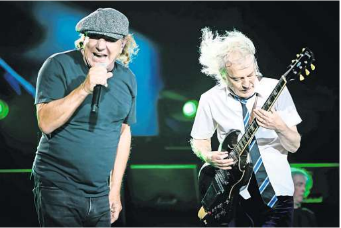
Legendäres Duo: Brian Johnson (links) und Angus Young bei einem AC/DC-Konzert im Oktober 2023.

black“, „Demon fire“, „Shot down in flames“, „Thunderstruck“, „Have a drink on me“, „Hell's bells“, „Shot in the dark“, „Stiff upper lip“, „Dirty deeds done dirt cheap“, „Shoot to thrill“, „Sin city“, „Givin the dog a bone“, „Rock'n'Roll Train“, „You shook me all night long“, „Dog eat dog“, „High voltage“, „Hell ain't a bad place to be“, „Riff raff“, „Highway to hell“, „Whole lotta rosie“ und „Let there be rock“ sowie als Zugaben „T.N.T.“ und „For those about to rock (We salute you)“.