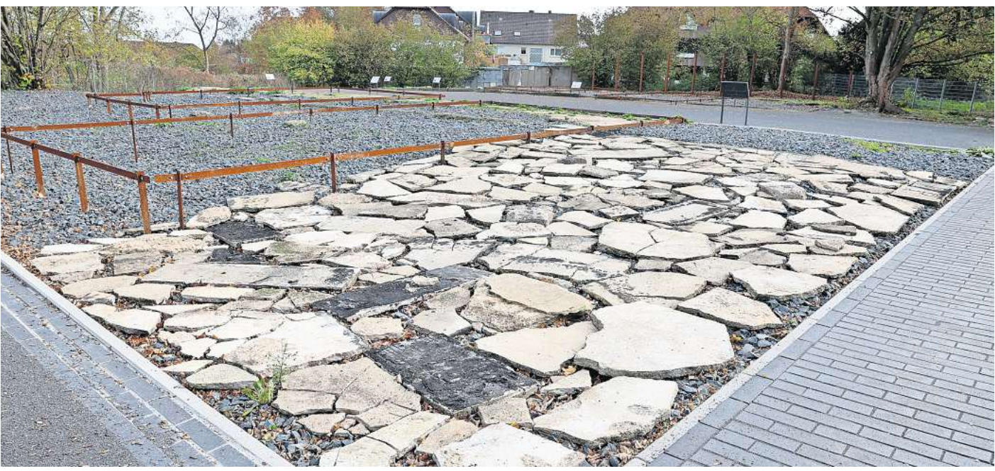
Ein beklemmender Ort: Archäologische Relikte erinnern auf dem Rundweg an das KZ Ahlem – auf diesem Bild an Fundamente.

Die Gedenkstätte in der Heisterbergallee 10 ist wegen eines Hochwasserschadens derzeit noch geschlossen. Informationen gibt es unter (0511) 61623745 oder per E-Mail an gedenkstaette@region-hannover.de .