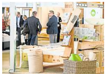
Im Ausstellungsbereich finden die Besucher eine große Auswahl an hochwertigen Betten, Matratzen, Kissen und Bettwaren.

Im Themenbereich Schlafmedizin finden die Besucher Hilfe bei therapiebedürftigen Schlafstörungen. Die ausstellenden Unternehmen präsentieren ihre Produkte zur Verbesserung von Ein- und Durchschlafproblemen. Im