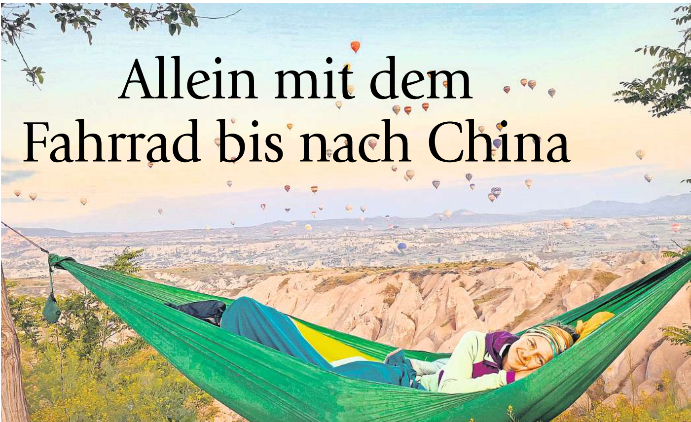
In der Hängematte: Schöne Schlafplätze sind ihr wichtig, gerne schläft sie auch in der Hängematte – wie hier vor der märchenhaften Landschaft in Kappadokien.

gegen war eine Herausforderung: Was nimmt man mit, worauf verzichtet man? Kochgeschirr, Werkzeug, Kleidung, Schlafsack, Luftmatratze, Hängematte, Zelt. Einen Luxusgegenstand gönnte sie sich: einen Campingstuhl. „Wenn man den ganzen Tag auf dem Rad gesessen hat, möchte man abends auch mal schön sitzen, besonders, wenn der Boden feucht und kalt ist!“, sagt sie und lacht. Allerdings verlor er an Bedeutung – wegen der vielen Länder, in denen man immer auf dem Boden sitzt. Das mit Gepäck beladene Fahrrad – ein Rad mit Stahlrahmen und Rohloff-Schaltung – wiegt zwischen 50 und 60 Kilo. Sie schläft am liebsten einsam in der Natur, empfindet das als sicherer. „Zelten ermöglicht eine große Unabhängigkeit – ich kann fahren, so lange und so weit ich will und mag“, sagt die Lehrerin. Auf der Reise dreht sich das aber etwas, in einigen Ländern ist es besser, „im Schutz der Gemeinschaft“ zu ruhen. Schon allein die Reiseroute liest sich beeindruckend: Start ist