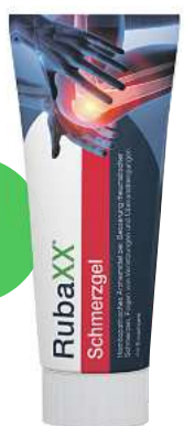
Rubaxx Schmerzgel (PZN 18709526)