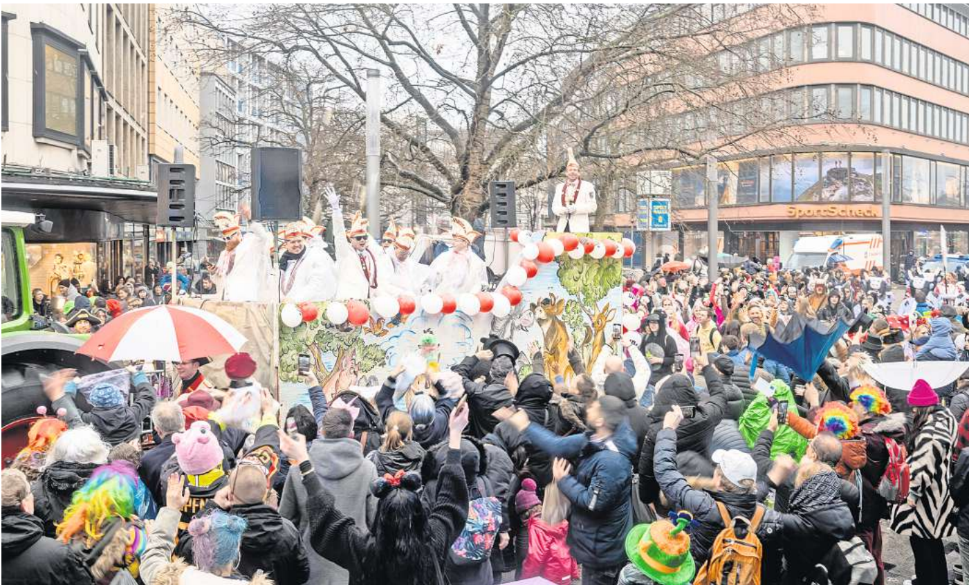
Tolle Stimmung und lustige Verkleidungen: Heute startet um 13.11 Uhr Hannovers Karnevalsumzug.

Die Abschlussparty zum großen Karnevalsumzug findet wie immer im Brauhaus Ernst August, Schmiedestraße 13 statt. Von 14 bis 1.30 Uhr bringen die DJs Denny Gee und Rico das bunt dekorierte Brauhaus sowie bunt kostümierte Feiernde mit Karneval-, Schlager- und Kult-hits zum Beben.