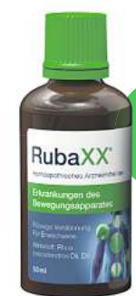
Rubaxx Tropfen (PZN 13588561)