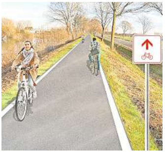
Viel Raum fürs Radfahren: Der Bund und die Region erweitern und sanieren den Radweg am Mittellandkanal auf 54 Kilometern.