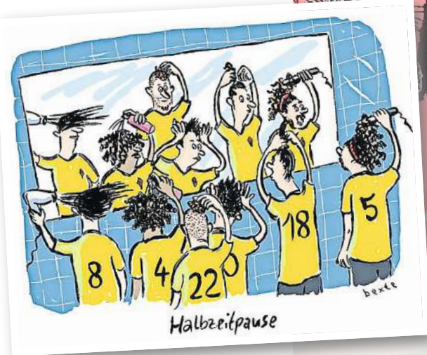
„Halbzeitpause“: Die Illustration von Bettina Bexte ist in der Ausstellung „Anpiff!“ zu sehen. Quelle: Bettina Bexte / Wilhelm-Busch-Museum

Im Westflügel ist bereits ein Gästezimmer für kleinere Ausstellungen entstanden. Daneben liegt das neue Kinderzim-