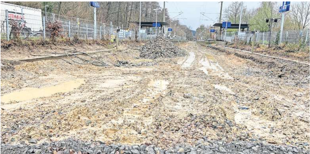
Tiefe Furchen: Auf diesem matschigen Boden kommen die schweren Baumaschinen nicht vorwärts. Eine Baustraße aus Kunststoffmatten soll nun helfen.

Diese Projekte laufen auch im Jahr 2024 und darüber hinaus weiter. Regions-Verkehrsdezernent Ulf-Birger Franz sagt deshalb: „Das Schienennetz in Deutschland wurde 30 Jahre lang vernachlässigt und ist in einem desaströsen Zustand.“ Es werde einige Jahre dauern, bis diese Versäumnisse aufgeholt seien werden. Er gehe deshalb auch in den nächsten Jahren von einer großen Störungsanfälligkeit des Netzes aus und rechne mit Einschränkungen wegen geplanter Baustellen, aber auch wegen ungeplanter Störungen, teilt Franz mit. Aktuell gibt es vor allem Behinderungen durch eine Baustelle zwischen Barsinghausen und Egestorf, deren Arbeiten schon längst beendet sein sollten. Denn eigentlich sollen Arbeiter die dortigen Gleise erneuern – vom 18. November bis zum 4. Dezember. Doch es gab und gibt immer neue Verzögerungen. Inzwischen steht fest: