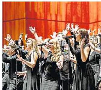
Mitmachen können alle, die Freude am Singen haben.

singOUT Hannover am 29. März 2025. Im Theater am Aegi Hannover präsentieren dann die 200 Stimmen eine Musikexplosion der Extraklasse. Um die Proben effektiver zu gestalten, erhalten die Sänger ein Songbook sowie Übungs-Dateien. Mitmachen können alle, die Freude am Singen haben sowie die Dynamik eines Mass-Choirs erleben möchten. Sei dabei! Anmeldung unter: hannover@singout-projekt.de