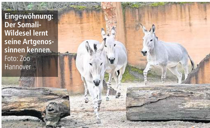
Eingewöhnung: Der Somali-Wildesel lernt seine Artgenossen kennen.