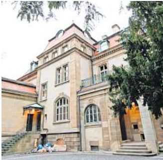
Ort der Erinnerung und lebendiger jüdischer Kultur: Villa Seligmann

Mehr über das Programm der Villa Seligmann, Hohenzollernstraße 39, gibt es unter www.villa-seligmann.de .