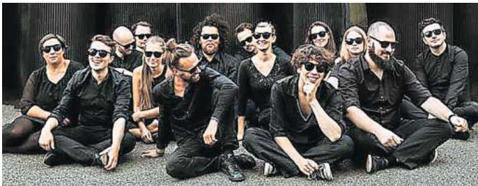
Das Orchester im Treppenhaus spielt im Aufhof.

Die Konzerte im Aufhof, Schmiedestraße 5, sind am Freitag, 16. Februar, sowie Sonabend, 17. Februar, jeweils ab 19 Uhr und ab 21 Uhr zu erleben. Eintritt: nach dem Prinzip „Zahle, was du kannst“. HR