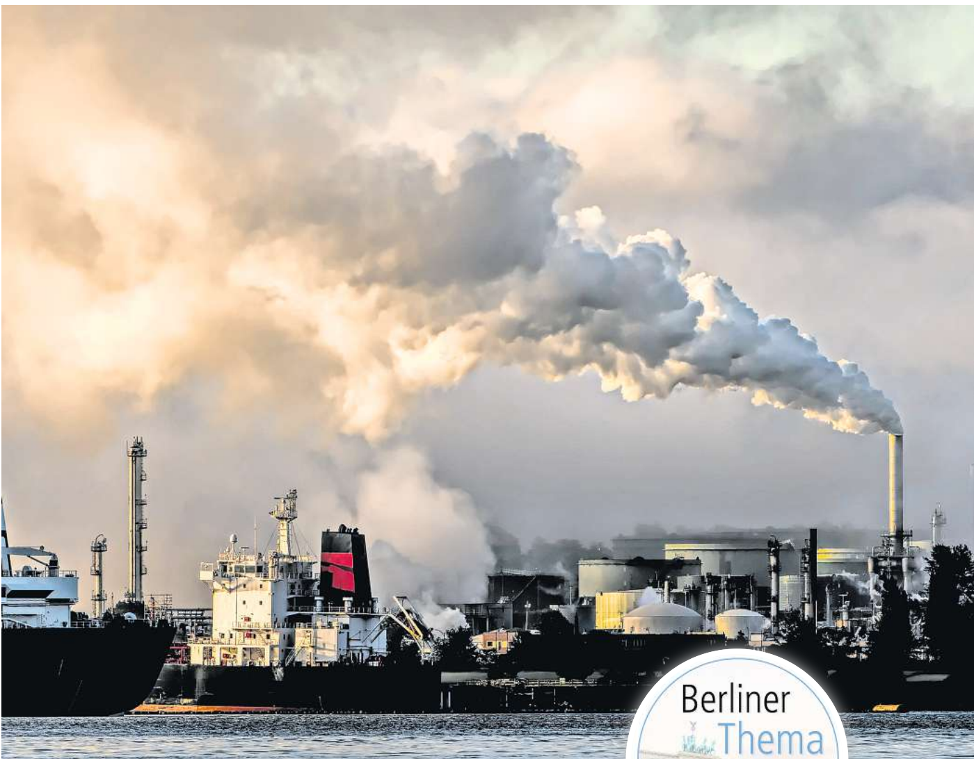
Die Produktion von CO2 ist einer der Hauptverursacher des Klimawandels.

Die unterirdische Speicherung des im industriellen Maßstab anfallenden Klimagas CO2 wird im Englischen „Carbon Capture and Storage“ ge-