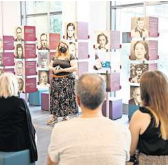
Führungen im Zeitzentrum Zivilcourage, dem interaktiven Lernort.

In Hannover gibt es viele Orte der Erinnerung. Nahe der „Menschenpaar“-Skulptur am Maschsee erinnert beispielsweise eine Tafel an die Bücherverbrennung. Am Ballhofplatz erklärt eine Tafel, dass hier einst die Hitlerjugend ihr Domizil hatte.