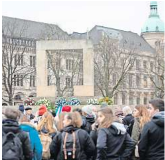
Ein Ort des Gedenkens: Das Holocaust-Mahnmal auf dem Opernplatz.

Speziell an junge Menschen richtet sich auch die Website www.ns-zeit-hannover.de , auf der kurze Filme beispielsweise von der Hitlerjugend oder dem Aufstieg der Nazis in Hannover berichten – und so ein Stück Vergangenheit in die Gegenwart holen.