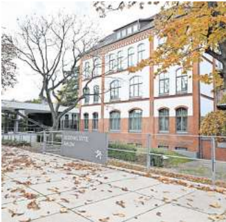
Gedenkstätte Ahlem: Hier sind Ausstellungen zu sehen.

Heute ist die Gedenkstätte Ahlem eine Bildungseinrichtung der Region Hannover. Eine bewegende Ausstellung erinnert – ebenso wie verschiedene Stationen auf dem Gelände – an die Verbrechen der NS-Zeit. Neben Führungen gibt es hier eine Vielzahl kultureller Veranstaltungen und pädagogische Angebote auch für Schulklassen.