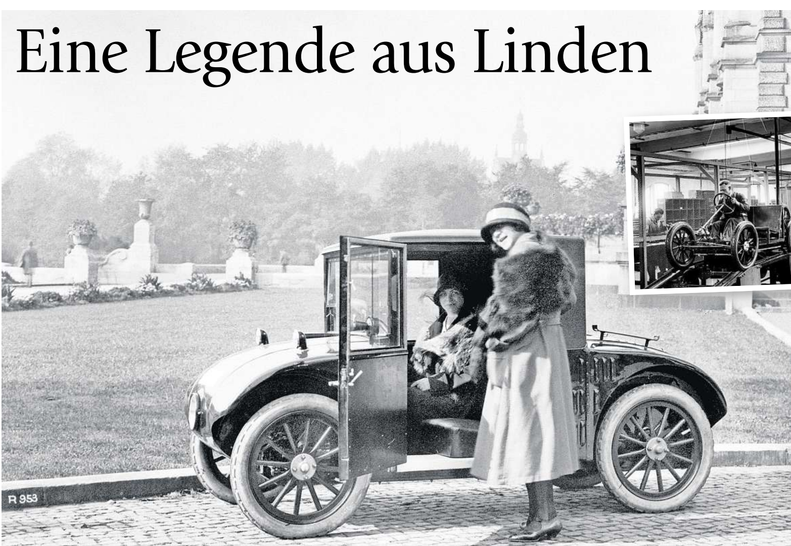
Legende aus Linden: Kommissbrot-Produktion im Jahr 1926.