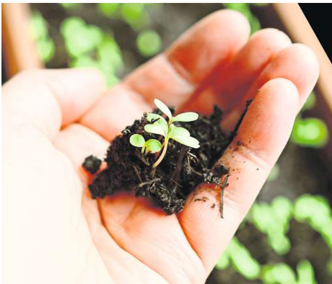
Im Frühjahr ist die Zeit für die Anzucht von Keimlingen.

und stellen sie hell und warm auf. Anfangs sind 22 bis 25 Grad ideal. Befeuchtet werden die Aussaat-schalen oder -töpfe mit einem feinen Wassernebel aus der Sprühflasche. Ein Gefrierbeutel oder ein über den jeweiligen Topf gestülptes Einmachglas schützt die Saat vor dem Austrocknen. Sobald sich das