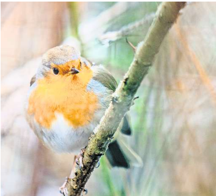
Gartenbesitzer können sie unterstützen: Bei eisigen Temperaturen haben es Rotkehlchen bei der Futtersuche schwer.

Gartenbesitzer können sie unterstützen: Bei eisigen Temperaturen haben es Rotkehlchen bei der Futtersuche schwer.