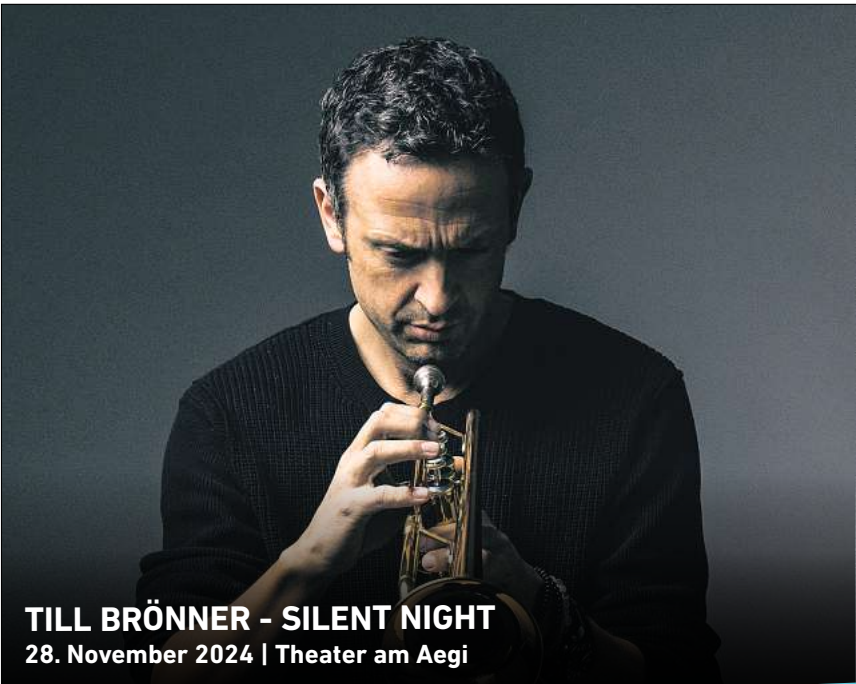
TILL BRÖNNER - SILENT NIGHT 28. November 2024 | Theater am Aegi

Ihr persönlicher Ticketservice der HAZ & NP