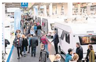
Bei Caravaning & Camping in den Hallen 21, 24 und 25 dreht sich alles um mobiles Reisen.

➔ Weitere Infos: ross-schule.de und diploma.de