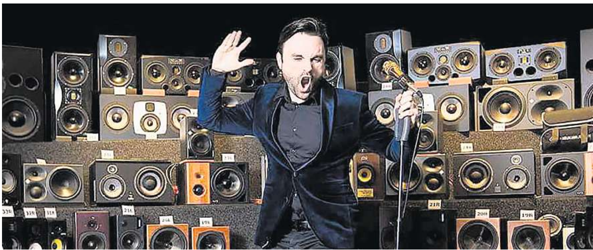
Promovierte mit Popmusik: Dr. Pop berichtet live aus der Musikwelt