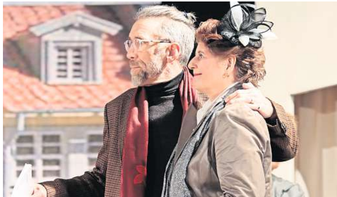
Die Theatergruppe der Matthias-Gemeinde zeigt die Komödie „Richtfest“.

☑ Kartenvorbestellungen sind möglich am Montag und Donnerstag von 17 Uhr bis 19 Uhr unter Telefon (05101) 58 69 39. Weitere Termine: spielkreis-theater-mk.de