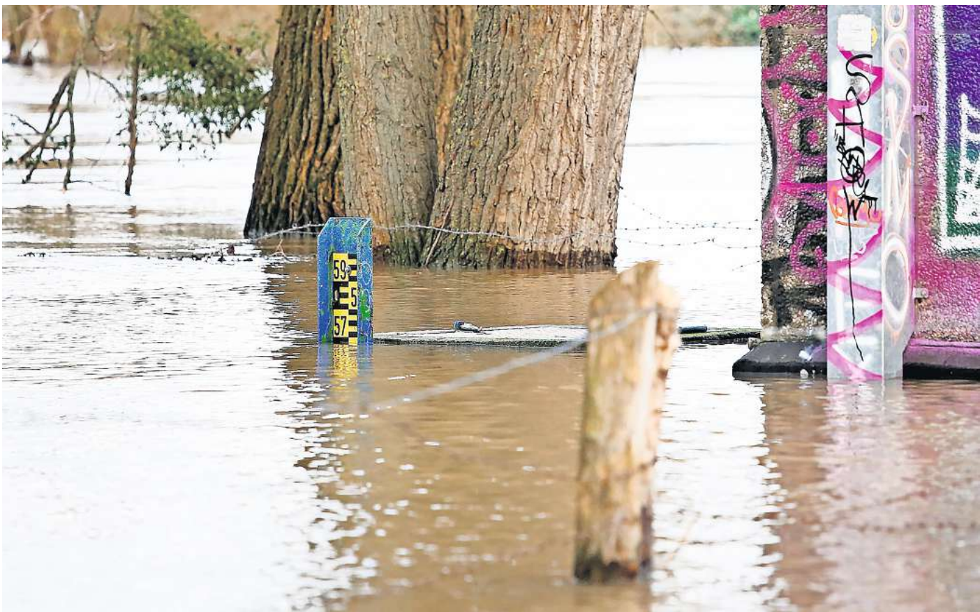
Land unter: Auch in der Region Hannover sind die Pegel an Weihnachten dramatisch angestiegen.

Für welche Hochwasserschäden kommt das Land auf? Soforthilfe gibt es für Schäden, die in Privathaushalten direkt durch Hochwasser verursacht wurden, etwa für zerstörten Hausrat. Das gilt auch für Schäden, die auf eine hochwasserbedingte Hangrutsche oder übergelaufene Regenwasser- und Mischkanalisation zurückzuführen sind. Das Land kommt zudem für Beschädigungen auf, die während des Hochwassers durch Einsatzkräfte und ihre Fahrzeuge verursacht wurden. Für die Kosten einer vorübergehenden Unterkunft, die aufgrund des Hochwassers nötig geworden ist, kann ebenfalls Soforthilfe beantragt werden. Die