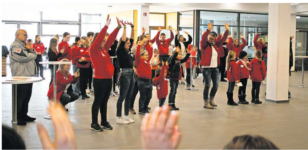
Miteinander stark bei viel Spiel, Spaß und Aktion – den Markenzeichen der Johanniter-Jugend.

Noch viel umfangreicher als im letzten Jahr beleuchtet die Themenwelt Fahrrad & Mobilität in Halle 26 die Vielzahl an neuen Möglichkeiten, die es in der Mobilitätsbranche gibt. Über 50 Fahrradmarken bieten eine große Auswahl an verschiedenen Modellen wie Mountainbikes, City-Flitzer, Hollandräder und E-Bikes. Eine Sonderausstellung widmet sich dem Thema „Fahrrad & Familie“. Zudem befindet sich in Halle 26 auch der Bereich Outdoor & Fitness.