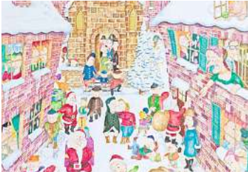
2. Platz: Uwe Schneider (Langenhagen) 22,7