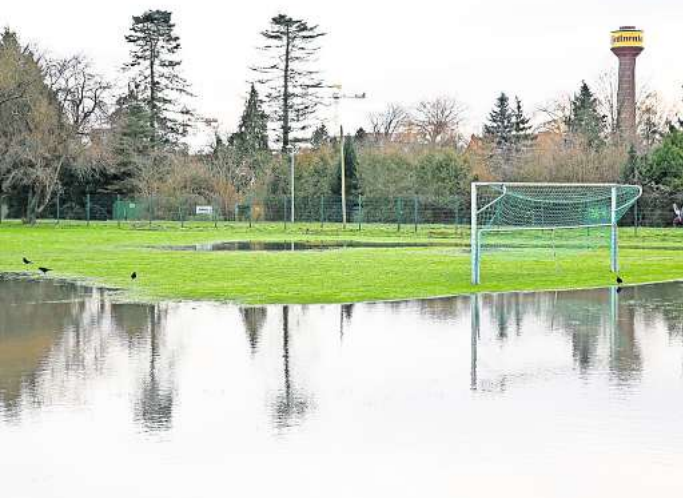
Abgesoffen: Der Sportplatz der SG Limmer stand weitgehend unter Wasser.

seien erforderlich. Wie hoch die Kosten am Ende ausfallen, könne man noch nicht sagen. Das historische Technikdenkmal hat die Stadt erst kürzlich für mehr als 6 Millionen Euro erneuern lassen. Auch die Gewächshäuser westlich des Großen Gartens waren teilweise überschwemmt. Hier seien Schäden an den Wasserleitungen möglich, sagt der Stadtsprecher. Das Ausmaß lasse sich aber erst im März ermitteln, wenn die Leitungen wieder unter Druck stehen.