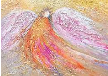
3. Platz: Martina Schramm (Garbsen) 12,6