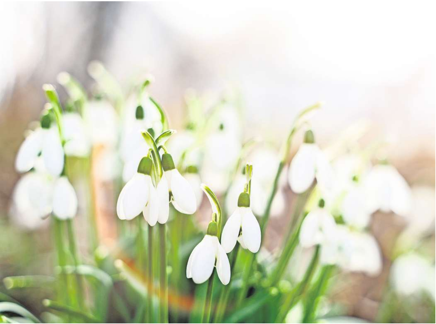
Die Blüten der Schneeglöckchen markieren den Beginn des Vorfrühlings.

Spät tragende Sorten haben ihre Früchte bis in den November hinein geliefert. Anders als die Sommersorten tragen Herbst-Himbeeren an den einjährigen Trieben. Das vereinfacht ihren Rückschnitt: Sie können nach der Ernte alle Triebe, die auch Ruten genannt werden, knapp über dem Boden abschneiden.