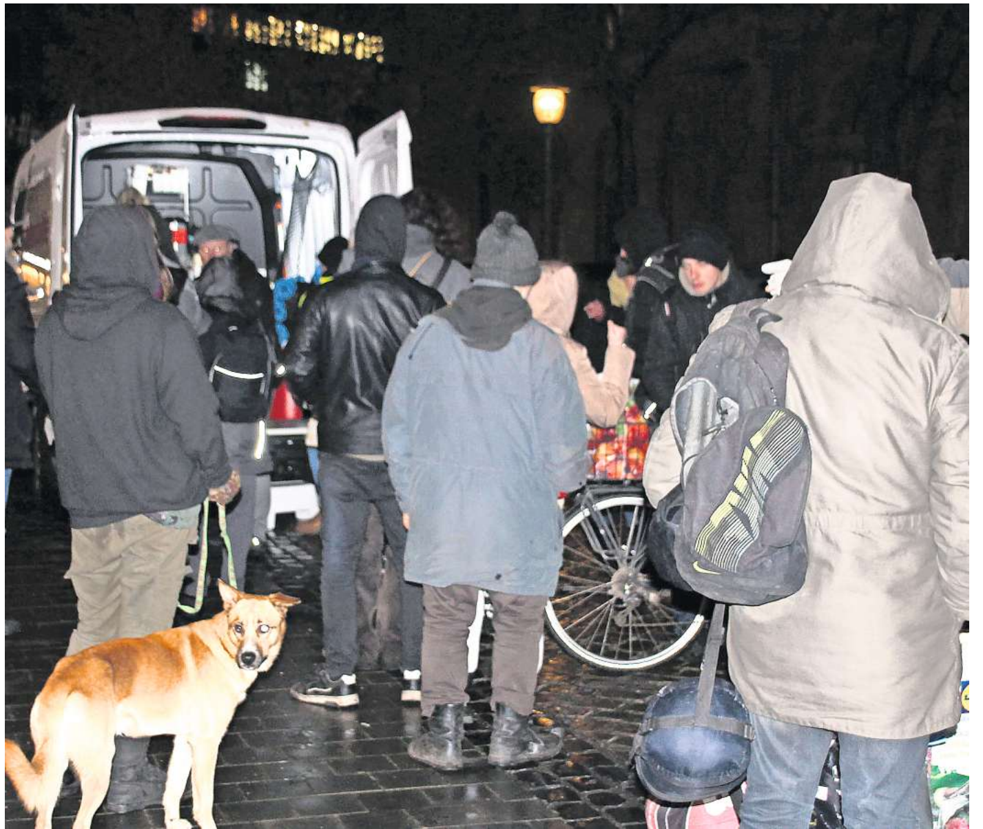
Obdachlose und Bedürftige bekommen beim Kältebus der Caritas eine warme Mahlzeit und heiße Getränke.