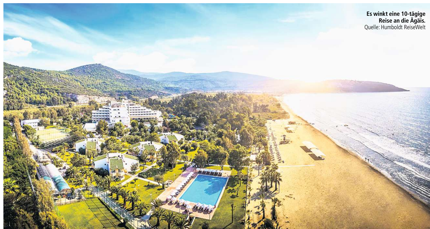
Es winkt eine 10-tägige Reise an die Ägäis.