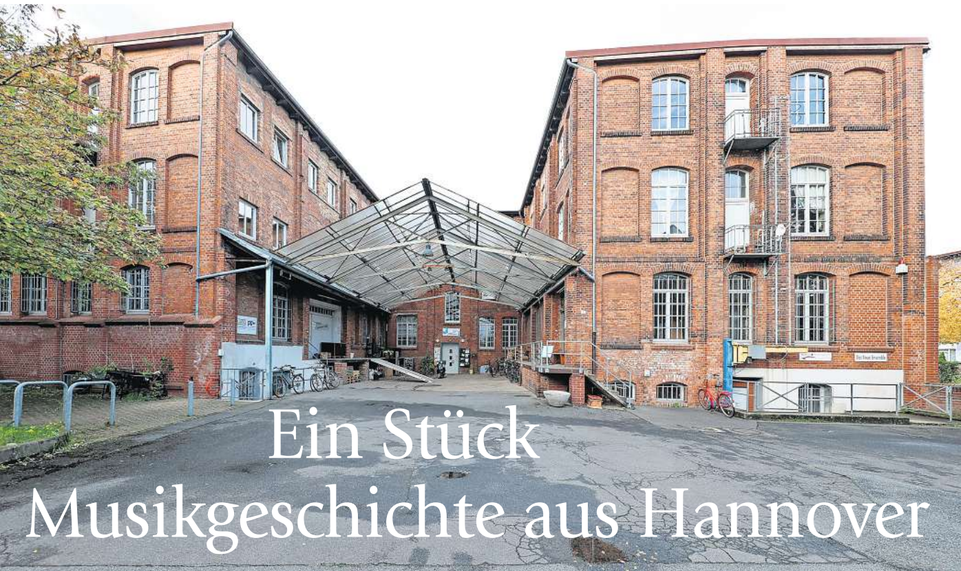
Die Alte Grammophonfabrik am Edwin-Oppler-Weg 5