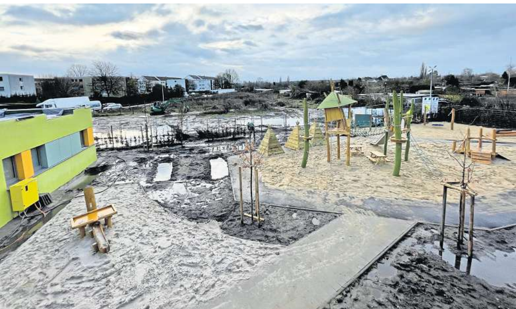
Auf dem Außengelände stehen bereits die ersten Spielgeräte, darunter ein Matschtisch mit Wasserpumpe, ein großes Kletterelement und Holzhütten zum Verstecken.