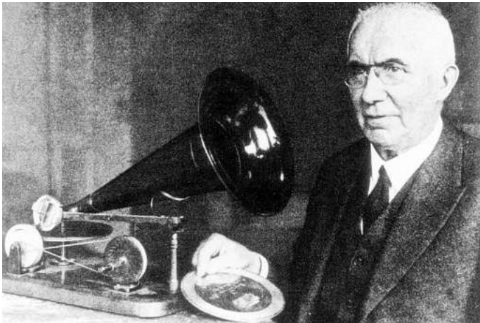
Emil Berliner mit seinem ersten Grammophon und einer der ersten Zink-Schallplatten.

Die ehemalige Schallplattenfabrik in der Podbielskistraße ist heute ein Büropark. 1991 wurde es zum Teil abgerissen und als Grammophon Büropark neu eröffnet. Das Nachfolgerwerk in Langenhagen, wo ja noch bis 2017 Tonträger produziert wurden, befand sich bis zuletzt in der Emil-Berliner-Straße.