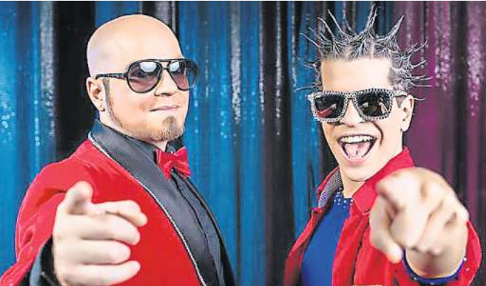
Die Clowns-Brüder Steve & Jones

Weitere Termine und Karten: weihnachtscircus-hannover.com