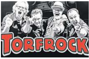
Torfrock feiern ihre Bagaluten-Wiehnacht im Capitol. Foto: Torfrock GbR (Collage)

Mit ebenso fiktiven wie aberwitzigen Geschichten aus dem Leben der Bewohner Torfmoorholms, der liebenswert trinkfreudig-chaotischen Wikingertruppe aus Haithabu und deren Nachkommenschaft haben sie auch heute noch eine immens große Anziehungskraft auf das Publikum jeden Alters. Der torfige Rock-Folk-Blues-Punk-Boogie; sowie der urtypische Bühnen-Humor lassen die Konzertbesucher zusammen mit der Band eine friedliche und fröhliche Torfrock-Party feiern. Natürlich mit „Spezielle Spezialgäste vorwech“. Los geht's am Montag, 25. Dezember, um 20 Uhr (Einlass: 19 Uhr) im Capitol. Tickets gibt es unter: