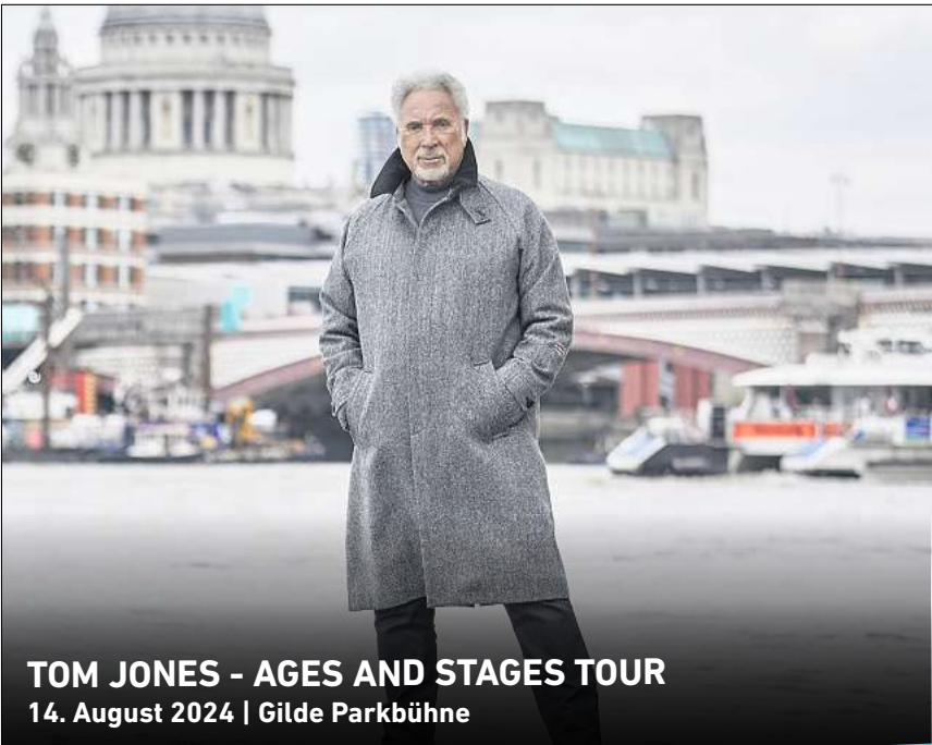
TOM JONES - AGES AND STAGES TOUR 14. August 2024 | Gilde Parkbühne

Ihr persönlicher Ticketservice der HAZ & NP