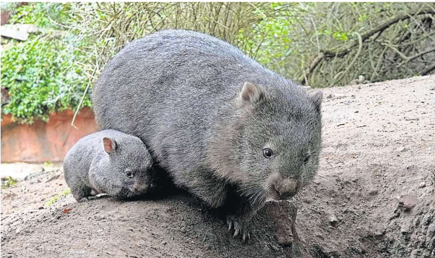
Das Baby vom Wombats Maya und Kelly ist bereits in der Anlage unterwegs.

HANNOVER. Die Selbsthilfegruppe Erektile Dysfunktion Hannover nimmt neue Teilnehmer auf. Alter: von 35 bis 75 Jahren, ohne dies jedoch fest zu beschränken. Betroffene leiden unter Potenzstörungen gleich welcher Art. Sie können sich in der Gruppe im geschützten Rahmen austauschen. Infos gibt es bei der Kontakt-, Informations- und Beratungsstelle im Selbsthilfereich (KIBIS) unter Telefon (0511) 666567.