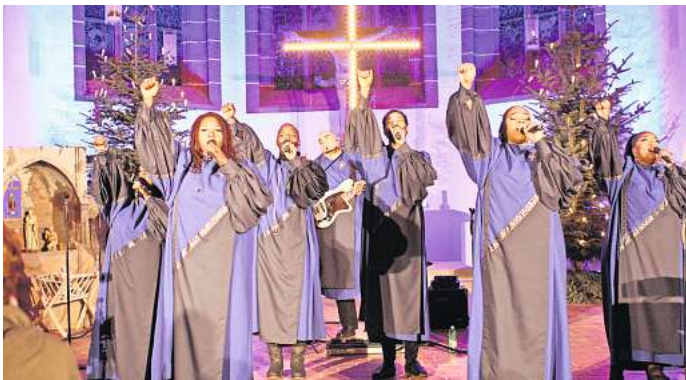
Die Best of Black Gospel treten am 14. Januar in der Markuskirche auf.

Eintrittskarten gibt es im Vorverkauf für 36 Euro (plus Gebühren) im Kartenshop in der Galeria Kaufhof (0511) 32 72 44, im Theater am Aegi (0511) 12 12 33 33, im NDR Ticketshop (0800) 6 37 84 25, an den bekannten Reservix-Vorverkaufsstellen sowie unter der Hotline: (0761) 88 84 99 99, online unter www.bestofblackgospel.de und reservix.de