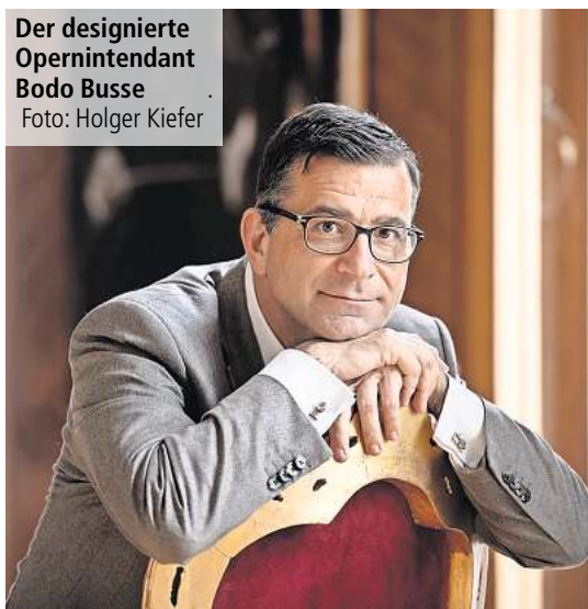
Der designierte Opernintendant Bodo Busse