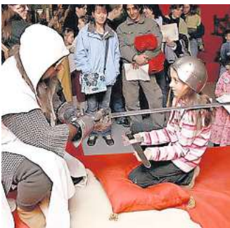
Ritterschlag? Gibt es im aufhof.

An zwei Terminen werden Siegel gegossen aus verschiedenem Material. Am 12. Dezember von 15 bis 18 Uhr entstehen in der Zeit von 15 bis 18 Uhr Seilsiegel und die Teilnehm-