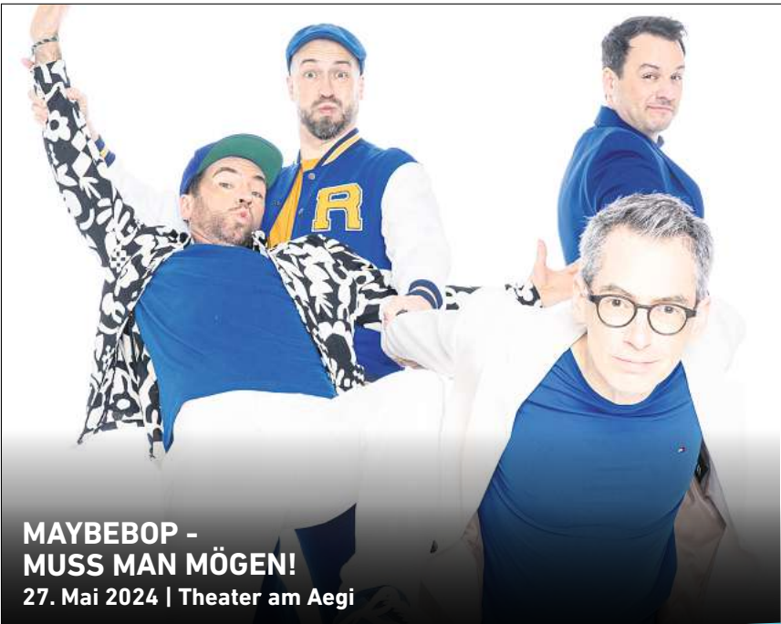
MAYBEBOP - MUSS MAN MÖGEN! 27. Mai 2024 | Theater am Aegi

HANNOVER. The Tazers sind am Dienstag, 12. Dezember, ab 21.15 Uhr beim Ruby Tuesday im Café Glocksee, Glockseestraße 35, live zu hören. Das südafrikanische Psych-Rock-Trio hatte den weltweiten Überraschungshit „Wake Up“. Die Band hat ihre Wurzeln tief in den 1970er Jahren und lässt daraus modernen Sounds und Strukturen spritzen. Fuzz-Sounds aus der Garage, Gesangsharmonien aus dem Himmel und hardrockende Trommelwirbel – The Tazers laufen heiß, wo immer sie spielen. Einlass ist ab 20 Uhr, der Eintritt ist frei. RED