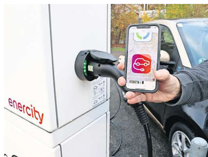
Enercity bietet seinen Kunden jetzt eine neue App für E-Autos.

Alle Wünsche indes könne Enercity nicht erfüllen. Dazu gehöre auch, dass nicht jeder Standort mit Grafik und Fotos dargestellt werden könne. „Unser Ziel ist es, dass auch Ortsunkundige die Ladepunkte schnell finden“, sagt der Sprecher. Deshalb arbeite Enercity mit Daten des Onlinedienstes Google Street View – allerdings eben nur im öffentlichen Verkehrsraum. „Wenn eine Ladesäule auf dem Parkplatz eines Supermarktes oder einer Bank steht, dann funktioniert das leider nicht.“