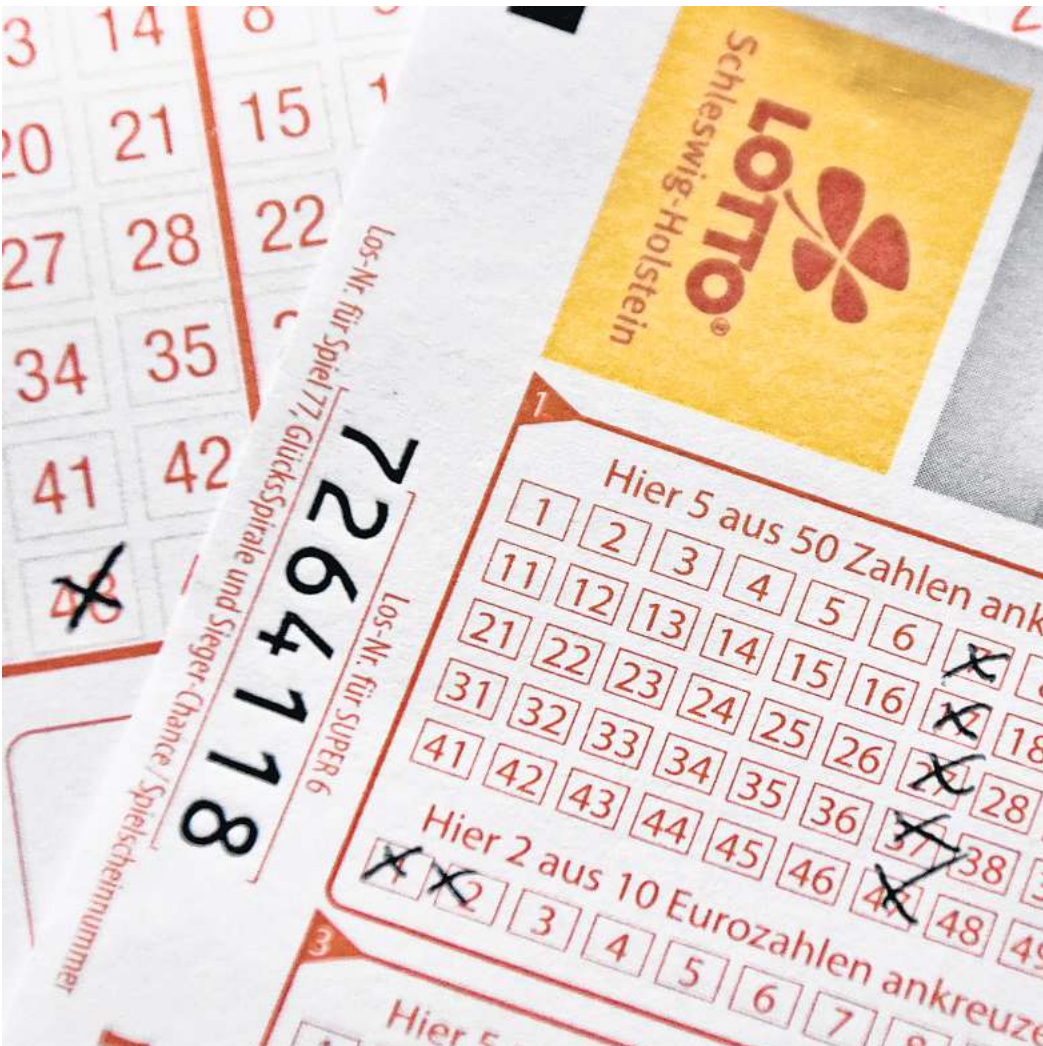
Spielautomaten und Lotto gehören die den Glücksspielen, die den Anbietern den größten Umsatz bringen.