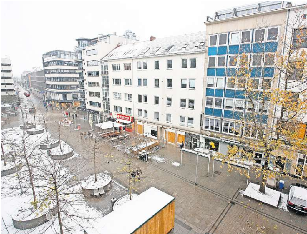
Die Stadt hat für den Platz ein Konzept, und einige Immobilieneigentümer haben schon gute Nachfolger im Auge

Jetzt soll der Platz nach nicht einmal 25 Jahren erneut umgebaut werden. Das Lindener Landschaftsarchitekturbüro Adam+Adam hat eine Machbarkeitsstudie „Grüner Bewegungsraum Andreaestraße“ erstellt, in der die Planer drei Varianten für einen Umbau skizzieren. Das Ziel: mehr Grün in der Stadt, mehr Aufenthaltsqualität, aber auch wieder mehr Platz für Freizeitsport und Bewegung (siehe auch Text unten).