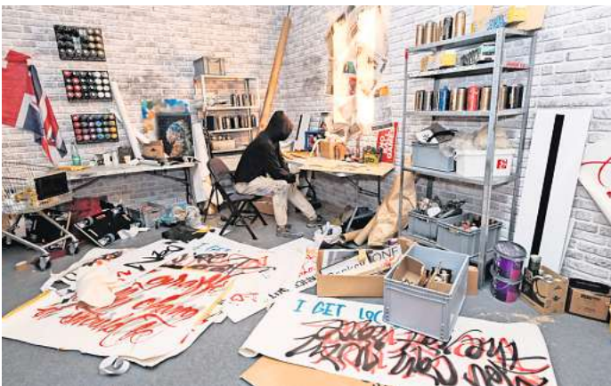
Geheimnisvoll: So sieht es aus, oder könnte es aussehen, das Banksy Arbeitszimmer.

Ins Atelier gelangt man nach dem Besuch eines ziemlich gut gemachten Banksy-Kinos, das wiederum durch einen nachgebauten Londoner U-Bahn-Wagen zu betreten ist. Dass sie an irgendetwas gespart hätten, kann man den Ausstellungsmachern wirklich nicht vorwerfen. Die Ausstellung präsentiert den politisch engagierten Künstler. Zu sehen ist die Hausecke mit dem Kind, das sich Schneeflocken auf der ausgestreckten Zunge zergehen lässt. Bewegt man sich etwa um die Ecke herum, sieht man die brennende Mülltonne, aus der weiße Ascheflocken aufsteigen und zum Kind herüber-