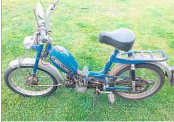
Suche altes Mofa Moped Motorrad auch defekt oder total verrostet ☎ (01 51) 11 52 02 65