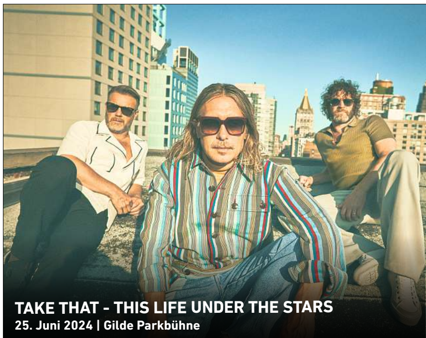
TAKE THAT - THIS LIFE UNDER THE STARS 25. Juni 2024 | Gilde Parkbühne

Ihr persönlicher Ticketservice der HAZ & NP