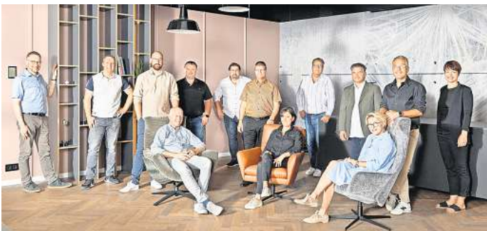
Starkes Netzwerk: Der Verbund der werkart stellt sich beim Tag des Handwerks in seiner ganzen Bandbreite vor, und zwar auf mehr als 1000 Quadratmetern.

Im Fokus der Veranstaltung stehen das 15-jährige Bestehen der werkart und die Vielfalt des Handwerks. Die mehr als zehn werkart-Partner, darunter unter anderem die Tischlerei Biesel, das Unternehmen Machnik Textile Werkstätten, die Malerwerkstatt Hinze, das Kachelofen und Ka-