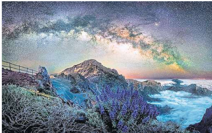
Siegerbild international: „Blue Tajinaste“ (Blauer Natterkopf) von Tony North