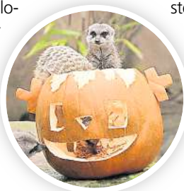
Die Erdmännchen plündern den Halloween-Kürbis.

Die Halloween-Tour ist für erwachsene Schauer-Expertinnen und -Experten sowie Kinder ab sieben Jahren geeignet. Teilnehmende unter 17 Jahren dürfen nur in Begleitung einer erwachsenen Person teilnehmen. Taschenlampen zur Wegorientierung werden vom Zoo bereitgestellt.