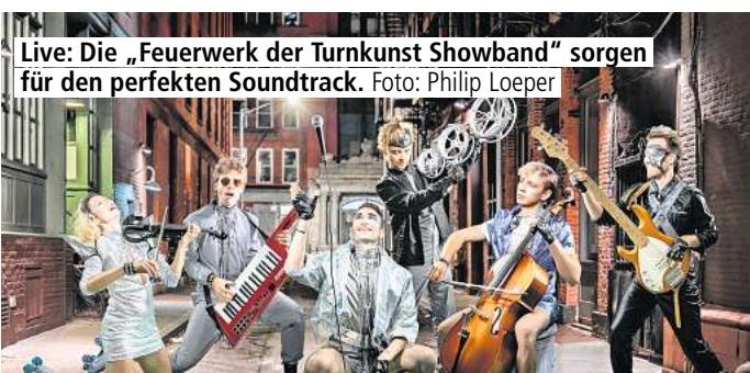
Live: Die „Feuerwerk der Turnkunst Showband“ sorgen für den perfekten Soundtrack.

Eine Zeit, in der die Straßen der US-amerikanischen Metropole regiert wurden durch Clans und tägliche Auseinandersetzungen. Hier schien kein Platz für Liebe zu sein. Emotionen äußerten sich vielmehr in Rivalität. Wenn die neue Produktion von Europas erfolgreichster Turnshow am 29. Dezember 2023 in Oldenburg ihre Premiere feiert, wird sie jedoch zeigen, dass die 80er Jahre viel mehr waren, als Straßenkampf, nämlich eine Zeit mit einem ganz besonderen Rhythmus und inspirierendem