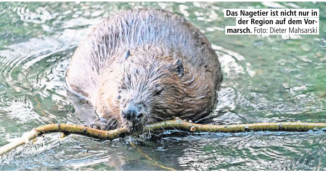
Das Nagetier ist nicht nur in der Region auf dem Vormarsch.

Der erste Rückkehr in der Region Hannover wurde 2005 an der südlichen Leine entdeckt,