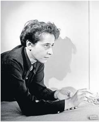
Mit den Hannah-Arendt-Tagen erinnert die Stadt Hannover an die 1906 in Linden geborene, international bekannte Politiktheoretikerin. Hannah Arendt, aufgenommen im Jahre 1944.