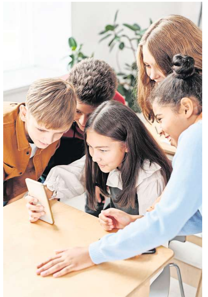
Und alle lesen mit: Kinder sollten darauf achten, was sie über sich in sozialen Netzwerken preisgeben.

1. Bilder sorgfältig überprüfen: Eltern können ihr Kind dazu ermutigen, sich nicht vom Zeitdruck irritieren zu lassen. Sie sollten zum Beispiel niemals freizügige Bilder posten, nur um innerhalb des Zeitlimits zu bleiben. Schließlich bleiben Bilder den ganzen Tag auf BeReal und können somit von allen gesehen werden, mit denen sie geteilt wer-