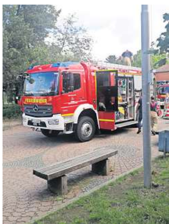
Wasserschaden an der Albert-Einstein-Schule: Die Laatzer Feuerwehr pumpt das Wasser aus dem Technikgebäude in die Kanalisation der Wülferoder Straße.