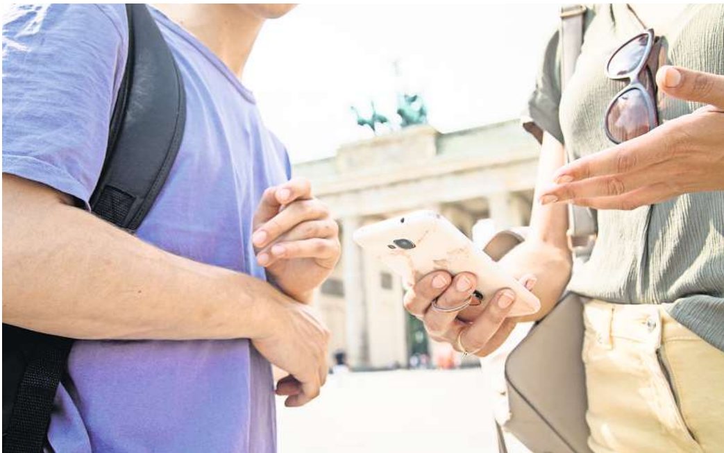
Ohne Risiken für die Kinder sind Urlaubsfotos mit Stadtbildern - und wenn der abgebildete Mensch nicht deutlich zu erkennen ist.

Eltern sollten ihre Kinder daher dabei unterstützen, herauszufinden, ob ein Bild wirklich für die Öffentlichkeit bestimmt sein soll – oder ob es einem später unangenehm sein könnte. Auf keinen Fall sollten laut der Initiative peinliche oder zu freizügigen Aufnahmen geteilt werden. Was im ersten Moment lustig oder provokant gemeint ist, können Jugendliche später bereuen. Das heißt natürlich nicht, dass man gar nichts vom schönen Urlaub posten darf. Unbedenk-