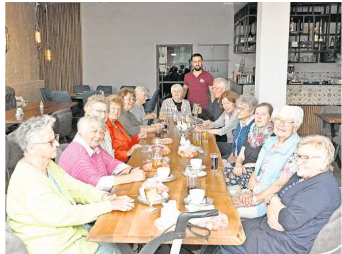
Muntere Sonntagsrunde: Beim Treffen im Restaurant Aspendos wird am Nachmittag gern und ausgiebig geklönt.

Partner im RedaktionsNetzwerk Deutschland RND