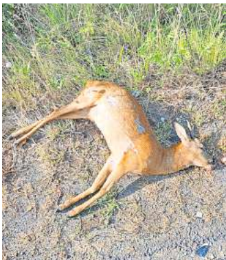
Wildunfall auf dem Messeschnellweg: Dieser Rehbock starb am Morgen des 24. Juni bei dem Versuch die B6 auf Höhe des Mastbruchholzes und des Ikea-Parkplatz zu überqueren.

Die Stadt ist offenbar entschlossen, etwas zu tun, wie deren Sprecherin sagt. „Sollte die Prüfung der Landesbehörde zu dem Ergebnis kommen, dass kein Zaun errichtet wird, prüft die Stadt die anderen Optionen zeitnah.“