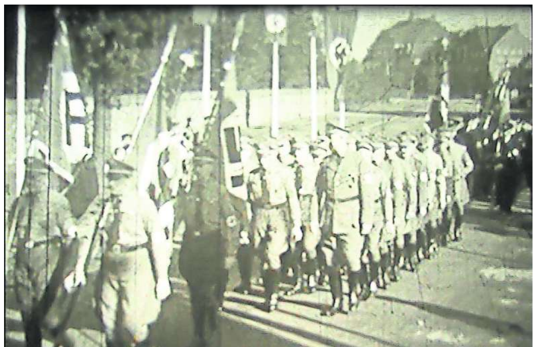
Laatzten in der NS-Zeit: Ausschnitt aus einem Film zur Einweihung des Kriegerdenkmals von 1934.