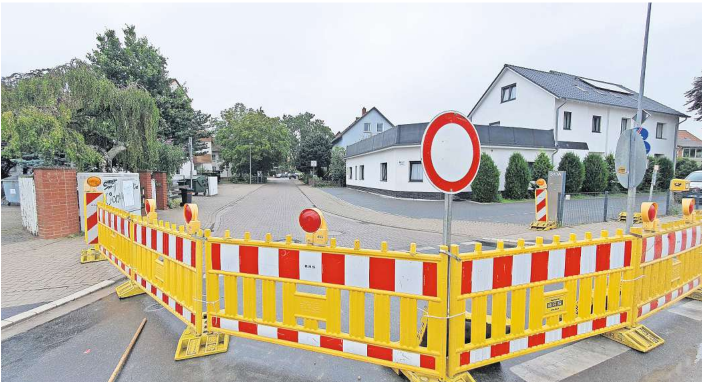
Die Zufahrt zum Immengarten ist seit Kurzem gesperrt.

„Es geht nicht nur um mich“, betont Fritsche. Gerade mobilitätseingeschränkte Menschen könnten nicht auf die angebotenen Ersatzbusse ausweichen oder das Fahrrad nehmen. Bei