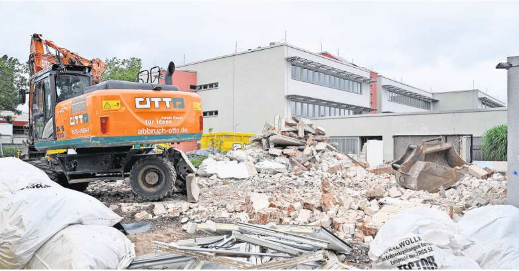
Dauerbaustelle bis Herbst 2025: Für die Erweiterung der KGS Hemmingen wird das frühere Wohnhaus von Hausmeister Kluge - die Kluge-Villa - abgerissen.

Südlich der Baustelle geht es an der Türmchenschule vorbei auf den Campus. Der Zugang von der