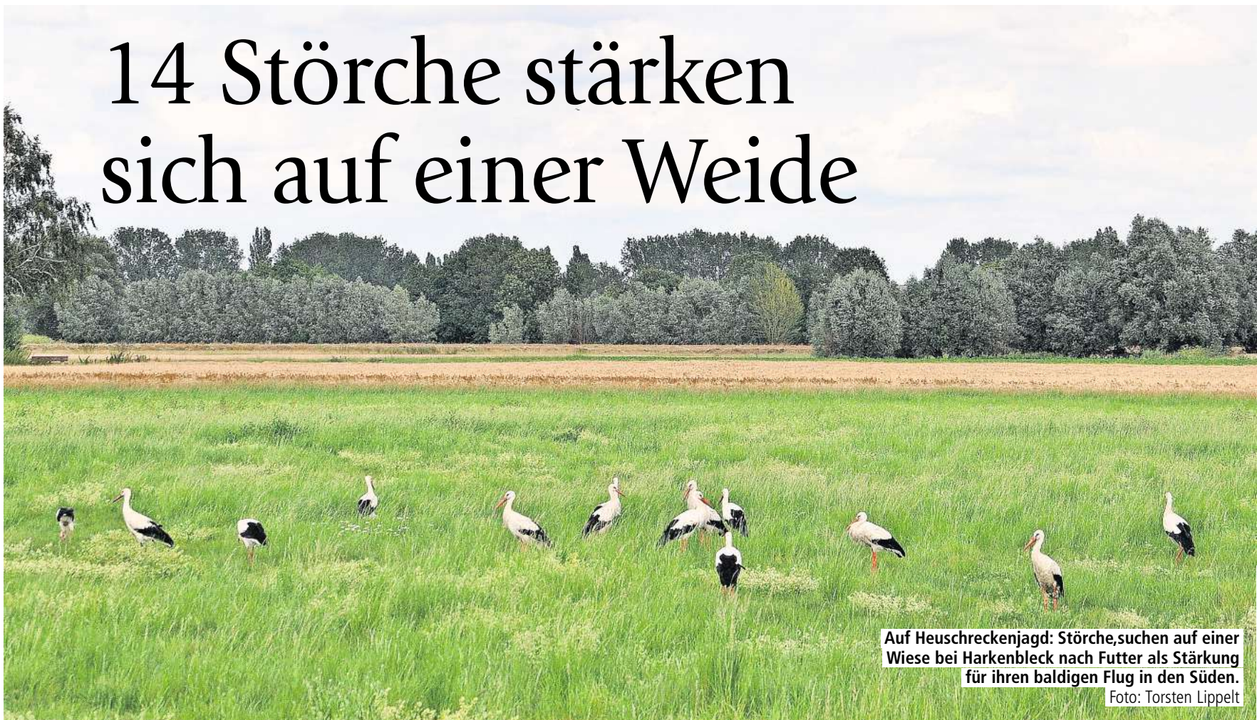
Auf Heuschreckenjagd: Störche suchen auf einer Wiese bei Harkenbleck nach Futter als Stärkung für ihren baldigen Flug in den Süden.