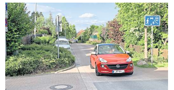
Fast alle fahren zu schnell durch die Spielstraße: 6800 Fahrzeuge wurden bei einer mehrwöchigen Tempomessung im rot gepflasterten Abschnitt der Lehrter Straße erfasst.

Es seien teils auch schon breitere Risse entstanden, bestätigte unter anderem Ortsratsfrau Andrea Melletat (Grüne). Wie Sprecher Bastian Wegener ankündigt, wolle die Stadt die Fläche noch in diesem Jahr provisorisch ausbessern, indem Sand in die ausgespülten Fugen eingebracht werde. Für das kommende Jahr sei dann eine umfangreichere Sanierung des Straßenabschnittes geplant.