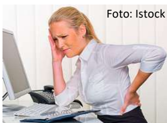
Rückenschmerzen können zur täglichen Qual werden!

Wichtig ist es, tiefsitzende, unwillkürliche Muskelschichten zu erreichen, um die Gelenke der Wirbelsäule zu mobilisieren und mehr „Luft“ in den Zwischenraum der Bandscheiben hinein-