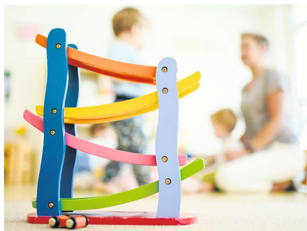
Die Stadt gibt die Schließzeiten für die Kindertagesstätten in den Sommerferien bekannt: Die personelle Situation bleibt angespannt. Uwe Anspach/dpa

Noch schwieriger wird die Aufrechterhaltung der Kinderbetreuung in Urlaubszeiten. Die Verwaltung hat die Schließzeiten der elf städtischen Kindertagesstätten in den Sommerferien von Donnerstag, 6. Juli, bis Mittwoch, 16. August, jetzt bekannt gegeben. Auch die Schließzeiten der Einrichtungen in freier Trägerschaft stehen fest. Die städtischen Kindertagesstätten wechseln sich wie üblich ab, sodass ein Teil in der ersten Hälfte der Sommerferien und der andere Teil in der zweiten Hälfte