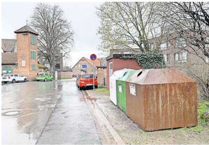
Umbaupläne: Die Container sollen abgebaut und an ihrer Stelle sechs Stellplätze, darunter drei behindertengerecht mit 3,50 Meter Breite, für Nutzer des rechts daneben liegenden Standesamtes eingerichtet werden.