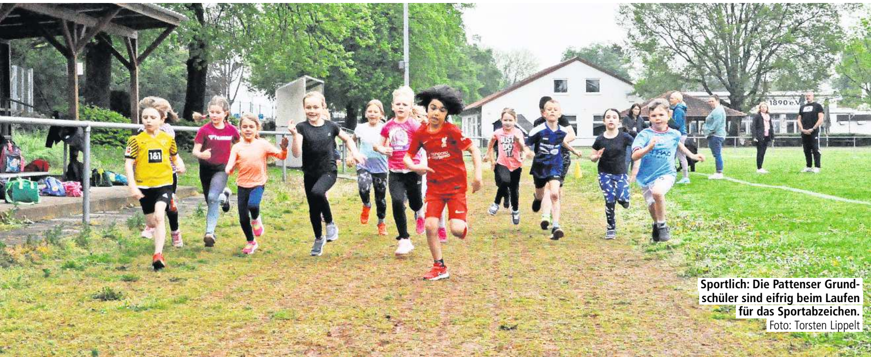
Sportlich: Die Pattenser Grundschüler sind eifrig beim Laufen für das Sportabzeichen.