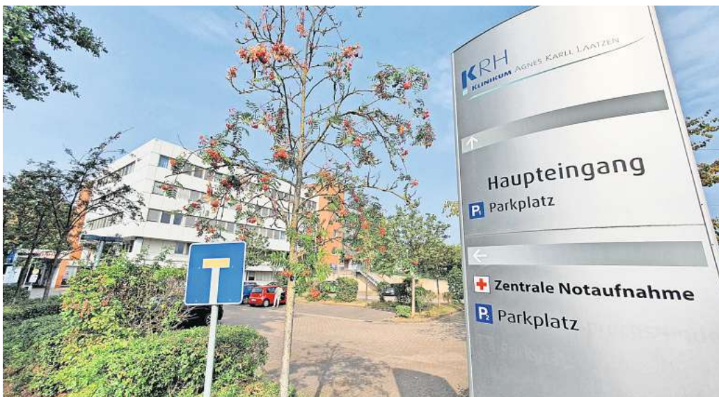
Medizinstrategie 2030 ist entschieden: Das Agnes-Karll-Krankenhaus verliert unter anderem seine Unfallchirurgie, soll aber um ambulante Angebote erweitert werden.

„Nach Vorbereitung und Herstellung der infrastrukturellen Voraussetzungen wird die Neurologie nach Gehrden und die Orthopädie und Unfallchirurgie in das Klinikum Mitte verlagert“, heißt es im Beschluss.