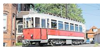
Legendar: Der Triebwagen 710 der „Roten Elf“.

Thurnitstraße 1. Von dort geht es auf der einstigen Route nach Sarstedt und zurück. Bei hoher Nachfrage sollen noch weitere Fahrten angeboten werden. Da nur über Stufen ein- und ausgestiegen werden kann, ist die Fahrt für mobilitätseingeschränkte Menschen nur bedingt geeignet. Rollstühle, Räder und große Kinderwagen können nicht mitgenommen werden. Tickets gibt es für 20 Euro am Fahrkartenverkauf der Üstra am Ernst-August-Platz in Hannover.