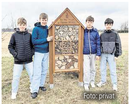
Fleißige Insektenhotel-Bauer Seite 4