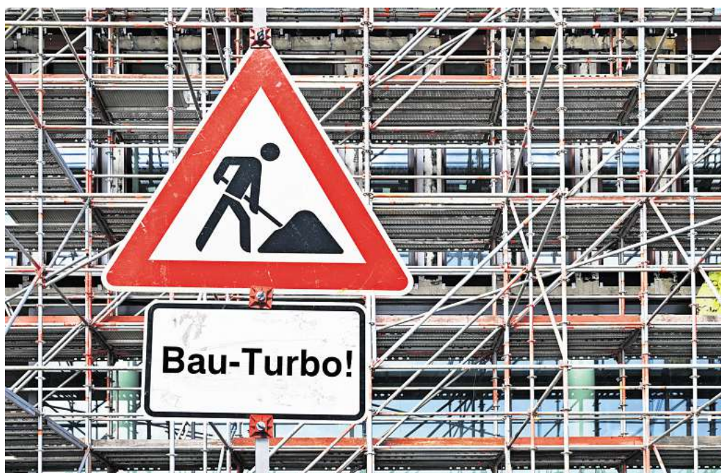
Bau-Turbo: Kommunen können Wohnungsbauprojekte schneller genehmigen. Das ist der Kern des neuen Paragraphen 36a im Baugesetzbuch (BauGB).