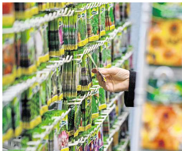
Die Verlockung ist groß, denn so ein Samentütchen ist klein und günstig.

► Der ideale Standort: Temperatur und Licht sind zwei wichtige Faktoren für Keimung und Wachstum. Direkte Sonneneinstrahlung ist zu vermeiden, einen hellen Platz sollte man dennoch bereithalten – so bleiben die Pflanzen kompakter. Die optimale Keimtemperatur, auf jeder Samentüte vermerkt, sollte man Tag und Nacht einhalten, damit sich gleichmäßig Pflanzen entwickeln.