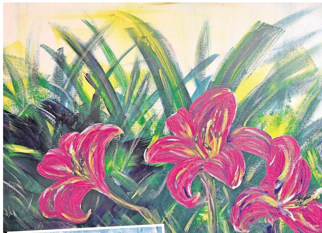
LaBruja: 3 Lilien, 2026. Acryl auf Leinwand.

Ausstellung mit Arbeiten von LaBruja in der GLOWART GALLERY