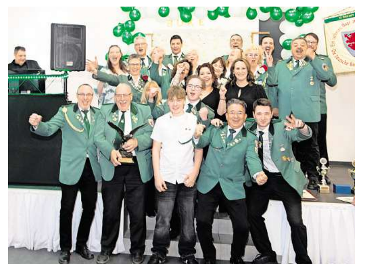
Der SV Gleidingen feiert ausgelassen die sportlichen Erfolge.

In den Mannschaftswertungen zeigte sich die Breite der Vereine: Der SV Laatzten ge-