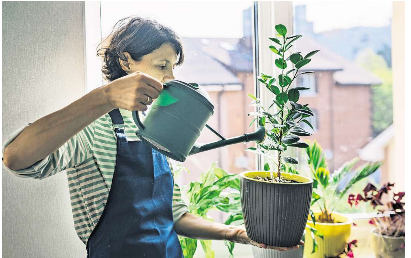
Häufigste Ursache fürs Absterben: Übermäßiges Gießen bekommt Zimmerpflanzen nicht gut – sie kommen mit kurzen Trockenphasen besser zurecht als mit ständig nasser Erde.

Neben der passgenauen Auswahl der Pflanze gibt es noch ein