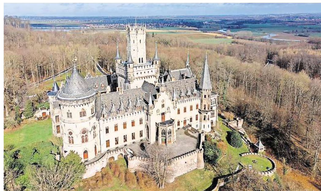
Das Epizentrum soll sich in der Nähe von Pattensens Ortsteil Schulenburg mit dem Schloss Marienburg – befinden haben.

Die Magnitudenskala ist logarithmisch aufgebaut, nicht linear. Ein Erdbeben der Magnitude 4,0 setzt eine 30-mal höhere Energie frei als ein Beben der Magnitude 3,0. Beben ab 3,0 bis 4,0 sind in der Regel spürbar, verursachen aber selten Schäden. Bis 5,0 sind Erschütterungsgeräusche wahrnehmbar. Bei stärkeren Beben sind Gebäudeschäden wahrscheinlich. Laut LBEG ereignete sich das stärkste bekannte Erdbeben in Niedersachsen am 3. September 1770 bei Alfhausen nördlich von Os nabrück. „Nach historischen Quellen führte es zu wenigen leichten Gebäudeschäden und wurde mit einer Intensität von 6 bewertet.“ Zum Vergleich: Das verheerende Erdbeben in der Grenzregion zwischen Syrien und der Türkei im Februar 2023 mit der Stärke 7,8 hatte fast 60.000 Tote und gut 280.000 eingestürzte oder beschädigte Gebäude zur Folge.