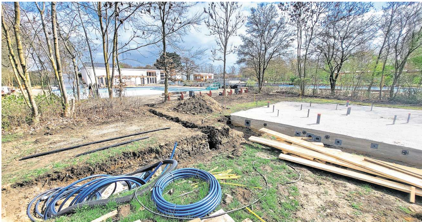
Im Freibad Arnum: Die Vorbereitungen für den Saisonstart laufen.

Ehrenamtliche unterstützen dabei, beschädigte Alltagsgegenstände wieder nutzbar zu machen. Repariert werden unter anderem Kleidung, kleinere Möbelstücke, Spielzeug, Fahrräder und Elektrogeräte. Das Angebot ist kostenlos, Spenden zur Deckung der Betriebskosten sind jedoch willkommen. Ziel des Repair Cafés ist es, Ressourcen zu schonen und die Lebensdauer von Gebrauchsgegenständen zu verlängern, anstatt sie vorzeitig zu entsorgen. RED