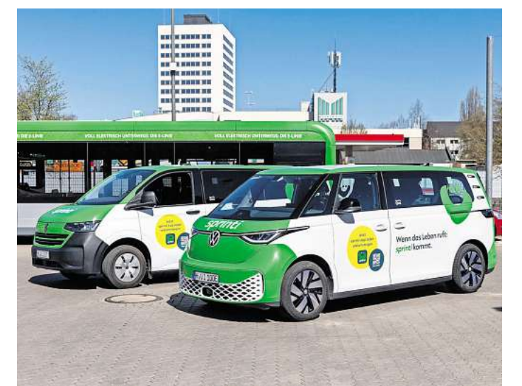
Neue E-Fahrzeuge erweitern die sprinti-Flotte.

Das System richtet sich damit gezielt an den Alltag im ländlich geprägten Raum. Wer etwa in Pattensen unterwegs ist, kann flexibel Fahrten innerhalb der Tarifzone buchen, ohne auf feste Abfahrtszeiten angewiesen zu sein. Voraussetzung ist lediglich ein gültiges Ticket des Verkehrsverbunds. Die Fahrzeuge bieten Platz für bis zu sechs Fahrgäste und sind auch für Rollstühle oder Kinderwagen ausgelegt. Wer einen Rollstuhl nutzt, kann dies im Kundenprofil angeben, um