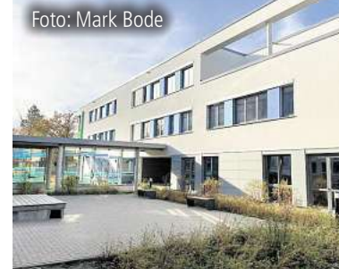
Steigende Schülerzahlen an der KGS Pattensen Seite 4