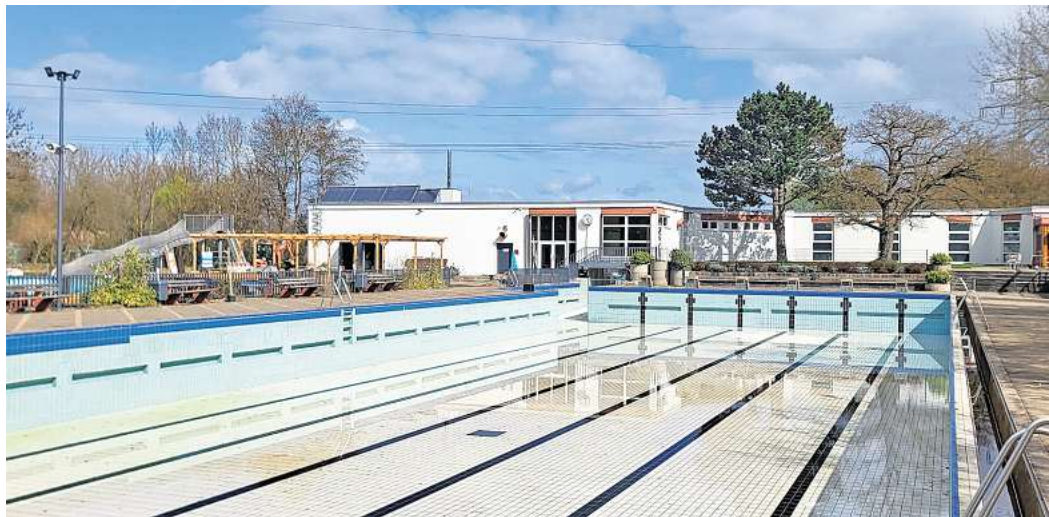
Die Saison im Freibad Arnum soll im Mai starten.