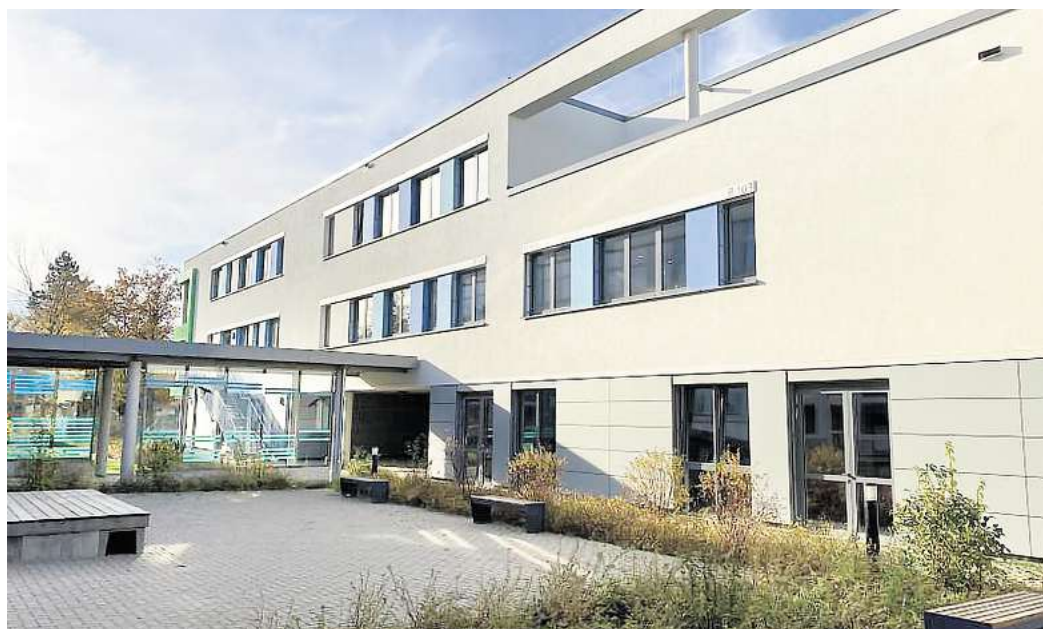
Steigende Schülerzahlen: Es wird voll an der Ernst-Reuter-Schule (KGS Pattensen).

Insgesamt besuchen 1130 Schülerinnen und Schüler die Ernst-Reuter-Schule. Davon sind 19,1 Prozent, also 215