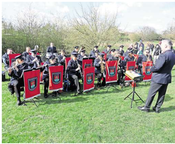
Der Feuerwehrmusikzug Laatzten begleitet musikalisch in den Frühling.