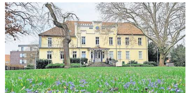
Laatzens schönstes städtisches Gebäude: Das Alte Rathaus in Alt-Laatzen liegt idyllisch in einem Park.

Eine Dauerlösung soll Gleidingen nicht werden. „Das Alte Rathaus soll nach der Sanierung wei-