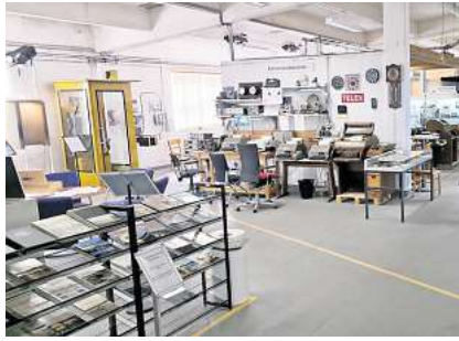
Besonders die Telex-Abteilung mit ihren zahlreichen funktionsfähigen und miteinander verbundenen Fernschreibern erfreut sich großer Beliebtheit.