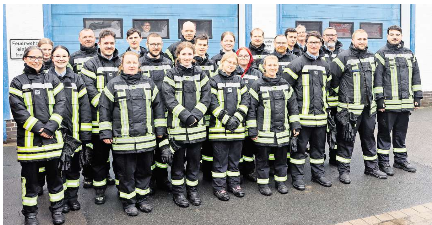
Geschafft: 23 Personen absolvieren erfolgreich die Grundausbildung der Pattenser Feuerwehr.