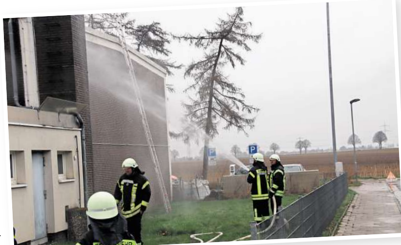
Einsatzszenario: Die angehenden Feuerwehrleute üben an der alten Grundschule in Schulenburg.

Den Abschluss des Lehrgangs bildete eine realitätsnahe Einsatzübung an der alten Grundschule in