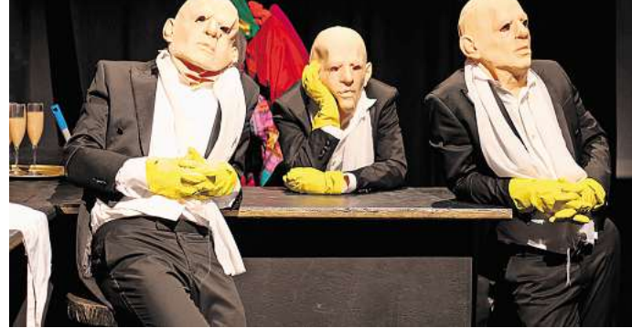
Szene aus „Mephisto. Under Pressure“