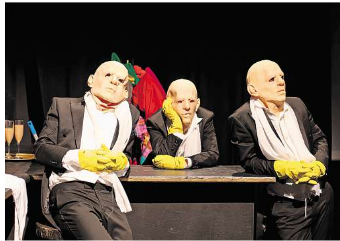
Szene aus „Mephisto. Under Pressure“

(„etwas mitgenommen“). Im Rahmenprogramm werden angeboten: Nachgespräche mit den beteiligten Akteurinnen und Akteuren; ein Vortrag von Radikale Töchter, in dem der eigene Mut-Muskel mit Mitteln der Aktionskunst trainiert wird; eine Podiumsdiskussion mit Akteurinnen und Akteuren der freien Szene über aktuelle Herausforderungen und ein Get-together des Landesverbandes Freie Darstellende Künste. Zur Eröffnungsfeier am 23. April gibt es Livemusik von den Ellingtones. Bei der Abschlussfeier am 25. April kann zur Musik der DJs streunerli und BruderJakob getanzt werden. Zu den Veranstaltungen des Rahmenprogramms ist der Eintritt frei.