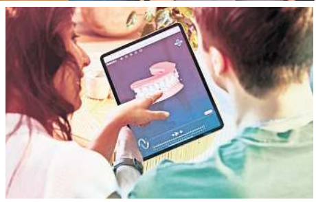
Individuelle Beratung: Mit der Aligner-Therapie zum gesunden und schönen Lächeln.

imation. „Wir zeigen so, wie sich Ihre Zähne Stück für Stück in die gewünschte Form bringen lassen und Ihr Lächeln nach einer Aligner Behandlung mit clearcorrect aussehen kann. Interessierte vereinbaren einfach einen Termin zur Be-