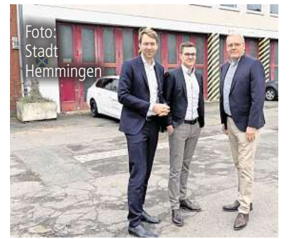
Schließen den Vertrag vor Ort ab. Seite 4