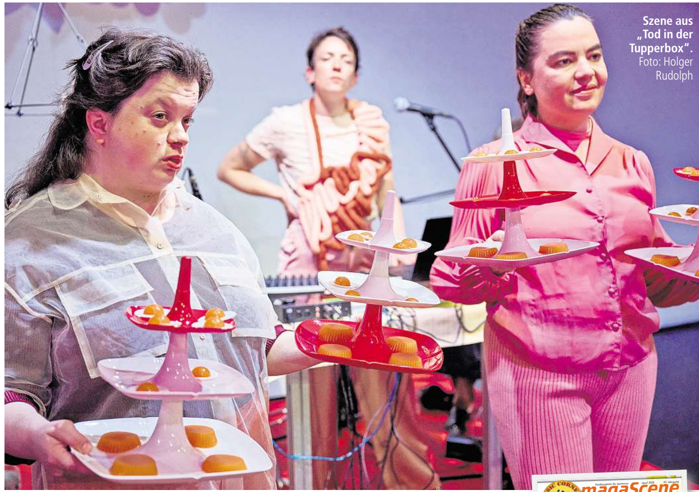
Szene aus „Tod in der Tupperbox“.