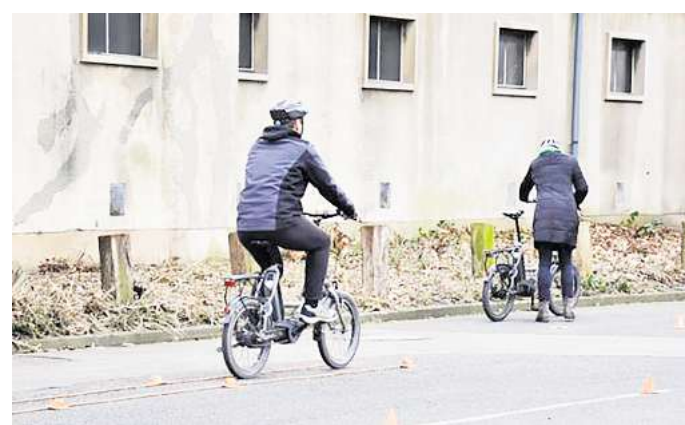
Eine Anmeldung ist erforderlich und telefonisch unter (0511) 109 2583 oder (0511) 109 2585 sowie per E-Mail an praevention@pi-hannover.polizei.niedersachsen.de möglich.

Die Teilnahme ist kostenfrei. Voraussetzung ist ein eigenes Pedelec sowie das Tragen eines Fahrradhelms. Die Teilnahme erfolgt in eigener Verantwortung.