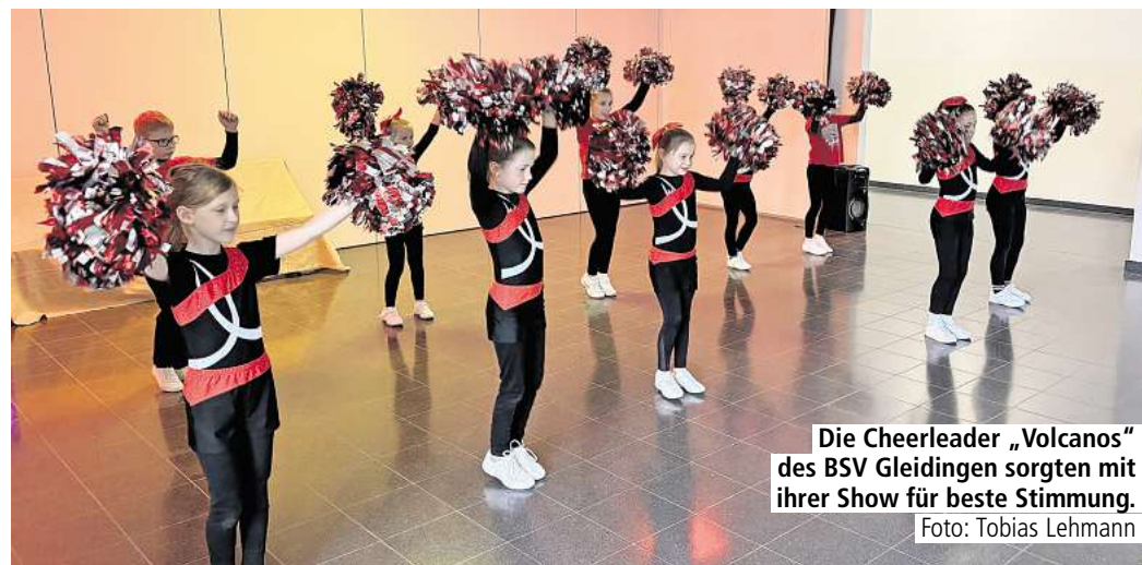
Die Cheerleader „Volcanos“ des BSV Gleidingen sorgen mit ihrer Show für beste Stimmung.