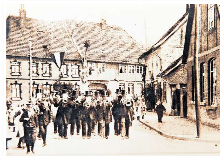
Lange Tradition: Schon im Jahr 1910 sind die Mitglieder des Uniformierten Jägercorps zum Abholen der Fahne in der Stadt unterwegs.