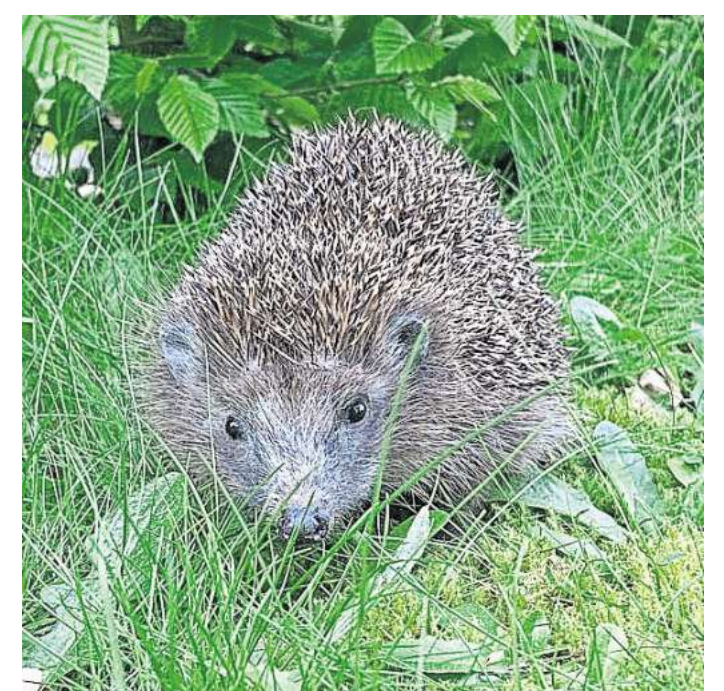
Igel können durch Mähroboter schwer verletzt werden.

Zusätzliche Rückzugsräume wie Laub- oder Reisighaufen können den Tieren Schutz bieten. Solche Bereiche sollten konsequent von der Mahd ausgeschlossen werden. RED