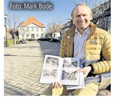
Stolz auf das Ergebnis. Seite 4