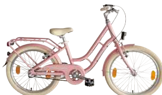
Art.-Nr.: 134813 rosa