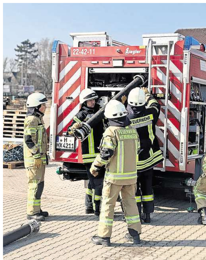
Die Teilnehmerinnen und Teilnehmer bestanden ihre Abschlussprüfung der modularen Grundausbildung.

Für Dienstag, 21. April, ist ein Spielenachmittag angekündigt. Beim gemeinsamen Scrabble steht das Gedächtnistraining im Mittelpunkt. Veranstaltungsort ist jeweils der Bürgersaal des Rathauses Hemmingen.