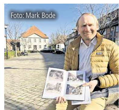
Stolz auf das Ergebnis. Seite 4