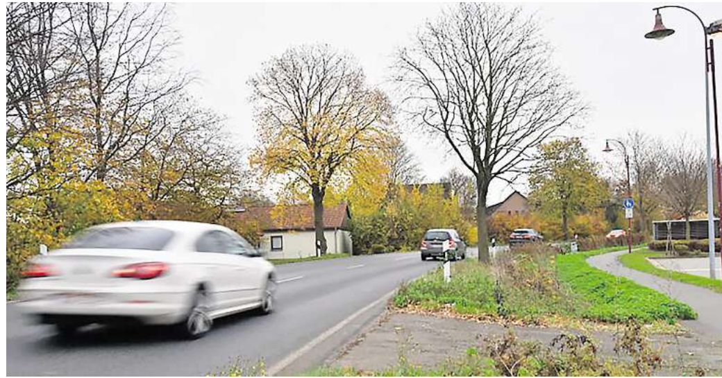
Als Standort für Glascontainer geeignet? Der Ortsrat Ingeln-Oesselse schlägt die asphaltierte Fläche vor dem Edeka-Markt an der Gleidinger Straße vor.

Bei der Endlos-Suche um einen Containerstandort für Altglas in Ingeln-Oesselse gibt es eine erneute Kehrtwende: Die Laatzener Stadtverwaltung hat nun doch Abstand davon genommen, eine weitere Wertstoffinsel in der Straße Im