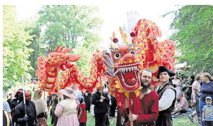
Bunt und fantasievoll: Viele Besucher erscheinen kostümiert oder mit spektakulären Objekten wie diesem Drachen.

verkauf, ermäßigt sind es 15,50 Euro. Es gibt zudem Familientickets sowie Karten für das gesamte Wochenende. Weitere Informationen gibt es im Internet unter annotopia.eu.