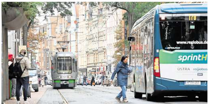
Bus und Bahn auf der Limmerstraße: „Wir wollen weitere Fahrgäste mit dem eTarif gewinnen.“

die Kosten kilometergenau berechnet werden und die technischen Voraussetzungen an den Stationen funktionieren. Mit dem Projekt übernehme der Üstra-Verkehrsverbund bundesweit eine Vorreiterrolle, sagt Emde-Lachmund. Zwar nutzten andere Verkehrsverbünde bereits die Start-Ziel-Abrechnung und lösten die Tarifzonen damit ab. Doch erstmals integriert ein Verbund mit dem Sprinti ein On-Demand-Angebot, also ein öffentliches Ruf taxi. Deshalb beteiligen sich sowohl der Bund als auch die Europäische Union mit Förderprogrammen an den Kosten im mittleren sechsstelligen Bereich. Ob sich diese Kosten kurzfristig amortisieren, steht für die Projektpartner nicht zwingend im Vordergrund: „Uns geht es darum, möglichst viele Menschen zum Umstieg von Auto auf den öffentlichen Nahverkehr zu motivieren“, sagt Mattern und sieht in der App mit dem eTarif einen weiteren Baustein. Allerdings gilt auch: Regelmäßige Üstra-Nutzer besitzen im besten Fall vier Apps auf den Handys. Neben der Üstra-App gibt es zudem eine für den Sprinti, das Sprint-Rad und nun auch „Üstra easy“. „Mittelfristig ist das Ziel, alles in einer App zu bündeln“, sagt Emde-Lachmund. Daran werde bereits gearbeitet, aber wie schnell sich dieses Vorhaben realisieren lasse, könne sie nicht konkret sagen. Deshalb plant der Verbund zunächst eine einheitliche Anmeldung für alle Apps, sodass sich Fahrgäste nur einmal mit ihren persönlichen Daten registrieren müssen.