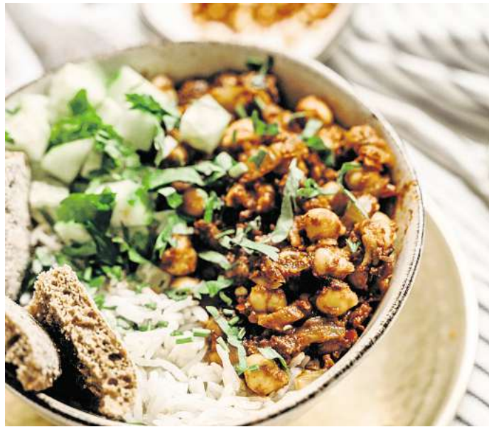
Gesundes Protein, das Lust auf leckere Rezept-Entdeckungen macht: Kichererbsen lassen sich zum Beispiel in einem Gemüsecurry zubereiten. Rote Linsen verfeinern anstelle von Hackfleisch eine Tomatensoße, die zu Nudeln passt.

Aber: Mehr als 150 bis 300 Gramm pro Woche und Person sollten es nicht sein, da sowohl Fleisch als auch Milch- und Milchprodukte gesättigte Fettsäuren enthalten. Heißt also: Pflanzliche Eiweißquellen wie Lupinen, Linsen oder Bohnen sind eine gesunde Alternative zu tierischem Eiweiß und bringen Abwechslung auf dem Teller. Vielleicht erlebt die Lupine auch auf Ihrem Teller ein kleines Revival?