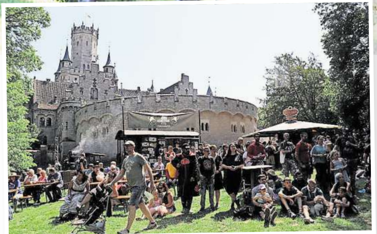
Schloss Marienburg wird zur Kulisse für Fantasy-Fans.