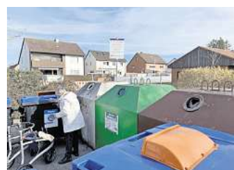
Die Wertstoffinsel wurde 2023 demontiert.

Mit der neuen Wertstoffinsel sollen die Probleme bei der Altglasentsorgung im Ortsteil endlich behoben werden. Der Ortsrat hatte zuletzt mehrfach moniert, dass vor allem die Sammelstelle am Heinrich-Heine-Weg immer wieder überfüllt