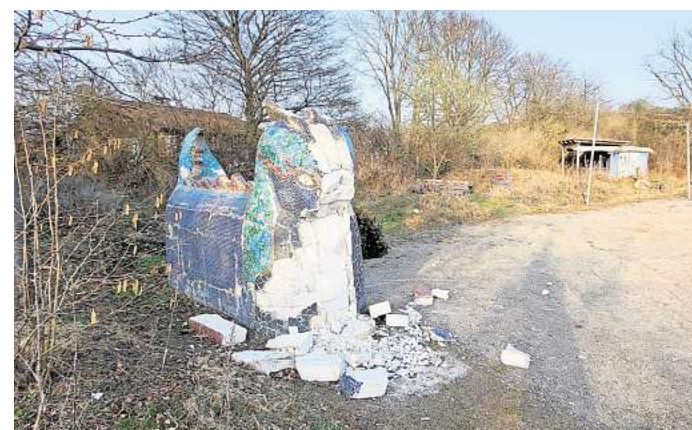
Kaputtgeschlagen: Die aus Ytongsteinen bestehende und mit bunten Mosaiken gestaltete Sitzbank in Form eines Drachen wurde seit dem Herbst immer mehr zerstört - nun ist sie weg.

Ob die Stadt an anderer Stelle noch einmal Bänke aufstellt, sei noch nicht abschließend geklärt, teilte Sprecherin Westphal auf Nachfrage mit. Denkbar wäre dies näher am Weg.