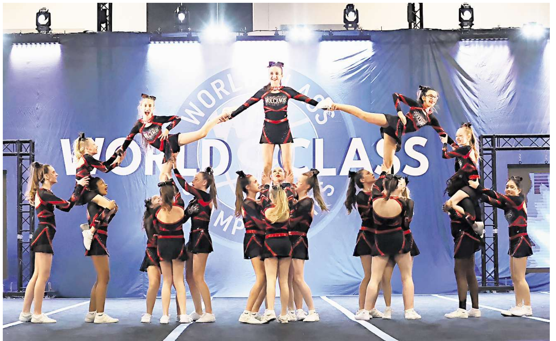
Die perfekte Vorstellung: Am ersten Wettkampftag erreichten die Volcanos Fire ein sogenanntes Hit Zero.