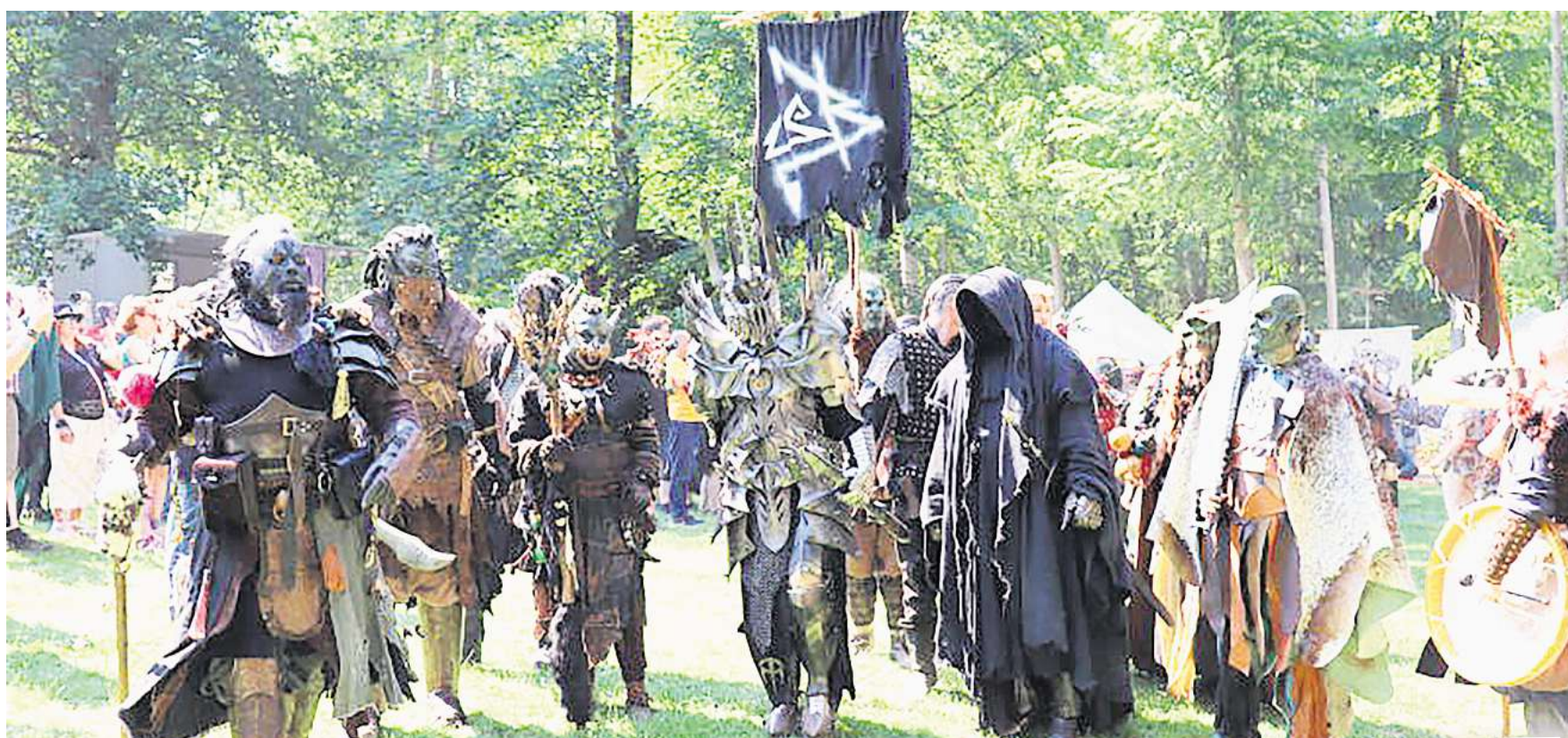
Fantastische Kostüme: Auf der Marienburg wird das Annotopia-Festival gefeiert.

Die Stiftung Schloss Marienburg bleibt aber bei dem bereits Anfang des Jahres veröffentlichten Plan, Pfingsten erstmals wieder zu öffnen. Neben einem umfangreichen Programm der An-