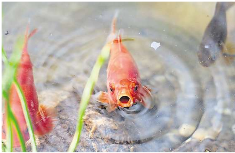
Ab 10 Grad: Teichfische werden erst aktiv, wenn das Wasser wärmer ist – kleine Futtermengen sind zum Saisonstart völlig ausreichend.

Ufer überprüfen: Auch das Teichumfeld sollten Gartenbesitzerinnen und -besitzer überprüfen. Im Winter können sich Folien, Steine oder Uferbefestigungen verschoben rund ums Wasser haben. Kleine Schäden lassen sich jetzt leicht beheben und verhindern spätere Probleme.