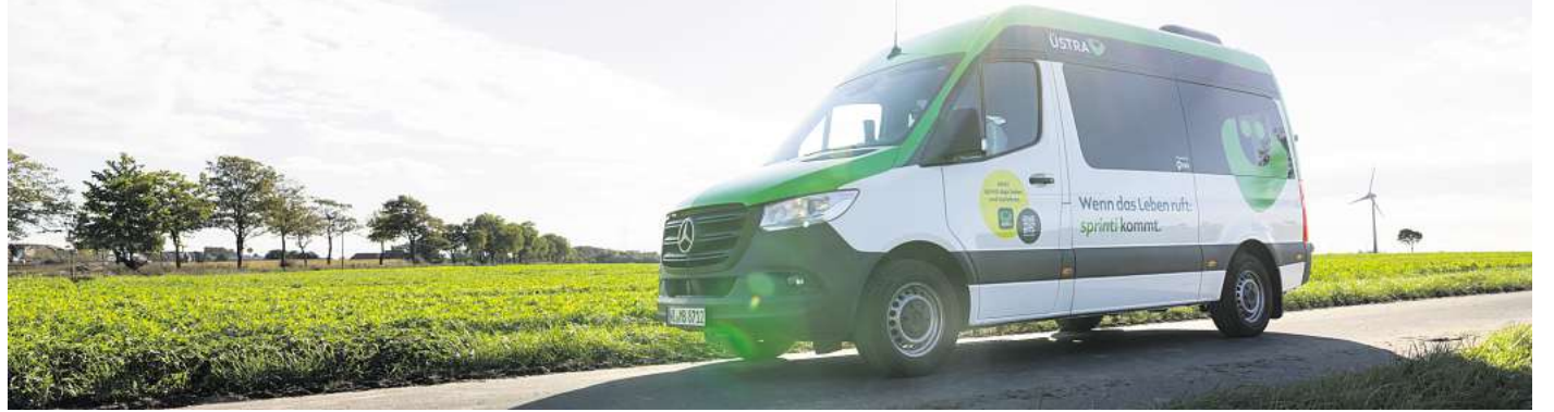
Der Service von sprinti wird unter anderem in Pattensen angeboten.

UMFRAGEERGEBNISSE DER REGION HANNOVER zeigen, dass das On-Demand-Angebot soziale Teilhabe stärkt und mancherorts das Auto ersetzt