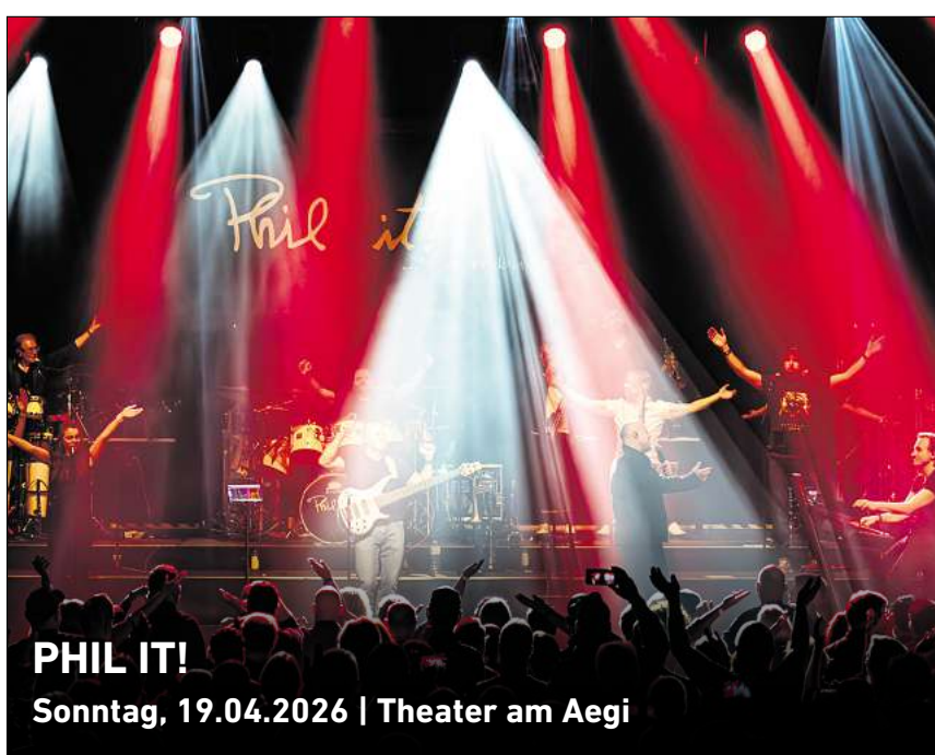
PHIL IT! Sonntag, 19.04.2026 | Theater am Aegi