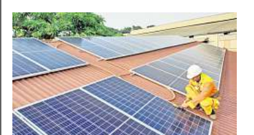
Rund um energetische Sanierungen und den Einsatz erneuerbarer Energien.

Die Teilnahme ist kostenlos. Eine Anmeldung ist erforderlich bei der Klimaschutzmanagerin Silke Nolting per E-Mail an silke.nolting@stadthemmingen.de oder telefonisch unter (0511) 4103-184.