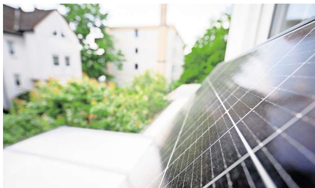
Damit das Balkonkraftwerk auch volle Leistung bringen kann, braucht es gelegentlich eine Reinigung.

an dieser Stelle weisen auf eine Störung hin. Dann oder bei sichtbaren Schäden an Kabeln oder Steckern sind Fachleute gefragt. Gleiches gilt übrigens auch für die Reinigung, wenn Sie nicht selbst bequem und ohne Gefahr an Ihre Balkonsolaranlage herankommen.