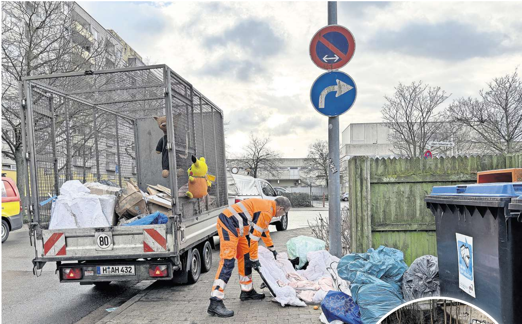
Unterwegs mit dem Standortreiner der aha-Wertstoffinseln in Laatzen: Heiko Motzkuhn