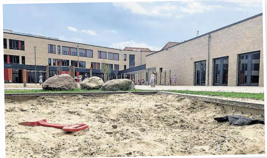
Sandkiste und Steinflächen: Auf dem Schulhof der Grundschule Pattensen heizt es sich im Sommer stark auf. Eine Entsiegelung könnte diesen Effekt reduzieren.