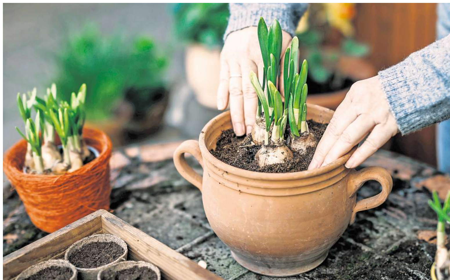
Blumenzwiebeln vertragen keine Staunässe.