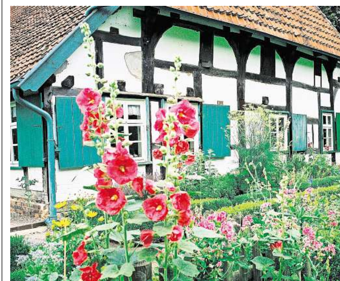
Offene Pforte: Das Nordhannoversche Bauernhausmuseum Isernhagen bietet am 31. Mai Einblicke in den wildromantischen Garten.