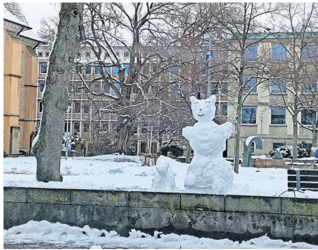
Schnee in Hannovers Calenberger Neustadt.