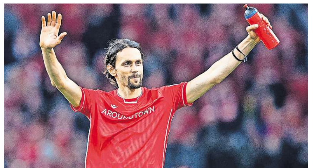
Im Union-Trikot: Neven Subotic wurde nicht nur in Dortmund, sondern auch in Berlin von den Fans gefeiert

Nach Stationen beim 1. FC Köln und bei Union Berlin sowie weiteren Engagements im Ausland zog er 2022 einen bewussten Schlussstrich unter seine aktive Profikarriere. Schon während seiner aktiven Karriere begann er, sich intensiv mit globaler Ungerechtigkeit auseinanderzusetzen, und zog daraus Konsequenzen: 2012 gründete er die well.fair foundation (ehemals Neven Subotic Stiftung), mit dem Ziel, Menschen in den ärmsten Regionen der Welt Zugang zu sauberem Trinkwasser, sanitären Anlagen und Hygiene zu ermöglichen.