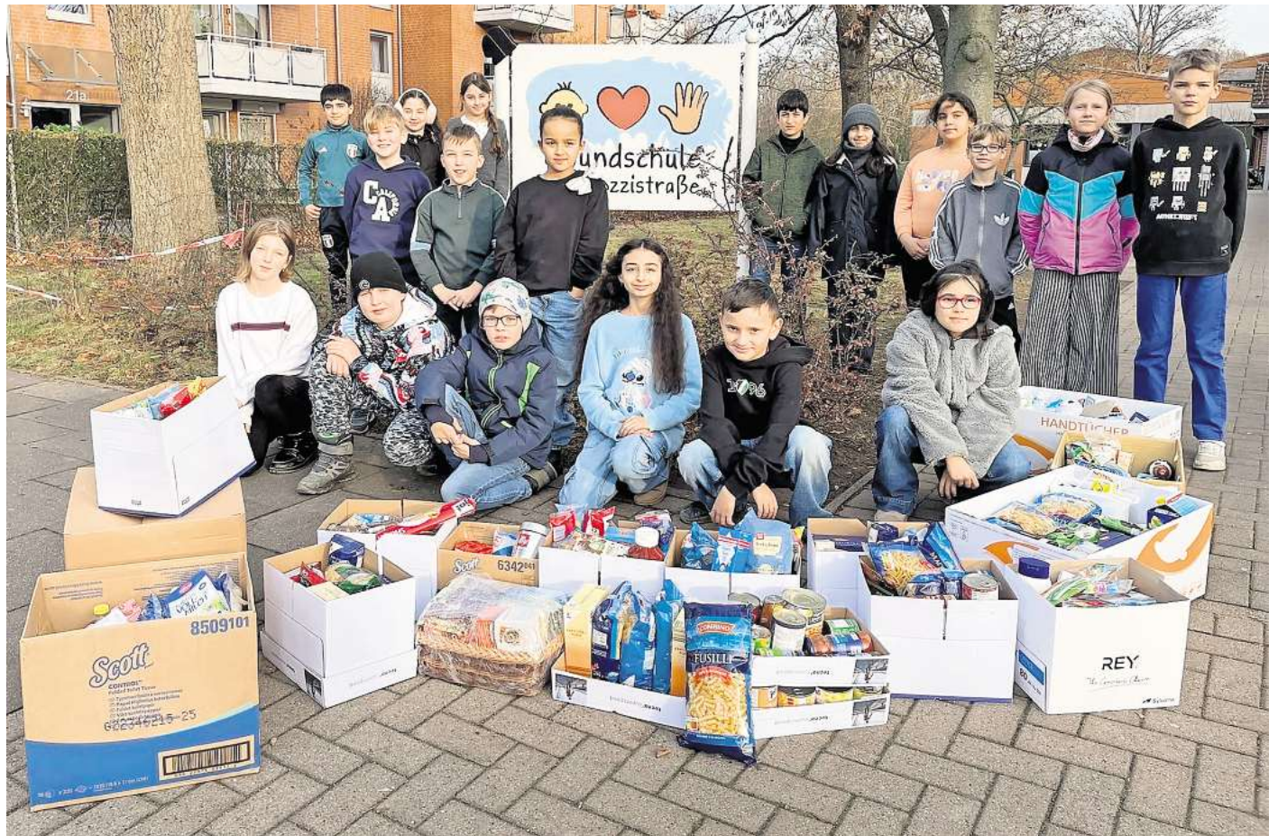
Haben etliche Kisten beigesteuert: Schülerinnen und Schüler der Grundschule Pestalozzistraße.