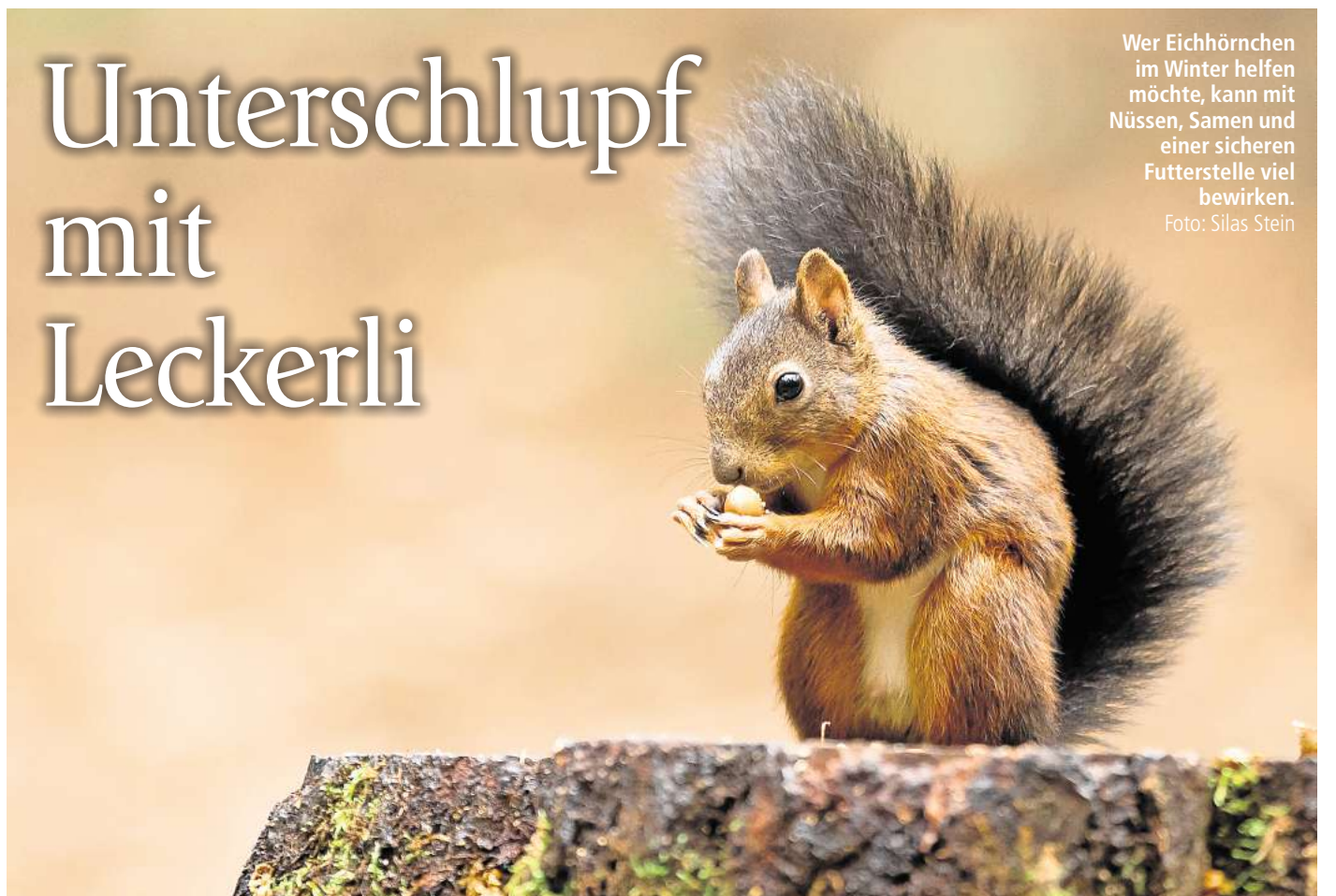
Wer Eichhörnchen im Winter helfen möchte, kann mit Nüssen, Samen und einer sicheren Futterstelle viel bewirken.

Manche Tiere sind auch in der kalten Jahreszeit AKTIV UND AUF FUTTERSUCHE – etwa Eichhörnchen. Ein bisschen Unterstützung kann helfen.