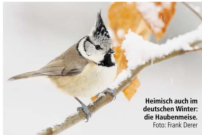
Heimisch auch im deutschen Winter: die Haubenmeise.

„Gerade jetzt, wenn der Boden gefroren ist, nehmen Meise, Amsel und Co. das angebotene Futter gerne an“, so Neffati. „Wer