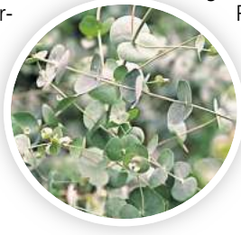
Wer Eukalyptus pflanzt, sollte bedenken, dass auch das Wurzelwerk viel Platz beansprucht.

lierendem Material abdecken und draußen lassen. Gießen nicht vergessen – aber deutlich sparsamer als während der Wachstumsperiode der Pflanze.