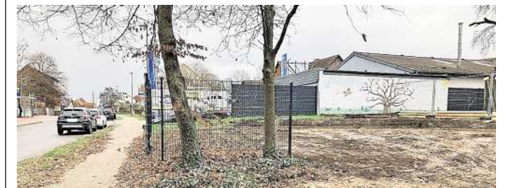
Neue Freifläche: Der einstige Schulbau „Alte Penne“ in Ingeln-Oesselse, der die letzten Jahrzehnte als Jugendtreff diente, wurde Ende November abgerissen.