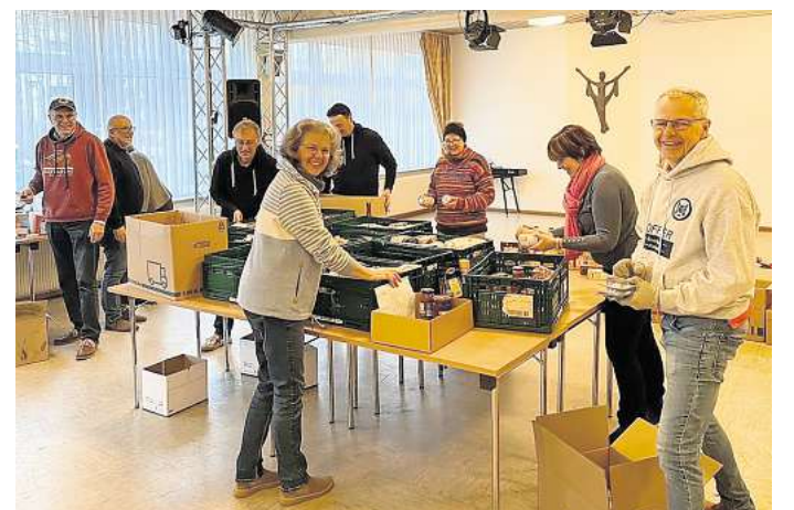
Sortieren die gespendeten Lebensmittel in Kisten um: Helferinnen und Helfer der St.-Oliver-Kirchengemeinde.