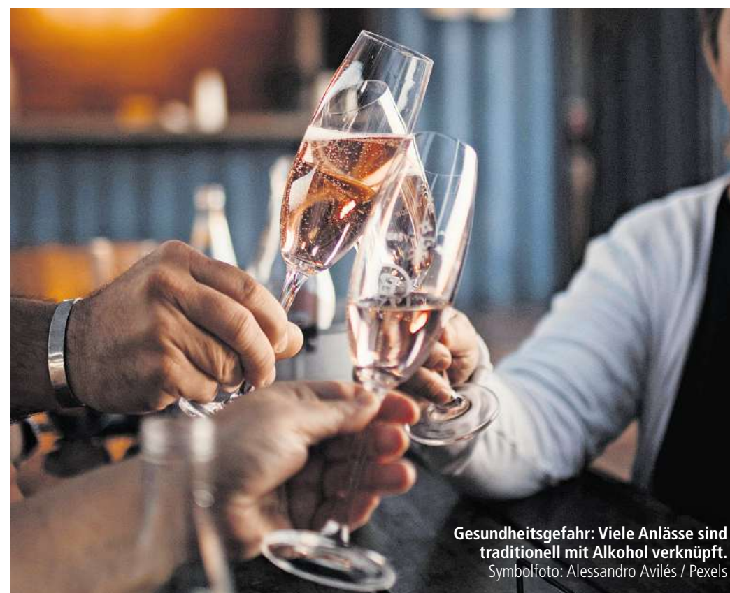
Gesundheitsgefahr: Viele Anlässe sind traditionell mit Alkohol verknüpft.

Gut zu wissen: Suchtberatungsstellen stehen nicht nur Betroffenen offen, sondern auch ihren Angehörigen. Die Deutsche Hauptstelle für Suchtfragen (DHS) bietet eine Online-Suche an, über die man Hilfsangebote in der Nähe des Wohnorts finden kann.