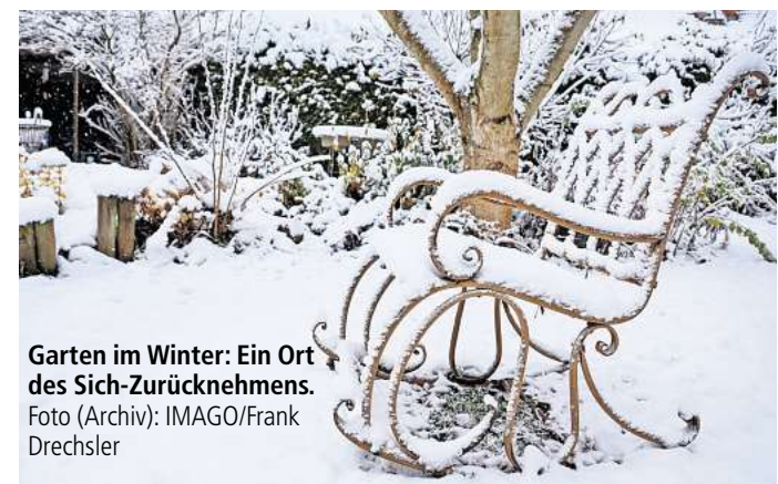
Garten im Winter: Ein Ort des Sich-Zurücknehmens.

Ein winterlicher Garten, der nach diesen Prinzipien betrachtet wird, offenbart eine neue Ästhetik. Wo ein ordnungsliebender Blick nur Chaos sieht, erkennt ein achtsamer Beobachter natürlichen Rhythmus und ästhetischen Ausdruck. Die Blätter, die über den gefrorenen Boden wehen und die kahlen Äste, die sich gegen den grauen Himmel abzeichnen, erzählen von Zeit, Wandel und Geduld. Diese Haltung verändert auch den Gärtner selbst. Wer Wabi Sabi