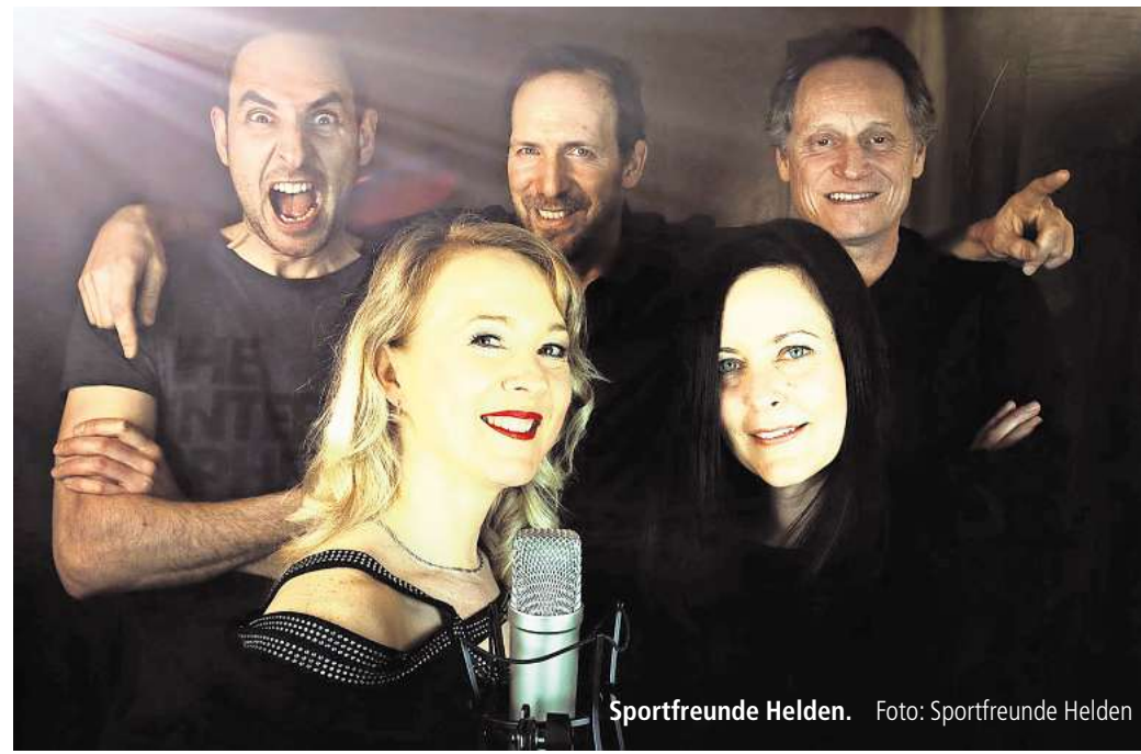
Sportfreunde Helden.