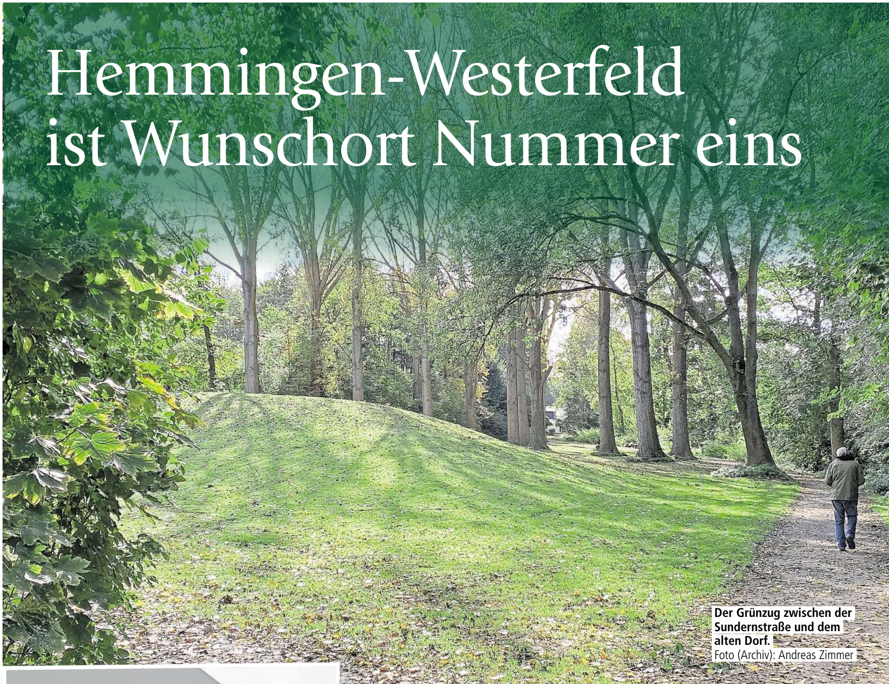
Der Grünzug zwischen der Sundernstraße und dem alten Dorf.