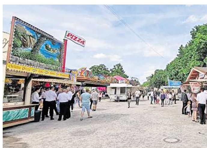
Pattensens Schützenplatz