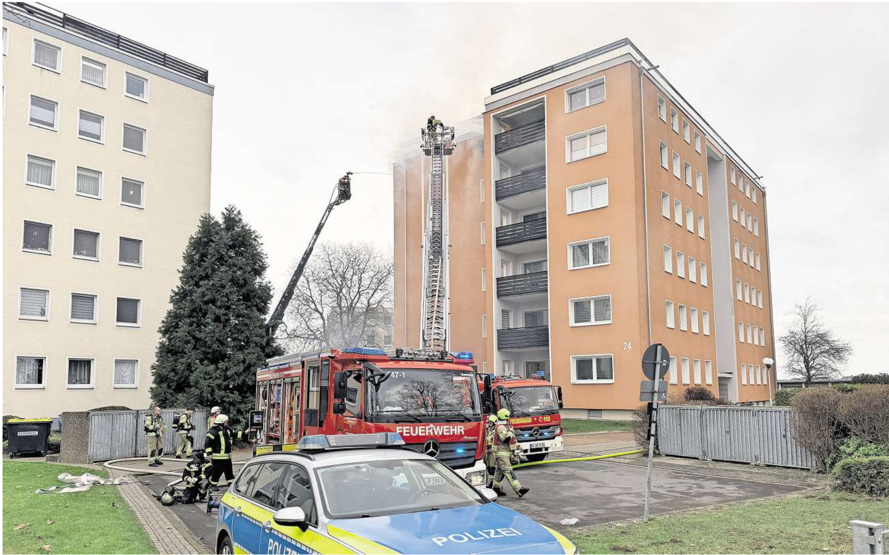
Großinsatz an der Liebigstraße: Die Feuerwehr löscht den Brand.