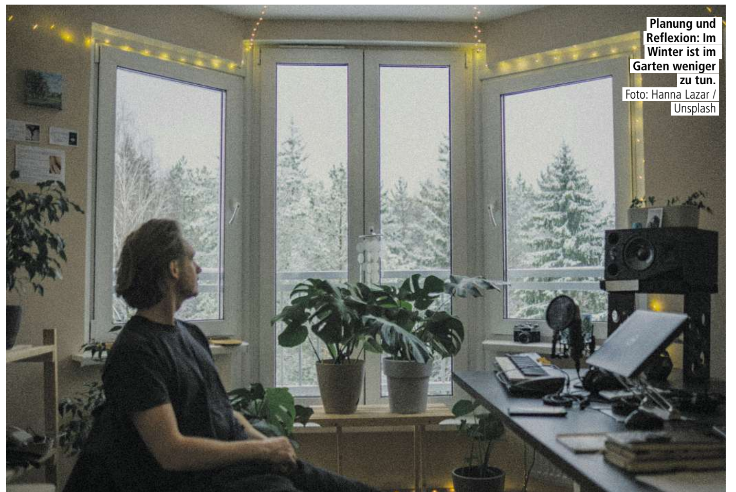
Planung und Reflexion: Im Winter ist im Garten weniger zu tun.