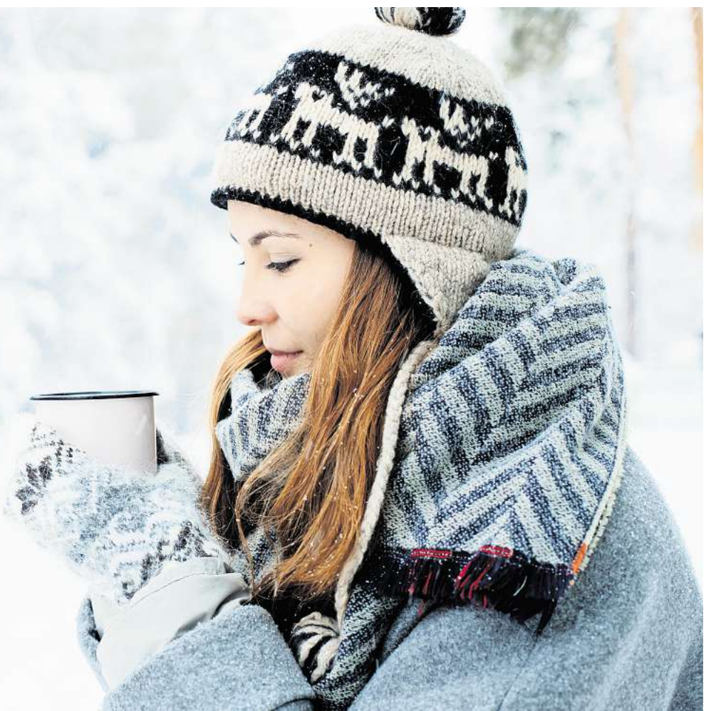
Zeit des Innehaltens: Die Raunächte laden dazu ein, Altes loszulassen und neuen Gedanken Raum zu geben.