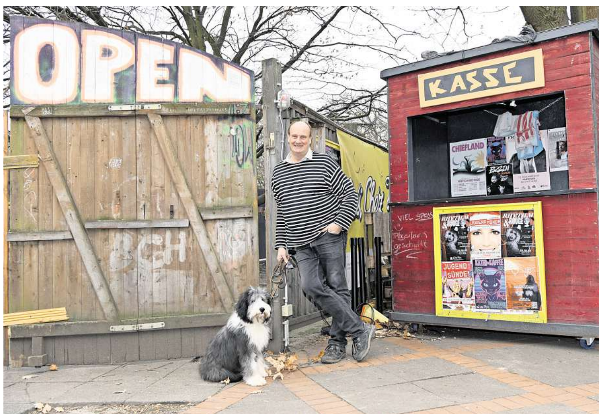
„Unser Programm hat sich immer gewandelt und geht mit der Zeit.“

geht mit der Zeit. Schon durch unsere jungen Azubis, die hier Veranstaltungskaufleute werden. Sie bringen frische, neue Ideen mit, die dann auch verwirklicht werden. Das ist auch gut so.