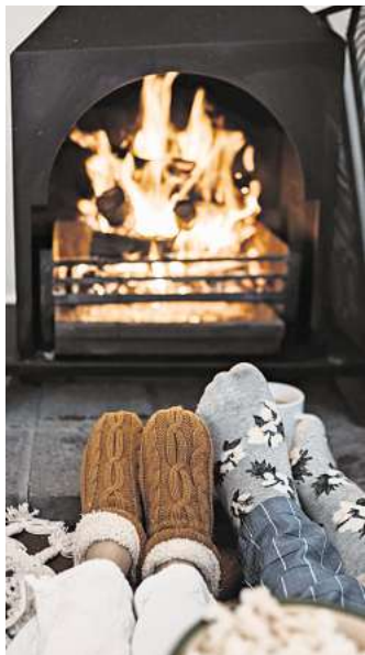
Eine kleine Auszeit vor dem Kamin (oder an der Feuerfontäne) spendet wohlige Wärme und Energie für bevorstehende Aufgaben.

Auch Dankbarkeit kann in dieser Phase ein Anker sein. Nicht im großen, weltbewegenden Sinn, sondern im Kleinen: ein gutes Moment, ein freundlicher Blick, ein Telefonat, das guttut, ein stiller Abend auf dem Sofa. Indem man die Aufmerksamkeit auf solche Miniatur-Freuden lenkt, wird das Chaos der Welt nicht kleiner – aber das eigene Gleichgewicht etwas stabiler. „Zwischen den Jahren“ ist damit kein Moment der Leere, sondern ein Raum zum Durchatmen. Eine kurze, fragile Zeit, in der man weder alles schaffen noch alles ändern muss. Vielleicht ist sie genau deshalb so wertvoll: weil sie uns erlaubt, uns selbst wieder einzusammeln, bevor wir ins neue Jahr hinübertreten.