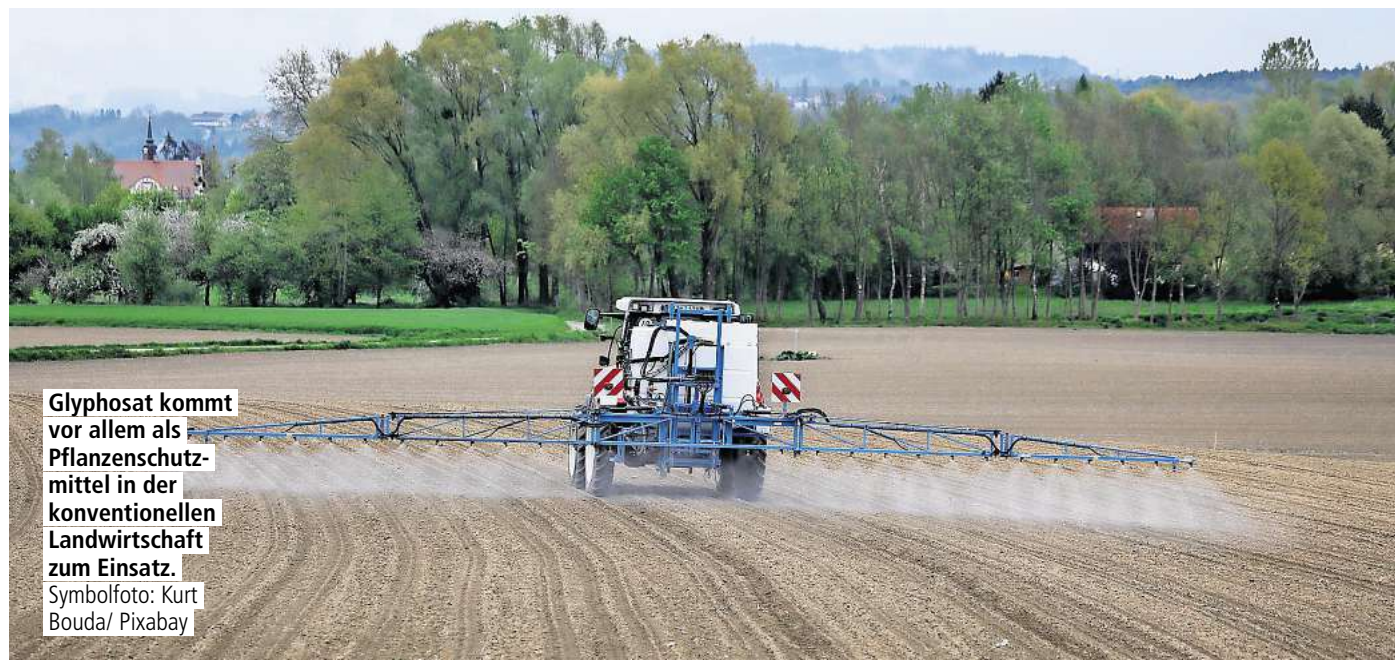
Glyphosat kommt vor allem als Pflanzenschutzmittel in der konventionellen Landwirtschaft zum Einsatz.

Fachjournal wirft den Autoren VERBINDUNGEN ZUM GLYPHOSAT-HERSTELLER Monsanto vor