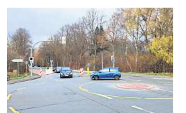
Immer bremsbereit: Wer in Arnum Kreisel fährt, tut gut daran.

Ein Passant, der namentlich nicht genannt werden möchte, stellte fest: „Gehput wird hier in den vergangenen 14 Tagen öfter als früher.“ Der Minikreisel in dieser Form, mitsamt seiner Miniinsel in der Mitte, erhält im Frühjahr 2026 seine dauerhafte Markierung in Weiß. Als Provisorium wird er voraussichtlich bis zur Jahreswende 2027/2028 den Verkehr an Arnums Ortseingang lenken. Erst danach ist im Zuge der geplanten Umgestaltung von Arnum-Mitte entlang der alten B3 der endgültige Umbau des bisherigen Kreuzungsbereiches vorgesehen.