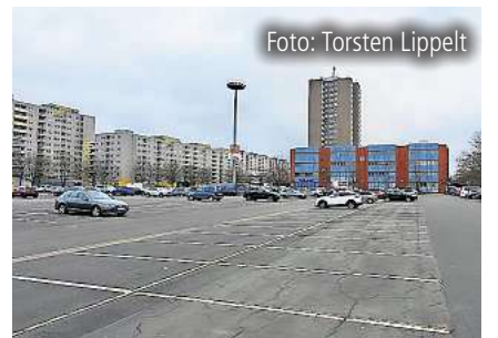
Wo sollen in Laatzen zukünftig Hitze-schutzinseln entstehen? Seite 4