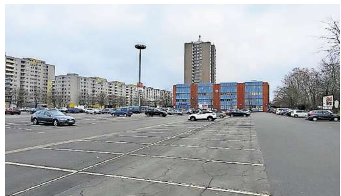
Bietet üblicherweise viel Platz für Autos: Der Parkplatz 2 am Leine-Center in Laatzten liegt in unmittelbarer Nähe zu den Stadtbahnhaltestellen Laatzten-Zentrum und Park der Sinne.

Zudem werde die Verwaltung bei Händlern im Stadtgebiet dafür werben, sich am bundesweiten Refill-Programm zu beteiligen, so Brinkmann weiter. Derzeit bietet nur der Nabu Laatzten (Ohestraße) eine Zapfstation für Trinkwasser an. Künftig sollten runde blaue Aufkleber bei Geschäften oder anderen öffentlichen Orten in Laatzten anzeigen, wo es kostenlos Leitungswasser gibt. Auch im Rathausfoyer werde eine Station eingerichtet, so Brinkmann – selbst wenn diese nur einen Sommer zu nutzen sei, weil das Rathaus ab 2027 abgerissen wird.