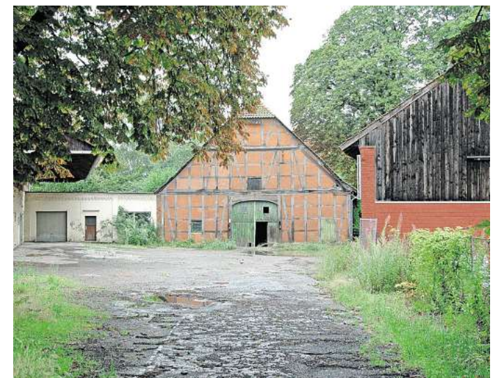
Idyllisch: Der Flebbehof im Juli 2014 - vor dem Abriss der übrigen Hofgebäude.