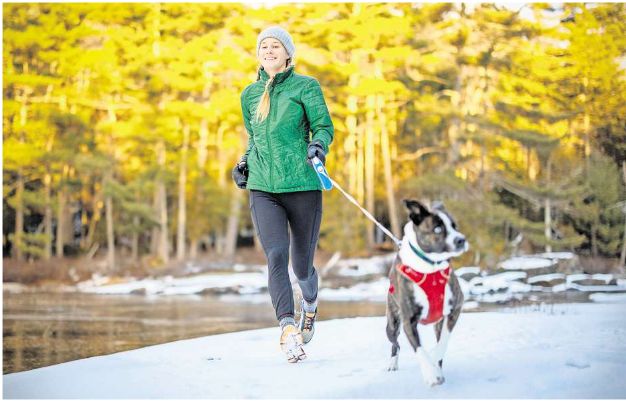
Auch bei Schnee und Eis draußen: Dieser Läuferin dürfte helfen, dass ihr Hund ohnehin vor die Tür muss.