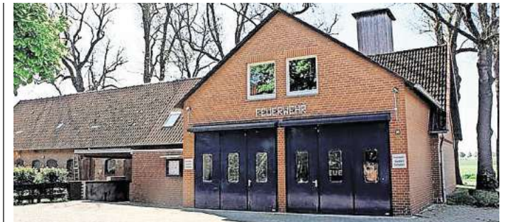
Die Zeit der veralteten Feuerwehrrhäuser, hier in Jeinsen, läuft ab: Die Ortsfeuerwehren in Pattensen bekommen bis 2033 neue Wachen.

Dass es durch den Umzug nach der im April 2026 geplanten Neueröffnung in Harkenbleck zu einem Rückgang bei den Nutzern und Nutzerinnen des Lernortes kommt, fürchtet im Verein niemand. Durch den neuen Standort und das inhaltlich erweiterte pädagogische Weltacker-Angebot auch für Ältere bestehe nun eine räumliche Nähe zu drei Kooperativen Gesamtschulen. Aus der Region liegen darüber hinaus bereits von vielen Schulen und Einrichtungen Buchungen vor. Interesse am handlungs- und lösungsorientierten Bildungsprojekt zeigen auch der Verband für Entwicklungspolitik Niedersachsen (Ven) und Brot für die Welt. Beide Verbände werden auf dem Gelände des Weltackers gezielt Nord-Süd-Verteilungsthematiken und Fragen der Gerechtigkeit aufgreifen, sowie eigene Veranstaltungen zum Thema anbieten.