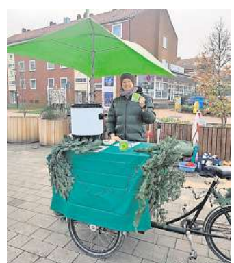
Die Hemminger Grünen sammeln auf dem Weihnachtsmarkt Sachspenden für die Ukraine und bieten alkoholfreien Punsch an.

Gesammelt werden Verbandskästen, Orthesen, Bandagen und weiteres Verbandsmaterial. Die Spenden können am 13. und 14. Dezember zwischen 14 und 18 Uhr am Stand der Grünen abgegeben werden. Das Material geht über den Ukrainischen Verein in Niedersachsen direkt in die Ukraine. Zum Aufwärmen wird am Stand zudem alkoholfreier Punsch angeboten.