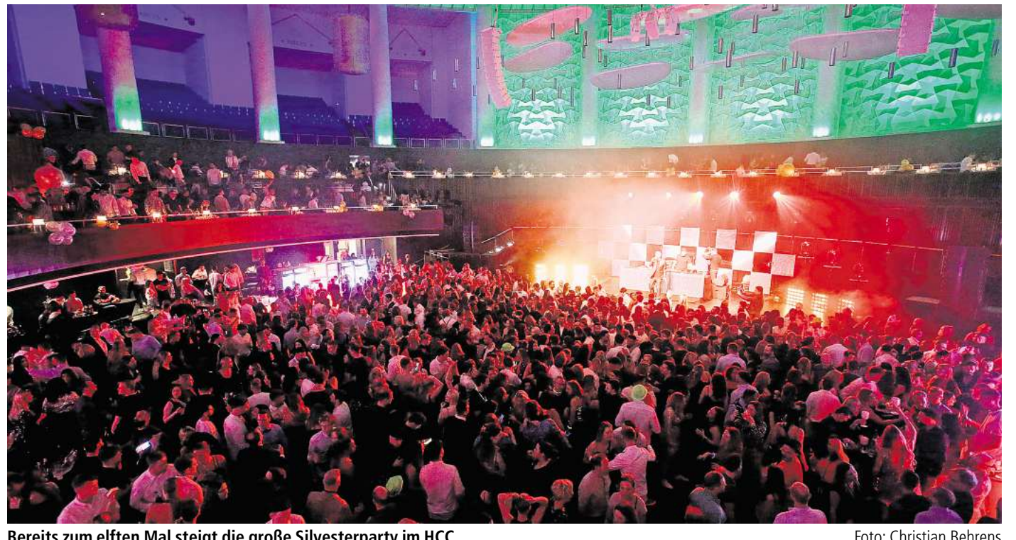
Bereits zum elften Mal steigt die große Silvesterparty im HCC.