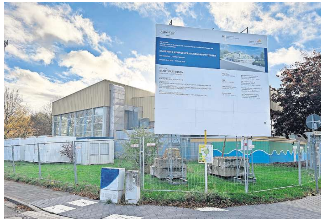
Großbaustelle: Das Pattenser Bad wird umfassend saniert.

Zu den Überraschungen während des Abrisses zählt unter anderem die Problematik beim Entfernen der Wandfliesen. Diese Arbeit gestaltet sich deutlich schwieriger als gedacht. „Die Mauer leidet, wenn man die Fliesen abschlägt“, sagt Bad-