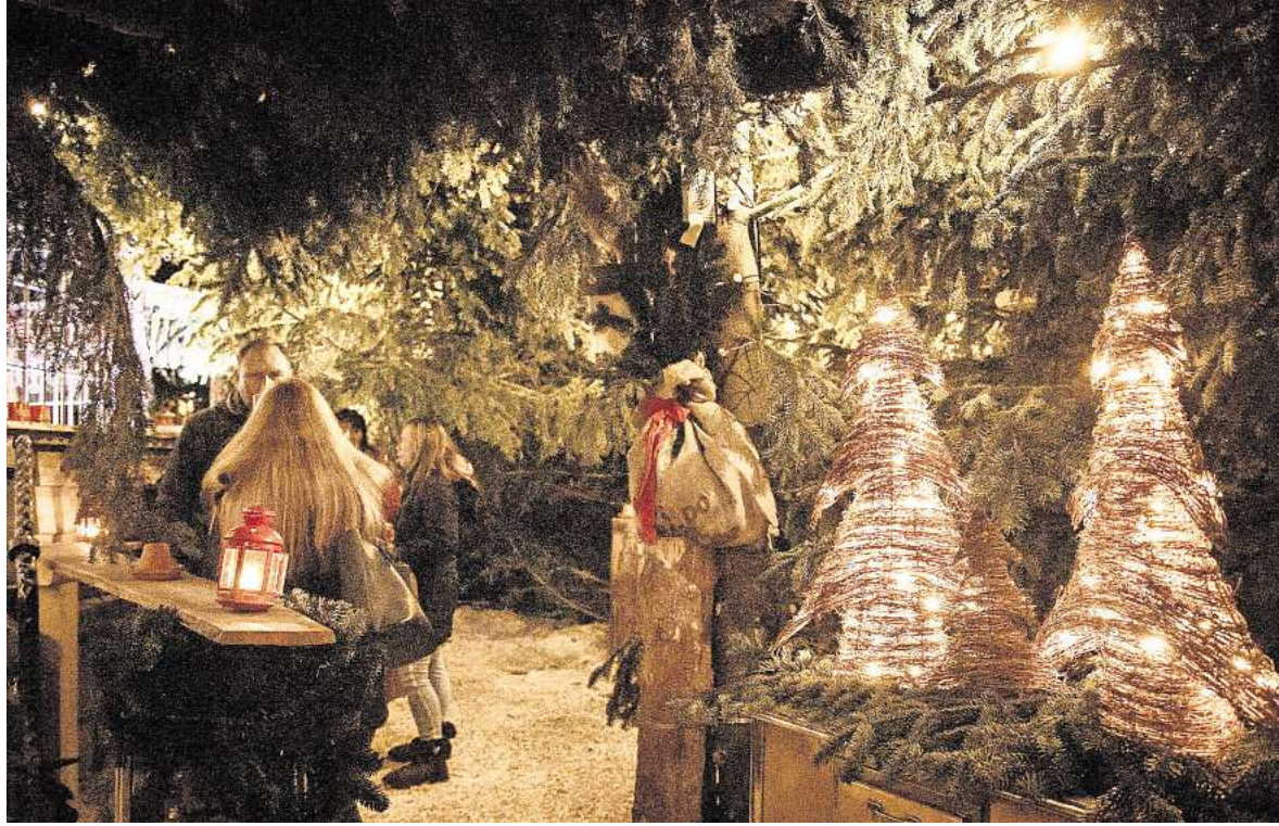
Rund 370 Tannenbäume aus regionalem Anbau und 195 m³ Hackschnitzel verwandeln die Winterwälder in ein stimmungsvolles Lichtermeer.

Von Käsespätzle über Gulasch bis zu Crêpes – die Winterwälder präsentieren sich kulinarisch vielseitiger denn je. Neu in diesem Jahr: Rosé-Glühwein und ein eigens kreierter Signature-Winterdrink „Slay me Santa“. Rund 370 Tannenbäume aus regionalem Anbau, 195 Kubikmeter Hackschnitzel und bebagte Dekorateure verwandeln