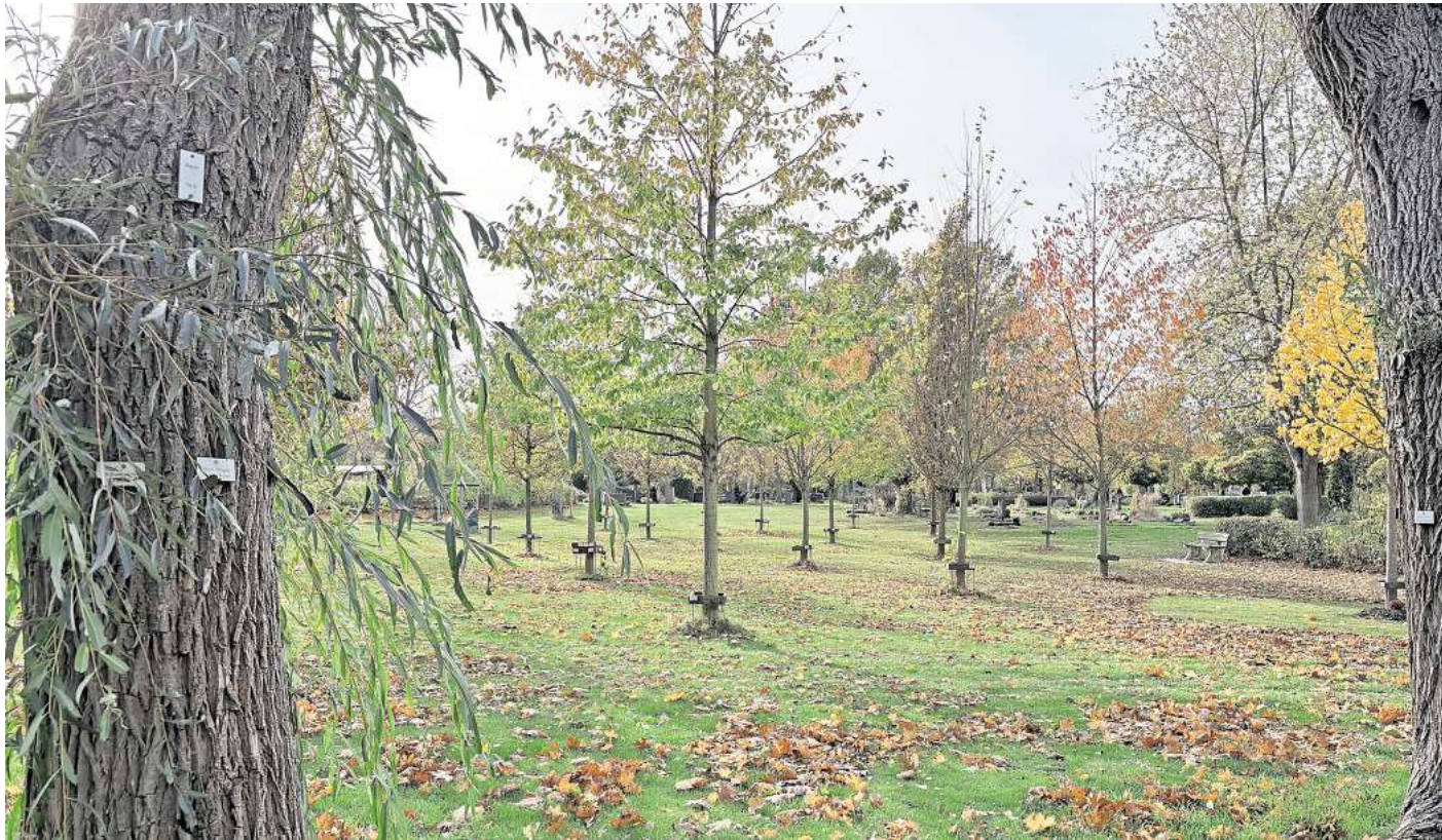
Der Friedhof Hemmingen-Westerfeld: Baumgräber werden immer beliebter.

Die Verwaltung überarbeitet das Konzept für HEMMINGENS FRIEDHÖFE