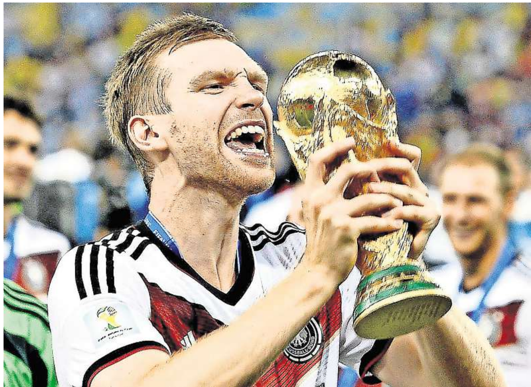
Sein größter sportlicher Triumph: Per Mertesacker mit dem Welpokal 2014 in Brasilien.

Am Dienstag, 18. November, ab 18 Uhr kommt der Ex-Nationalspieler in die Alte Druckerei nach Bemerode. Gesprächsthemen gibt es viele. Wie erlebt er die Entwicklung bei Hannover 96 unter Trainer Christian Titz? Kann er sich eine Rückkehr zu seinem Jugendclub vorstellen? Wie blickt er heute mit etwas Abstand auf die größten Momente seiner Karriere zurück. Auch mit Blick auf die Dinge, die