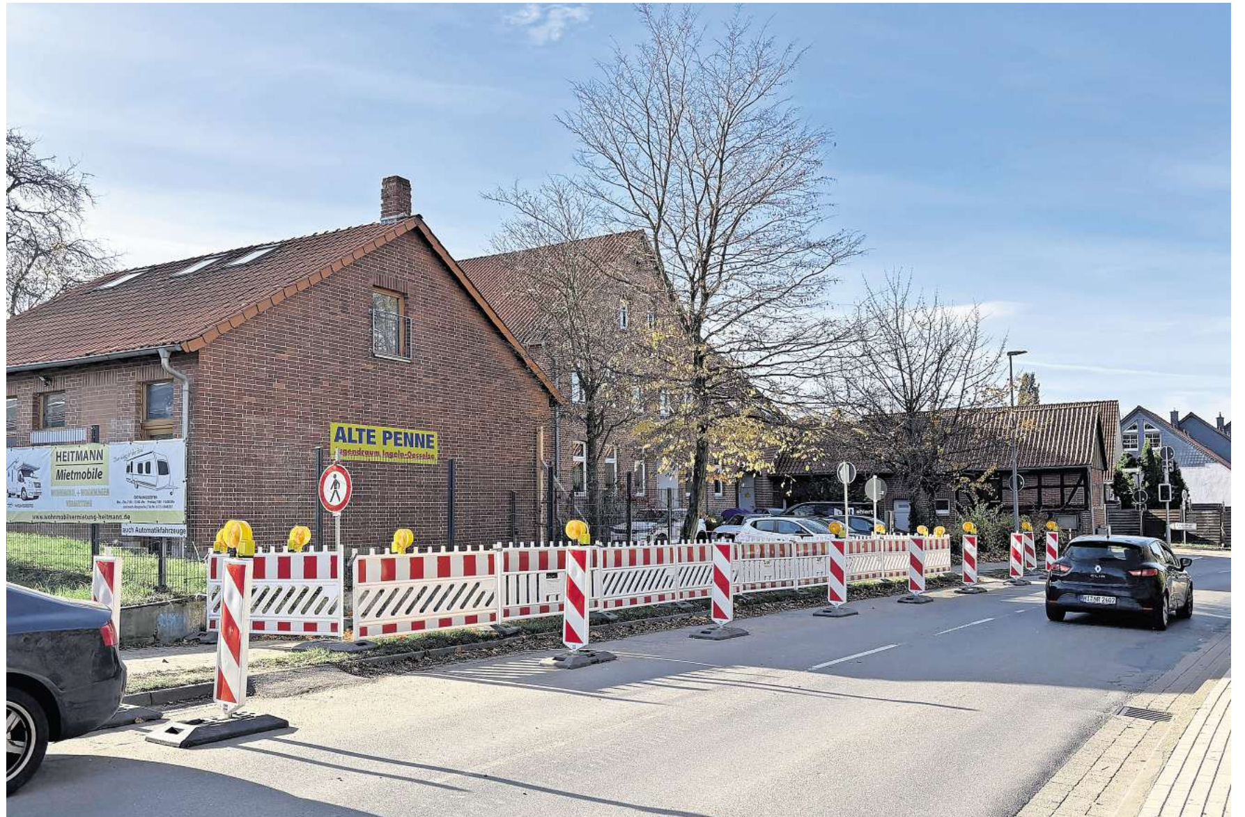
Mangelnde Standsicherheit: Der Jugendtreff Alte Penne neben der DRK-Kita in Ingeln-Oesselse wird zeitnah abgerissen.