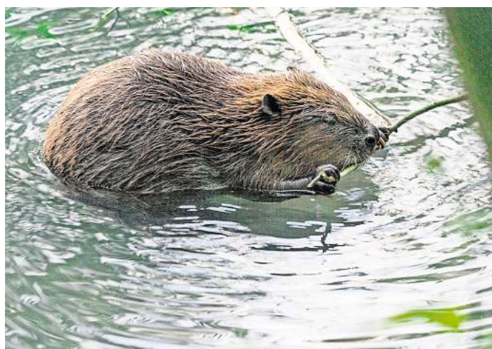
Biber (Castor fiber)

Die eigentliche Biber-Kartierung findet im Zeitraum vom 15. Januar bis 15. März 2026 statt. Über die Internetplattform des NABU Laatzen kann das zu kartierende Uferstück individuell ausgewählt werden. Damit trägt jede und jeder Engagierte dazu bei, die Lebensräume des Bibers besser zu verstehen und seinen Schutz langfristig zu sichern.