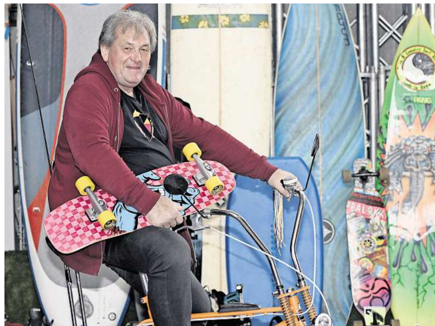
„Skater waren damals Einzelgänger, wir brauchten keinen Verein, keine Anleitung.“

magaScene: Dete, im Jahr 2000 nahm der Duden erstmalig den Begriff „Funsport“ in seinen Definitionskanon auf, mit dieser Erklärung: ein unkonventioneller Sport, bei dem das Vergnügen im Vordergrund steht. Seit wann bist Du vergnügungssüchtig? Rehbock: Seit 50 Jahren! Der Vater eines Kumpels war Amerikaner und brachte seinem Sohn aus den USA ein Skateboard mit. Das muss um 1975 gewesen sein. Das kann ich deswegen so datieren, weil 1977 das erste deutsche Skate-Magazin auf den Markt kam,