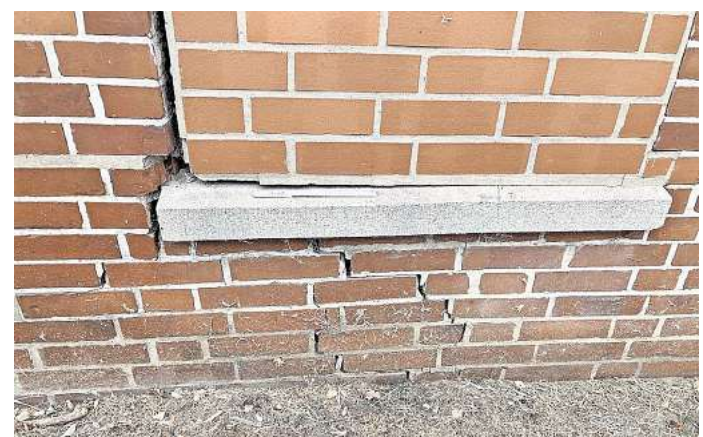
Größer werdende Gebäuderisse und Fensterfugen: Die Fotos zeigen den Zustand der Alten Penne im September.

Wegen der Alten Penne seien aktuell zwar das Außengelände sowie Parkflächen in Teilen gesperrt, erklärte DRK-Sprecherin Nadine Spangenberg: „Diese Einschränkung wirkt sich jedoch nicht wesentlich auf den pädagogischen Alltag in der Einrichtung aus“. Das Kita-Gebäude selbst ist laut Stadt nicht von Rissbildungen oder ähnlichem betroffen.