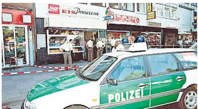
Hier fielen 1997 die tödlichen Schüsse: Das Eiscafé „Panciera“ an der Goethestraße.

Mit dieser Maßnahme habe man den Kriminellen klargemacht, dass der Staat „gewillt und in der Lage ist, sich zu wehren“, so Klosa. Doch was wurde aus den Tätern? 2001 hatte sich einer von ihnen der Polizei ge-