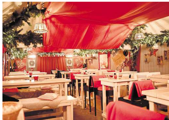
Rustikal, herzlich und wetterfest mit vielen überdachten oder beheizten Bereichen.

die Winterwälder in ein stimmungsvolles Lichtermeer. Kurz vor Weihnachten können Gäste viele der Tannen gegen eine Spende erwerben – der Erlös geht an lokale Hilfsprojekte. Die Hackschnitzel werden anschließend als Heizmaterial wiederverwendet – nachhaltig, regional und sinnvoll.