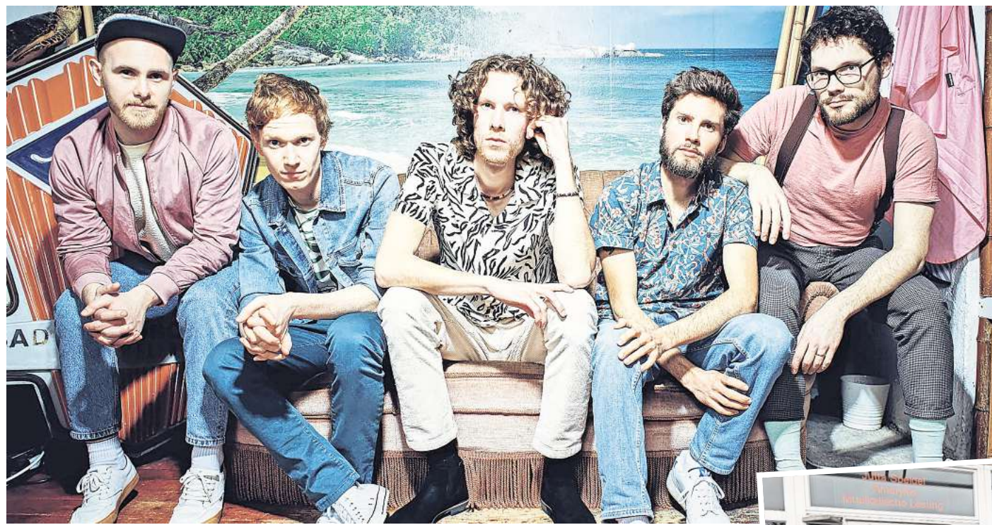
Die A-cappella-Band Anders aus Freiburg kommt 2026 nach Hemmingen.

Mit Unterstützung der Bürgerstiftung Hemmingen hat der bauhof vor kurzem ein neues Leuchtdisplay gekauft, das je-