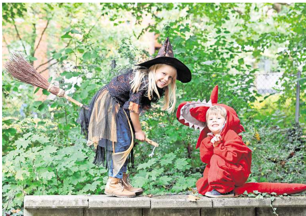
Liegen im Trend: Kostüme für kleine Hexen mit Zauberhut und Besen.

Wie bei den Kindern sind Hexen, Zauberer und andere magische Kostüme für Erwachsene angesagt. Aktuell wird die Halloween-Szene besonders vom Film „Wicked“ mit Cynthia