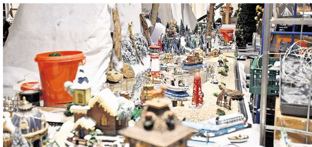
Noch viel zu tun bis zur Eröffnung: Vieles muss Micky noch aufbauen.

Wer einen Vorgeschmack auf Mickys Miniaturwelten bekommen will, kann am Donnerstag, 30. Oktober, die Halloween-Party in dem Ladengeschäft besuchen. Für Kinder beginnt diese um 15 Uhr, für Erwachsene um 19 Uhr. Freiwillige, die Micky helfen wollen, erreichen ihn unter (01575) 7932668.