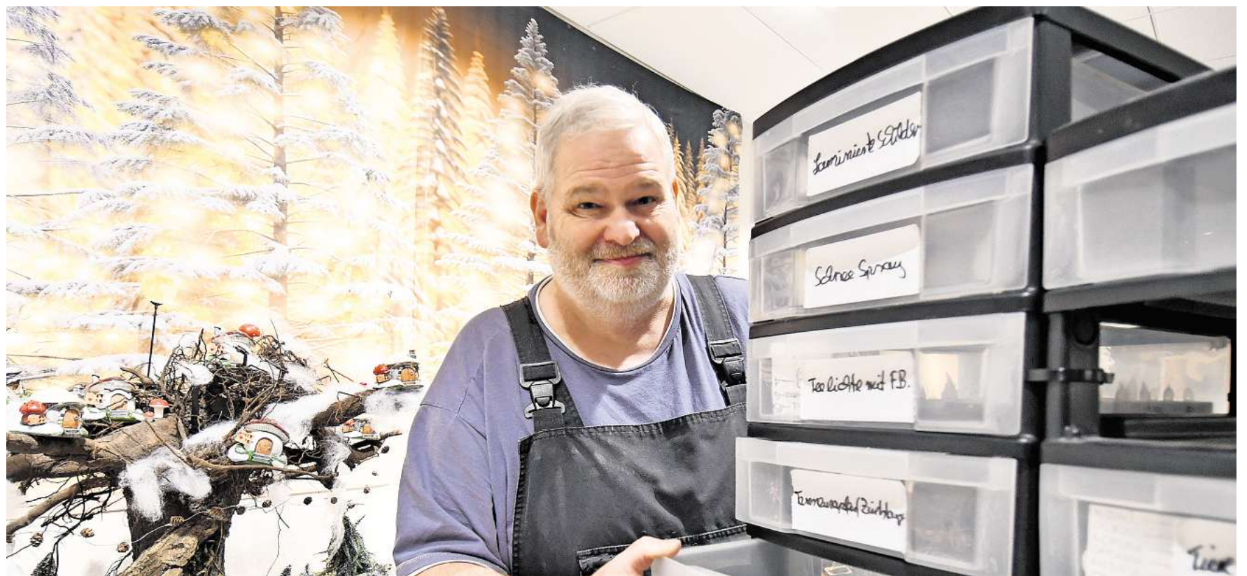
Gut sortiert: In rund 160 Schubladen hat Micky kleinere Einzelteile wie Zäune und Tiere eingeordnet.