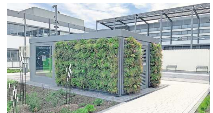
Begrünt: So könnte die geplante Netzersatzanlage auf dem Parkplatz am Pattenser Rathaus in Zukunft aussehen.