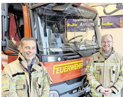
Neue Kommandospitze bei der Feuerwehr in Hemmingen.