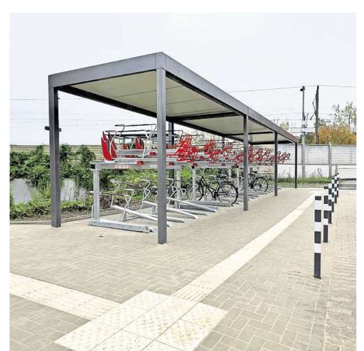
Platz für 84 Fahrräder: Die drei doppelstöckigen Anlagen an der Koldinger Straße sowie der Ostseite des Rethener Bahnhofs sind ab sofort zu nutzen.