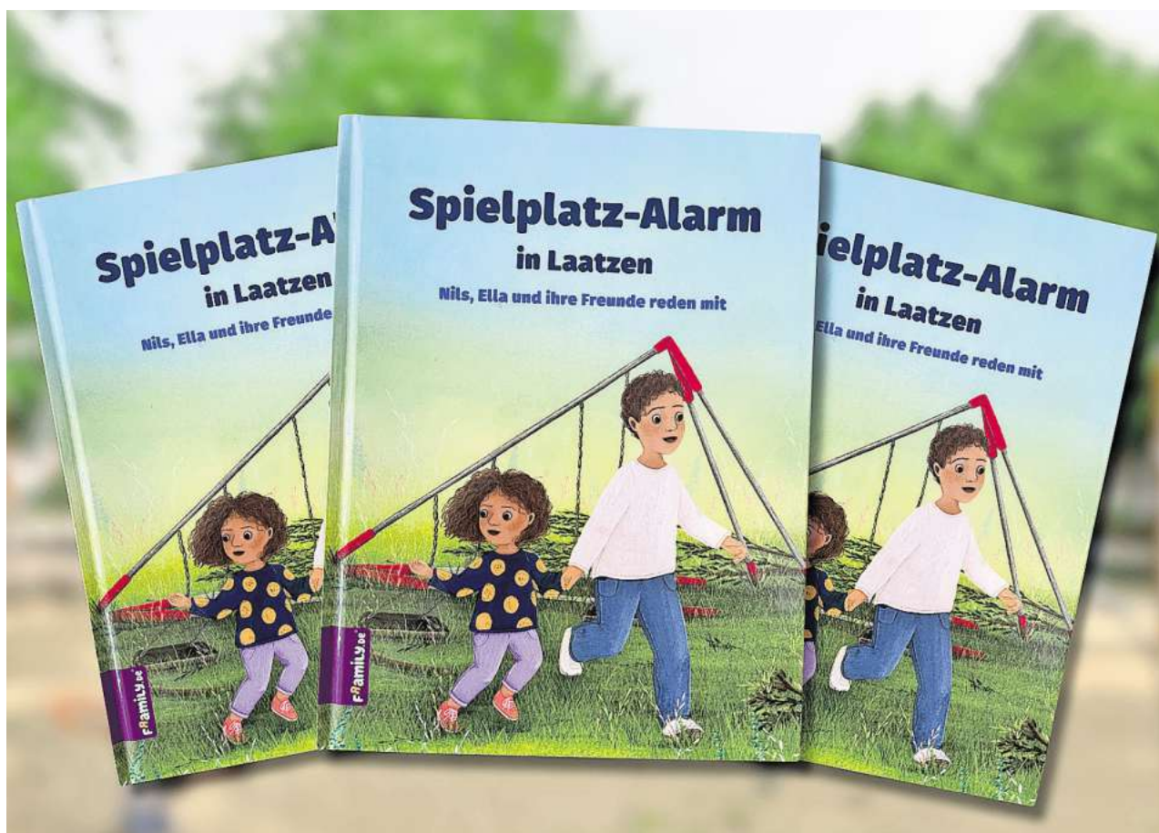
Kommunalpolitik, kindgerecht erklärt.