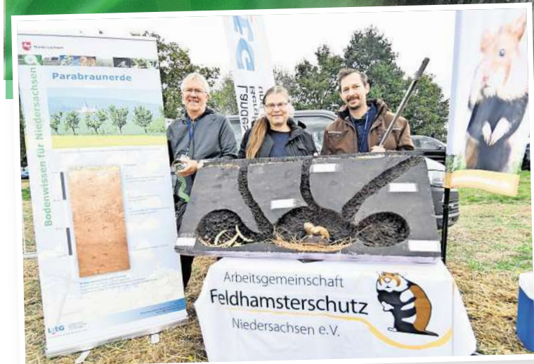
Sind in ganz Deutschland vom Aussterben bedroht: Feldhamster.

Geografen erklären, warum sich die streng geschützten FELDHAMSTER auf den Feldern in Pattensen so wohlfühlen