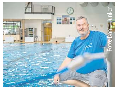
Wasser ist sein Metier. Seite 4