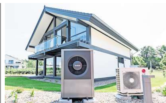
Klimafreundlich: Wärmepumpen gelten als saubere Alternative für die Beheizung von Häusern.

Viele weitere, spannende Neuigkeiten aus der lokalen Kulturszene finden Sie in der aktuellen Ausgabe unseres Partnermediums magaScene , monatlich frisch gedruckt und kostenlos an über 500 Auslegestellen in Hannover oder online auf www.magaScene.de inklusive Download-Möglichkeit.