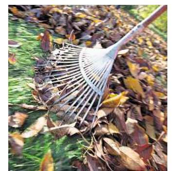
Herbstlaub sollte man regelmäßig entfernen.

Das anfallende Herbstlaub kann mit dem normalen Grünabfall in der Biotonne, auf dem eigenen Kompost, den Wertstoffhöfen von aha oder auf dem Kompostplatz der Stadt Laatzens, Hildesheimer Straße 305 in Rethen entsorgt werden. Dieser ist montags von 7.15 bis 12 Uhr und vom 1. April bis 30. November donnerstags von 13 bis 16 Uhr geöffnet.