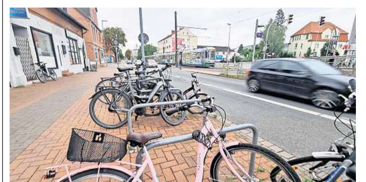
Zu wenig Platz, um Fahrräder anzuschließen: Die Stadt will weitere Bügel aufstellen - auch an der Stadtbahn-Haltestelle Eichstraße in Alt-Laatzen.

Bis dahin können nur noch Restbestände installiert werden. Derzeit hat der Betriebshof nach eigenen Angaben 13 Anlehnbügel auf Lager. Sie sollen zeitnah an der Grundschule Rethen aufgestellt werden und das dortige Angebot ergänzen, kündigt die Stadt an.