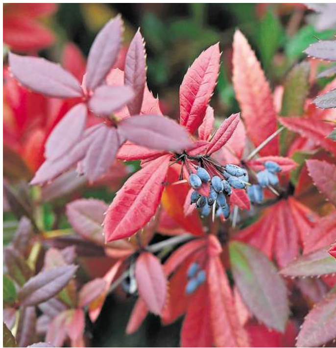
Die Berberitze: Im Herbst begeistert sie mit farbenfrohem Laub und bietet Vögeln Schutz sowie Nistmöglichkeiten. Eine Heckenpflanze, die erst bei tieferen Temperaturen das Laub abwirft.

Laut Nabu Berlin muss man seinen Kirschlorbeer jetzt aber nicht gleich ausgraben – auch wenn es Wildsträucher gibt,