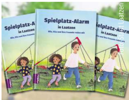
Kommunalpolitik, kindgerecht erklärt. Seite 3