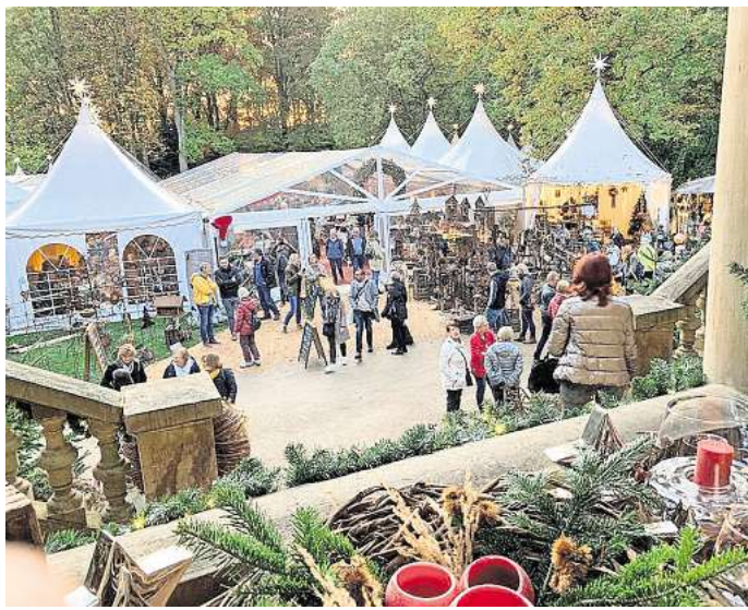
Die WinterTräume in Eldingen sind ein Fest für alle Sinne.