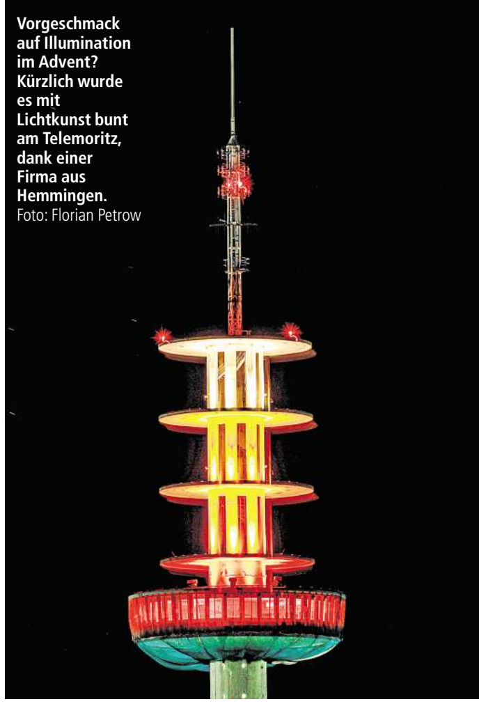
Vorgesmack auf Illumination im Advent? Kürzlich wurde es mit Lichtkunst bunt am Telemoritz, dank einer Firma aus Hemmingen.

Die Stadt hat das Bauwerk daraufhin flugs unter Denkmalschutz gestellt. Gekauft hat ihn dann der Unternehmer Oliver Blume, der am Turmschaft etwa 150 Miniapartments bauen und Teile der Plattformen öffentlich zugänglich machen will. Derzeit laufen aber noch die Planungsabsprachen mit der Stadt.