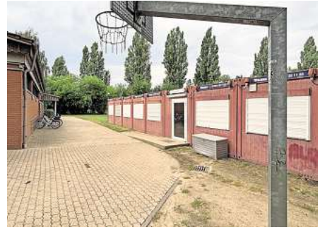
Wird ersetzt: Das mobile Klassenzimmer der Grundschule Grasdorf soll im Sommer 2026 durch eine um die Hälfte längere Containeranlage für dann zwei Klassen ersetzt werden.

gebaut oder die Schule neu errichtet wird, ist zwar weiter offen, die für die Entscheidung nötige Machbarkeitsstudie jedoch laut Fachbereichsleiter Ali Kara in der finalen Phase. „Wir gehen davon aus, dass wir sie in der Novembersitzung vorstellen, um die Variante beschließen zu lassen“, sagte er jüngst im Ortsrat. Das Gremium tagt am Dienstag, 4. November, 18 Uhr im Rathauszimmer 503 (Marktplatz 13).