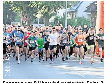
Sonntag um 9 Uhr wird gestartet. Seite 3