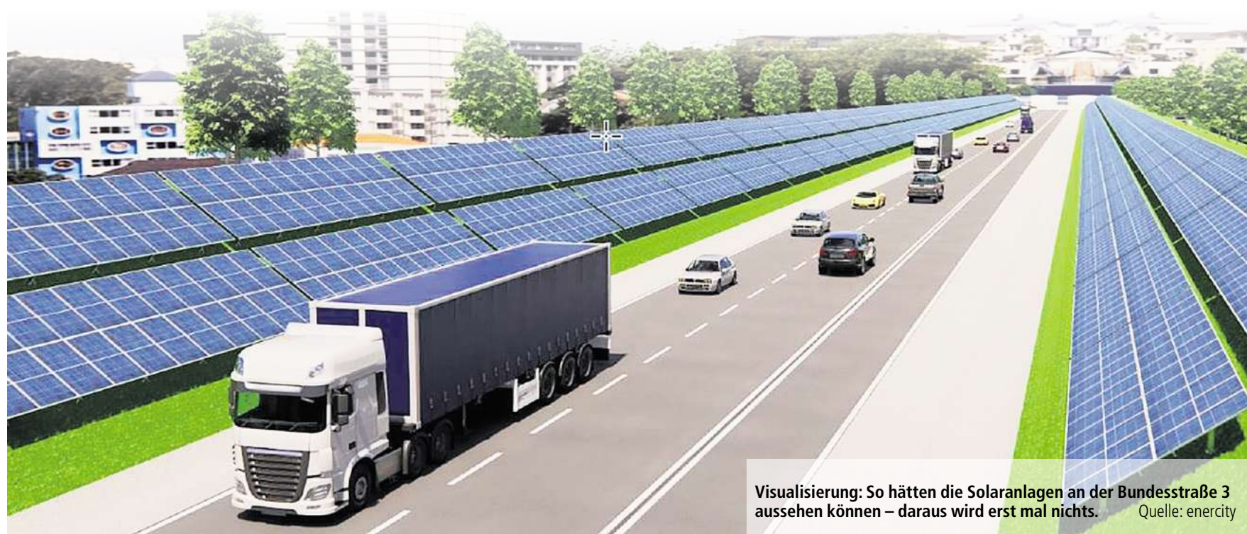
Visualisierung: So hätten die Solaranlagen an der Bundesstraße 3 aussehen können – daraus wird erst mal nichts.

Das an der B3 Hemmingen geplante Projekt wird nicht verwirklicht.