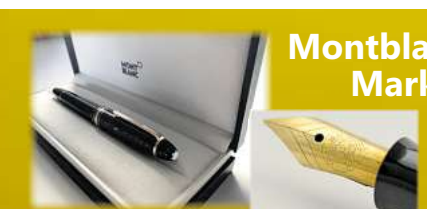
Montblanc & Markenstifte