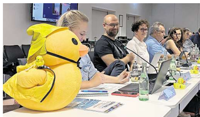
Umstrittenes Maskottchen: „Enti“ groß und klein auf den Tischen der SPD-Fraktion im Hemminger Rat.