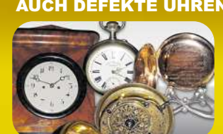
Taschenuhr ( Gold & Silber )