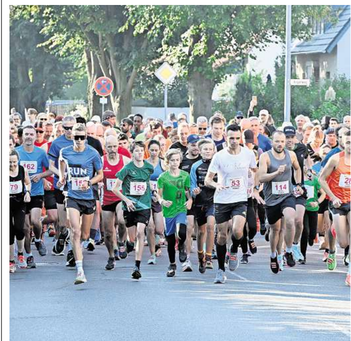
Der Rübenlauf beginnt am Sonntag um 9 Uhr.

Wer den Wettkampf auf dem Sportplatz in Hiddestorf verfolgen möchte: Dort gibt es Gegrilltes, Kuchen und Waffeln sowie Getränke.