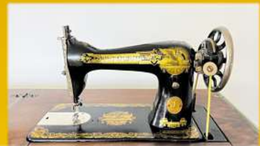
Für Nähmaschinen bis zu 1.500,-