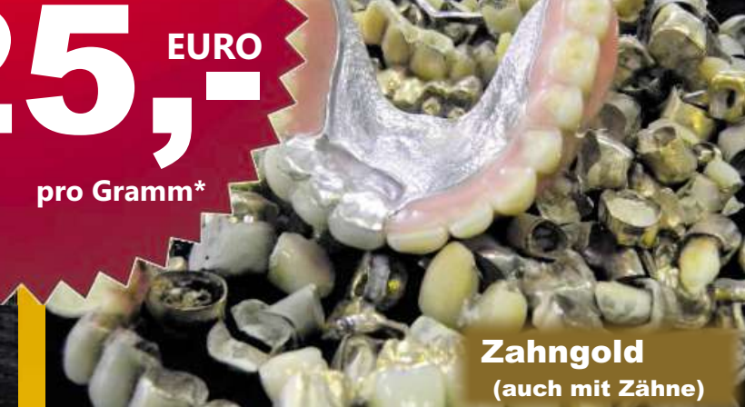
Zahngold (auch mit Zähne)