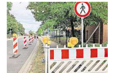
Sperrung: Ein Behelfsfußweg ist auf derselben Straßenseite direkt neben dem bestehenden Gehweg angelegt.

Die Stadt Laatzen erarbeitet derzeit ein Konzept für den mittelfristigen Umgang mit dem Gebäude. Dieses Konzept legt die Verwaltung den politischen Gremien zur Beratung vor und informiert anschließend über die nächsten Schritte.