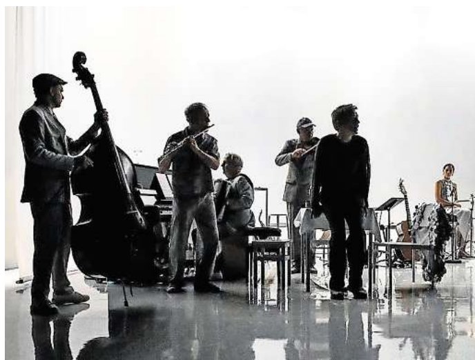
Das Schauspiel Hannover zeigt „Mit anderen Augen“.