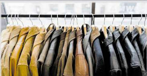
Für Lederjacken bis zu 3.500,-

Bisam • Persianer • Fuchspelze aller Art • Zobel • Nerze • Nutria • Chincilla