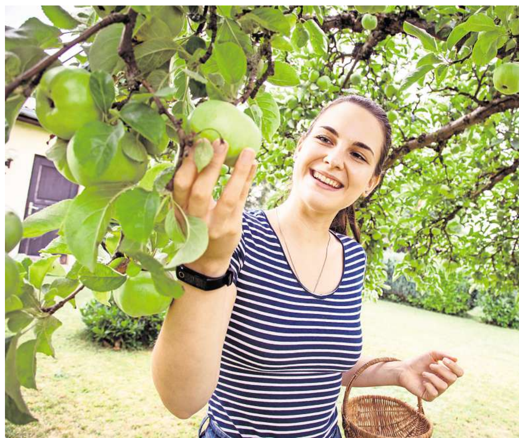
Weder pralle Sonne noch Regen: Das Wetter spielt bei der Ernte von Äpfeln eine wichtige Rolle.

Anhand der Färbung der Schale oder der Kerne lässt sich nur bedingt ablesen, ob Äpfel wirklich reif sind. Stattdessen kann man es mit der sogenannten Kipp-Probe herausfinden. Und so funktioniert es: den Apfel am Zweig um bis zu 90 Grad nach oben biegen. Wenn sich die Frucht mitsamt Stiel einfach vom Zweig löst, ist sie reif und darf den Baum verlassen. Bleibt