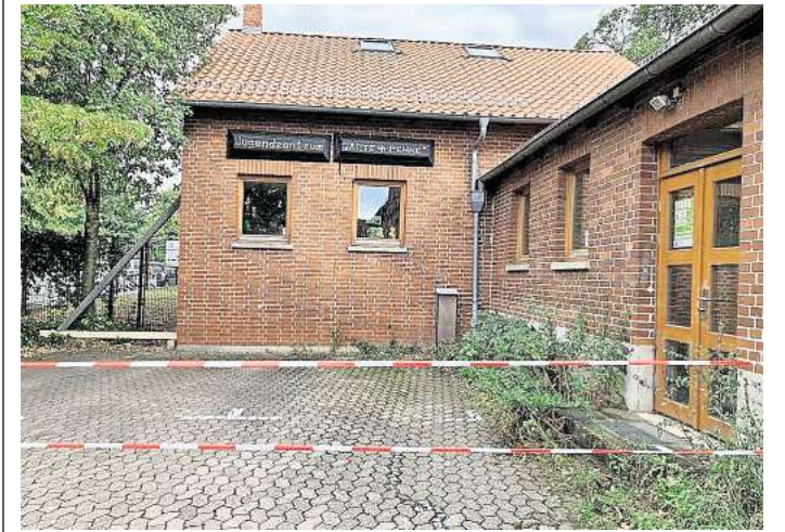
Seit Sommer 2022 steht die „Alte Penne“ leer.