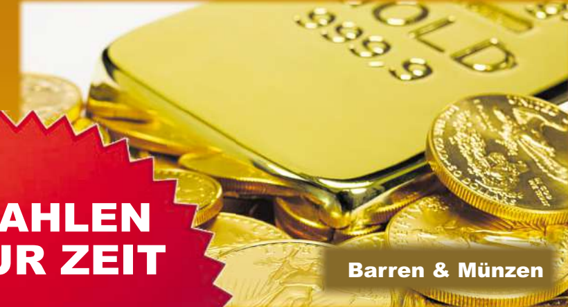
Barren & Münzen