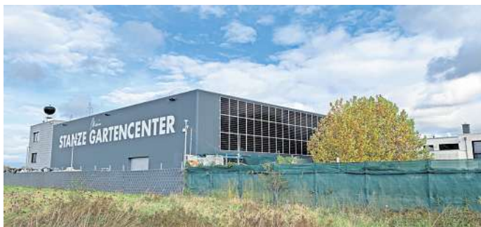
Das Stanze Gartencenter.

Die Angaben entsprechen dem Stand bei Redaktionsschluss.