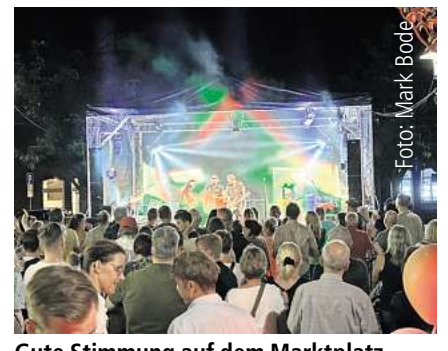
Gute Stimmung auf dem Marktplatz. Seite 3