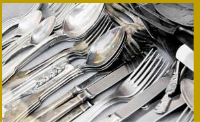
Silberbesteck bis zu 700,- Kg