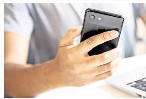
Besser auf die Wortwahl achten: Bei Auffälligkeiten im Zahlungsverkehr sind Banken verpflichtet, diese zu melden.

„Gibt es hier Auffälligkeiten, die einen Geldwäscheverdacht begründen, sind die Banken und Sparkassen verpflichtet, solch einen Verdacht an die Financial Intelligence Unit (FIU) beim Zollkriminalamt zu melden“, so Altmann. Bei Hinweisen auf sonstige Straftaten können die Institutionen auch Anzeige bei den Strafverfolgungsbehörden erstatten.