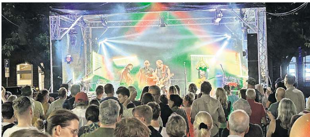
Gute Stimmung auf dem Marktplatz: Die Coverband Rockkantine begeistert Menschen in Pattensens Altstadt.

Der Musikverein Pattensen lädt am Sonnabend, 27. September, zum Oktoberfest in den Ratskeller in Pattensen-Mitte ein. Einlass ist ab 17.30 Uhr, Beginn des Programms um 18 Uhr. Von etwa 18.30 bis 20.30 Uhr spielen die Musikerinnen und Musiker des Vereins. Ab 21 Uhr sorgt ein DJ für die Musik und Partystimmung. Eintrittskarten gibt es direkt im Ratskeller zum Preis von 8 Euro pro Person. Dort können Interessierte auch Essen vorbe-