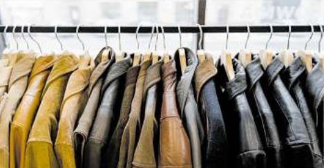
Für Lederjacken bis zu 3.500,-

Bisam • Persianer • Fuchspelze aller Art • Zobel • Nerze • Nutria • Chincilla