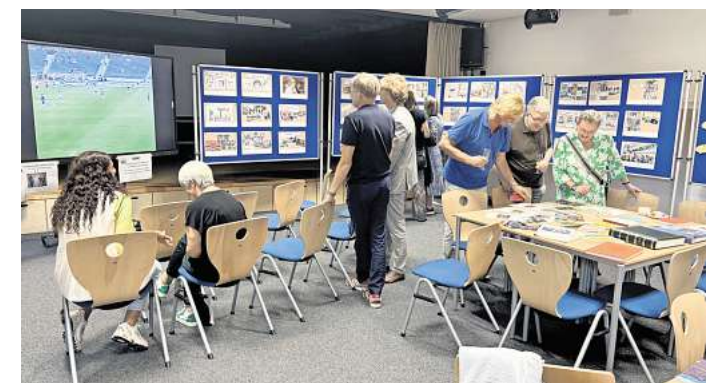
Zeitreise: Im Henry-Korman-Haus hatte die Albert-Einstein-Schule eine Fotowand und Videomaterial zur deutschen Geschichte vorbereitet sowie Jahrgangsbücher ausgelegt.