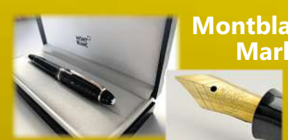
Montblanc & Markenstifte