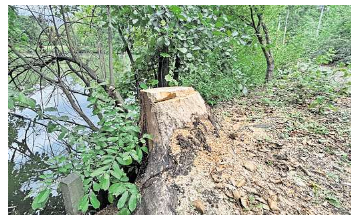
Biss- und Sägespuren: Die Weide am Südostufer des Stückenfeldteiches in Laatzen-Mitte wurde kürzlich von der Stadt gefällt.

Für die Stadt sind die Drahtmaßnahmen vorerst erledigt. „Am Stückenfeldteich wurden bereits alle Bäume geschützt, die erhalten bleiben sollen“, so Sprecherin Pilz weiter. Weitere Bäume würden an dieser Stelle aus gutem Grund nicht mit Draht geschützt: „Um den Biber nicht durch Entzug seiner Nahrung zu vergrämen.“