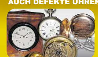
Taschenuhr (Gold & Silber)