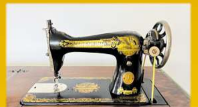
Für Nähmaschinen bis zu 1.500,-