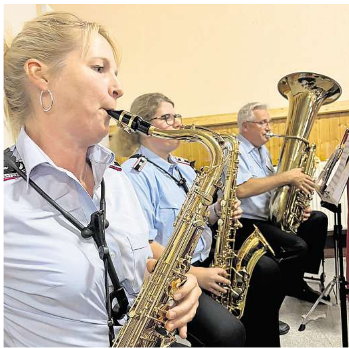
Die Proben finden im Feuerwehrhaus Gleidingen-Rethen statt.

Darüber hinaus steht der Initiativkreis für Fragen zur Verfügung. Eine Anmeldung ist nicht erforderlich.