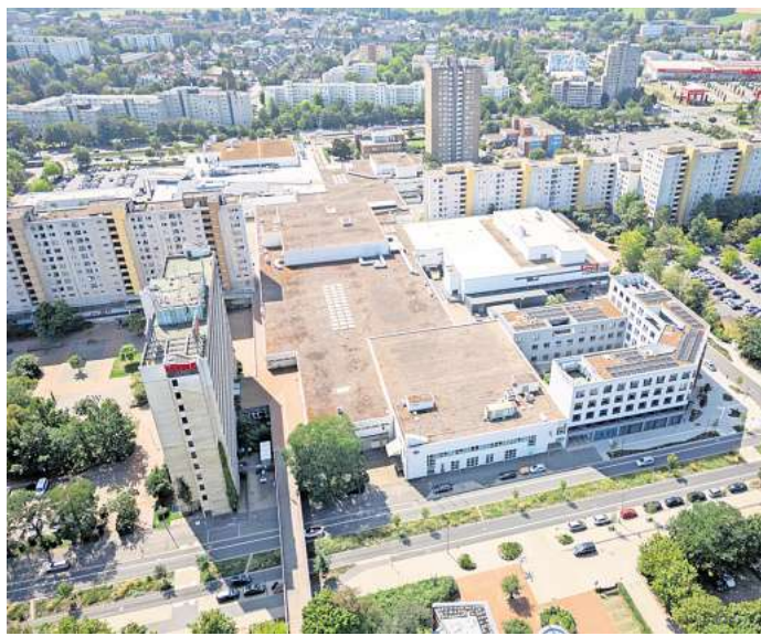
Ist größer als die Ernst-August-Galerie in Hannover: das Leine-Center in Laatzen.

LAATZEN. Beim Verkauf des Leine-Centers gab es im Hintergrund Überlegungen, ob die Stadt Laatzen selbst ein Vorkaufsrecht geltend machen sollte: Der dem Vernehmen nach geringe Preis, zu dem der Investor das Einkaufszentrum erworben haben soll, hatte für stadterne Gespräche Anlass gegeben, wie aus Kreisen von Politik und Verwaltung zu hören ist.