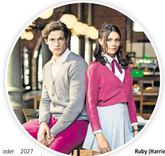
Ruby (Harriet Herbig-Matten) und James (Damian Hardung) sind die Hauptfiguren.

Das passt zum Start der zweiten Staffel von „Maxton Hall“. Denn während Staffel drei, die jetzt gedreht wird, erst 2026