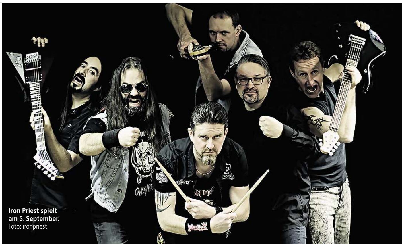
Iron Priest spielt am 5. September.

Außerdem gibt es natürlich ein gut gezapftes Bier von Nordstadt braut!, lecker Essen vom foodtruck.klub, kalte Drinks bei Onkel Olli, und auch Hannover 96 ist mit einem Glücksrad vor Ort. Mit dem Steineland könnt Ihr in die kreative Welt der Lego-Steine eintauchen. Klingt nach einem tollen Event? Ist es! Also nix wie hin da.