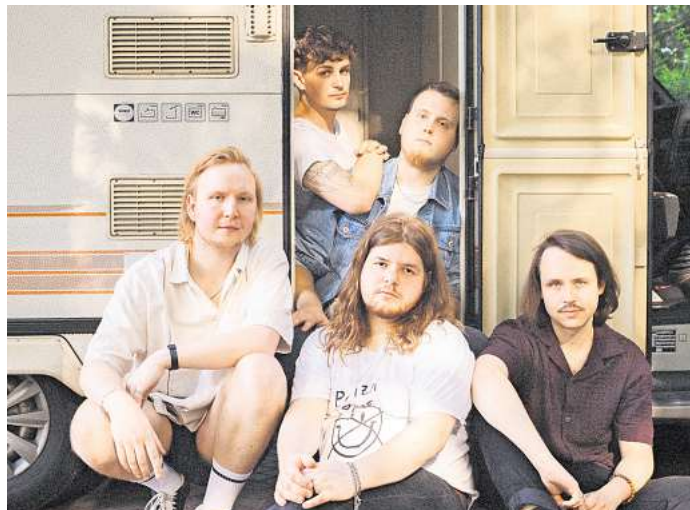
GoDotS tritt am 6. September auf.

Viele weitere, spannende Neuigkeiten aus der lokalen Kulturszene finden Sie in der aktuellen Ausgabe unseres Partnermediums magaScene, monatlich frisch gedruckt und kostenlos an über 500 Auslegestellen in Hannover oder online auf www.magaScene.de inklusive Download-Möglichkeit.