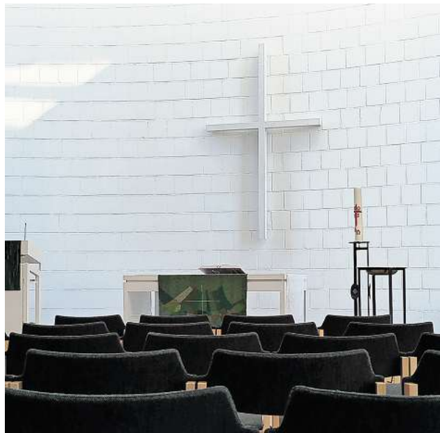
St. Petrus Kirche in Springe