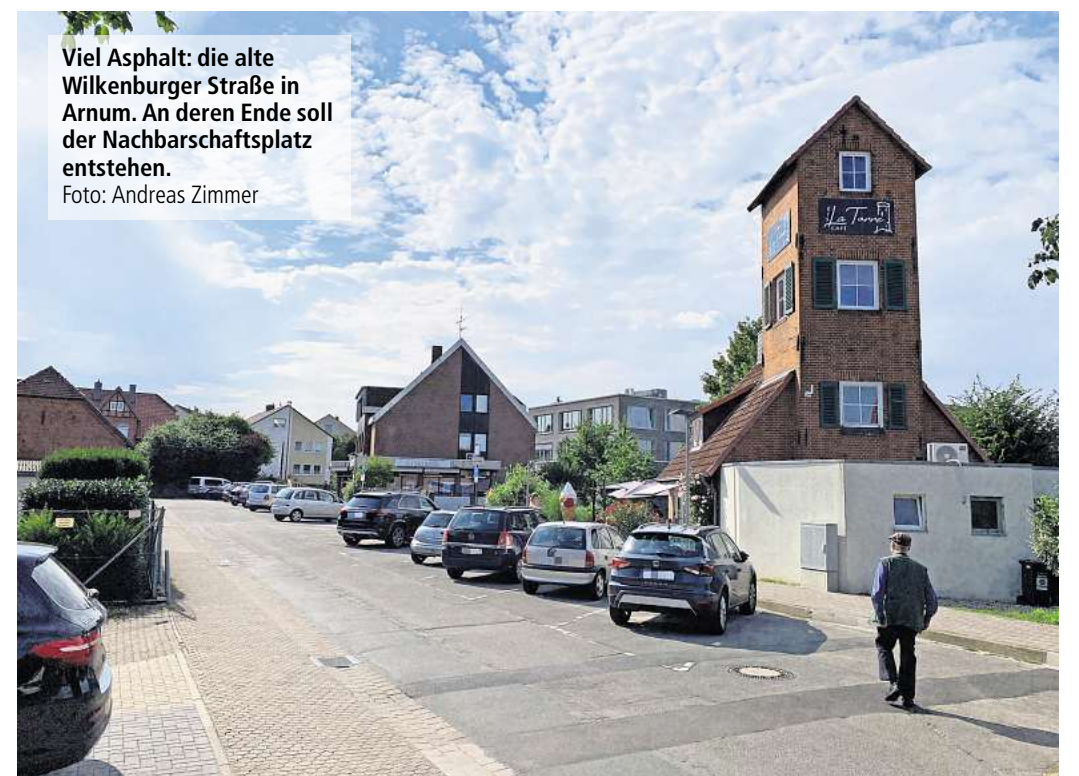
Viel Asphalt: die alte Wilkenburger Straße in Arnum. An deren Ende soll der Nachbarschaftsplatz entstehen.