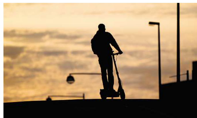
Nicht mehr möglich: Ingeln-Oesselse und Gleidingen sind jetzt Sperrgebiet für E-Scooter.