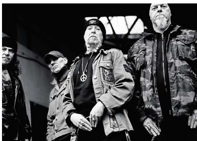
Schrei! spielt am 6. September.