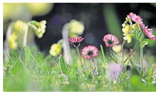
Im Kräuterrasen sind Wildkräuter wie etwa Gänseblümchen oder Schlüsselblumen enthalten.

Ein Kräuterrasen ist die ideale Lösung für alle, die genug vom getrimmten Grün haben – ihn anzulegen, ist einfacher als gedacht