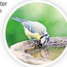
Die Blaumeise trinkt Wasser aus der Vogeltränke.

Bieten Sie ihnen daher ausschließlich frisches Wasser an! Eine Wassertiefe von bis zu fünf Zentimetern, ist für eine Vogeltränke ideal.