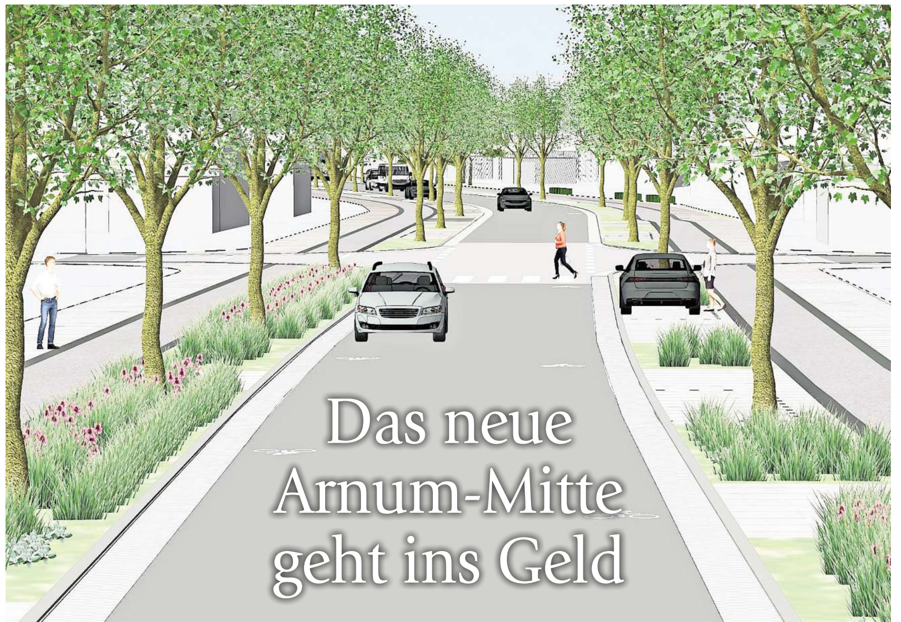
Simulation: So können sich die Planer die Göttinger Straße in Arnum vorstellen.

Interessierte, die beim Musikzug mitmachen möchten, sind willkommen. Immer donnerstag ab 19.30 Uhr treffen sich die Männer und Frauen im Feuerwehrhaus Gleidingen-Rethen, Hildesheimer Straße 373 zu ihren Proben.