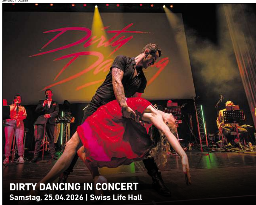
DIRTY DANCING IN CONCERT Samstag, 25.04.2026 | Swiss Life Hall

Ihr persönlicher Ticketservice der HAZ & NP