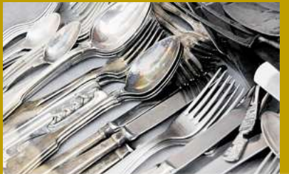
Silberbesteck bis zu 700,- Kg