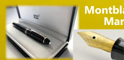
Montblanc & Markenstifte