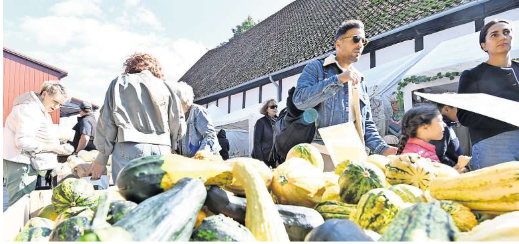
Großer Andrang: Tausende Besucher kamen im vergangenen Jahr zum Kürbisfest nach Wilkenburg.