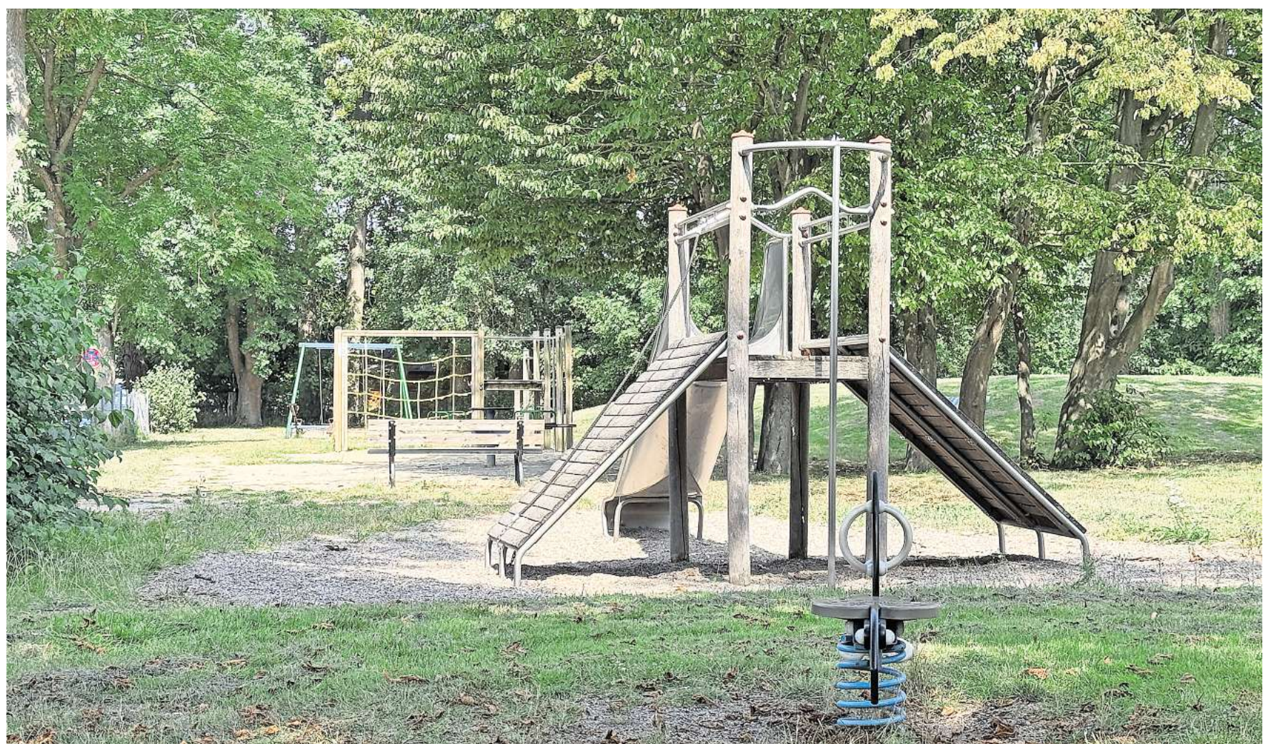
Die Stadt Laatzens will den Spielplatz am Steinbrink barrierearm umgestalten. Geplant ist ein barrierefreier Zugang, zudem soll ein Barfußpfad eingerichtet werden, der auch mit dem Rollstuhl befahrbar ist. Zusätzlich ist ein Spielgerät geplant, das auch von Kindern mit körperlichen Einschränkungen genutzt werden kann - beispielsweise ein rollstuhlgerechtes Karussell.