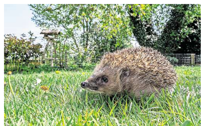
Weil sie sich bei Gefahr einrollen und nicht flüchten, sind häufig Igel von Verletzungen betroffen.

Ein vergleichbarer inklusiver Spielplatz existiert in Laatzens bislang nicht. In anderen Kommunen wurden ähnliche Konzepte aber bereits umgesetzt. Vor zwei Jahren hat der SC Hemmingen-Westerfeld auf seinem