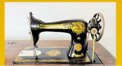
Für Nähmaschinen bis zu 1.500,-