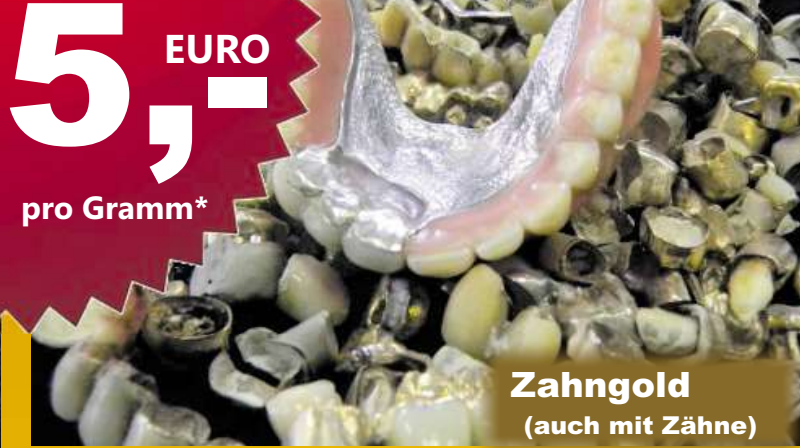
Zahngold (auch mit Zähne)