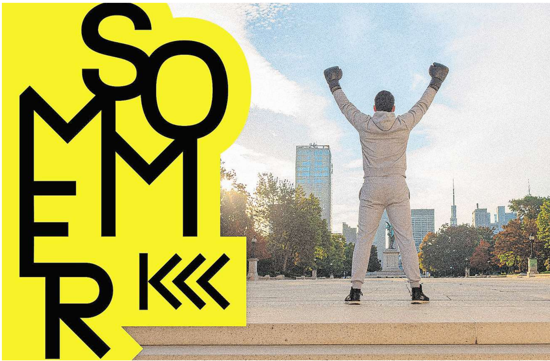
Am 2. September wird der legendäre Boxerfilm „Rocky“ gezeigt.

► Unter dem Titel „VORSPANN“ hat die VereinteKulturHannover ein abwechslungsreiches Rahmenprogramm vorbereitet, das eine Stunde lang die Vielfalt und Kreativität der hannoverschen Künstlerinnen und Künstler in den Mittelpunkt stellt. Mit spannenden Performances, Musik, Tanz und mehr macht „VORSPANN“ immer eine Stunde vor dem Open-Air-Kino Kulturschaffende und Kollektive aus verschiedenen Sparten und Vierteln der Stadt sichtbar und lädt alle ein, die kreative Energie Hannovers zu entdecken.