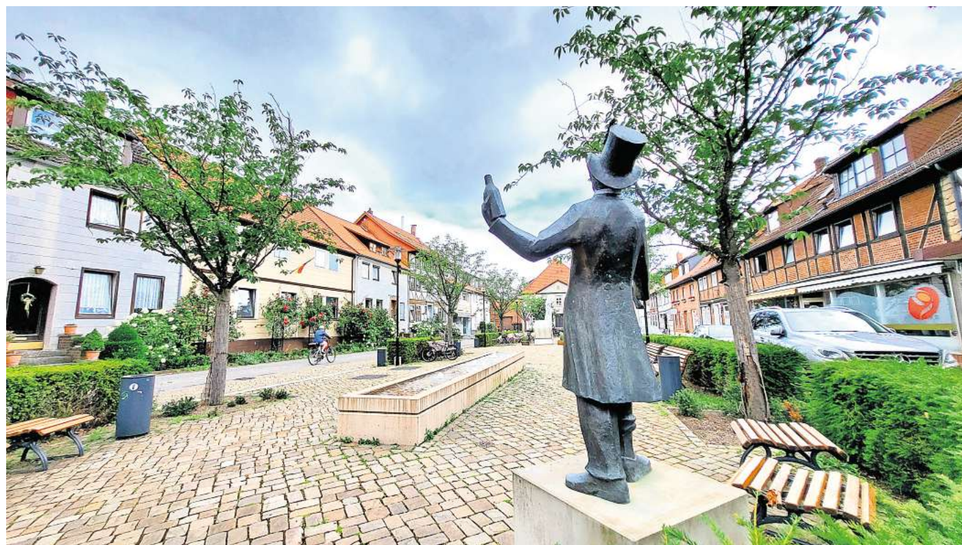
Der Marktplatz in Pattensen sorgt nicht für Abkühlung.

Die verwendeten Versiegelungsmaterialien speichern die von der Sonne aufgenommene Wärme und geben diese erst verzögert in der Nacht wieder ab.