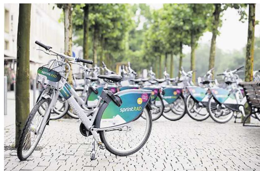
In Hannover betreibt das Unternehmen Donkey Republic im Auftrag der Üstra das Mietrad-System mit dem Namen „Sprintrad“.

Ausflügler seien in der Regel mit eigenen Fahrrädern unterwegs. Eine Möglichkeit, sich in Pattensen-Mitte ein Rad zu leihen, gibt es. Allerdings handelt es sich dabei um ein Lastenrad. Dieses ist am Rathaus angeschossen und kostenfrei nutzbar, nachdem man sich per App registriert und ein Zeitfenster reserviert hat.