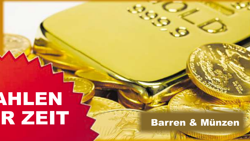
Barren & Münzen