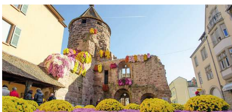
Chrysanthema in Lahr

Chrysanthema im Schwarzwald 5 Tage ✓ Fahrt im Luxusreisebus ✓ 4 x Ü/HP im Hotel Ochsen in Kehl/Kork im DZ ✓ Schwarzwaldrundfahrt ✓ Stadtführung Straßburg ✓ Besuch der Chrysanthema in Lahr ✓ durchgehende Reisebegleitung