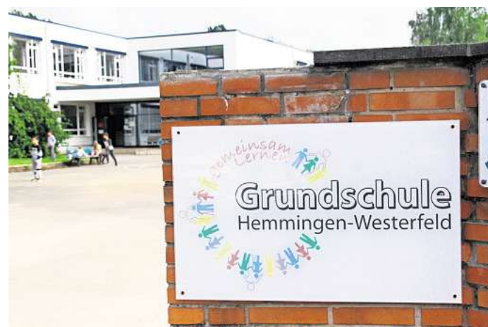
Grundschule Hemmingen-Westerfeld: Der Neubau der Mensa beginnt im Februar.

Aktuell sollen genug Kapazitäten vorhanden sein, um alle Kinder und Jugendlichen unterzubringen. Der zurzeit noch laufende Neubau mit drei Stockwerken wird voraussichtlich im Sommer 2026 eröffnet. Wegen unterschiedlicher Störungen im Bauablauf verzögert sich die geplante Eröffnung um fast ein Jahr. Mit mehr als 25 Millionen Euro ist der Neubau das größte Bauprojekt in der Geschichte der Stadt. Für den Übergang hatte die Stadt bereits 2021 sechs Container auf dem Gelände aufgestellt, in denen sechs Klassenräume untergebracht sind.