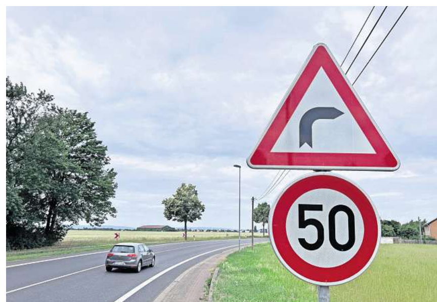
Zwei Schilder zusammen: Autofahrerinnen und Autofahrer zwischen Koldingen und Pattensen scheinen nicht genau zu wissen, was dieses Schilder-Duo an der B443 tatsächlich bedeutet.

Am Koldinger Ortsausgang der B443 gilt Tempo 50 – aber nur für einen Kurvenbereich. Das ist nicht allen Autofahrenden bekannt.