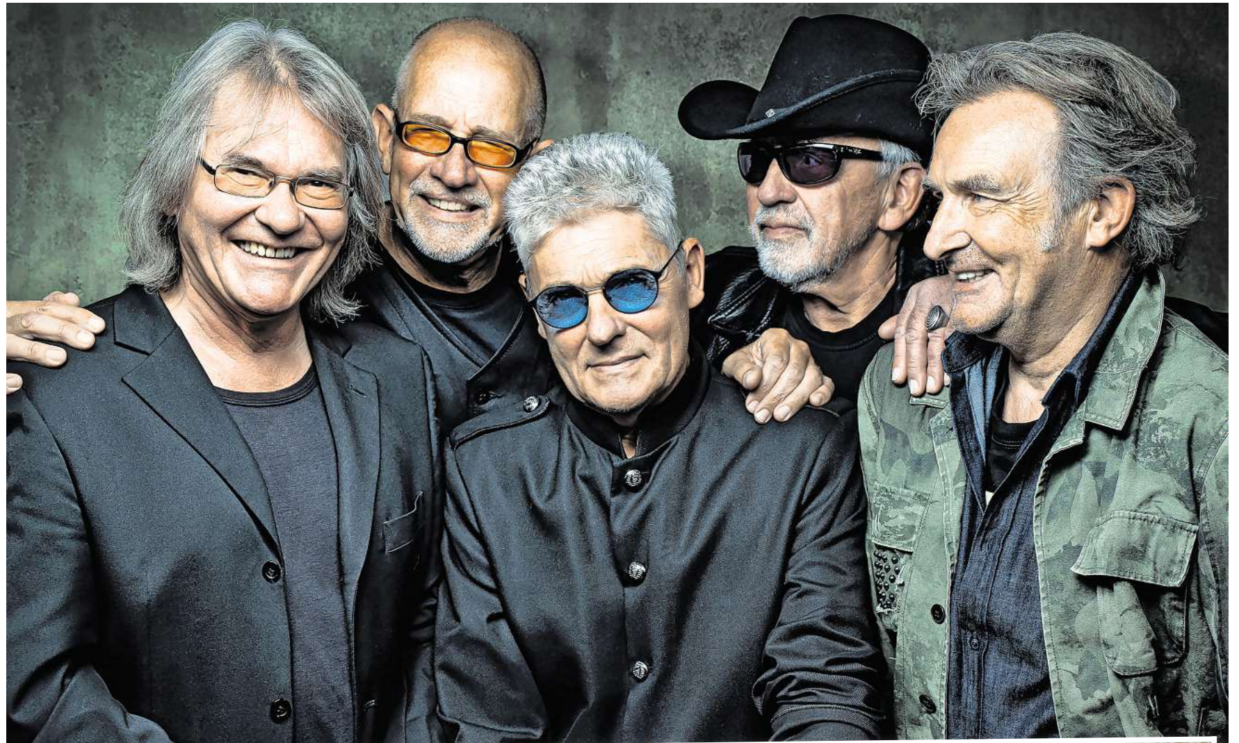
Die Green River Gang spielt ihr „Best of“ von Creedence Clearwater Revival und John Fogerty.

Der Sonntag beginnt um 10 Uhr mit einem Gottesdienst der Gesamtkirchengemeinde Laatzen im kulinarischen Dorf. Um 11:30 Uhr lädt Bürgermeister Kai Eggert zum offiziellen Stadtempfang ein.