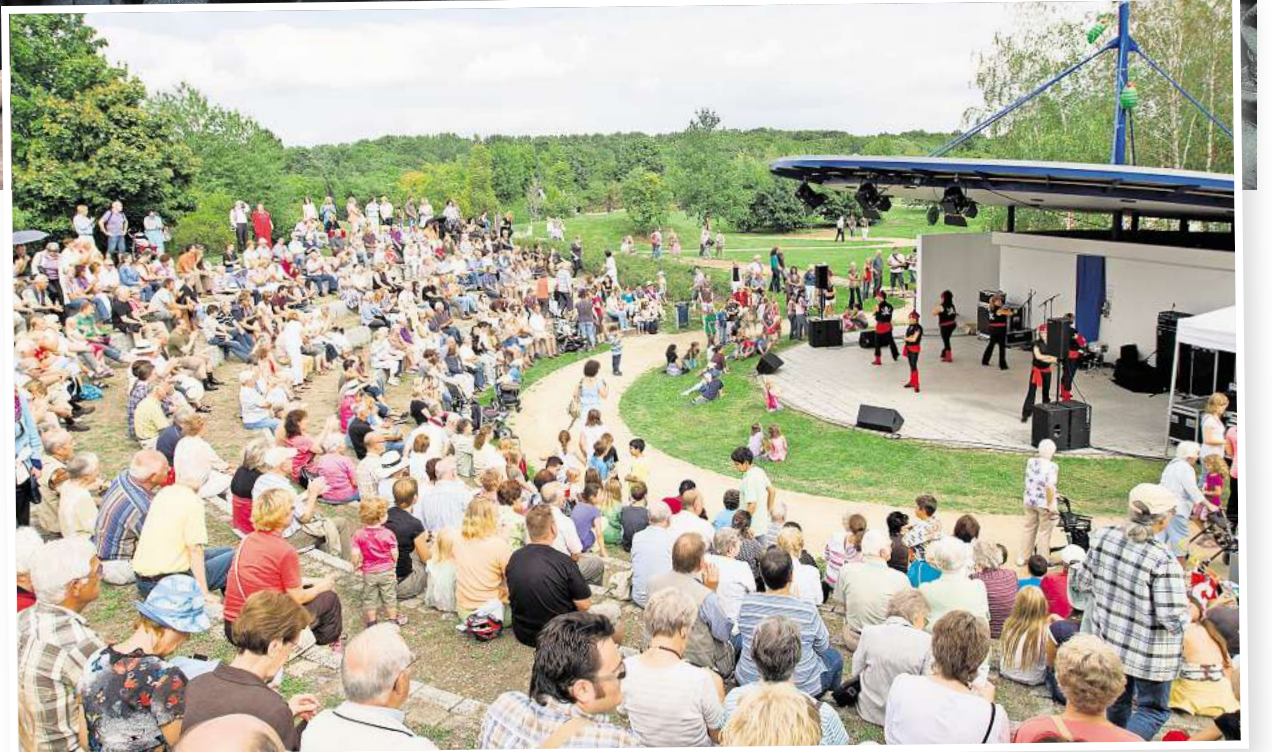
Fest der Sinne: Ein buntes Programm zum Mitmachen, Entdecken und Genießen.