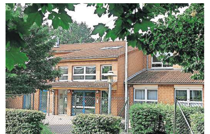
Kinder lernen Demokratie: Die Grundschule Hiddestorf bekommt ein besonderes Zertifikat.