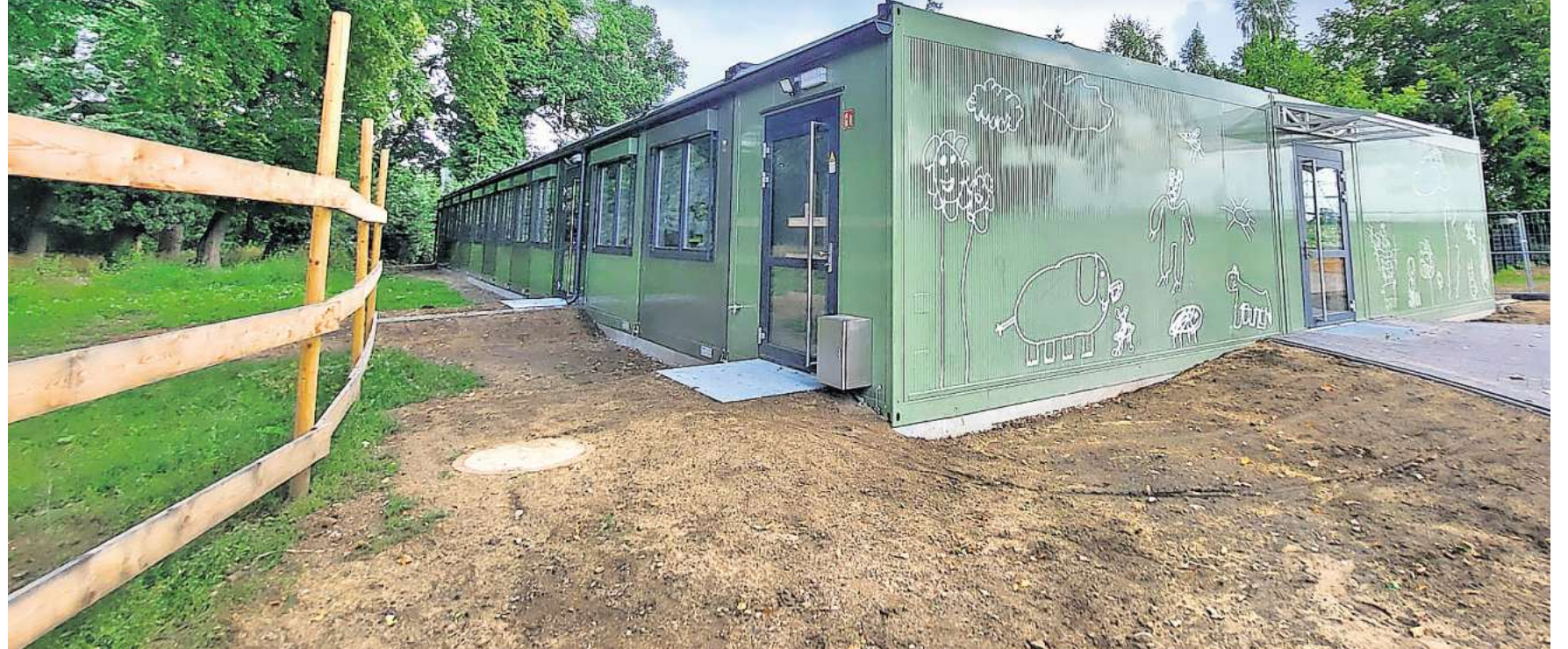
Das Containergebäude an der Grundschule Arnum: Dort sind zurzeit zwei Horträume, die Verwaltungsräume und das Lehrerzimmer untergebracht.

Drei Grundschulen gibt es im Stadtgebiet von Hemmingen. Bauprojekte und Platznot sorgen für zusätzliche Herausforderungen.