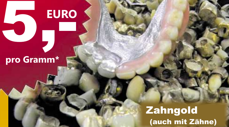
Zahngold (auch mit Zähne)