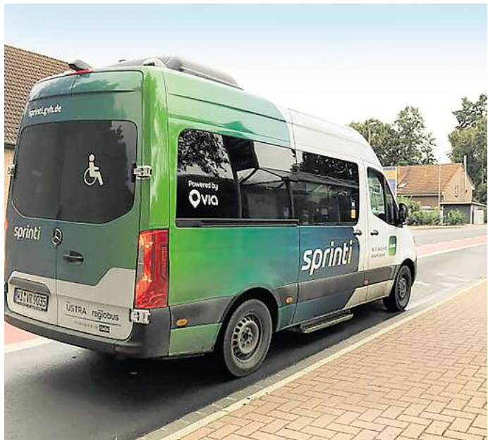
Ist auch in Pattensen unterwegs: Der Sprinti.

Die Statistik zeigt weiterhin, dass das Angebot am meisten an Sonntagen zwischen 18 und 20 Uhr genutzt wird. Der Sprinti ist aktuell in zwölf Kommunen der Region Hannover mit jeweils 120 Bussen unterwegs, von denen 40 elektrisch fahren. Am häufigsten wird der Bus zurzeit in Neustadt genutzt, wo jüngst an nur einem Sonntagsabend mehr als 1200 Fahrgäste gezählt wurden. Die Region hatte erst kürzlich darauf hingewiesen, dass Pattensen voraussichtlich nicht an die Stadtbahn angeschlossen wird. Dafür seien aber der Sprinti und die SprintH-Linie gute Alternativen.