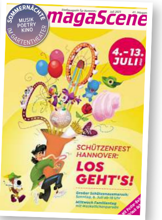
Stadtmagazin für Hannover magaScene

Wie kann ich eigentlich einen Tisch beim Maschseefest reservieren? Am besten über das Reservierungstool auf unserer Homepage www.maschseefest.de . Einfach den Standort anklicken und den Betreiber aussuchen, Tag, Uhrzeit und Personenzahl melden und schon geht eine Mail direkt an den Gastronomen heraus, der dann die weitere Abwicklung übernimmt. Das Reservieren eines Tisches spart Zeit und Nerven beim Maschseefestbesuch!