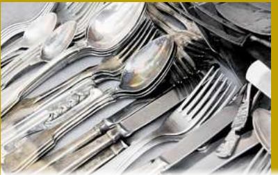
Silberbesteck bis zu 700,- Kg