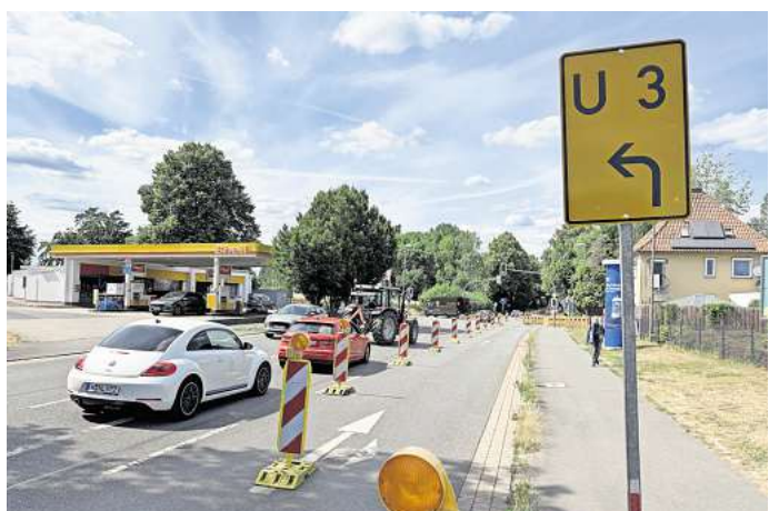
Verkehrsführung geändert: die Göttinger Straße an der Kreuzung mit dem Hohen Holzweg und dem Sundernweg mit Blick in Richtung Hemmingen-Weserfeld.

gegeben, kündigt die Landesbehörde an. Autofahrende nehmen die Umleitung über die Bundesstraße 3 nach Pattensen, weiter über die B443 nach Laatzen und dann über die B6/Messeschnellweg bis zum Seelhorster Kreuz – und umgekehrt. An der Hildesheimer Straße geht es weiterhin auf den Südschnellweg in Richtung Seelhorster Kreuz.