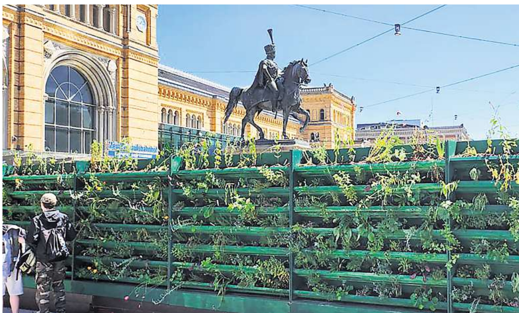
„Unterm Schwanz“ wird es grün: Vor dem Hauptbahnhof Hannover lädt der Bahnhofsgarten wieder zu zahlreichen Veranstaltungen ein.

nen und andere Insekten gebastelt, die zu Hause im Garten oder auf dem eigenen Balkon aufgehängt werden können. Außerdem gibt es viele Tipps zum naturnahen Gärtnern, die dazu beitragen, unsere Artenvielfalt zu erhalten. ► 25. Juli, 14.30 bis 17 Uhr: Samenbomben herstellen ► 26. Juli, 10 bis 15 Uhr: Fahrradmarkt „Fietzenbörse“ – Privatpersonen, Tüftler und regionale wie auch überregionale Händler bieten Hunderte gebrauchte Fahrräder an. Ob Hollandrad, Mountain-Bike oder Kinderrad, hier wird jeder fündig. Wer sich unsicher ist, ob ein bestimmtes Rad zu einem passt, kann sich von unabhängigen Spezialisten beraten lassen. Zu jedem Rad gibt es von der Fietzenbörse einen Kaufvertrag. Wer ein altes Fahrrad verkaufen möchte, kann morgens zwischen 8.30 und 11 Uhr sein Rad bei der Fietzenbörse abgeben und selbst den Verkaufspreis bestimmen. Gegen eine Provision, die sich am Verkaufspreis orientiert, wird das Rad zum Verkauf angeboten. Gegen 15 Uhr kann man seinen Gewinn oder das Fahrrad wieder abholen. Weiterer Termin: 23. August von 10 bis 15 Uhr.