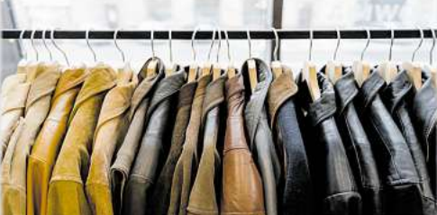
Für Lederjacken bis zu 3.500,-

Bisam • Persianer • Fuchspelze aller Art • Zobel • Nerze • Nutria • Chincilla