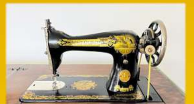
Für Nähmaschinen bis zu 1.500,-