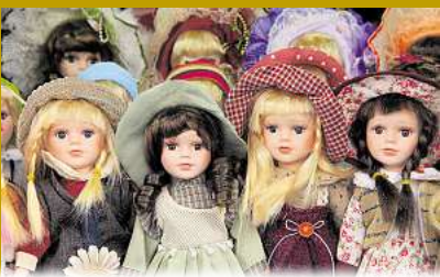
Porzellan Puppen bis zu 1.500,-