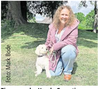
Tipps von der Hunde-Expertin. Seite 4