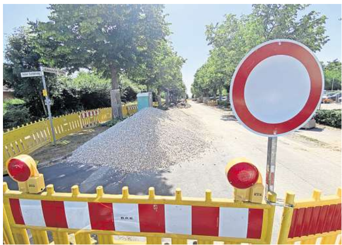
Gesperrt: der Abschnitt der Hiddestorfer Straße zwischen Hoher Eschenweg und der B3-Umgehungsstraße.

Die Hauptstraße in Hiddestorf ist seit 5. Mai von der Ostertorstraße bis Ortsstraße voll gesperrt. Sie gehört zur L389, die saniert wird. Der Verkehr wird über die Kreisstraße 226 in Richtung Pattensen und die B3-Umgehungsstraße umgeleitet. Die Bauarbeiten dauern voraussichtlich bis 15. Oktober. Wer zu Fuß oder mit dem Rad unterwegs ist, kann die Hauptstraße laut Landesbehörde für Straßenbau und Verkehr entlang der Baustelle passieren.