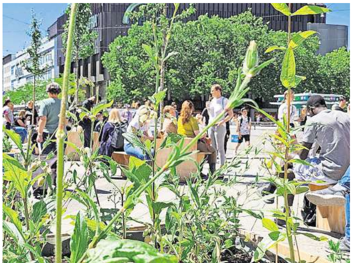
Begrünte Sitzplätze bieten Platz für eine Pause.