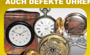
Taschenuhr (Gold & Silber)