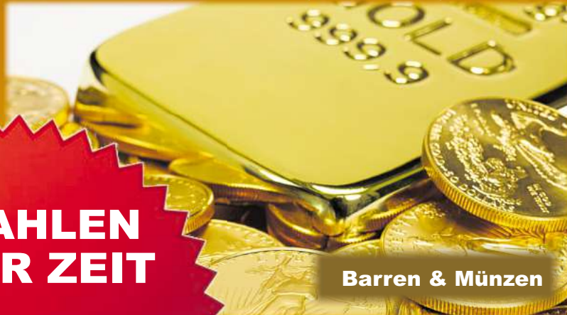
Barren & Münzen