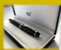
Montblanc & Markenstifte