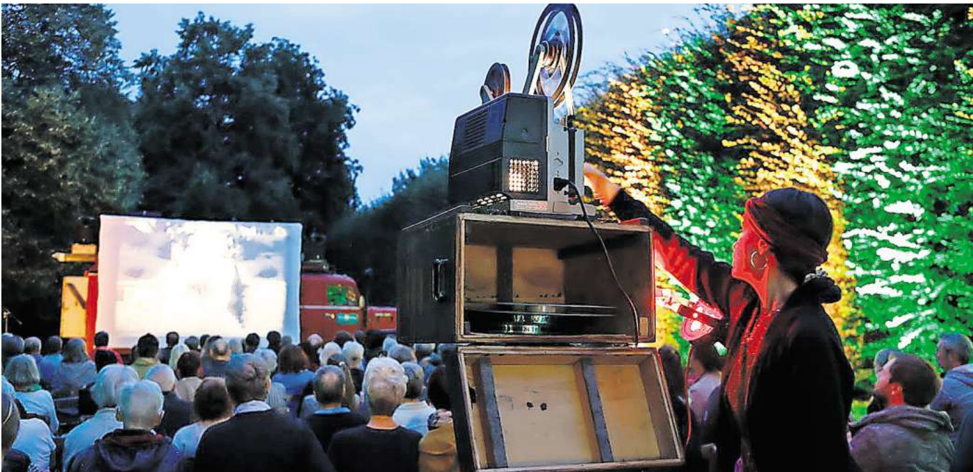
Wanderkino unter freiem Himmel: Am Schloss Landestrost werden Stummfilme gezeigt.