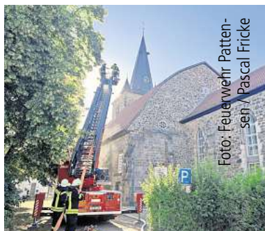
Groß angelegte Einsatzübung.