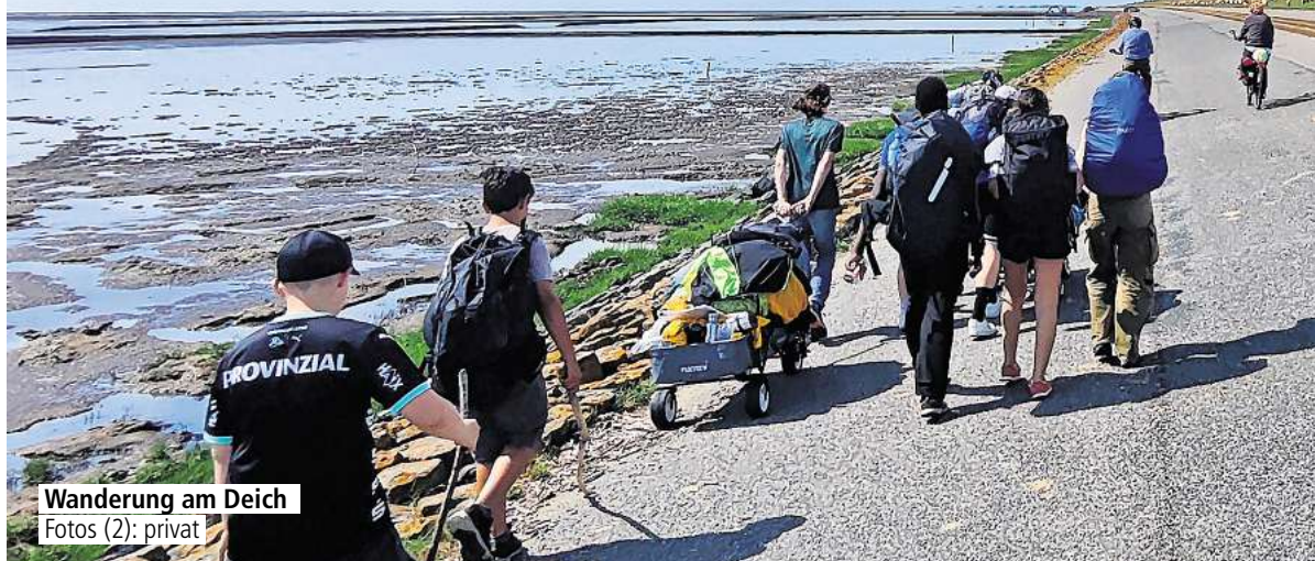
Wanderung am Deich

OHNE HANDY UND SICHERE SCHLAFPLÄTZE: Vor den Sommerferien stellt sich die Herausforderungs-AG einer besonderen Aufgabe