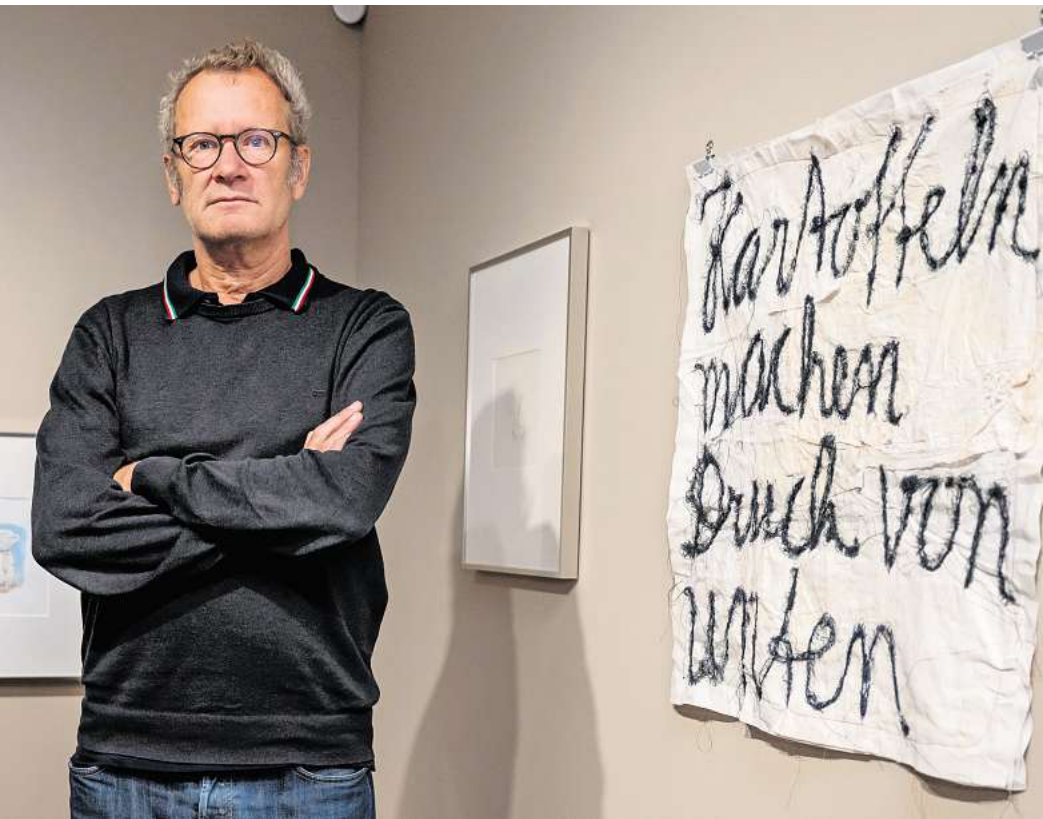
Meister des Wortes, des Strichs und des Sticks: Tex Rubinowitz neben einem seiner „Stickstoffe“.

Absurd und skurril muten die nicht zuletzt aus dem Satiremagazin Titanic bekannten Cartoons von Tex Rubinowitz auf den ersten Blick an – doch hinter dem scheinbar flüchtigen Strich lauert subversiver Tief-sinn. Zerzauste Gestalten prahlen auf scheinbar harmlose Tiere; alltägliche Szenen entpuppen sich als seltsame Parallel-universen mit doppelbödigen Pointen. Der seit 1984 in Wien lebende Rubinowitz dekonstruiert mit lakonischem Humor den banalen Alltag und jongliert mit Sprache – beim Publikum bleibt am Ende ein schmunzelndes Staunen, gepaart mit angenehmer Ratlosigkeit. Und spätestens seit dem Gewinn des Ingeborg-Bachmann-Preises 2014 für seinen lakonisch-witzigen Prosatext „Wir waren niemals hier“ kennt man ihn auch als scharfzüngigen Literaten. Als kreativer Querkopf liebt er es, Traditionen auf den Kopf zu stellen und dem Vertrauten die Unschuld zu rauben. Aus diesem Antrieb heraus ist auch eine weitere seiner Spezialitäten entstanden: skurrile Listen, sogenannte „Katalogisierungen“, mit denen er vermeintlich Ordnung ins Chaos bringt. So fragt er augenzwinkernd: