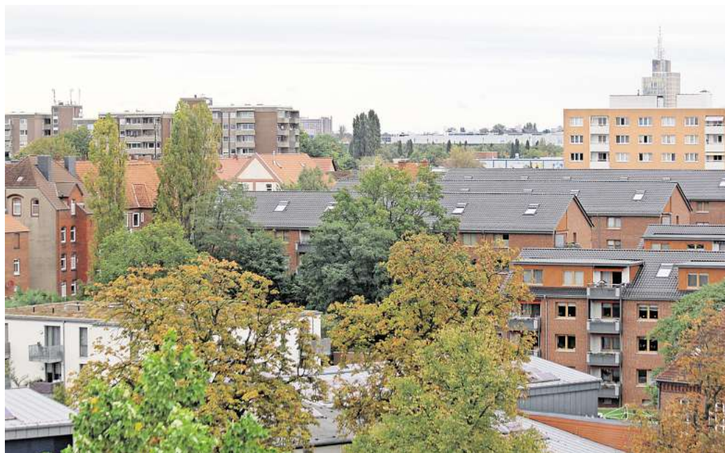
Knapper Wohnraum: Politik und Verwaltung in Laatzen wollen gegen die Zweckentfremdung von Wohnraum vorgehen.

Unter Laatzens Ratspolitikern stößt die Initiative überwiegend auf Zustimmung. So hat sich der Stadtentwicklungsausschuss vor Kurzem bei nur einer Gegenstimme