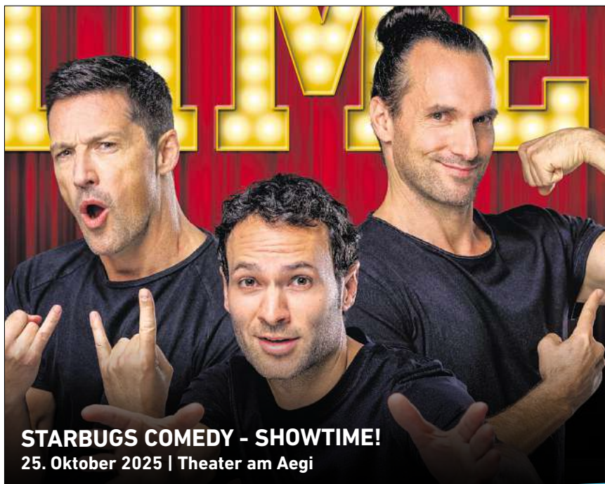
STARBUGS COMEDY - SHOWTIME! 25. Oktober 2025 | Theater am Aegi