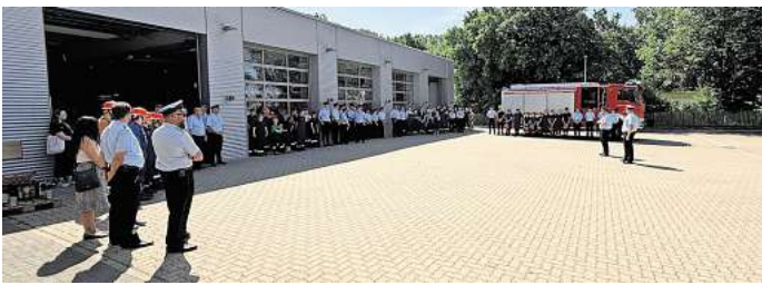
Feuerwehrtechnischer Wettbewerb der Stadtjugendfeuerwehr Hemmingen.