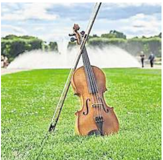
Barocke Spiele, Märchen und Musik sind in der „Sonntags“-Reihe im Garteneintritt enthalten.

los Kinderspiele funktionieren. Studierende der HMTMH präsentieren einstündige Konzerte auf der Probenbühne, jeweils ab 12 und ab 14 Uhr. Am 31. August ist ein Duo mit Gitarre und Flöten zu hören, am 14. September spielt mit „Bridges of Brass“ ein Blechbläser-Ensemble, und am 28. September treffen sich E-Piano und Trompete. RED