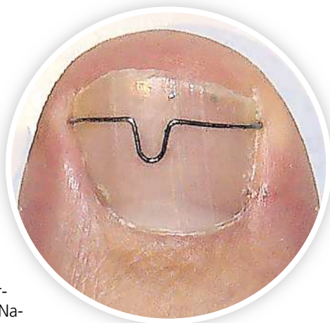
Orthonyxiespangen bei eingewachsenen Nägeln

➡ Weitere Informationen gibt es im Internet unter www.podologie-behrens.de .