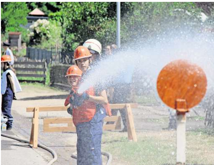
Der Angriffstrupp der Jugendfeuerwehr Jeinsen hat das Ziel ge-troffen.

Museum Wilhelm Busch Georgengarten www.karikatur-museum.de