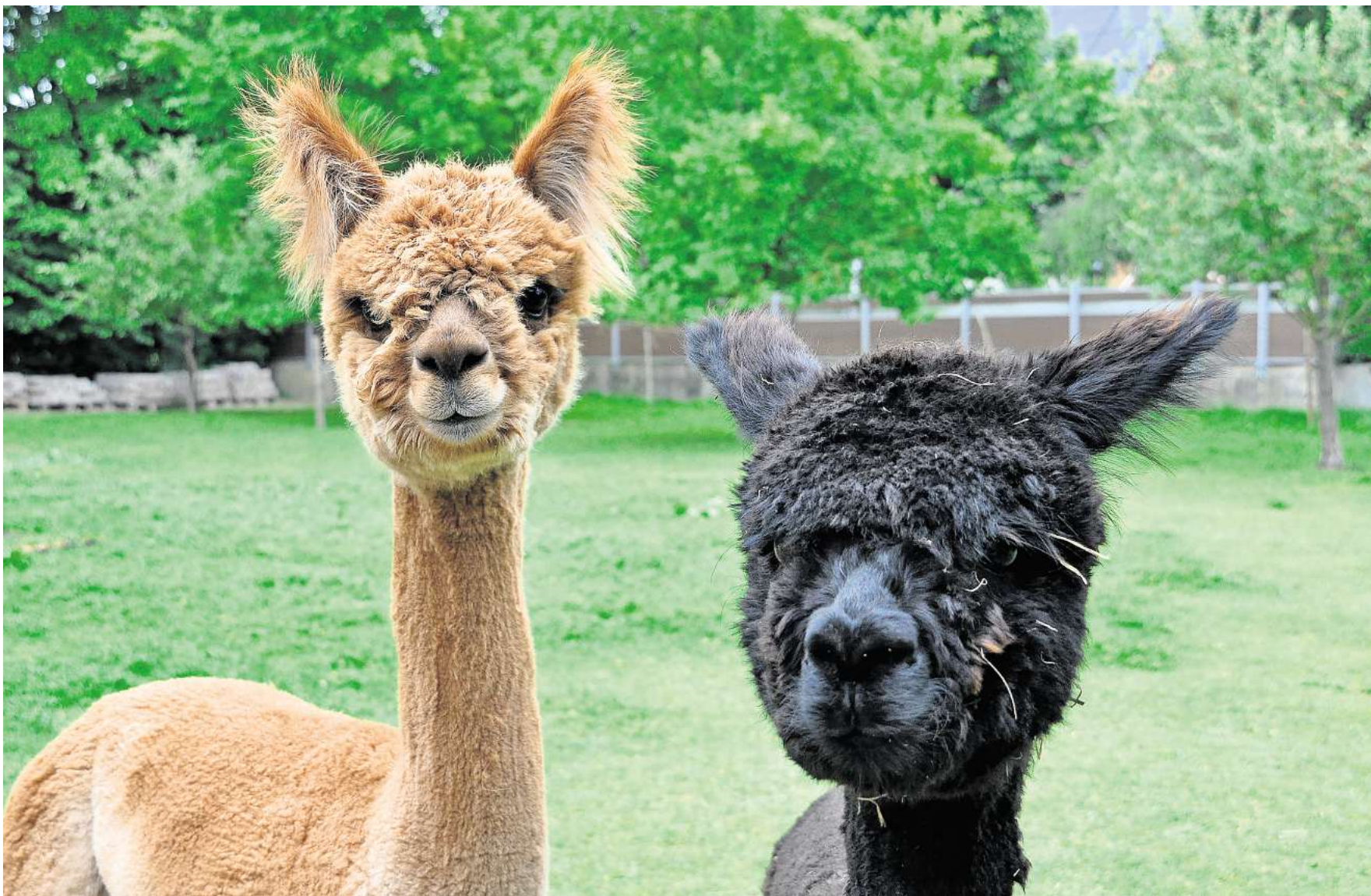
Die beiden einjährigen Alpaka-Halbbrüder Apollo (braun) und Hubertus (schwarz) sind ein sehr beliebtes Foto-Motiv. Manche Alpaka-Fans gehen für solche Aufnahmen jedoch zu weit, zerstören fremdes Eigentum oder füttern die Tiere nicht artgerecht.

Die detaillierten Ergebnisse sind auf kijub-laatzten.de einsehbar.