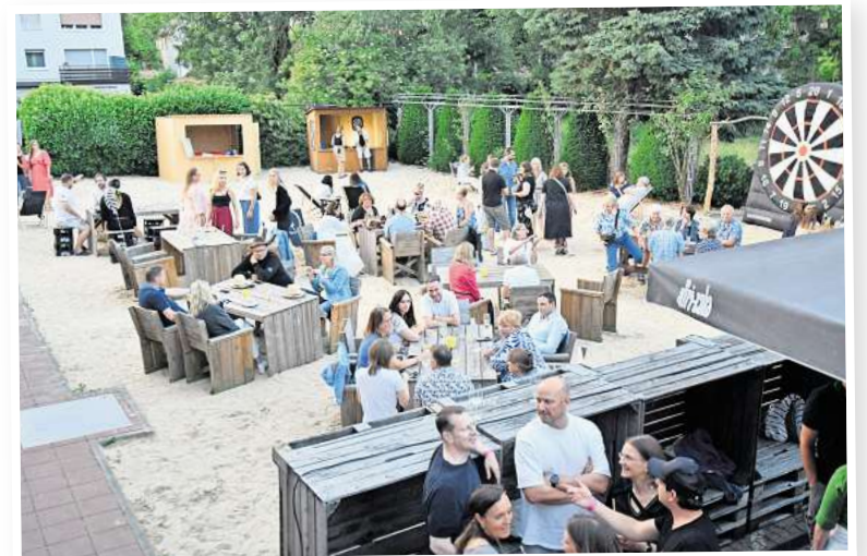
Gut besucht: Viele Gäste sind zur Strandparty gekommen.

Die Resonanz auf die vergangenen zwei Partys sei groß gewesen. „Jedes Mal kamen rund 180 Frauen zum Tanzen.“