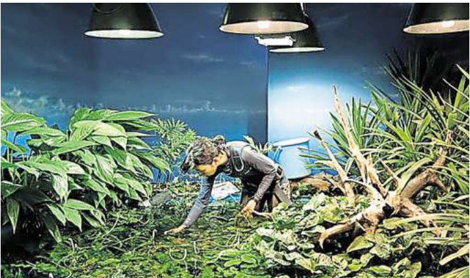
Die Ausstellung im Kubus beschäftigt sich mit dem Verhältnis zur Natur, hier „Toba Aquarium“.

Nähere Informationen und alle Termine stehen auf: atelierhaus-hannover.de/kubus