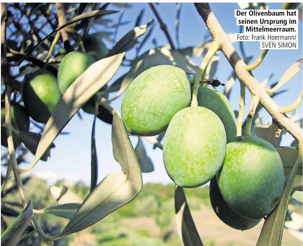
Der Olivenbaum hat seinen Ursprung im Mittelmeerraum.

Die Ursachen für gelbe Blätter an der Olive sind vielfältig. Sie reichen von Nässe über Nährstoffmangel bis hin zu Pilzkrankungen. Wenn ab und zu ein paar Blätter gelb werden und herunterfallen, muss man sich keine Sorgen machen. Wenn aber ganze Äste befallen sind,