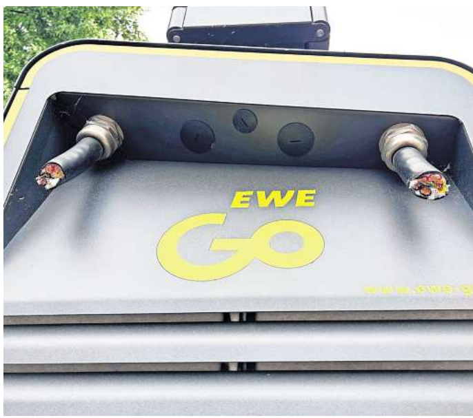
Kupferdiebe sind unterwegs: Unbekannte haben Ladekabel einer E-Ladesäule in Pattensen abgeschnitten. Die Polizei ist ihnen auf der Spur.