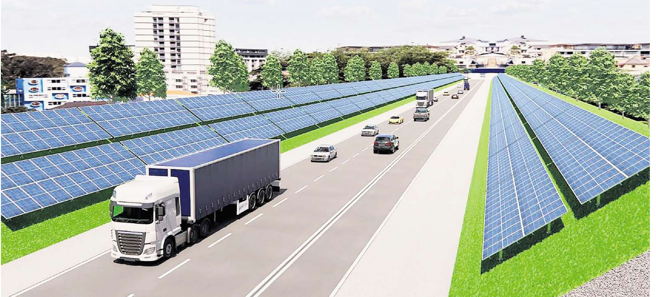
Simulation: So könnte eine beidseitige Solaranlage an der B3 aussehen.