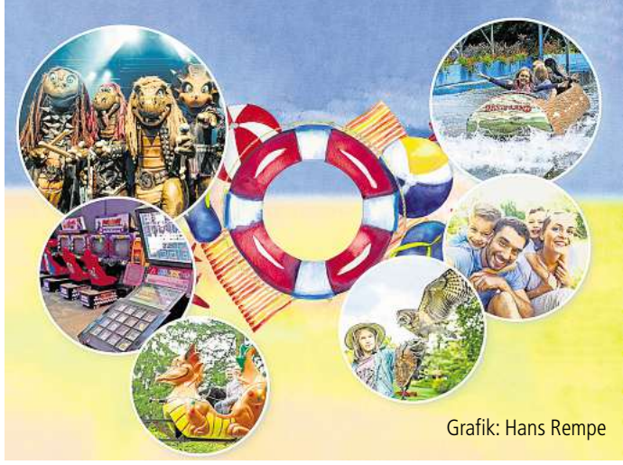
Grafik: Hans Rempe

Alternativ können Sie auch den QR-Code scannen, um direkt zu den Angeboten zu gelangen. Nutzen Sie diese Gelegenheit, um unvergessliche Erlebnisse zu schaffen und die Sommermonate in vollen Zügen zu genießen. Si- chern Sie sich Ihre Tickets und freu- en sich auf einen aufregenden Er- lebnissommer!