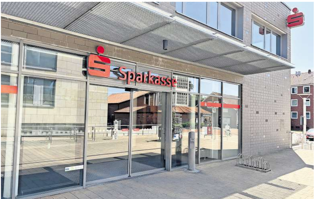
Ein zweites SB-Terminal soll zeitnah in die Sparkassen-Filiale in Hemmingen-Westerfeld eingebaut werden.