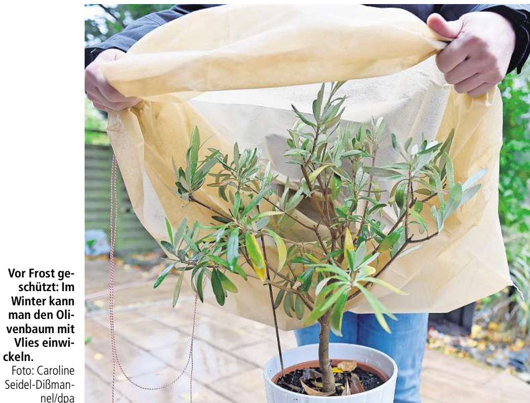
Vor Frost geschützt: Im Winter kann man den Olivenbaum mit Vlies einwickeln.

Aus dem mediterranen Pflanzenrepertoire kommen auch die als Bart-Iris bekannten Schwertlilien und Yucca infrage. Peter Berg plädiert für Gräser, den Blau-Schwingel oder das fein duftende Tautropfengras. Für den heißen, sonnigen Standort eignet sich die Hohe Fetthenne. Sie blüht vom Spätsommer bis in den Winter.