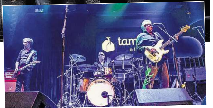
Das Baltic Rock Project live im Tamsta Club Vilnius.

spielen. Am nächsten Tag, also dem 29.6., sind sie bei uns in Hannover im Clubhaus 06 zu Gast. Die Band existiert seit 1986, hat so einige Alben veröffentlicht und genießt in Litauen den Ruf der besten Rockband