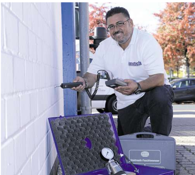
Eine kostenlosen Schadensanalyse und ausführliche Beratung ist für die innotech GmbH fester Bestandteil des Leistungsversprechens.

Starkregenereignisse haben im Zuge des Klimawandels rasant zugenommen. Auf diese Bedrohung haben mittlerweile auch die Region Hannover sowie die Regionskommunen reagiert und informieren im Internet mittels Starkregenhinweiskarten sowie weiteren Informations- und Beratungsangeboten über die wachsende Gefährdung des Immobilienbestands. Große Niederschlagsmengen, die in kurzer Zeit abregnen, können von den Böden nicht aufgenommen werden, zumal Starkregenereignisse immer öfter von längeren Trockenperioden begleitet werden, in denen die Böden aushärten. In der Folge staut sich Niederschlagswasser auf und dringt bei unzureichend geschützten Immobilien durch das Mauerwerk ein. Die Konsequenz: gesundheitsgefährdende Schimmelbildung oder Salzausblühungen, die der Bausubstanz schaden. Hier ist rasches Handeln gefragt. Besonders ältere Immobilien, die vor den 70er Jahren errichtet wurden, verfügen häufig nicht über eine ausrei-