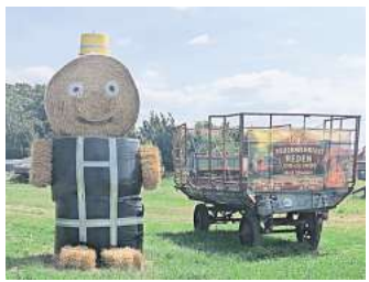
Die Dekorationen kündigen es bereits an: Die Feuerwehr Reden feiert.