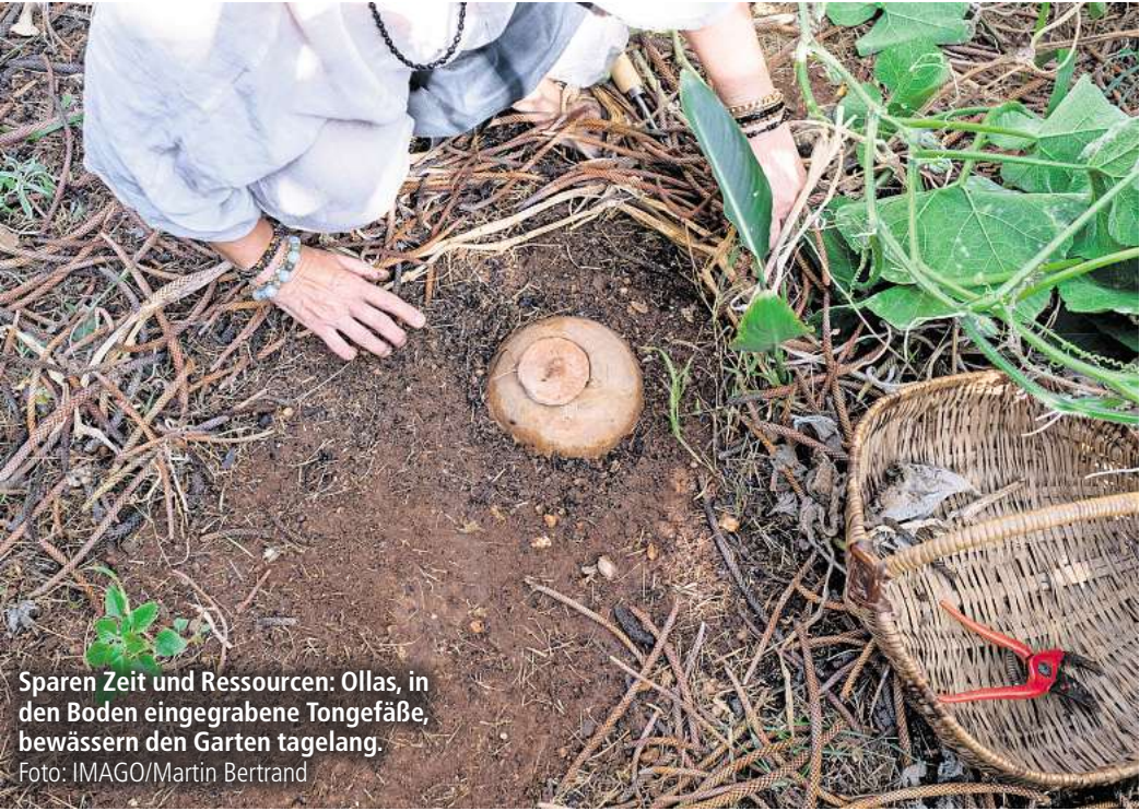
Sparen Zeit und Ressourcen: Ollas, in den Boden eingegrabene Tongefäße, bewässern den Garten tagelang.