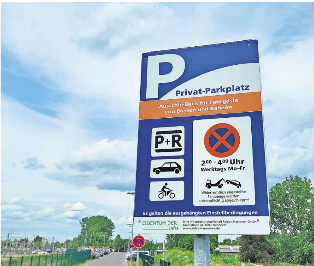
Neue Schilder wie auf dem Bild in Hemmingen: Sie weisen auf das nächtliche Parkverbot hin.

Wie viele Fahrer und Fahrerinnen zum Beispiel an der Stadtbahn-Endhaltestelle in Hemmingen-Westerfeld seit Mai ein Strafgeld zahlen mussten und wie viele Autos abgeschleppt wurden, ließ sich nicht benennen. Hauschke erklärte, die Infra habe damit die Firma GSG German Service Group mit Sitz in Mainz beauftragt, die die Zahlen für alle Plätze zusammen übermittelt. Außerdem sei die Regelung erst vor kurzem geändert worden. „Bei Verstößen gegen