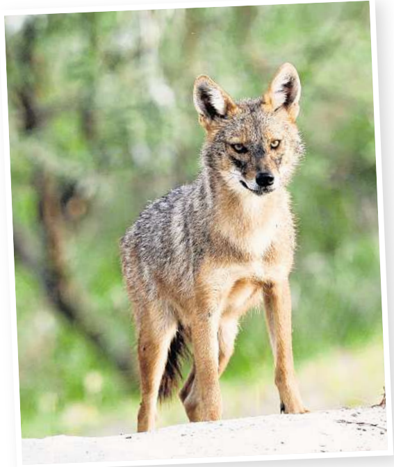
Inzwischen auch in Laatzen unterwegs? Goldschakale werden seit 2015 in Niedersachsen gesichtet.

Bislang gebe es 21 konkrete Nachweise. Im September 2022 seien erstmals Bilder von Goldschakalwelpen im Landkreis Uelzen bestätigt worden: Der Reproduktionsnachweis gilt als entscheidendes Merkmal, dass sich die Spezies in Niedersachsen fest angesiedelt hat. Für Menschen gilt das Tier nicht als Gefahr – anders bei Nutztieren: In Öster-