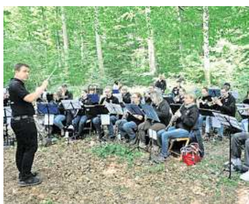
Spielt einen Open-Air-Frühschoppen im Wald: Der Musikzug Hiddesdorf-Ohlendorf.