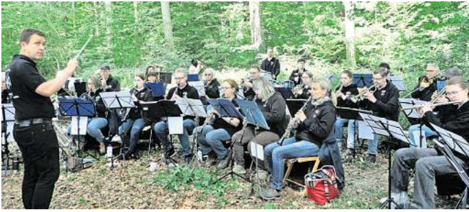
Spielt einen Open-Air-Frühscoppen im Wald: Der Musikzug Hiddestorf-Ohlendorf.