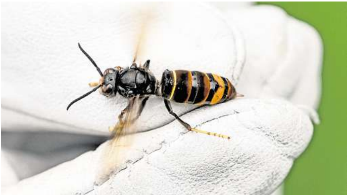
Dunklerer Körper, gelbliche Beine: die Asiatische Hornisse unterscheidet sich an einigen Stellen merklich von der einheimischen Art.

Die Asiatische Hornisse ist etwas kleiner als die heimische Europäische Hornisse, hat einen auffälligen gelben Strei-