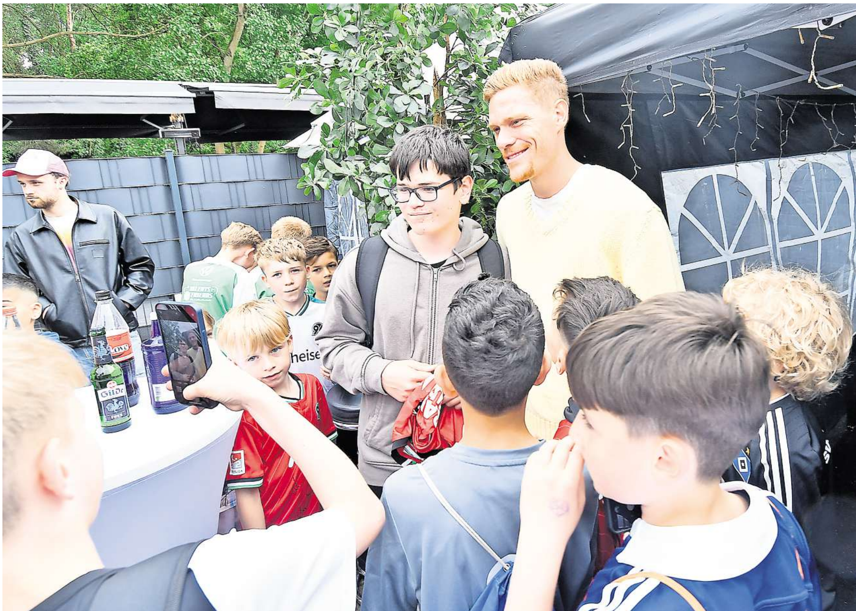
Gibt geduldig Autogramme und posiert für etliche Selfies: Der Ex-Nationalspieler und Laatzeer Marcel Halstenberg.