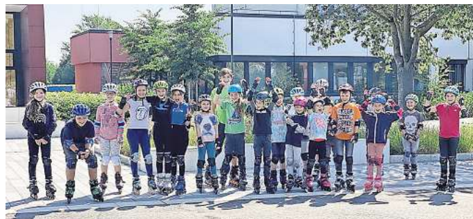
Ferienspass vielleicht auch wieder auf Inliner.

➡ Weitere Informationen sowie das Anmeldeformular erhalten interessierte Familien unter kj-buero@laatzen.de sowie im Kinder- und Jugendbüro unter 0511 8205-5204 und per Mail an kinderundjugendbuero@laatzen.de .