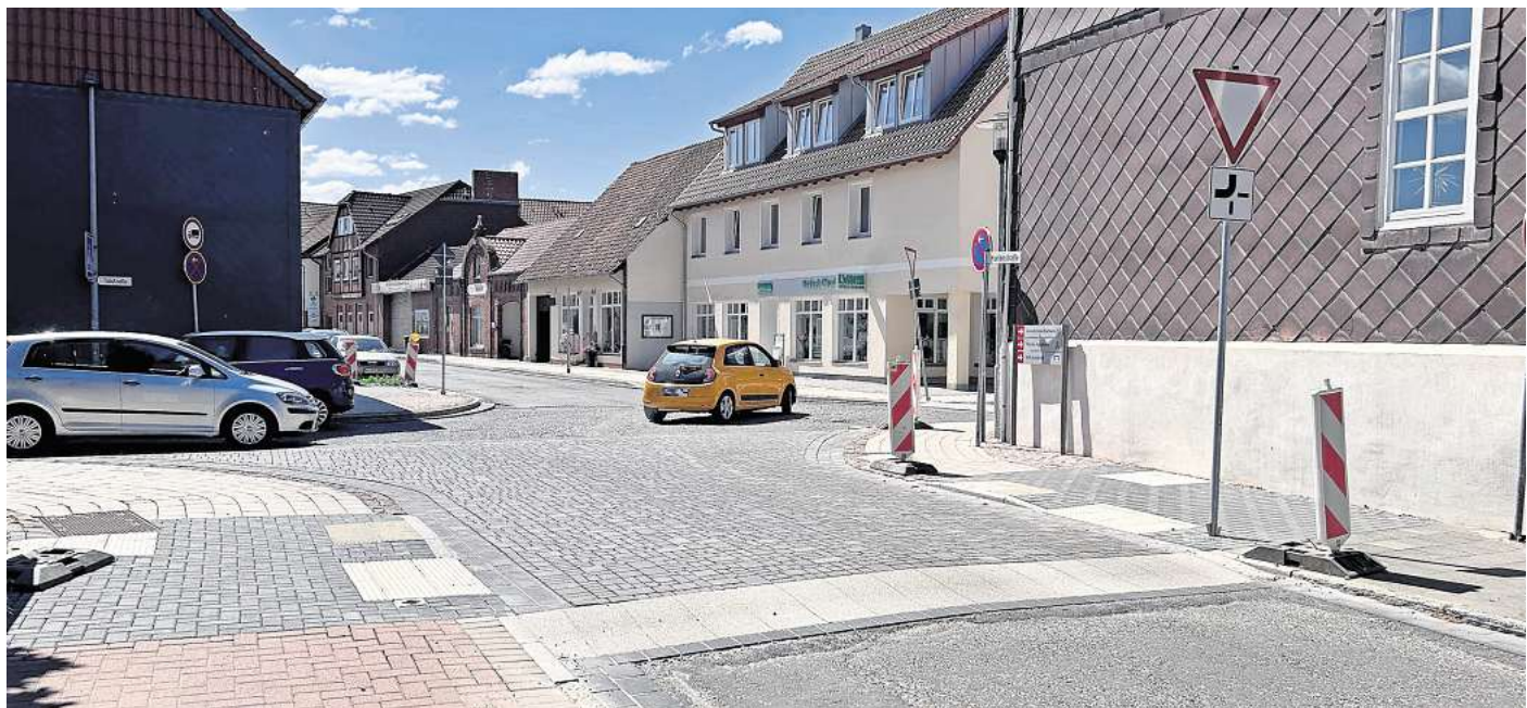
Mehrere Tage dicht: Die Marienstraße wird wegen Bauarbeiten für den motorisierten Verkehr gesperrt.

Die Grundschulleiterin Stephanie Pieper hatte Eltern schon frühzeitig über die Pläne in Kenntnis gesetzt. Sie verwies in dem Schreiben darauf, dass Eltern ihre Kinder für diesen Zeitraum am Bruchweg absetzen müssen. Von dort ist es ein geringfügig längerer Fußweg bis zum Schulgebäude.