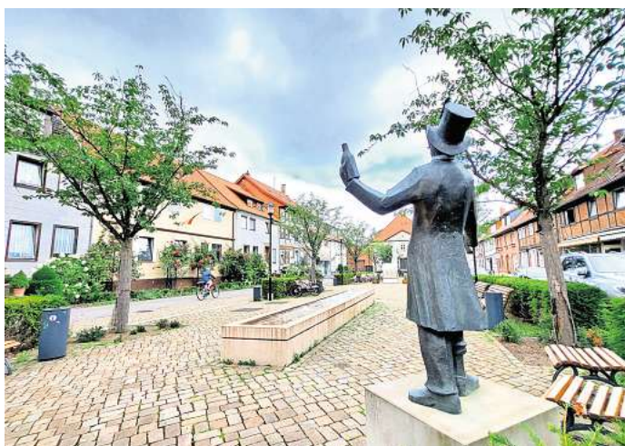
Der Marktplatz in Pattensen: Während des Wochenmarktes am 5. Juni ist auch eine Veranstaltung gegen Rechtsextremismus geplant.