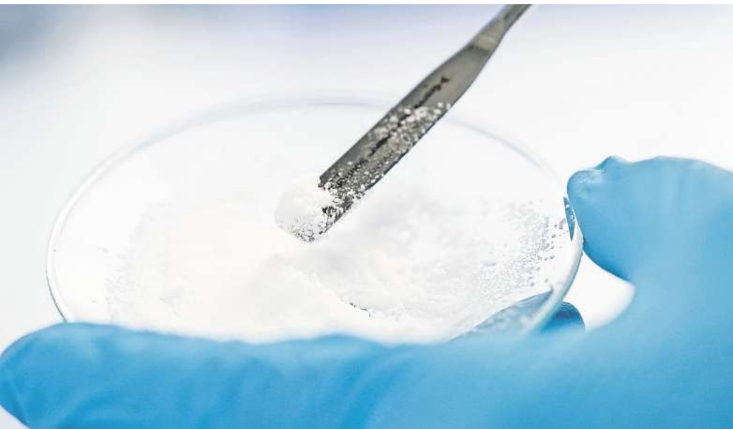
Genehmigt: Esso darf in Niedersachsen nach Lithium suchen.

► Wo darf noch nach Lithium gesucht werden? Die Erlaubnisfelder verteilen sich über ganz Niedersachsen und reichen vom Emsland bis nach Hildesheim. Insgesamt sind es laut LBEG inzwischen 25 Gebiete. Anfang des Jahres 2024 waren es lediglich zwei. In der Region Hannover befindet sich mit „Husum I“ ein weiteres Gebiet in den Kommunen Neustadt und Wunstorf. Gleich mehrere Gebiete fallen in die Landkreise Rotenburg (Wümme), Olden-