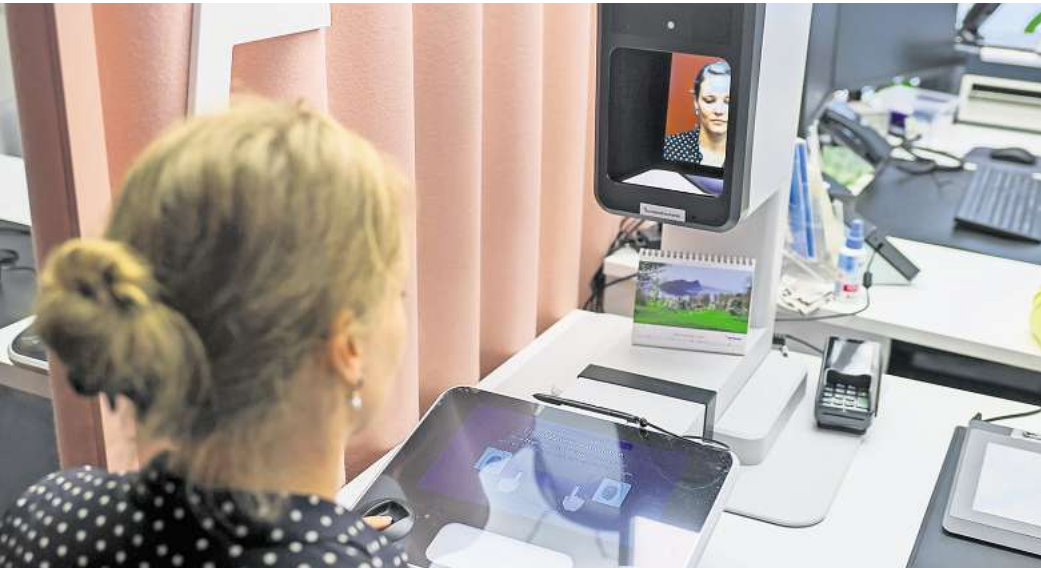
Noch nicht in Betrieb: Die Hemminger Verwaltung richtet die von der Bundesdruckerei zugelassene Kamera in den nächsten Tagen im Rathaus ein (Symbolbild).

Die Stadt informiert im Internet auf der Seite stadthemmingen.de und der Bund auf der Seite personalausweisportal.de über die neue Regelung.