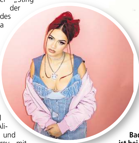
Badmómzjay ist bei der N-Joy Starshow dabei.

Superstar Sting wird im Rahmen seiner „Sting 3.0“-Tour der Headliner des NDR2 Plaza Festivals am Freitag, 6. Juni, sein. Ferner werden Samu Haber, Bosse, Michael Schulte, Alice Merton und Sophie Grey mit kompletten Sets dabei sein.