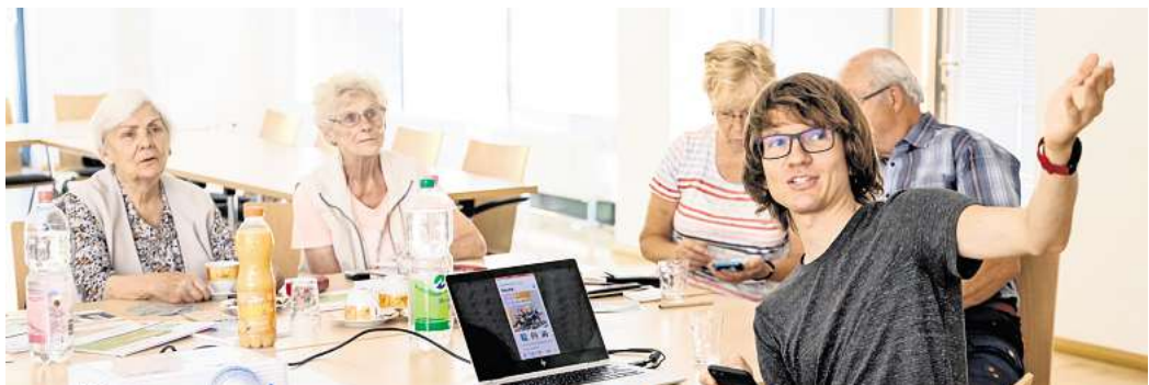
Die Digitalen Engel erklären den sicheren Umgang.

liner Allee 13, beraten lassen. Für Interessierte ist eine Terminvereinbarung unter der Telefonnummer (0511) 829-1565 erforderlich. Zum Gespräch sollten dann die Versicherungsunterlagen und der Personalausweis oder Reisepass mitgebracht werden.