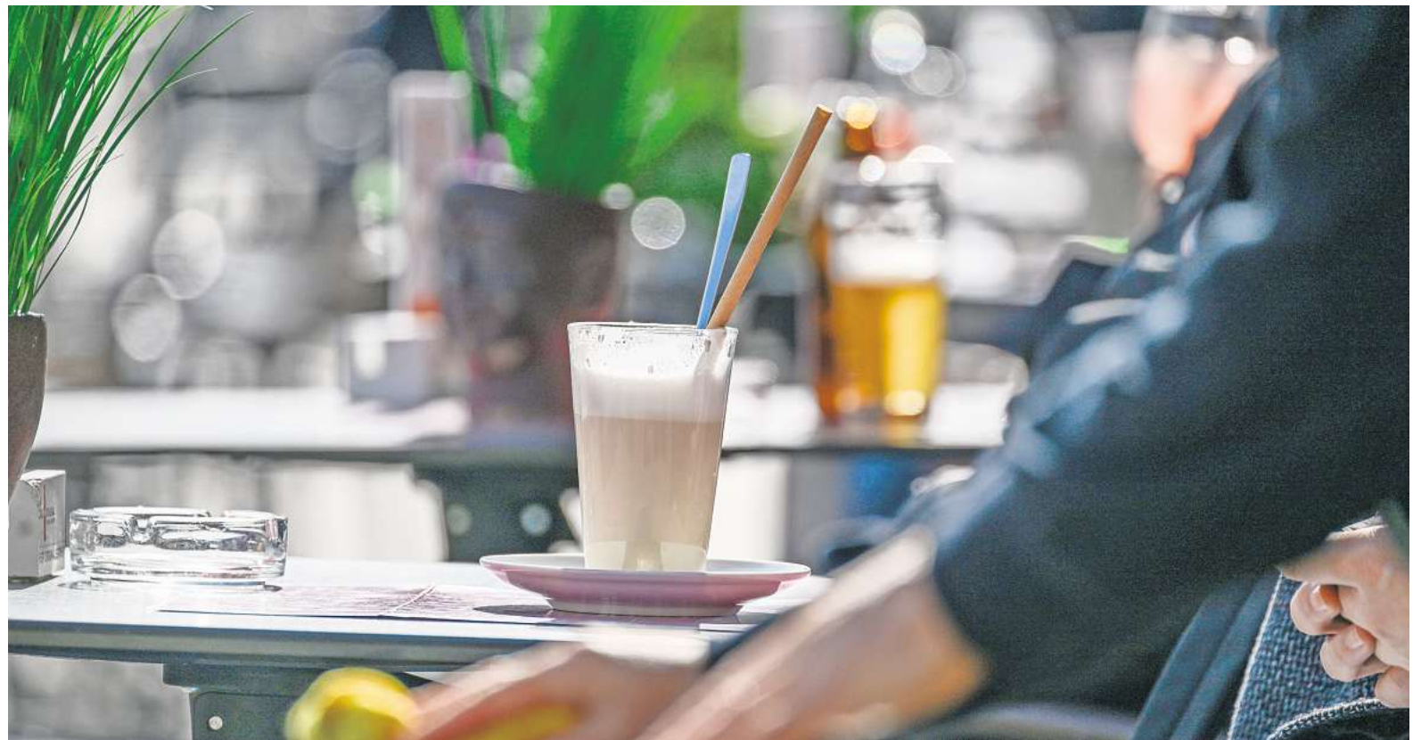
Teures Pflaster: In keiner niedersächsischen Kommune mit mehr als 40.000 Einwohnern ist die Terrassengebühr so hoch wie in Laatzen.