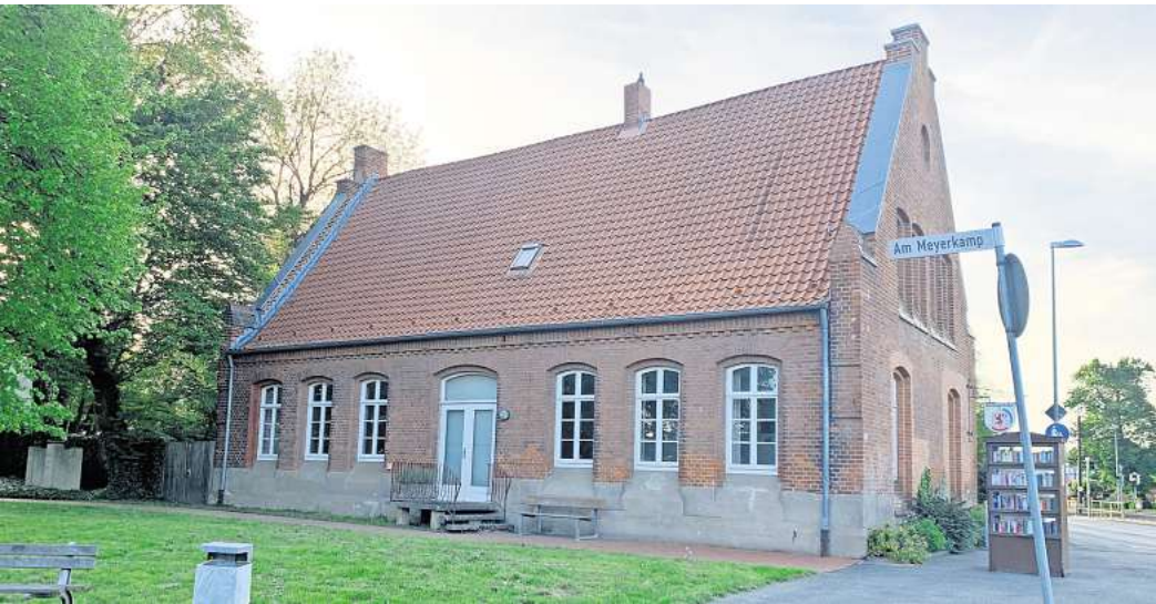
Der denkmalgeschützte Treff Alte Schule soll nach dem Umbau und Einzug des Standesamtes wieder über die Südseite erreichbar sein. "Wünsche berücksichtigt": Architekt Karl Butz zeigt, wie das 61 Quadratmeter große einstige Klassenzimmer per Faltwand geteilt werden kann. Bleibt erhalten: Der barrierefreie Zugang von der Hildesheimer Straße.

Der zweite, große Raum zum Garten hin sei zwar vorrangig als Trauzimmer vorgesehen, für besondere Anlässe nach Absprache aber auch anderweitig zu nutzen. „Es ist nicht so, dass wir das Haus in Beschlag nehmen“, betonte die Standesbeamtin Petra Schwarz an Vertreter der Nutzergruppe gerichtet: „Wir