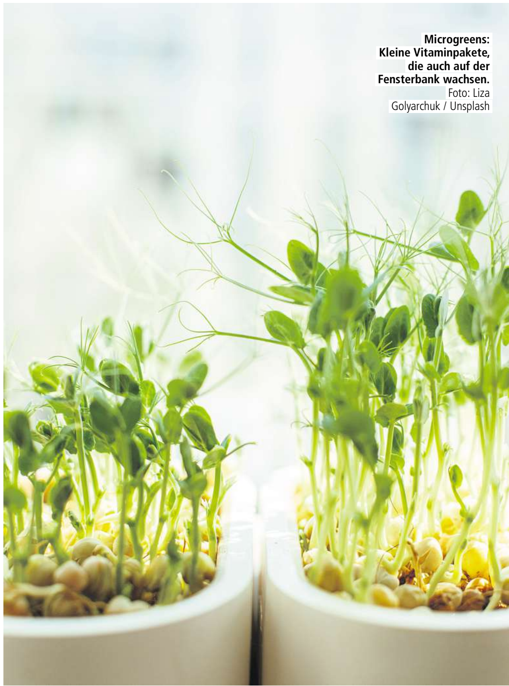
Microgreens: Kleine Vitaminpakete, die auch auf der Fensterbank wachsen.

Eine beliebte Technik ist unter anderem das Square-Foot-Gardening: Hier wird das Beet in Quadrate von etwa 30 mal 30 Zentimetern (ein Quadratfuß) eingeteilt, die jeweils dicht mit einer Pflanzensorte bepflanzt werden. Nach der Ernte eines Quadrats kann sofort eine neue Sorte kultiviert werden. So produzieren kleinere Flächen deutlich mehr als herkömmliche Gärten, und das ganz ohne synthetische Helfer. Dieser Anbautrend entwickelt sich aktuell sogar zu einem neuen Geschäftsmodell: Bundesweit entstehen Mikrofarmen, die auf kleinen Flächen Gemüse anbauen und es lokal vermarkten – ein Modell nachhaltiger Landwirtschaft mit Potenzial für die Zukunft.