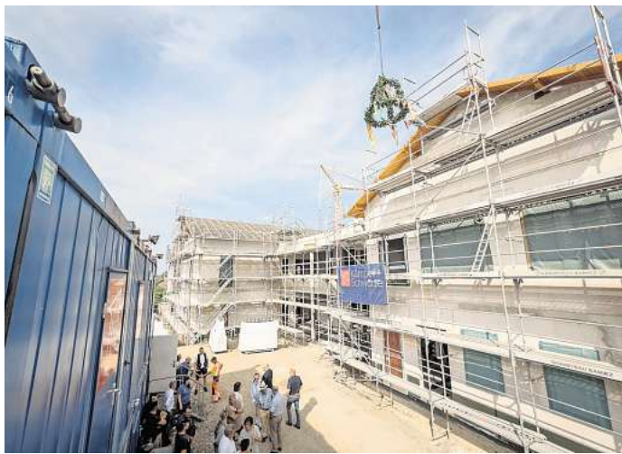
Die neue Grundschule Ingeln-Oesselse sieht viel Platz für die Schülerinnen und Schüler vor. Aber: Die Feuchtigkeitsschäden in der Dachkonstruktion der Schule dürften zu deutlichen Mehrkosten beim Neubau führen.