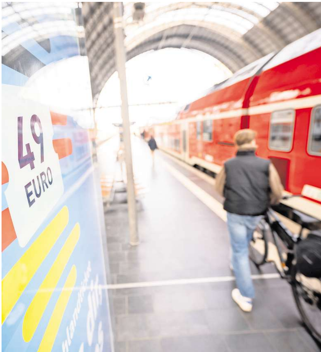
Erfolgsmodell 49-beziehungsweise jetzt 58-Euro-Ticket: Mindestens 13,5 Millionen Menschen nutzen derzeit das Ticket, das als Nachfolger des erfolgreichen 9-Euro-Tickets im Mai 2023 für 49 Euro an den Start ging.

Er begrüßt, dass im Koalitionsvertrag der Fortbestand des Deutschlandtickets für die nächsten Jahre zugesichert ist. Allerdings gibt es dort einen Finanzierungsvorbehalt. Und es seien mit Blick auf das Ticket noch viele Details offen, betont Flege. „Man sollte zum Beispiel bundesweit einheitlich regeln, ob Kinder, Hunde und Fahrräder auf dem Ticket mitfahren dürfen.“ Bislang wird dies von Verkehrsverbund zu Verkehrsverbund unterschiedlich gehandhabt.