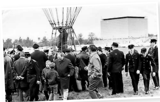
Menschentraube bei Heißluftballon: Auf einer Wiese stehen Dutzende Männer, Frauen und Kinder, einige von ihnen in Feuerwehruniform.