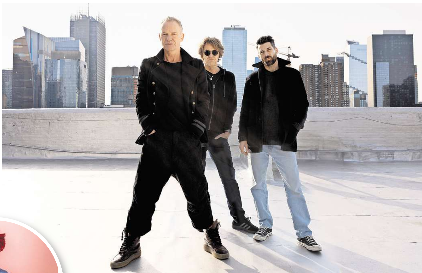
Weltstar Sting kommt zum Plaza Festival