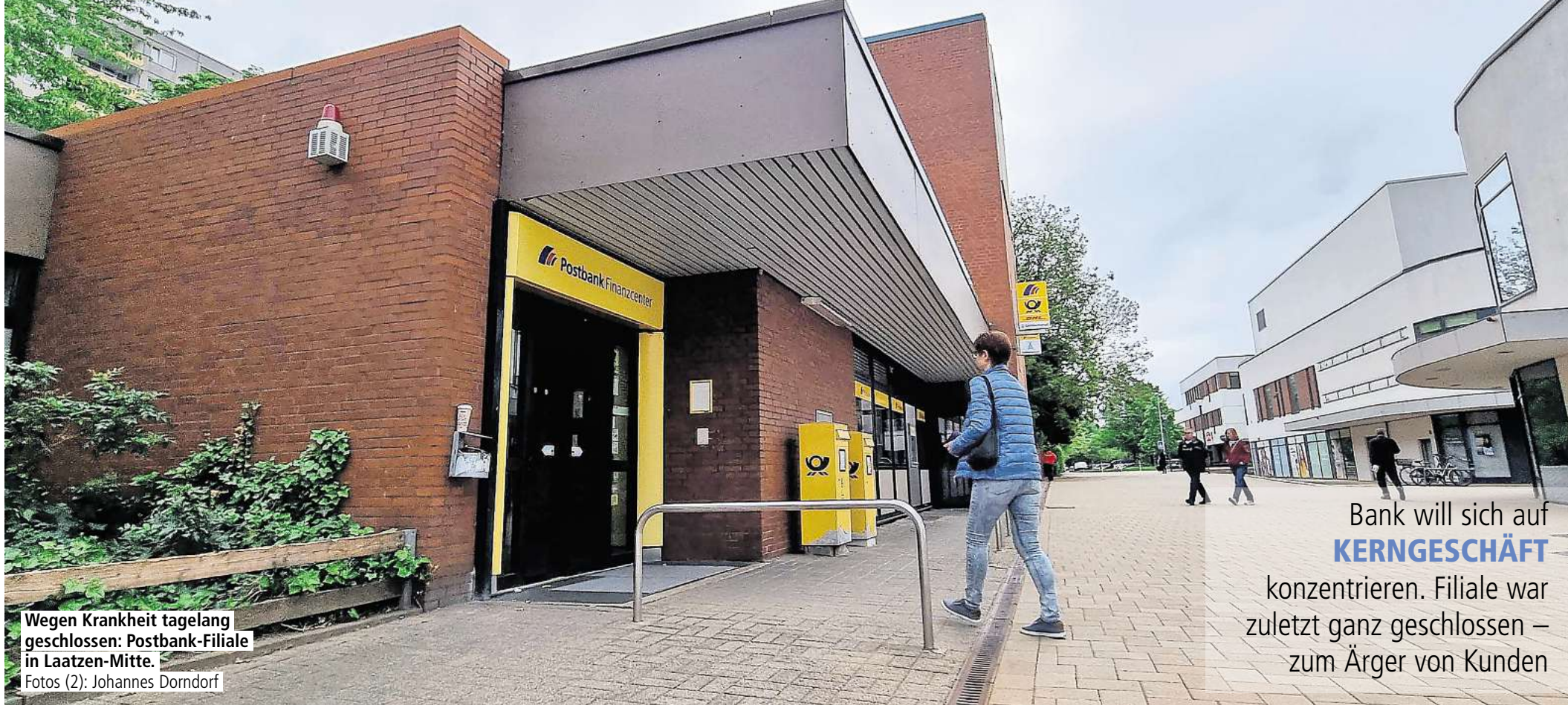
Wegen Krankheit tagelang geschlossen: Postbank-Filiale in Laatzen-Mitte.

Bank will sich auf KERNGESCHÄFT konzentrieren. Filiale war zuletzt ganz geschlossen – zum Ärger von Kunden