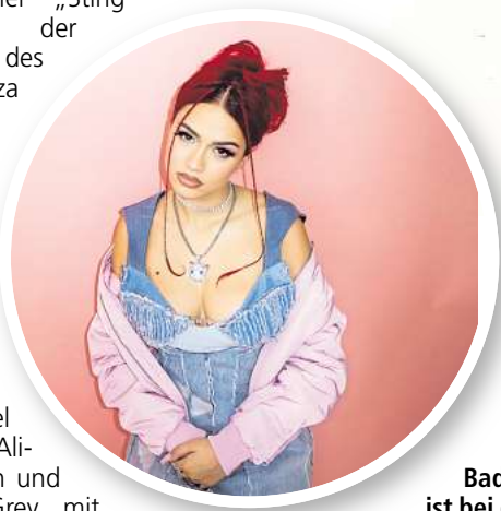
Badmónzjay ist bei der N-Joy Starshow dabei.

Superstar Sting wird im Rahmen seiner „Sting 3.0“-Tour der Headliner des NDR2 Plaza Festivals am Freitag, 6. Juni, sein. Ferner werden Samu Haber, Bosse, Michael Schulte, Alice Merton und Sophie Grey mit kompletten Sets dabei sein.