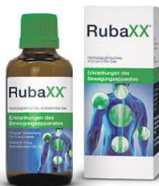
Abbildung Betroffenen nachempfunden

Für Ihre Apotheke: Rubaxx (PZN 13588561)