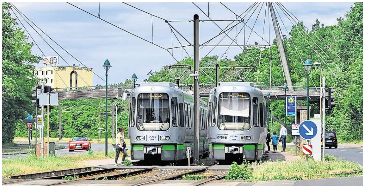
Ist noch nicht barrierefrei: Stadtbahn-Haltestelle Park der Sinne.

Stattdessen gab es in den vergangenen Wochen Vermessungen im Bereich der Haltestelle. „Sie dienen als Grundlage für