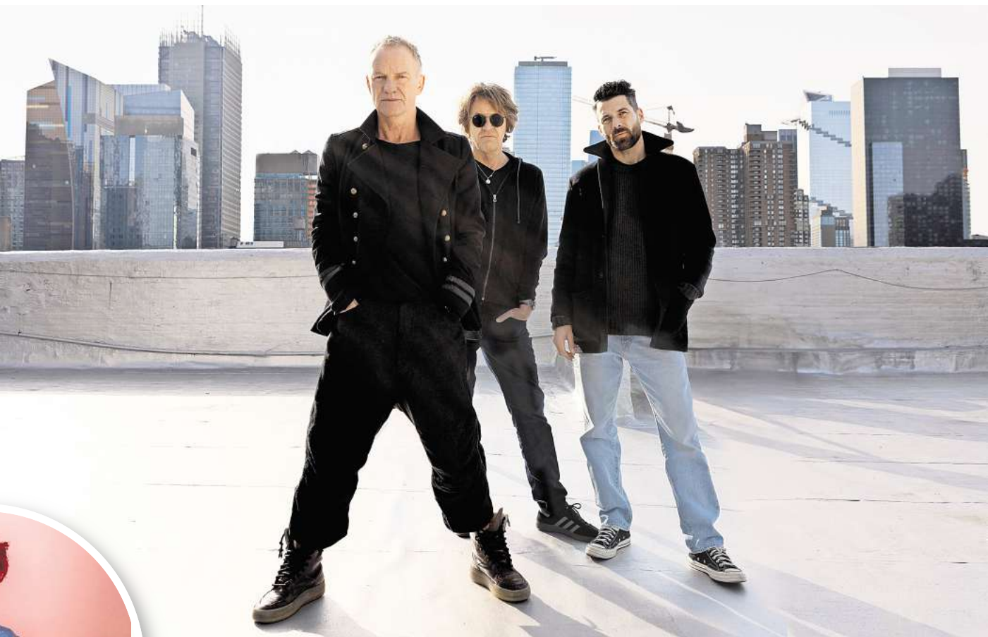
Weltstar Sting kommt zum Plaza Festival