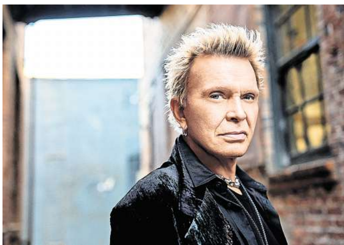
Billy Idol rockt am 18. Juni auf der Waldbühne Northeim