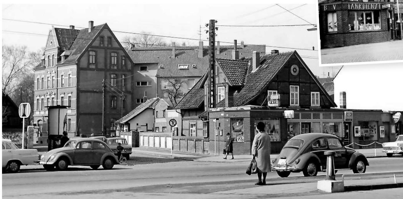
Die Hildesheimer Straße in Laatzens 1966: In dem Eckladen zur Kurzen Straße ist zu dieser Zeit das Geschäft von Foto Steiger.

Die wichtigen Hinweise zu diesen Zeitzeugnissen der Stadt Laatzens erhielt Schwanse bei den sogenannten Foto-Cafés. Ab 2023 hatte die Stadt dafür ausgewählte, mit der Stadtgeschichte und ihren Menschen vertraute Männer und Frauen ins Rathaus eingela-