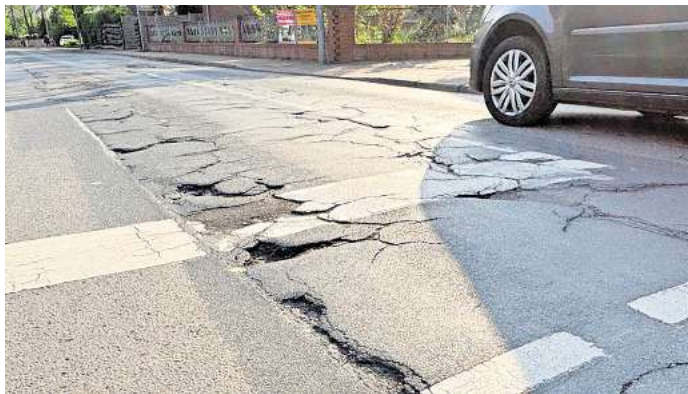
Marode: die Hauptstraße in Hiddestorf.