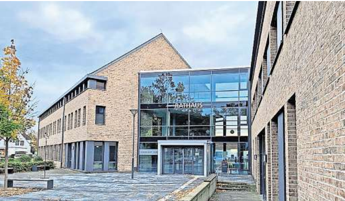
Wer sitzt ab Herbst 2026 an der Spitze des Pattenser Rathauses?