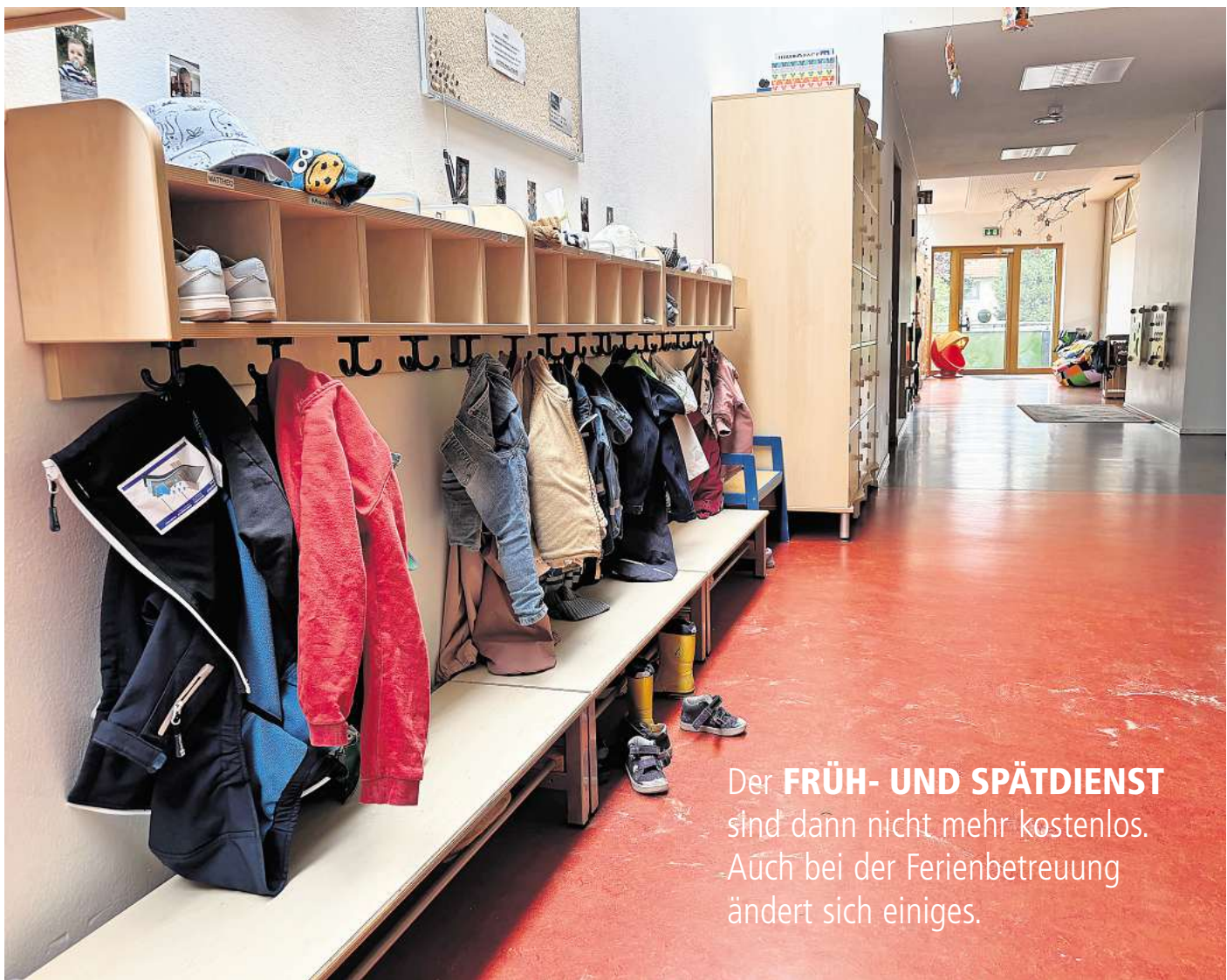
Die Krippe Arnummer Feldmäuse: Fotos mit Kindern sind aus datenschutzrechtlichen Gründen nicht möglich.

Zurzeit liegen die Kosten bei monatlich 93 Euro, künftig wären samt Ferienbetreuung 137 Euro im Monat zu zahlen. Im Ferien-