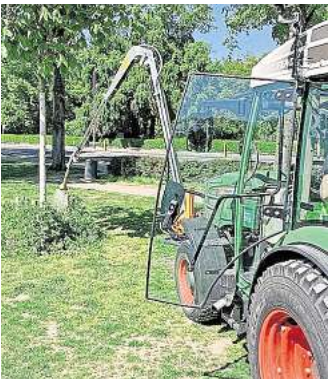
Mit der neuen Gießtechnik können in kürzerer Zeit mehr Stadtbäume bewässert werden.