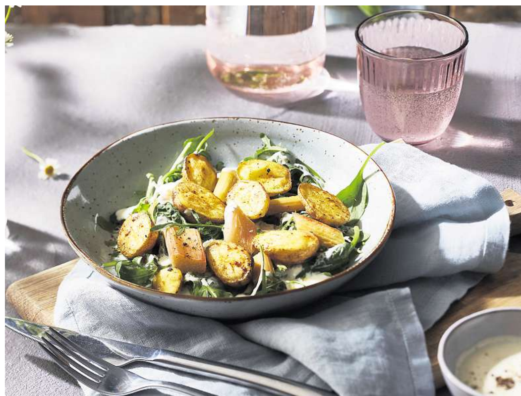
Kartoffel-Rhabarber-Salat bringt saisonale Abwechslung auf den Tisch.