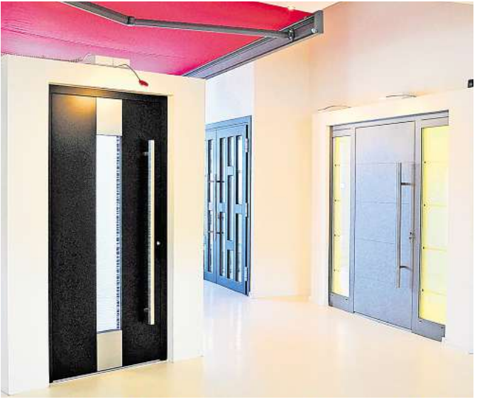
Fertigt hochwertige Türen und Fenster nach Maß: das Laatzen Fachunternehmen Robering.

Robering Angewandte Fenstertechnik Hamburger Straße 2 30880 Laatzen (Rethen) Telefon (0 51 02) 9 35 80 info@robering.com www.robering.com