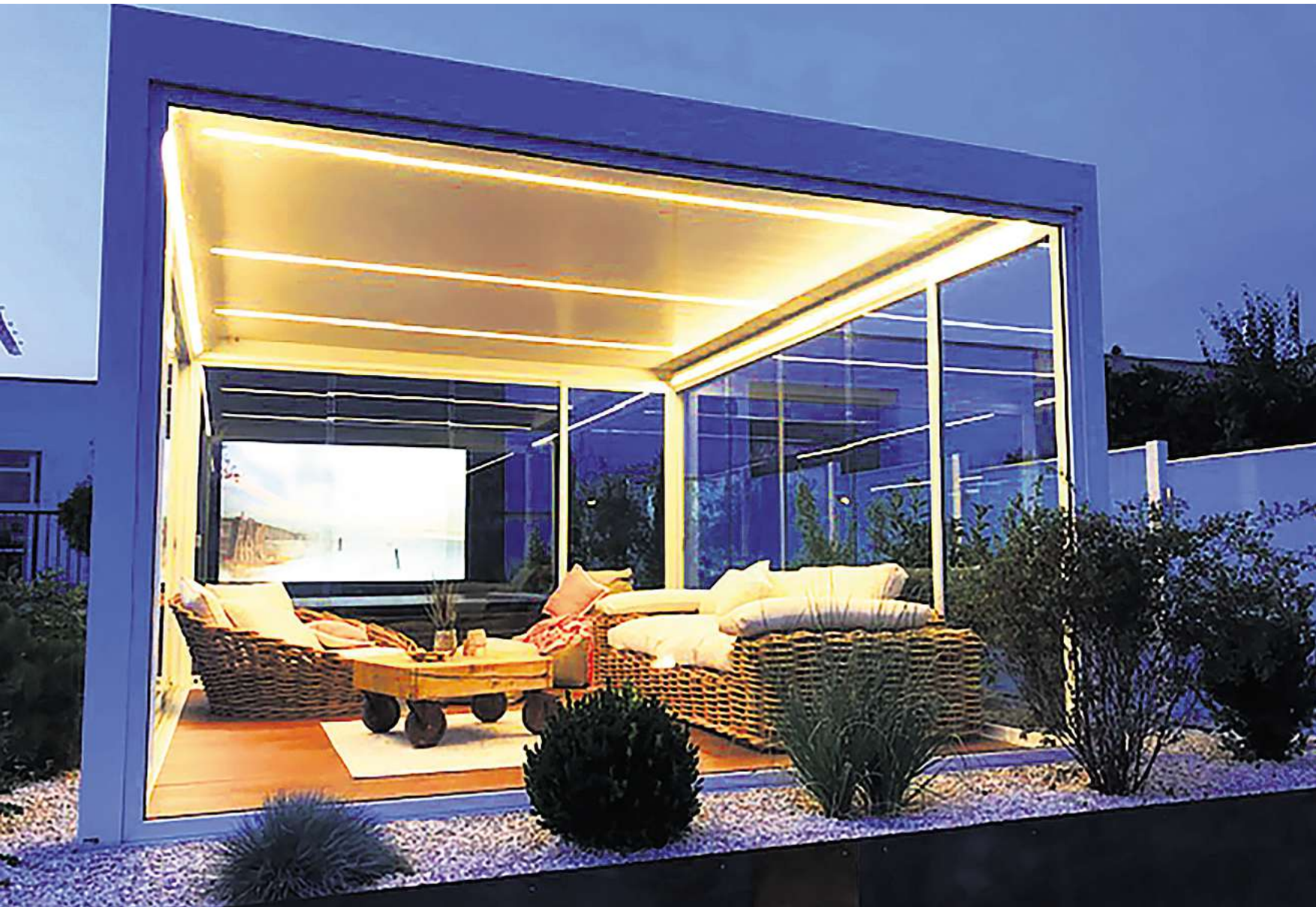
Kompetenter Ansprechpartner für Terrassengestaltung, Wintergärten und mehr: die Firma Robering.

Rethener Unternehmen setzt Maßstäbe mit selbstgefertigten hochwertigen Fenstern, Türen und mehr