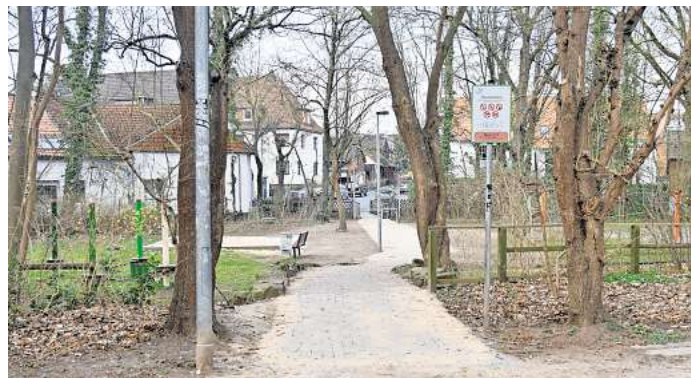
Den Zugang zum Rethener Park an der Schmiedestraße hat die Stadt vor kurzem neu pflastern lassen.

haltung unternommen. Vor Kurzem ist zudem der Eingangsbereich an der Schmiedestraße saniert worden. Dort hat die Verwaltungen für rund 27.000 Euro das Drängelgitter auf der Brücke entfernen lassen, um den Zugang zum Park für Menschen mit Mobilitätseinschränkungen und Kinderwagen zu erleichtern. Am Spielplatz wurde der Weg neu gepflastert, auch alte Waschbetonplatten ließ die Stadt entfernen. „Zusätzlich wird noch beidseitig des Weges eine Hecke gepflanzt, um den Bereich räumlich zu trennen und die Spielbereiche einzufrieden“, kündigt Stadtsprecherin Ilka Hanenkamp-Ley an. Auch die wasergebundene Wegedecke an der Kita will die Stadt noch in diesem Jahr verbessern. „Die Maßnahme wird intern durch den Betriebshof durchgeführt, genaue Kosten sind daher noch nicht zu benennen“, sagt die Stadtsprecherin. Der Zeitplan stehe noch nicht fest.