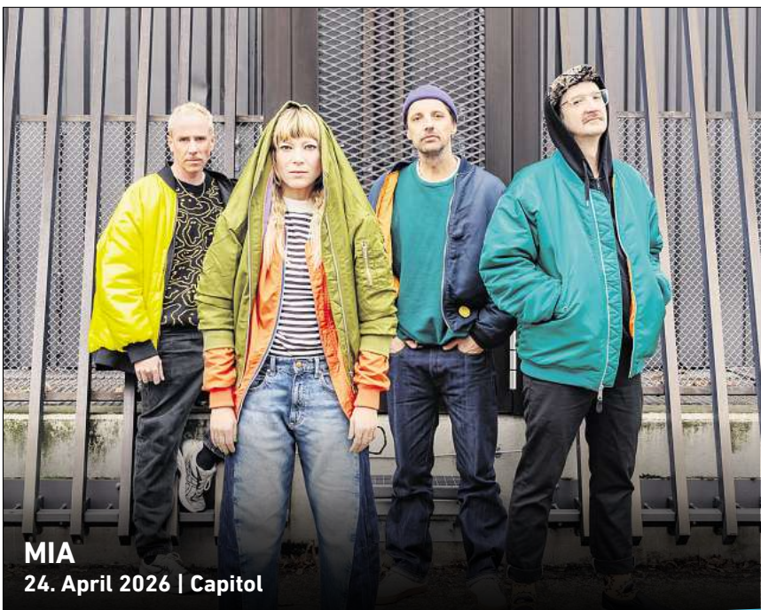
MIA 24. April 2026 | Capitol