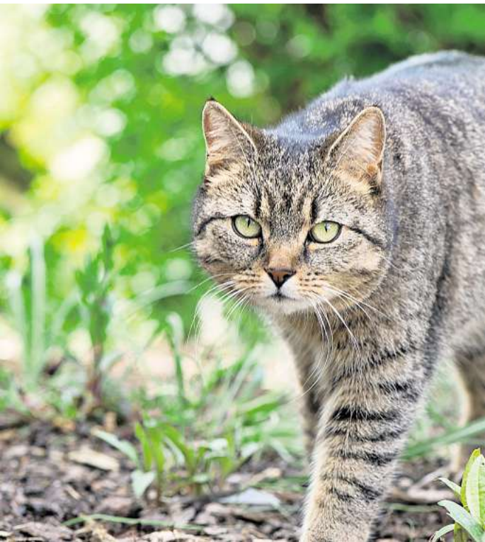
Ist die Bindung zum Heim gefestigt, bietet der Garten eine Möglichkeit für einen kontrollierten Freigang.

Für Halter und Halterinnen ist die Entscheidung das Tier aus dem Haus zu lassen, nicht einfach.