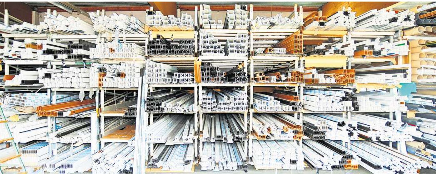
„Made in Laatzen“: Das Unternehmen Robering fertigt Fensterprofile mit System.