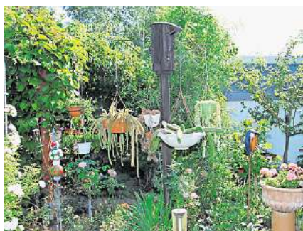
Angelika Gehring lädt ein.