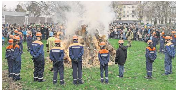
Die Jugendfeuerwehr entzündet das Osterfeuer in Arnum: Mehr als 1000 Menschen kamen nach Feuerwehrangaben 2024 in den Park.