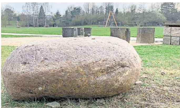
Soll bald wieder hängen: Der etwa 350 Kilogramm schwere Stein ist in der Nähe des Pendel-Bauwerks zwischengelagert worden.