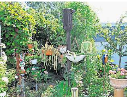
Angelika Gehring lädt ein.