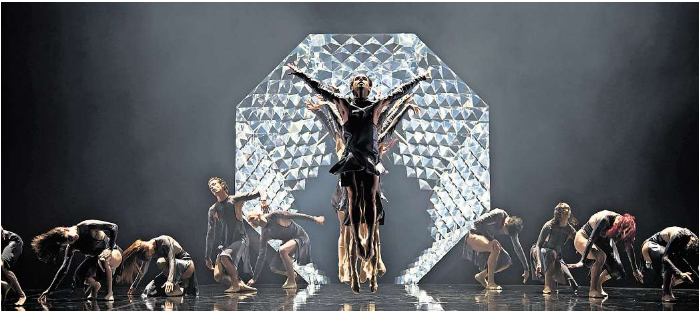
Das Staatsballett Hannover zeigt „Ikarus“.