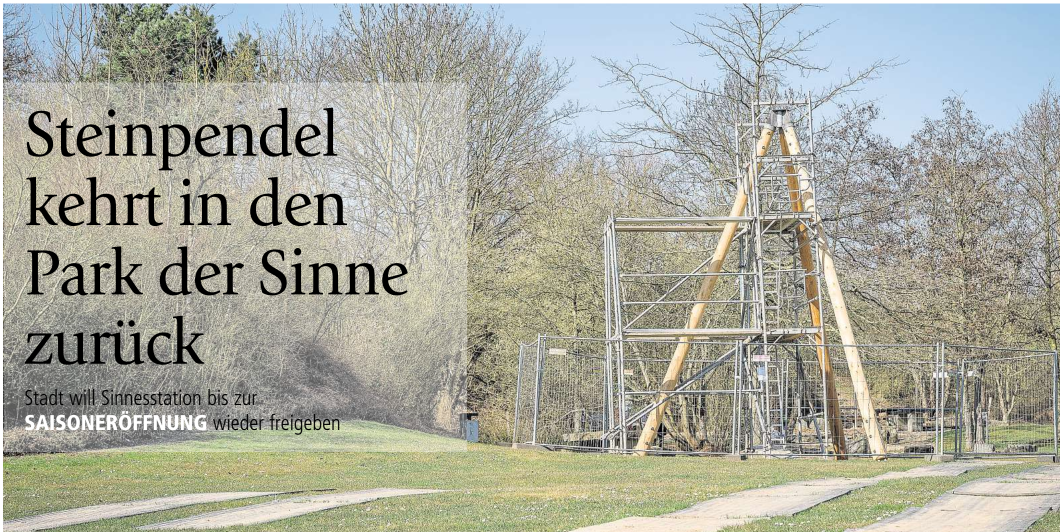
Der Dreifuß steht schon: Die Stadt lässt das Steinpendel im Park der Sinne erneuern.

Stadt will Sinnesstation bis zur SAISONERÖFFNUNG wieder freigegeben