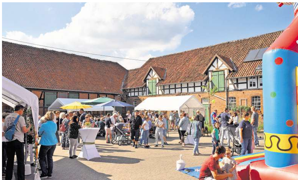
Volle Sitzbänke und Stimmung auf Schiefers Hof: Harkenbleck feiert mit mehr als 200 Besuchern den 36. Kapellentag.

Neben der Pflege zum Beispiel des Kapellengartens – Termin dafür ist am 20. September ab 9 Uhr angesetzt – bindet die Organisation und Betreuung von Veranstaltungen viel Zeit und Kraft. Der Kapellentag, sonst im Juni,