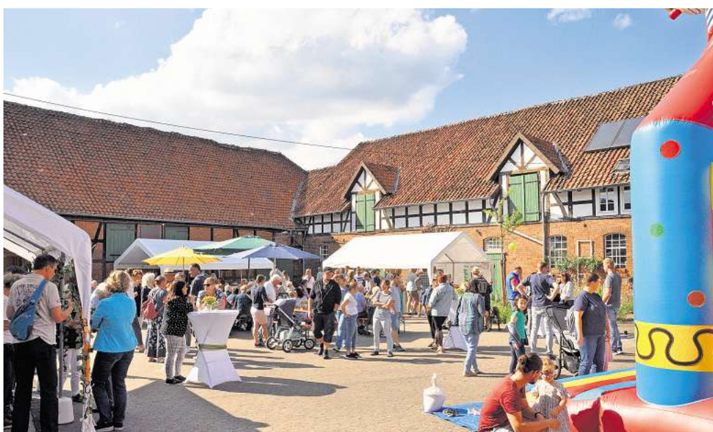
Volle Sitzbänke und Stimmung auf Schiefers Hof: Harkenbleck feiert mit mehr als 200 Besuchern den 36. Kapellentag.

Neben der Pflege zum Beispiel des Kapellengartens – Termin dafür ist am 20. September ab 9 Uhr angesetzt – bindet die Organisation und Betreuung von Veranstaltungen viel Zeit und Kraft. Der Kapellentag, sonst im Juni,