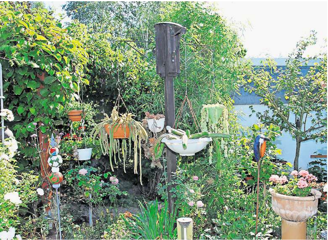
Angelika Gehring lädt zum Besuch ihres "Gartenparadieses" ein.