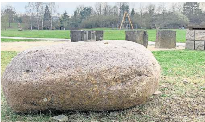
Soll bald wieder hängen: Der etwa 350 Kilogramm schwere Stein ist in der Nähe des Pendel-Bauwerks zwischengelagert worden.

che Experimente allerdings verzichten, weil die Stadtverwaltung den Stein aus Sicherheitsgründen hatte entfernen lassen. Grund waren morsch gewordene Stämme, wie Stadtsprecherin Ilka Hanenkamp-Ley erläutert.