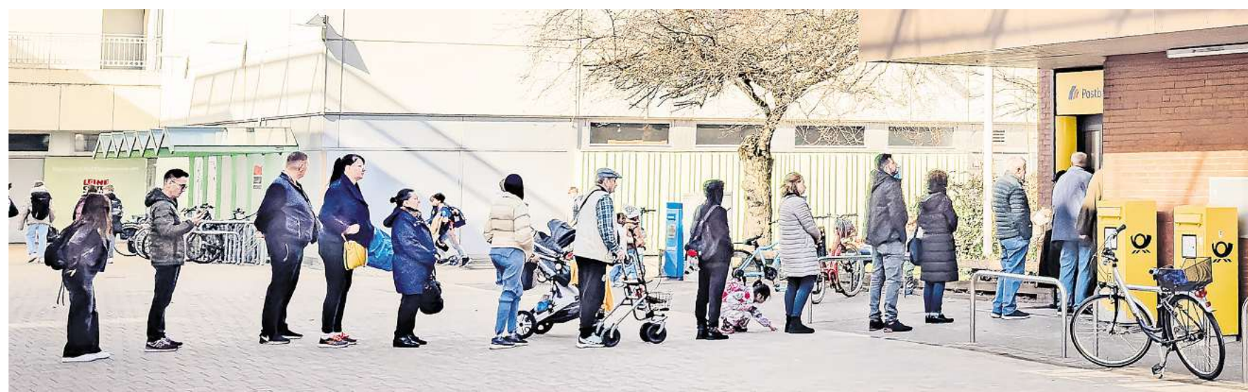
Vor der Filiale der Post an der Robert-Koch-Straße in Laatzen-Mitte bilden sich mitunter lange Warteschlangen.

„Es ist nicht erträglich, dass die Filiale zu den ganz normalen Geschäftszeiten geschlossen