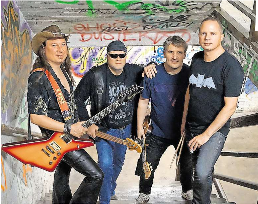
Hard'n Blue liefern erstklassige Classic Rock-Coverversionen. Absolut partytauglich!