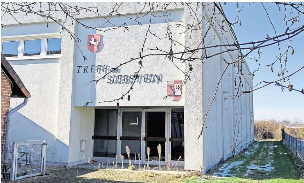
Inzwischen mehr als 50 Jahre alt: Die Mehrzweckhalle in Harkenbleck.

Das Feuer war seinerzeit im Geräteraum der 1974 errichteten Halle ausgebrochen und hatte sich auf das übrige Gebäude ausgebreitet. Geschätzter Schaden: rund 1,7 Millionen Euro. Der geplante Neubau ist um ein Vielfaches teurer. Die Stadt will mehr als 9 Millionen Euro investieren, obwohl es bis jetzt noch keine Zahlung von der Gebäudeversicherung gibt.