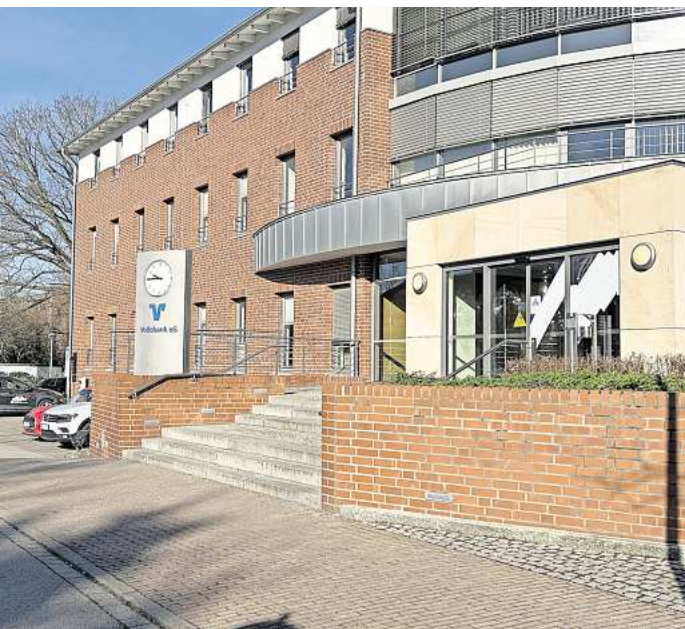
Nach wiederholtem Vandalismus am Eingangsbereich: Wird die Volksbank-Filiale in Pattensen-Mitte zukünftig videoüberwacht?

Welchen besseren Schutz kann es geben? Das Gebäude befindet sich in der Pattenser Altstadt an der Heinz-Goltz-Straße und Marienstraße. In den Abend- und