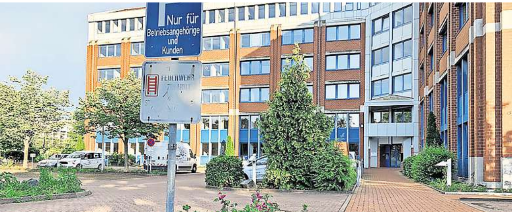
Als Alternative im Gespräch ist ein Zusammenziehen der Stadtverwaltung an der Gutenbergstraße.

Hinter den Kulissen wird derzeit über mehrere Varianten gesprochen. Die teuerste wäre eine Verlegung der Stadtverwaltung zur Rentenversicherung. Das Rathaus würde dann abgerissen, für das Gebäude Gutenbergstraße müssten eine neue Nutzung oder ein Verkauf geprüft werden. Als Alternative im Gespräch ist ein Zusammenziehen der Stadtverwaltung an der Gutenbergstraße. Wenn der Platz dort nicht für alle Mitarbeiterinnen und Mitarbeiter ausreicht, müsste die Stadt entweder zusätzliche Räume anmieten oder auf einen Anbau setzen. Der könnte entweder auf dem bestehenden Parkplatz vor dem Gebäude oder auf dem Gelände des benachbarten, weitgehend ungenutzten Parkdecks entstehen. Ein weiteres Problem: Die von Bürgermeister Kai Eggert (parteilos) angestrebten neuen Arbeitswelten mit größeren Büroflächen und ohne feste Zuord-