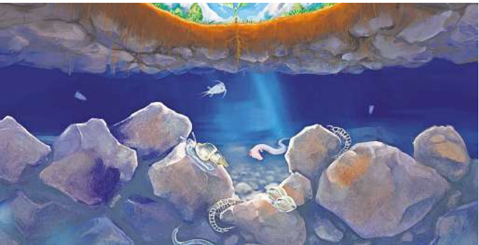
Das Landesmuseum zeigt die Ausstellung „Grundwasser lebt – ein verborgener Kosmos“.

Zum Weltwassertag am Sonn-abend, 22. März, gibt es im Fa-milienprogramm des Landes-museums einige besondere Ak-tionen. In der Zeit von 12 bis 17 Uhr stellen sich lokale Institutio-nen wie Ökostadt e.V., Enercity AG, der Grundwasserschutz oder die Stadtentwässerung der Stadt Hannover vor. Sie bieten am „Internationalen Tag des Wassers“ der Vereinten Natio-nen (UN) einen Einblick in die