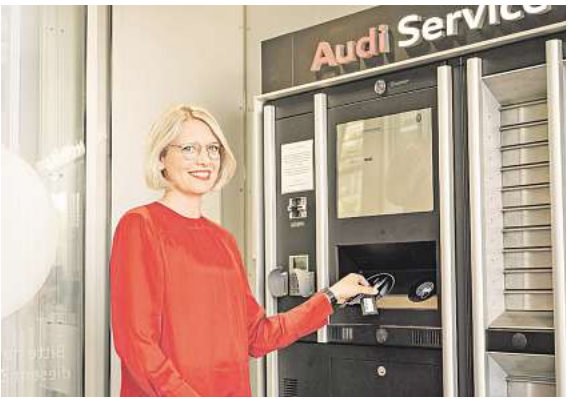
Eine 24-Stunden Audi Service Station wird es weiterhin geben. Hier kann man rund um die Uhr abgeben, abholen, mieten und bezahlen.