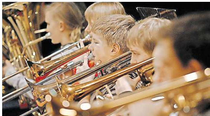
Trompeten, Rock und mehr: Die Musikschule Laatzen lädt von Freitag bis Sonntag, 21. bis 23. März, zu mehreren Konzerten ein.

Zudem denkt das Gymnasium über smartphonfreie Zonen nach. Sie könnten zum Beispiel in der Pausenhalle, der Mensa oder im Ganztagsraum eingerichtet werden. Eine Arbeitsgruppe, an der auch Schülerinnen und Schüler mitwirken, soll die Regelungen konkretisieren.