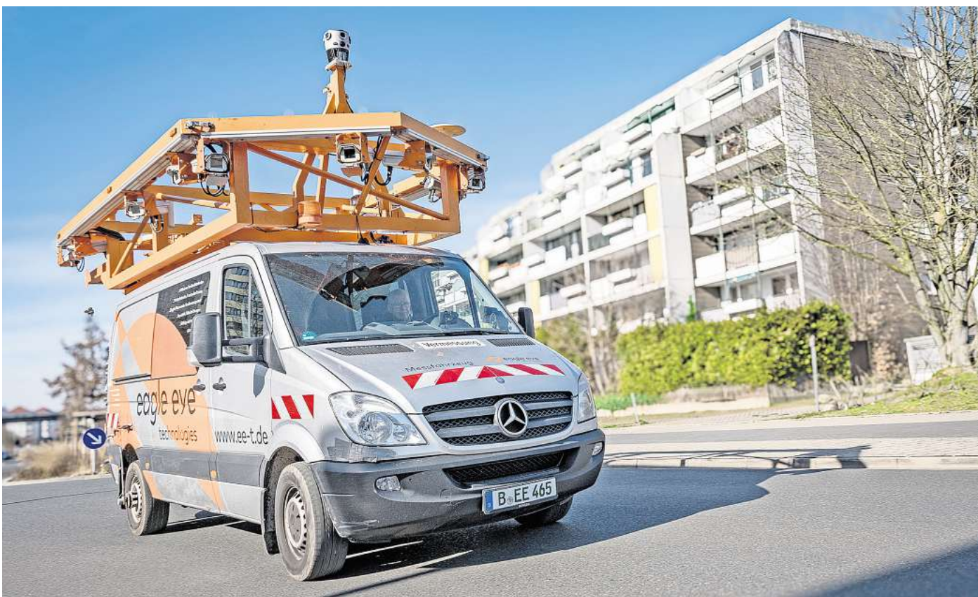
Das Vermessungsfahrzeug Eagle Eye erstellt mithilfe von Bild- und Laserkameras ein 3D-Abbild der Laatzen Infrastruktur.