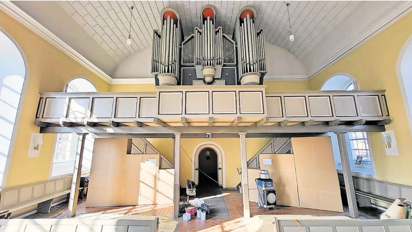
Vorarbeiten und Modell für Kolumbarium: Die zum Mittelgang abgestufte Urnenwand soll ab Juni unter der Empore von St. Marien stehen.