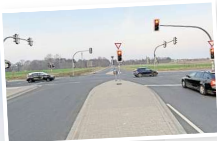
Die unfallträchtige Kreuzung B3/L389 mit Blick in Richtung Arnum: Der Linkspfeil, der bisher blinkte, befindet sich dort, wo links im Bild die Fußgängerampel auf Rot steht.

2024 gegen 19.20 Uhr. Drei Menschen zogen sich leichte Verletzungen hinzu. Laut Polizei fuhr der 52-Jährige aus Freden bei Alfeld mit seinen beiden 13-jährigen Töchtern in einem Opel aus Richtung Pattensen kommend auf der Bundesstraße und wollte geradeaus in Richtung Hannover weiterfahren. Eine 18-Jährige aus Arnum war in einem VW Touran auf der Hauptstraße aus Richtung Hiddestorf unterwegs, fuhr in die Kreuzung, wollte geradeaus weiterfahren und nahm dem 52-Jährigen die Vorfahrt. Die Ampel an der Kreuzung war zu dem Zeitpunkt ausgefallen.