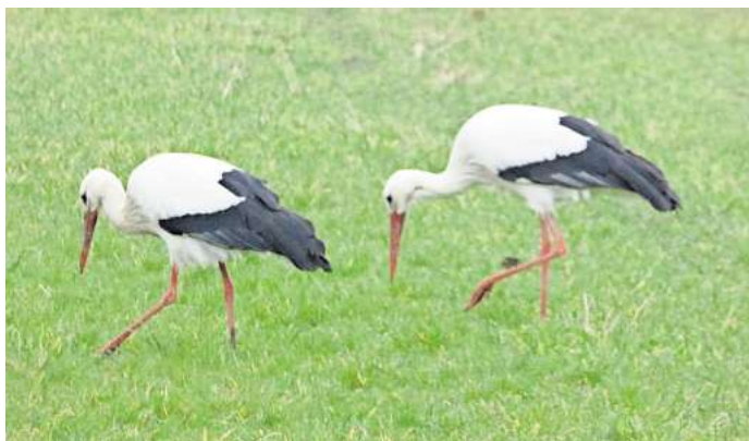
Rückkehr des Storchpaares: Die "Hilde" (links) und "Paulchen" genannten Altvögel suchten dieser Tage bereits Nahrung auf den Äckern nahe dem Plinkengang.