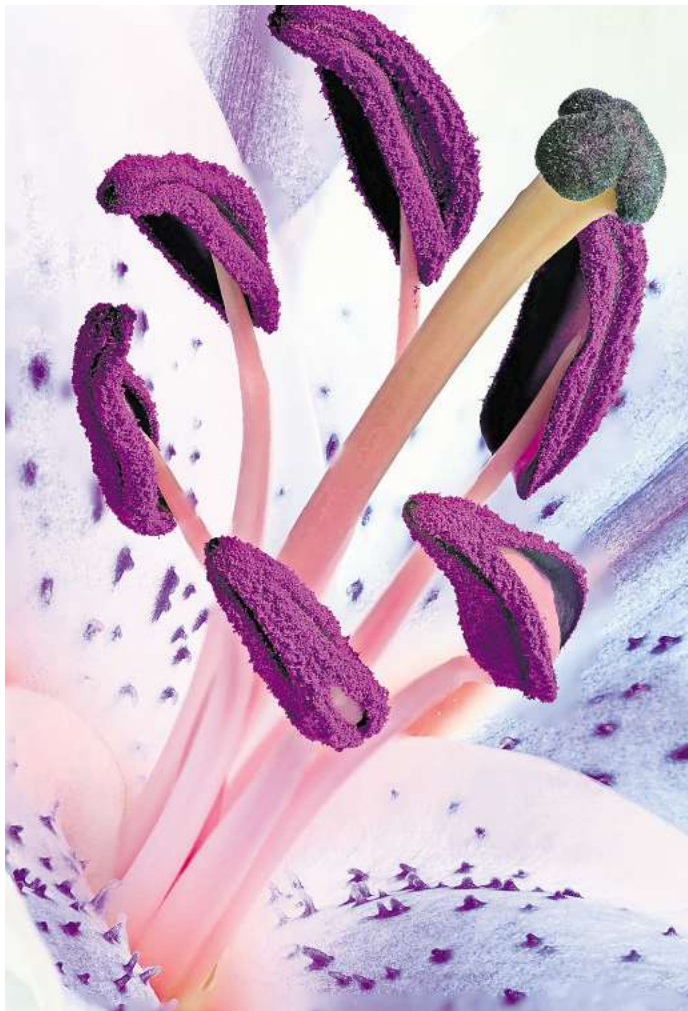
Mithilfe von Pollen können sich Pflanzen vermehren.