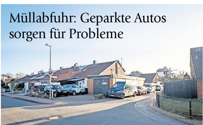
An der Straßenecke Flinsberger Weg / Köllnbrinkweg werden oft Autos in der Einmündung abgestellt. Die Fahrzeuge des Abfallsorgers Aha haben deshalb Problem, in die Straße einzubiegen.

► Buchstabensuppe Eine Zwiebel schälen und in kleine Würfel schneiden. Einen Porree in der Hälfte durchschneiden, ihn unter fließendem Wasser abspülen, in feine Streifen schneiden und dann zur Zwiebel geben. Das weitere Gemüse – zwei Möhren, eine Pastinake, ein Viertel Sellerie und eine halbe Paprika – waschen, schälen, putzen und in kleine Stücke schneiden. Zwei Esslöffel Bratöl in einen Topf geben und so zunächst die Zwiebel-Porree-Mischung anbraten. Das andere Gemüse dazu geben und alles gemeinsam ein bis zwei Minuten anbraten. Anschließend 500 Gramm passierte Tomaten sowie einen Liter Wasser in den Topf dazugeben, außerdem einen Esslöffel Gemüsebrühe. Die Suppe nun zum Kochen bringen. Dann den Herd so herunterstellen, dass die Suppe rund 15 Minuten lang dauerhaft blubbert. Nun erst die Buchstabennudeln dazugeben und die Suppe weitere fünf Minuten kochen lassen. Am Ende noch etwas geschnittene Petersilie auf die Suppe geben und mit Pfeffer und Salz abschmecken. ► Fruchtiger Schlemmerquark 250 Gramm Magerquark und 75 Milliliter – etwa eine halbe kleine Tasse – Milch in eine Schüssel geben und mit dem Schneebesen gut durchrühren. 400 bis 500 Gramm Obst – nach Wahl Äpfel, Bananen, Birnen oder Mandarinen – waschen und abtropfen lassen, nach Bedarf schälen und kleinschneiden. Bananen möglichst klein schneiden, damit sie den Quark süßen. Obst in den Quark geben und alles umrühren. Nur wenn nötig, noch mit ein wenig Zucker oder Agavendicksaft etwas nachsüßen.