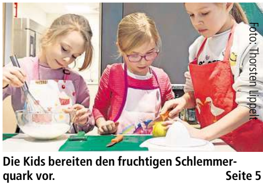
Die Kids bereiten den fruchtigen Schlemmerquark vor.