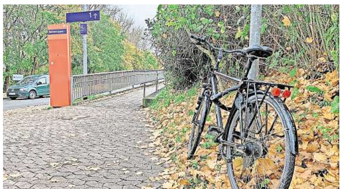
Im Frühjahr sollen drei überdachte Abstellflächen für Fahrräder am Bahnhof Rethen entstehen.

Das kann sich Müller auch nicht erklären. „Wir haben von Beginn an immer wieder darauf hingewiesen, dass dies auf die Eigentümer zukommt“.