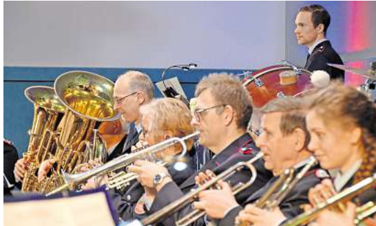
Der Musikzug Hiddestorf/Ohlenhof spielt ein Frühjahrskonzert im neuen Feuerwehrgerätehaus.

Das kommende Konzert beginnt am Sonntag, 29. März, um 18 Uhr im Feuerwehrhaus, an der Feuerwehr 1, in Hemmingen-Westerfeld. Die Veranstaltung ist kostenlos. Wegen der begrenzten Platzzahl werden je-