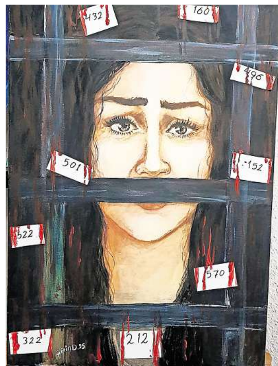
Aus der Ausstellung in der Marktkirche – Sherin Dawoud: „Keine Menschen, sondern Zahlen“, 2025.

Musik und Frauenrechte treffen auch bei der Veranstaltung „Femme*tastic“ in der Bürgerschule / Stadtteilzentrum Nord-