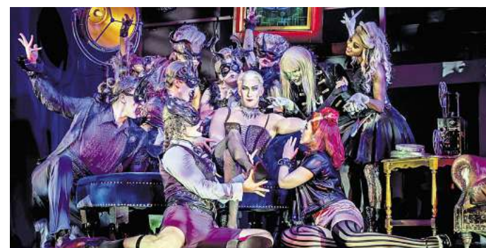
Der schrille Dr. Frank N. Furter feiert mit seinem Gefolge eine besondere „Geburtstagsparty“.