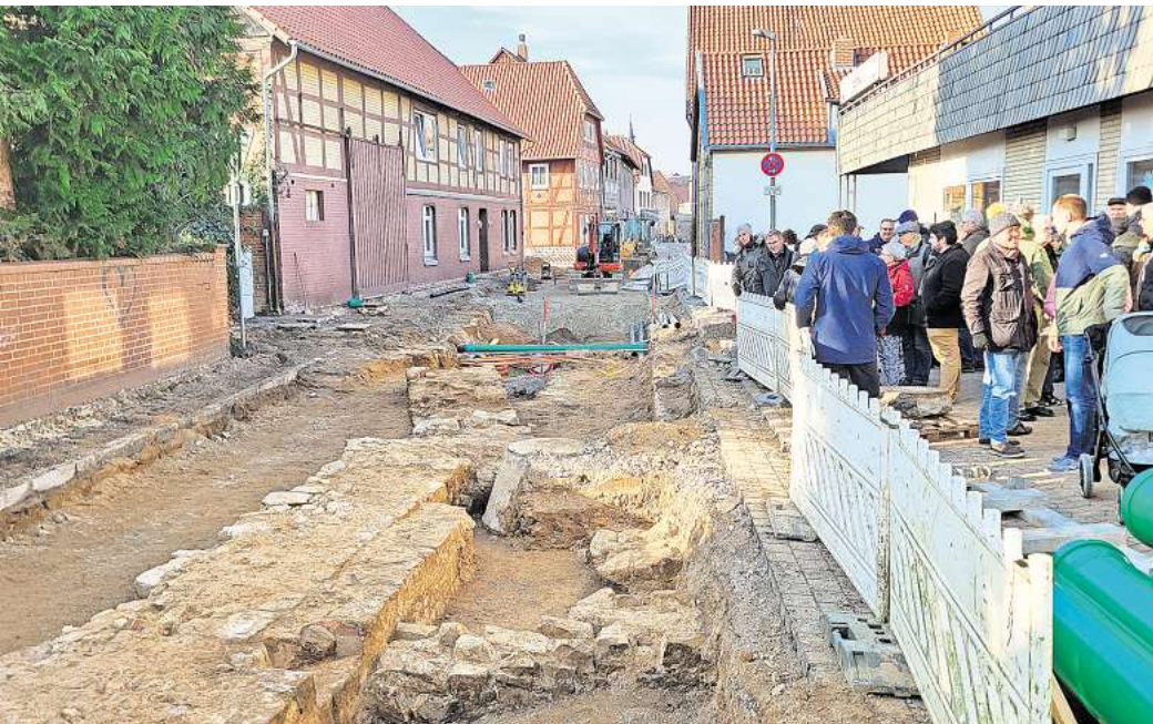
Schlusspunkt: Mit den Arbeiten an der Steinstraße soll das Sanierungsprojekt 2025 beendet sein.

Die Arbeiten an der Steinstraße, der letzten dieses Mammutprojektes, sind seit Sommer 2024 im Gange und sollen im Laufe dieses Jahres abgeschlossen werden. Über Sinn und Unsinn wurde vorab ausgiebig gestritten. Dabei bildeten sich zwei Lager: Die einen bezeichneten die Sanierung als unnötig, weil die Straße oberflächlich noch in einem guten Zustand sei. Befürworter verwiesen dagegen darauf, dass die Rohrleitungen unter der Straße ohnehin zeitnah erneuert werden müssten. Schließlich erhielt das Projekt politisch eine Mehrheit. Anlieger fürchten eine Minderung der Attraktivität, weil Parkplätze wegfallen.