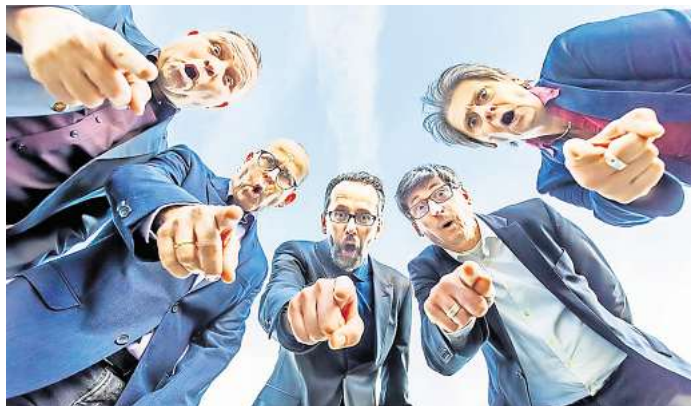
Erklären das Weltgeschehen: Störfall.