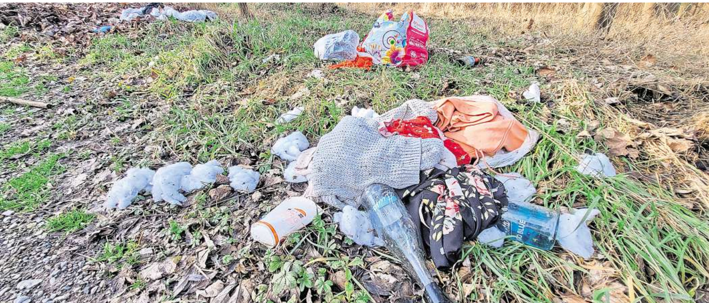
Schon wieder wurde an den Koldinger Seen illegal Müll abgeladen.