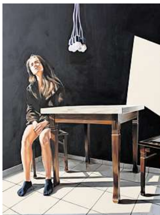
Lillien Grupe: „Die Suche nach sich selbst“, 2019. Öl und Acryl auf Leinwand.