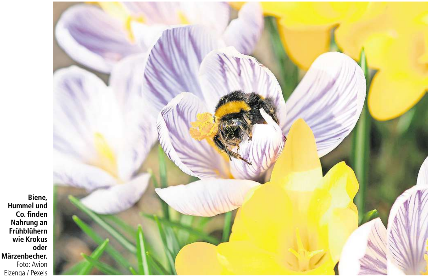
Biene, Hummel und Co. finden Nahrung an Frühblühern wie Krokus oder Märzenbecher.