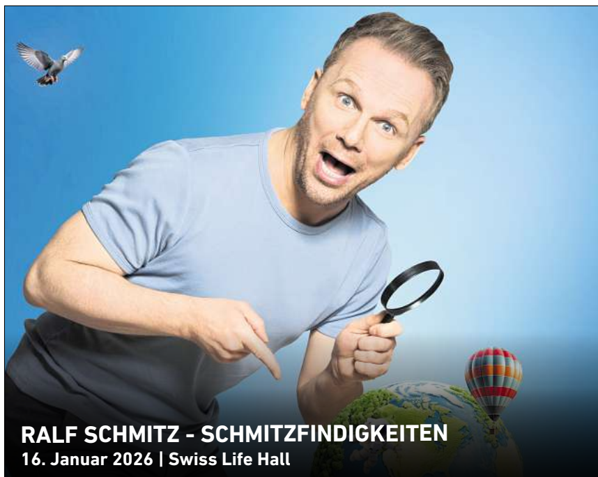
RALF SCHMITZ - SCHMITZFINDIGKEITEN 16. Januar 2026 | Swiss Life Hall

In den HAZ & NP Geschäftsstellen Hannover, Lange Laube 10 Neustadt, Am Wallhof 1 Burgdorf, Marktstraße 16 Langenhagen, im CCL, Marktplatz 5 Theater am Aegi, Aegidientorplatz 2