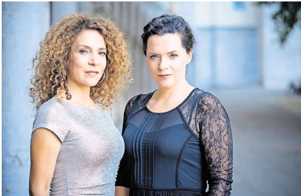
Kommt im April nach Hemmingen: das Duo Pariser Flair.

In besonderer Erinnerung bleibt aus dem vergangenen Jahr auch die Varieté-Show an einem Oktoberwochenende zum 25-jährigen Bestehen des Kulturzentrums vor insgesamt 600 Gästen. So erfolgreich die Doppelshow im KGS-Forum auch war, so war sie doch sehr aufwändig für die rund 30 fast ausschließlich ehrenamtlichen Mitglieder, die den bauhof-Betrieb am Laufen halten. Varieté-Elemente würden aber auch 2025 wieder bei vielen Veranstaltungen auftau-