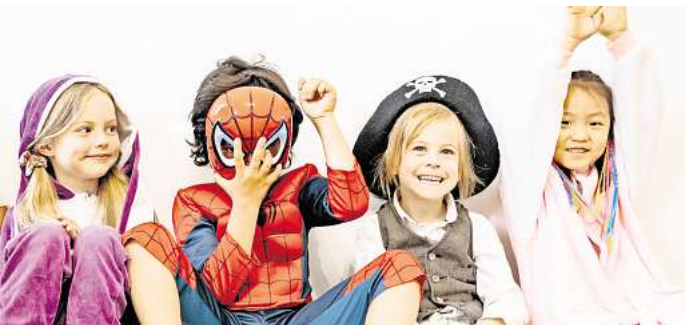
Auf zum Verkleiden: Der Kinderkarneval wird gefeiert.

Am Freitag, 21. Februar, findet im Stadtteilzentrum Ricklingen, Anne-Stache-Allee 7, ab 16 Uhr die beliebte Faschings-Kinder-Disco statt. Kinder ab sechs Jahren sind (gerne kostümiert) zum Tanzen und Spielen willkommen. Der Eintritt kostet 5 Euro, mit Aktivpass 50% Ermäßigung. RHR