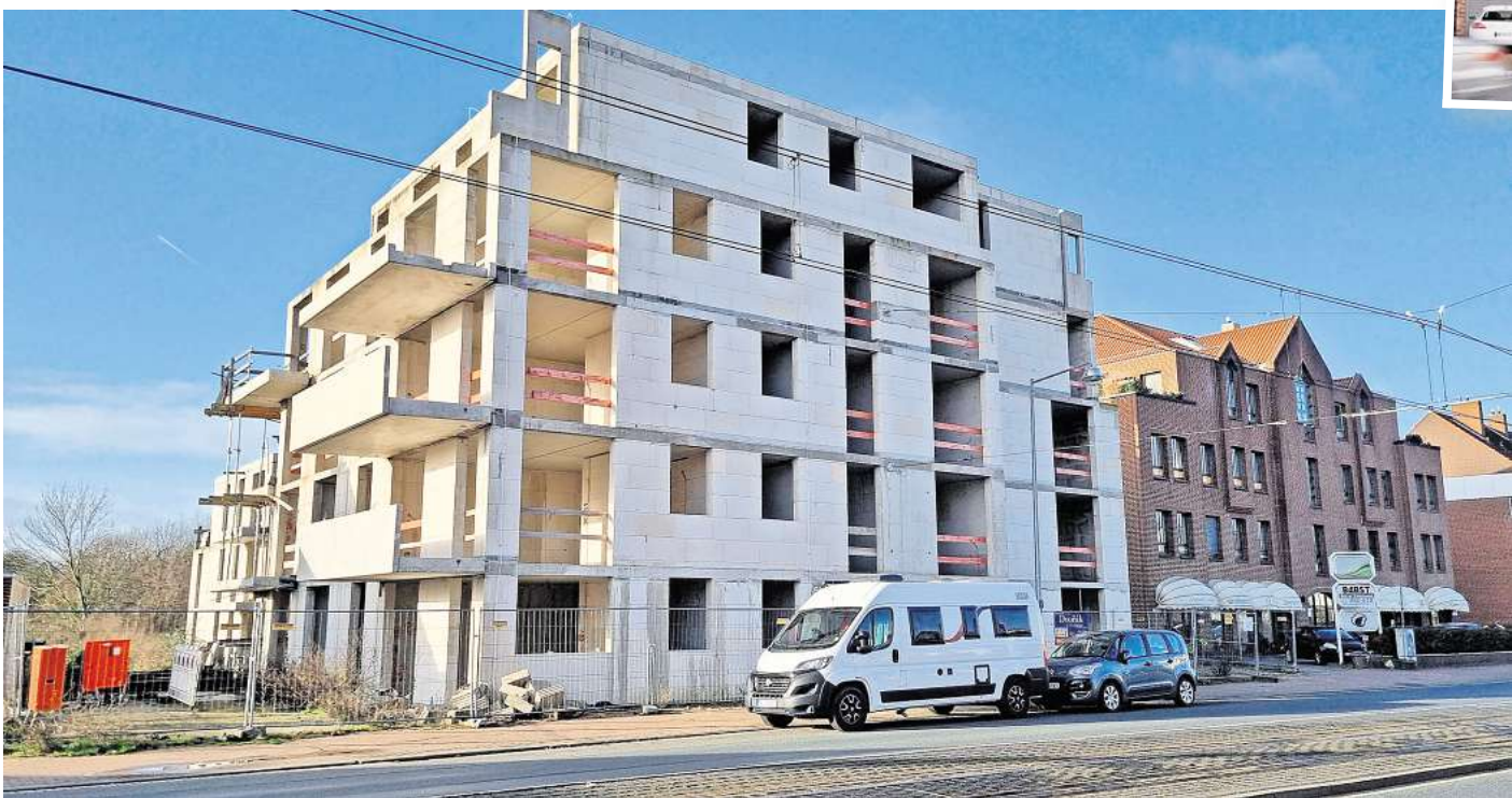
Im Frühjahr soll es weitergehen: Seit 2023 ruhen die Bauarbeiten beim Wohnungsbauprojekt an der Hildesheimer Straße in Grasdorf.