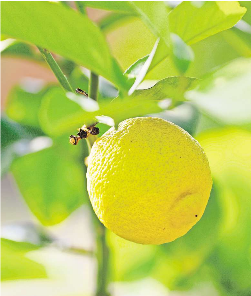
Das „Citrus-Fest“ in der Orangerie stellt die kostbaren Früchte, einst als „goldene Äpfel der Hesperiden“ gefeiert, in den Fokus: mit kulinarischen Genüssen, Foto: Stefan Schulze

350 Jahre Großer Garten Herrenhausen werden das ganze Jahr über gefeiert: Das Sommerfest am 23. August mit zahlreichen Partnerern, darunter die Volkswagen Stiftung, SEA LIFE Hannover, das Museum Wilhelm