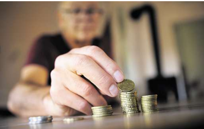
Im Vorsorge-Spezial der Neuen Presse und der Hannoverschen Allgemeinen Zeitung geht es auch um finanzielle Altersabsicherung.

Folgende Schwerpunkte wurden dafür gesetzt: Vom 17. bis 22. März dreht sich alles um Ver-