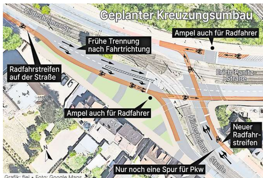
Grafik: flei • Foto: Google Maps

„Die Kreuzung ist von Regionsseite komplett schlecht ge-