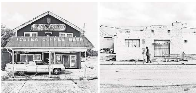
Die GAF zeigt Fotografien von Peter Rathmann.

Geöffnet ist die GAF Donnerstag bis Sonntag von 12 bis 18 Uhr bei freiem Eintritt. RED