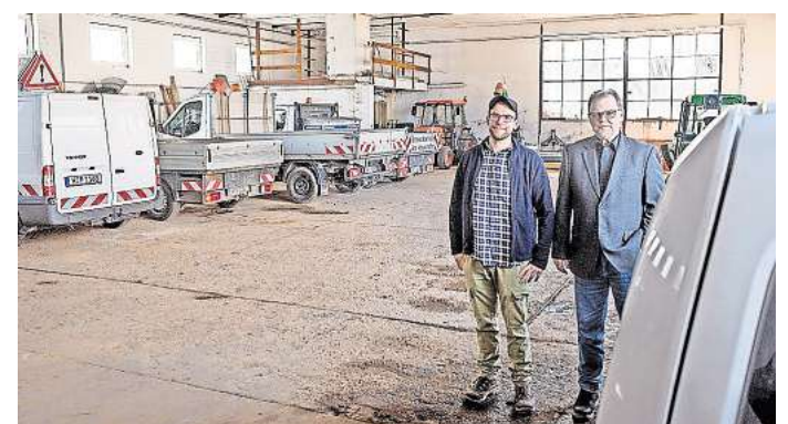
Die Fahrzeughalle des Stadtbetriebshofs

Während der Prüfung wurden auch die Städte Hemmingen und Laatzen befragt, ob sie sich möglicherweise eine interkommunale Zusammenarbeit der Betriebshöfe vorstellen könnten. Beide lehnten ab. Die Stadt Laatzen verwies darauf, dass die Strukturen und damit auch die Bedürfnisse der Kommunen doch sehr unterschiedlich seien.