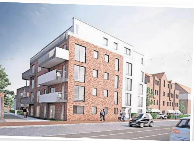
So soll das Vorderhaus - von der Hildesheimer Straße aus gesehen - einmal aussehen.

nanzierung stehe „bombenfest“. Altlasten im Zusammenhang mit dem bisherigen Eigentümer gebe es nicht. Für ihn ge-