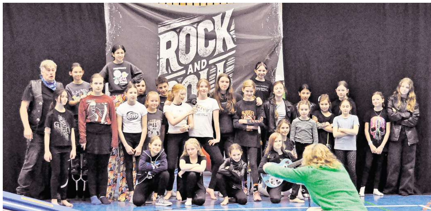
Mit Selbstvertrauen und Teamgeist: 26 Schulkinder sind im Zirkus Kunterbunt bei der aktuellen Show dabei.