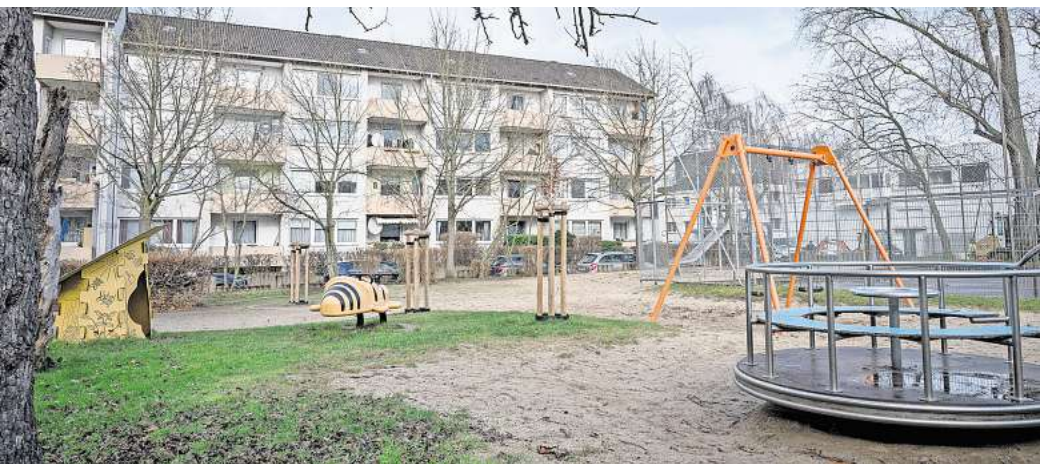
Eine Bank, ein paar Spielgeräte, eine kleine Hütte und ein Bolzplatz. Viel mehr Aktionsmöglichkeiten gibt es nicht auf dem Spielplatz am Margeritenweg in Alt-Laatzen.

LAATZEN. Etwas trostlos sieht er aus, der Spielplatz am Margeritenweg an der Kreuzung zur Birkenstraße. Eine Schaukel, eine Rutsche und einen Sitzkreisel gibt es neben dem Bolzplatz. Ein paar Meter davon entfernt stehen noch ein Wipptier, ein kleines gelbes Häuschen sowie eine einzelne Bank. Das war es auch schon an Spiel- und Aufenthaltsmöglichkeiten in dem Mischgebiet an der Kreuzung zur Birkenstraße, zwischen mehrstöckigen Wohnhäusern und Gewerbegebäuden. Die Anwohner wünschen sich mehr. Sie wollen, dass dort ein Begegnungsort entsteht.