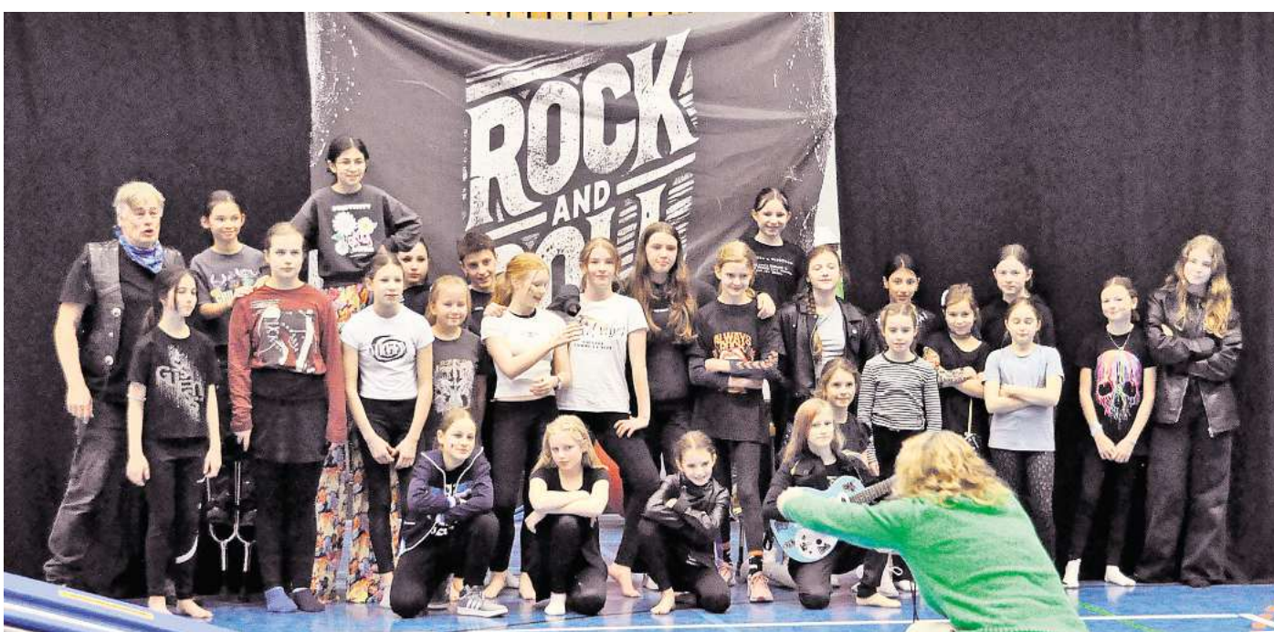
Mit Selbstvertrauen und Teamgeist: 26 Schulkinder sind im Zirkus Kunterbunt bei der aktuellen Show dabei.