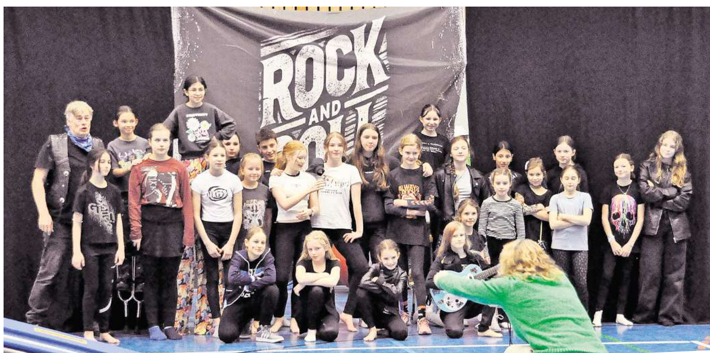
Mit Selbstvertrauen und Teamgeist: 26 Schulkinder sind im Zirkus Kunterbunt bei der aktuellen Show dabei.