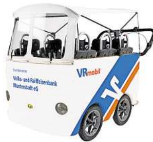
So sieht der Kinderbus aus.

für sechs Kinder im Alter von bis zu 4 Jahren. Er verfügt über ein Verdeck als Sonnen- und Regenschutz, eine Gepäckablage sowie verstellbare Sitze und Schiebbügel. Neu ist die praktische Mitlaufeile, an der sich die größeren Kinder festhalten können. Somit ist der Bus für kleinere Trips in die Umgebung bestens geeignet.