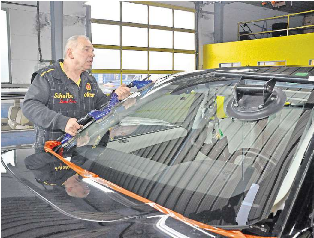
Nach dem Scheibeneinbau müssen die Fahrerassistenzsysteme neu kalibriert werden.