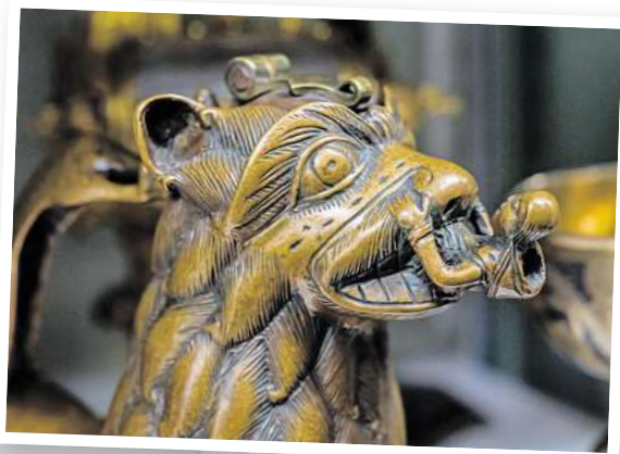
Ein Türzieher aus der Marktkirche.

und als Bausätze verkauft“, sagt sie. Eines der Highlights ist das sogenannte Nazarius-Relief aus Elfenbein, das aus dem hessischen Kloster Lorsch kommt. „Vermutlich war es einmal Teil eines Bucheinbandes“, sagt Brandt. Fast putzig mutet ein Aquamanile an: Das bronzene Gießgefäß aus dem 12. Jahr-