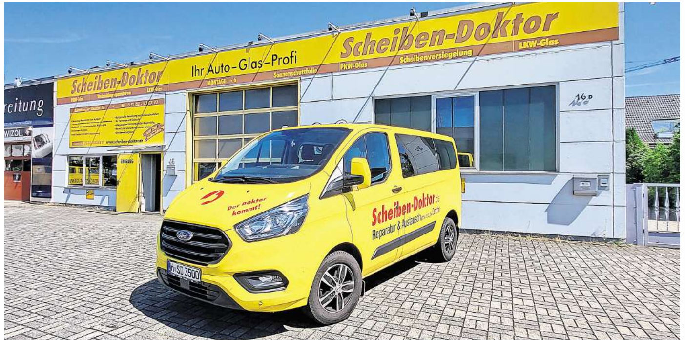
Erster Ansprechpartner für schnelle Hilfe bei Steinschlag ist der Scheiben-Doktor in Laatzen-Rethen.