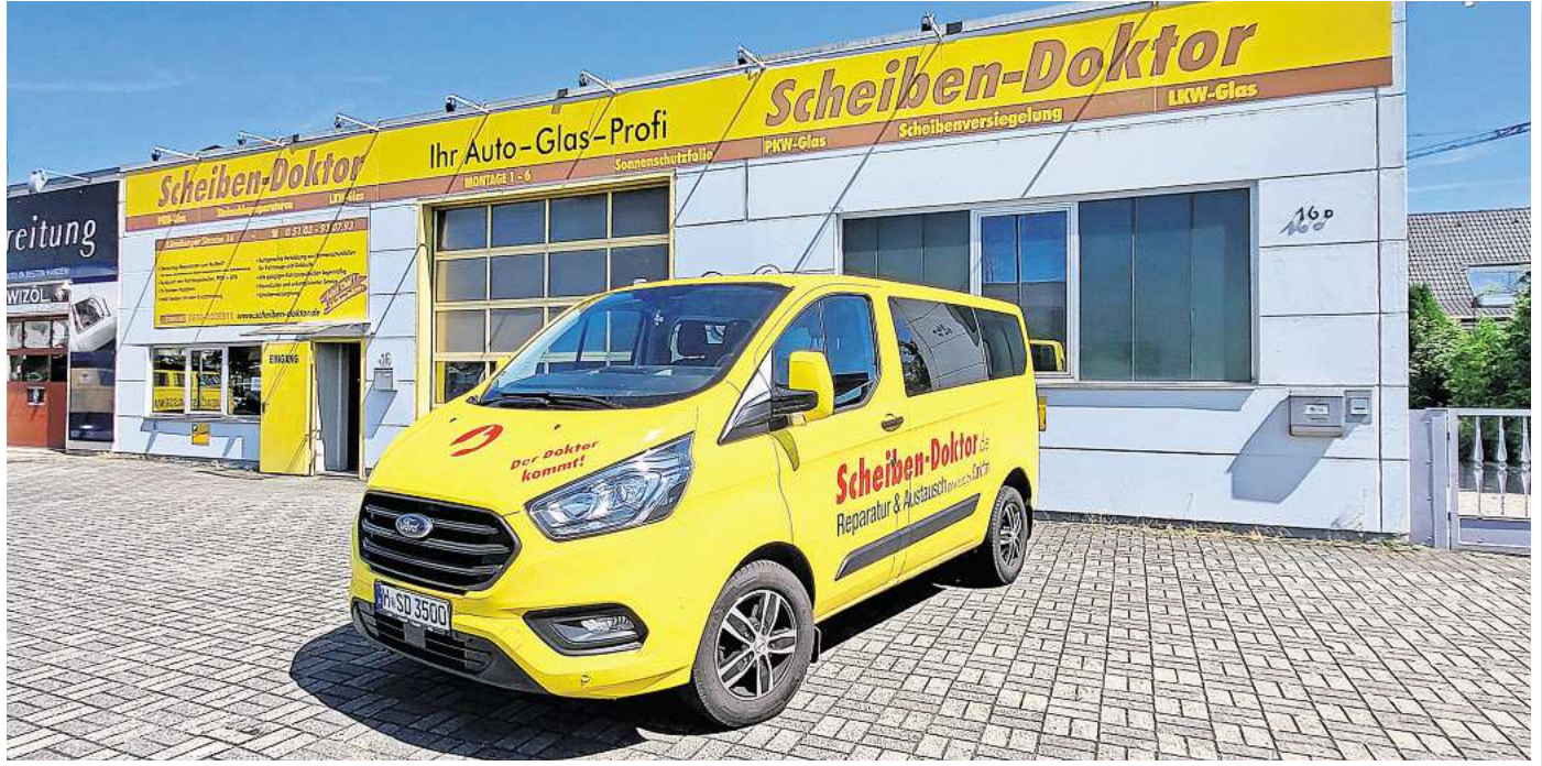
Erster Ansprechpartner für schnelle Hilfe bei Steinschlag ist der Scheiben-Doktor in Laatzen-Rethen.