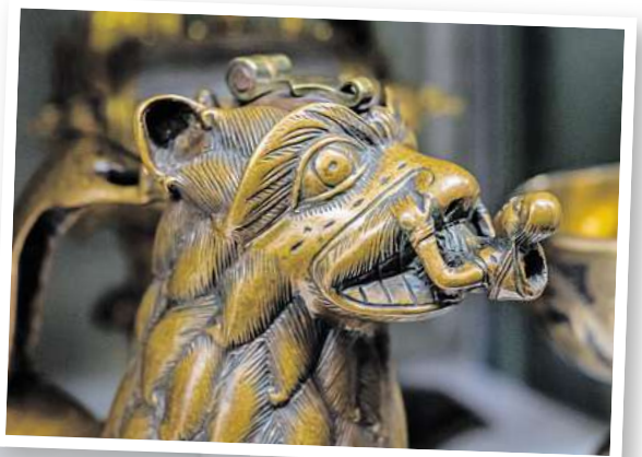
Ein Türzieher aus der Marktkirche.

und als Bausätze verkauft“, sagt sie. Eines der Highlights ist das sogenannte Nazarius-Relief aus Elfenbein, das aus dem hessischen Kloster Lorsch kommt. „Vermutlich war es einmal Teil eines Bucheinbandes“, sagt Brandt. Fast putzig mutet ein Aquamanile an: Das bronzene Gießgefäß aus dem 12. Jahr-