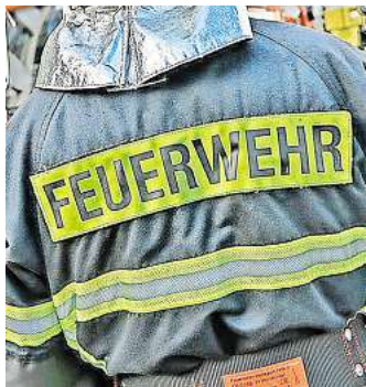
316 aktive Mitglieder leisten ihren Dienst. Symbolbild

HEMMINGEN. Zu rund 140 Einsätzen (Stand 31. Dezember 13 Uhr) rückten im Jahr 2024 die ehrenamtlichen Einsatzkräfte der Stadtfeuerwehr Hemmingen aus. Die unterschiedlichen Einsätze teilten sich wie folgt auf: 60 Brandeinsätze, 69 technische Hilfeleistungen, 2 Tierrettungen, 3 Erkundungen und 2 Sonstige Einsätze. Insgesamt 316 Aktive Mitglieder leisteten im vergangenen Jahr ihren Dienst in den sechs Ortsfeuerwehren (Arnum, Devese, Harkenbleck, Hemmingen-Westerfeld, Hiddestorf-Ohlendorf, Wilkenburg) und sorgten für die Sicherheit der Bürgerinnen und Bürger in der Stadt Hemmingen. In der Silvesternacht kam es zu weiteren 7 Brandeinsätzen, die von 61 Feuerwehrleuten bearbeitet wurden, und allesamt glimpflich verliefen.