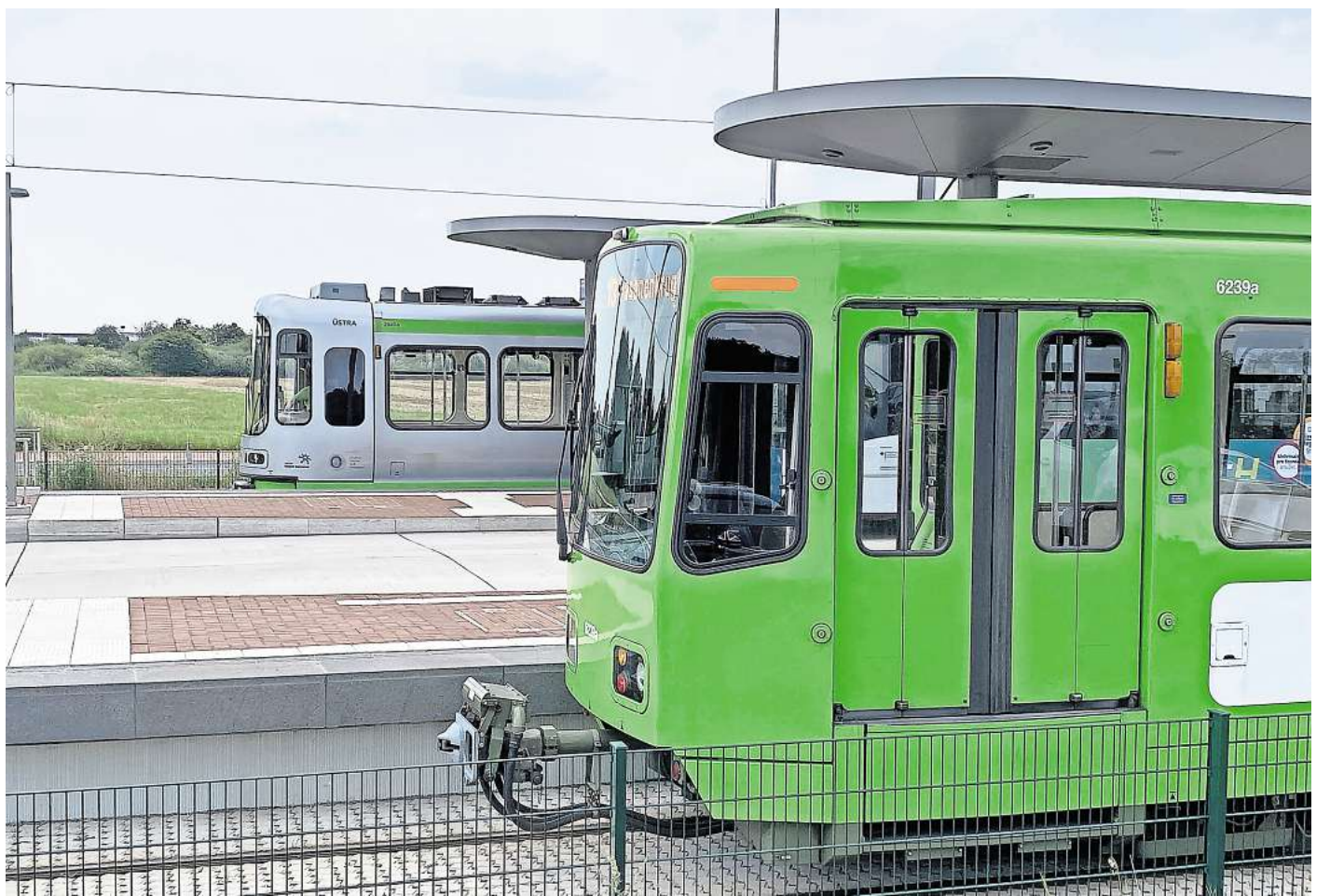
Endhaltestelle in Hemmingen-Westerfeld: Eine neuere Bahn fährt ein, eine ältere fährt ab.

Für die Jugendnetz Karte zahlen Nutzerinnen und Nutzer 3 Euro mehr, also 18 Euro. Die