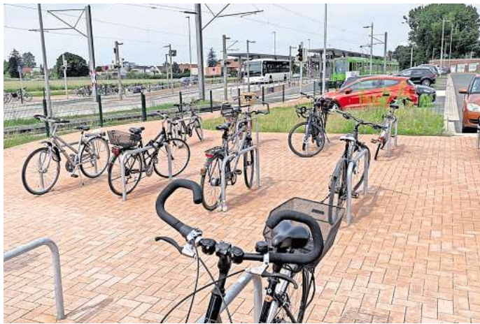
Endpunkt Hemmingen-Westerfeld: Insgesamt 250 Bike-and-Ride-Plätze gibt es dort.

Der Weg aus Richtung Sundernstraße zur Endhaltestelle in Hemmingen-Westerfeld wird 2025 gepflastert und beleuchtet. Zuletzt hieß es, dies passiere voraussichtlich in der zweiten Hälfte des Jahres 2024. Die rund 200 Meter lange Strecke entlang des Hemminger Maschgrabens war früher ein Stichweg. Dieser wurde vorwiegend von Beschäftigten und Kunden der Firmen genutzt, die dort ansässig sind.