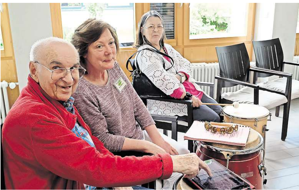
Das neue „Lebenswerk3“-Projekt startet im Frühjahr 2025

Eigene musikalische Talente entdecken, selbst künstlerische Werke schaffen und kulturelle Erlebnisse mit anderen teilen – dazu haben gesundheitlich und mobilitätseingeschränkte ältere Menschen kaum Gelegenheit. Das will die Landesarbeitsgemeinschaft Rock in Niedersachsen e.V. (LAG Rock) mit einem neuen Projekt ändern. „Lebenswerk3“ ermöglicht Bewohnerinnen und Bewohnern von Pflegeheimen die kulturelle Teilhabe durch den Einsatz von digitalen Medien und analogen Musikinstrumenten. Aus Lebenserinnerungen entstehen mithilfe von Musik-Apps zum Beispiel Songs oder Hörspiele, die in Digitalkonzerten den Teilnehmenden der anderen Einrichtungen präsentiert werden. Angeleitet werden die wöchentlichen Kurse über drei Jahre hinweg von Tandem-Teams aus musikpädagogischen Profis und jungen Assistenzkräften. Die Workshops in den Einrichtungen werden im Frühjahr 2025 beginnen. Die Seniorinnen