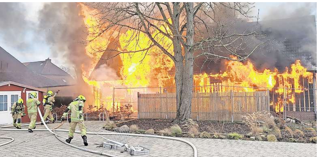
Im Brand: Das ehemalige Gemeindehaus von St. Marien in Grasdorf steht in Flammen.

LAATZEN. Die Inflation schlägt auch auf die Laatzen Feuerwehrr durch: Die Stadt Laatzen hat jetzt eine Erhöhung der Gebühren beschlossen, die bei Einsätzen in Rechnung gestellt werden. Die Steigerungen sind teilweise happig: Bei einfachen Löschfahrzeugen wird es auf die Stunde bezogen doppelt so teuer. Bei Spezialfahrzeugen, die zumeist nur bei Großeinsätzen unterwegs sind, erhöht sich die Gebühr auf ein Vielfaches, in einem Fall sogar um den Faktor 20. Die meisten Einsätze bleiben allerdings kostenfrei. Wie teuer die Rechnung wird, hängt vor allem von der Zahl der involvierten Feuerwehrleute und der Zahl und Art der Einsatzwagen ab. Die Einsatzkräfte beispielsweise schlagen neuerdings mit 110 statt 50 Euro pro Stunde zu Buche. Ein Löschfahrzeug kostet 960 statt 490 Euro pro Stunde, ein Mannschaftstransportwagen 230 statt 60 Euro. Besonders gravierend ist der Aufschlag bei Spezialfahrzeugen: Der Gerätewagen Mess-technik wird künftig mit 1770 statt 420 Euro pro Stunde berechnet, der Einsatzleitwagen ELW 2 sogar mit 3250 statt 150 Euro. STADT REDUZIERT EIGENANTEIL Die teils deutlichen Aufschläge hängen unter anderem damit zusammen, dass die letzte Anhebung schon mehr als fünf Jahre zurückliegt, sie stammt von 2019. Auch hat die Feuerwehr in den vergangenen Jahren mehre-