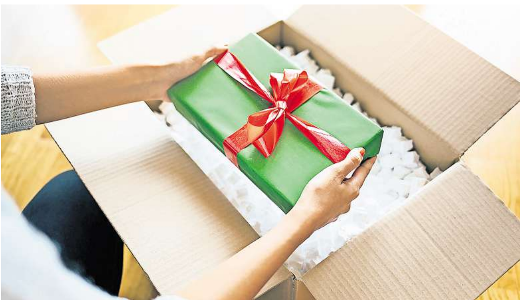
Wenn das Geschenk nicht gefällt, so klappt es mit dem Umtausch.

Umtausch und Widerruf sind rechtlich nicht dasselbe. „Während der Umtausch auf dem guten Willen des Händlers beruht, ist der Widerruf gesetzlich geregelt“, betont Brandl. Das Widerrufsrecht greift bei sogenannten Fernabsatzgeschäften, also Bestellungen im Internet, per Telefon oder per Katalog. Kunden können solche Einkäufe innerhalb von 14 Tagen ab Erhalt der Lieferung widerrufen und die Ware ohne Angabe von Gründen zurückschicken. „Beim Widerruf müssen sie lediglich den Händler über ihren Wunsch informieren und die Ware fristgerecht zurücksenden“, ergänzt