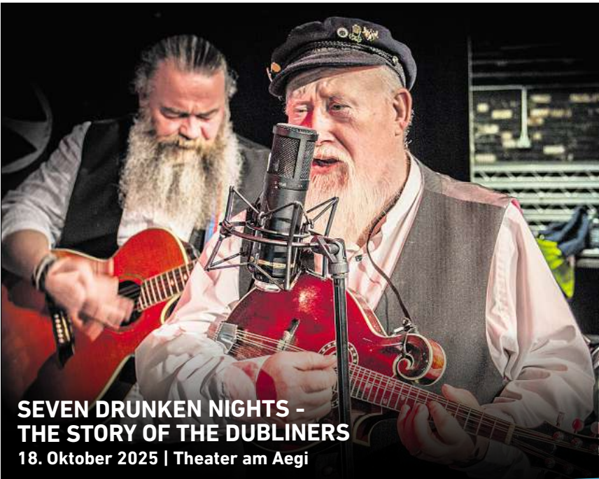
SEVEN DRUNKEN NIGHTS - THE STORY OF THE DUBLINERS 18. Oktober 2025 | Theater am Aegi

Viele weitere, spannende Neuigkeiten aus der lokalen Kulturszene finden Sie in der aktuellen Ausgabe unseres Partnermediums magaScene, monatlich frisch gedruckt und kostenlos an über 500 Auslegestellen in Hannover oder online auf www.magaScene.de inklusive Download-Möglichkeit.