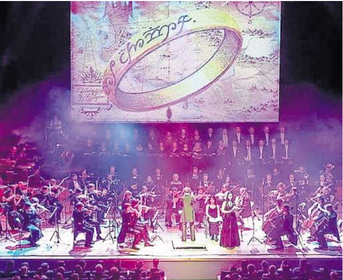
Eine musikalische Reise nach Mitteleuropa.