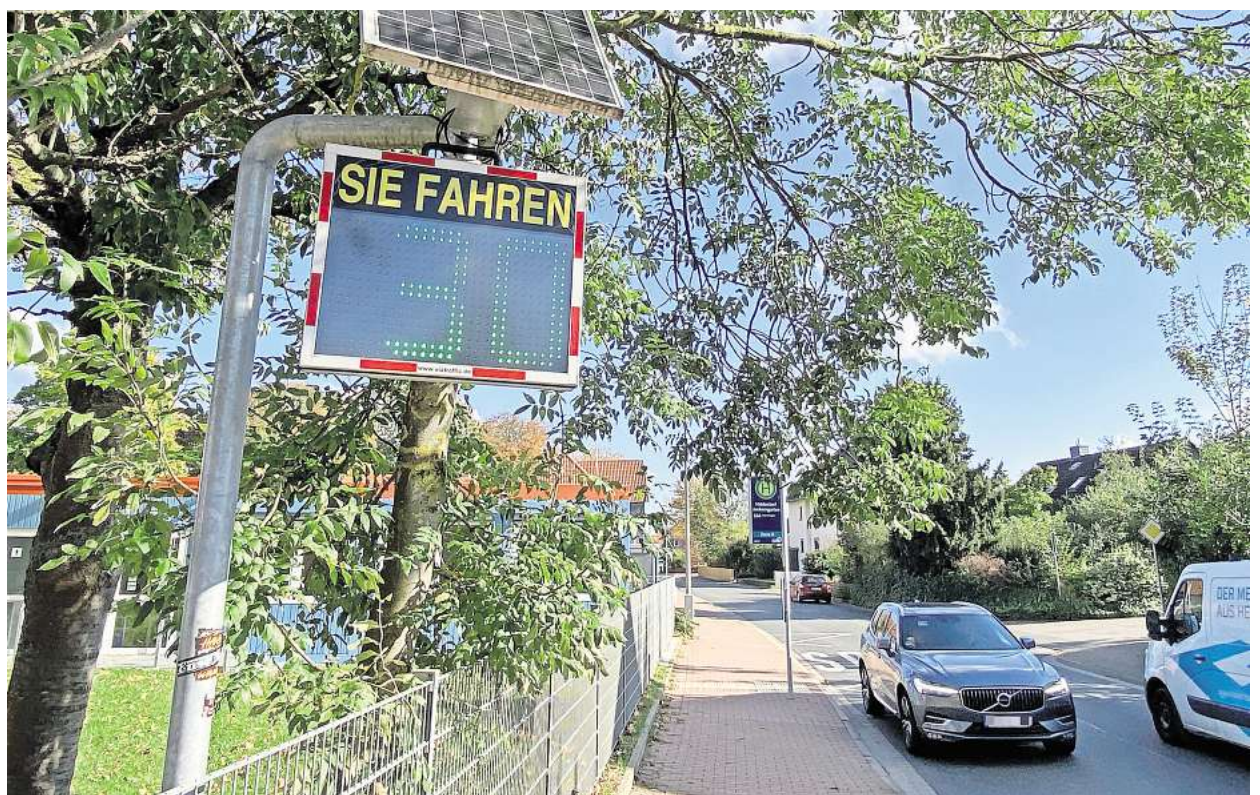
Alles im grünen Bereich am Junkerngarten in Hiddesdorf: Die Geschwindigkeitstafel zeigt Tempo 30 in Höhe der Grundschule.

Die Stadt will fünf solcher Tafeln installieren. Smart bezieht sich auf die entsprechende Technologie. Die Verkehrsdaten werden live übermittelt und können dann online verfolgt werden. Mögliche Standorte könnten zum Beispiel an Schulen sein. Die Standorte können jederzeit verändert werden.