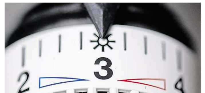
Wie wird in Hemmingen künftig geheizt? Der Bund hat eine kommunale Wärmeplanung für Kommunen mit weniger als 100.000 Einwohnern bis zum 30. Juni 2028 vorgeschrieben.

Der Bund hat eine kommunale Wärmeplanung für Kommunen mit weniger als 100.000 Einwohnern bis zum 30. Juni 2028 vorgeschrieben.