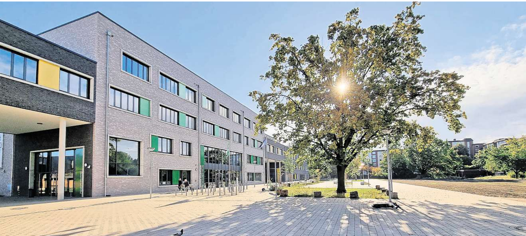
Schön gestaltet, aber offen: Die Fläche vor dem Erich-Kästner-Schulzentrum. Die Stadtverwaltung schlägt vor, entlang des Weges rechts im Bild Hecken zu pflanzen.