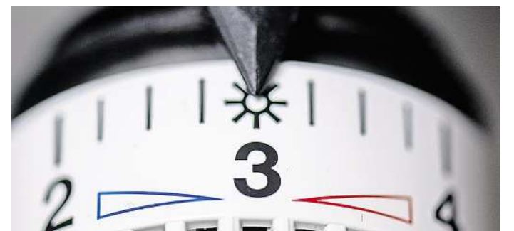
Wie wird in Hemmingen künftig geheizt? Der Bund hat eine kommunale Wärmeplanung für Kommunen mit weniger als 100.000 Einwohnern bis zum 30. Juni 2028 vorgeschrieben.

Der Bund hat eine kommunale Wärmeplanung für Kommunen mit weniger als 100.000 Einwohnern bis zum 30. Juni 2028 vorgeschrieben.