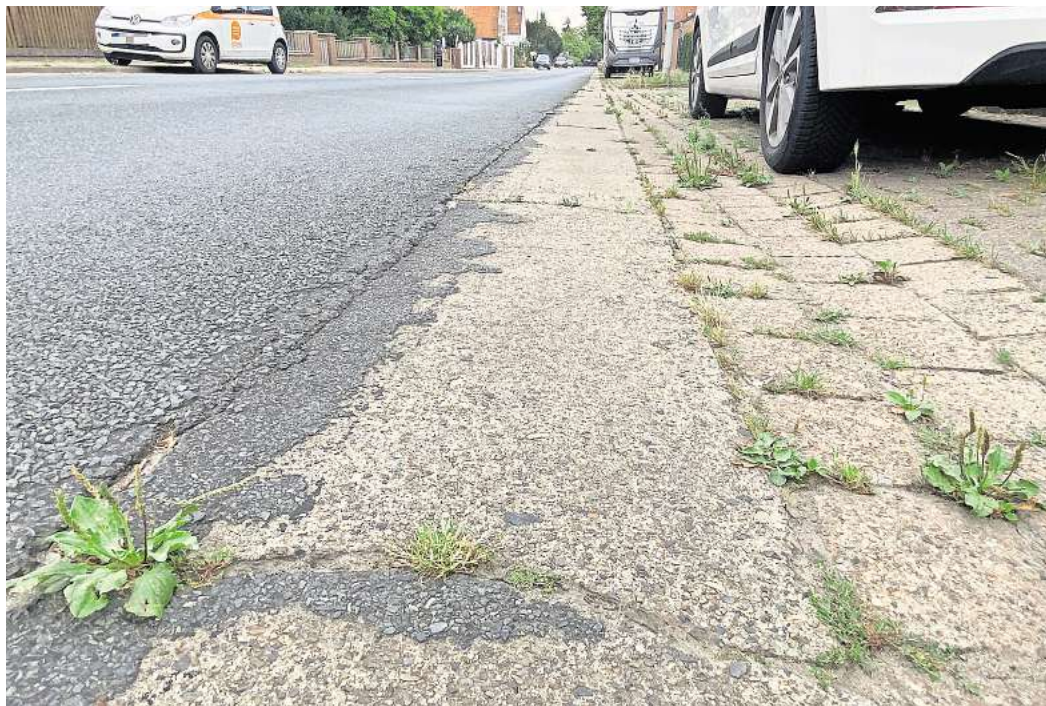
Wurde schon ausgebessert: die Deveser Straße in Hemmingen-Westerfeld.

Das Projekt auf dem rund 700 Meter langen Abschnitt kostet rund 570.000 Euro. Der nicht öffentlich tagende Verwaltungsausschuss hatte sich bereits im Sommer dieses Jahres dafür ausgesprochen. Aktuell geht die Stadtverwaltung davon aus, dass sich die Arbeiten bis in den Juni 2025 hinein erstrecken werden. Während der Sanierungszeit soll der Parkplatz an der Straße Heisterkamp für die notwendigen Baufahrzeuge und Materialien zur Verfügung gestellt werden. Zu Beginn wird der Schmutzwasserkanal im Verbindungs-