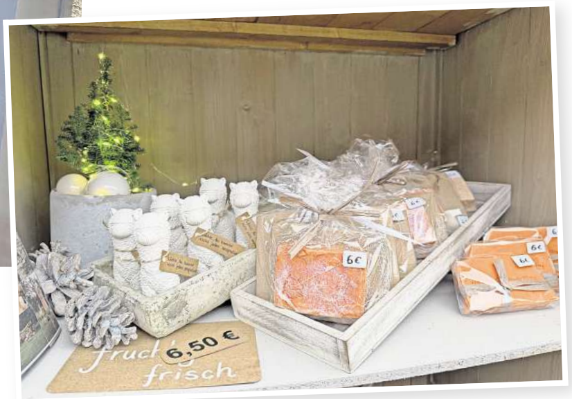
Neuer Verkaufsschrank: Bei Alpakas an Karls Hütte in Schulenburg gibt es unter anderem Seife, die aus der Wolle der eigenen Tiere kreiert wird.