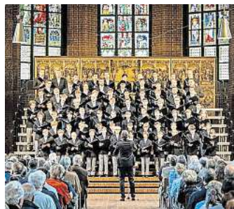
Der Knabenchor Hannover singt in der Marktkirche.