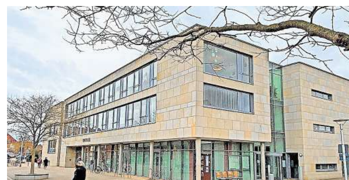
Rekorddefizit: SPD will Mehreinnahmen über Fördergeld erreichen – doch die Stadtverwaltung will die Stelle nicht.