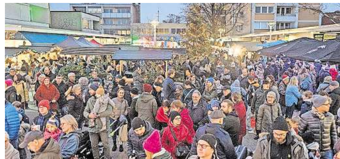
Marktgäste sollen Lieder singen

Darüber hinaus dürfen sich die Gäste wieder auf Musik, Walking-Acts, Glühwein und unterschiedliche kulinarische Leckereien freuen. Rund 60