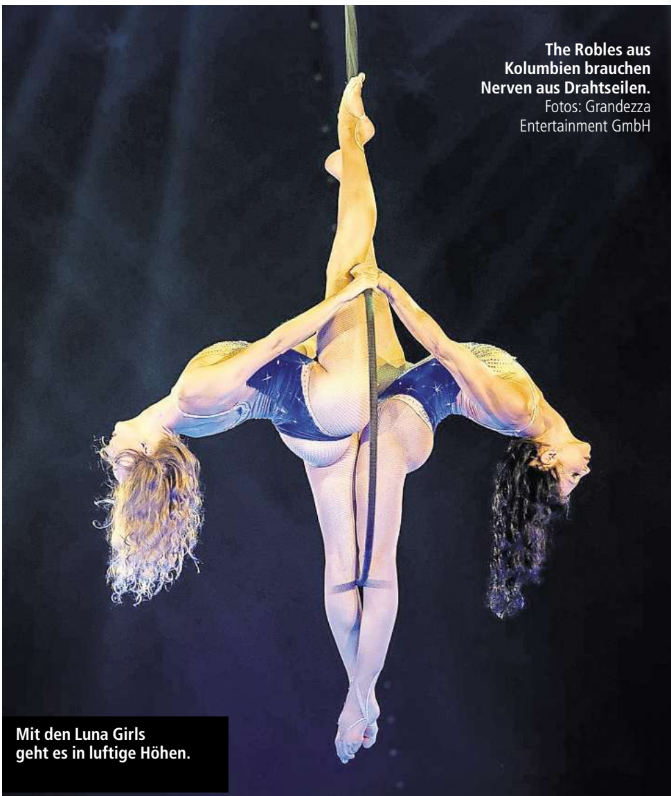
Mit den Luna Girls geht es in luftige Höhen.

Wo findet man die Crème de la Crème der internationalen Artistik? In Hannover – und das nur zur Weihnachtszeit. Als schöne Bescherung für das Publikum, denn der Weihnachtscircus Hannover geht mit dem beliebten „Grand Prix der Artisten“ im komfortablen Zelt mit nummerierten Einzelsitzen in die nächste Runde. Supersicht auf die Superstars der Manege: Das neue Zelt wird ohne innere Masten errichtet – so haben die Besucher von jedem Platz aus besten Blick auf das Geschehen. Die auf großen internationalen Circus Festivals ausgezeichneten Artisten müssen an der Leine eine ganz besondere Hürde nehmen: Das Publikum entscheidet auch dieses Mal darüber, wer zwischen Zelthimmel und Manegengrund der Beste unter den Besten ist. Dazu können sie einen Stimmzettel ausfüllen oder per App ihre Favoriten anklicken. Die feierliche Siegerehrung ist dann wieder am letzten Spieltag. „Für den Wettstreit während der glanzvollsten Zeit des Jahres haben wir Legenden der Circus-