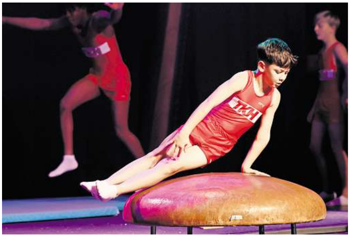
Zu Gast in der Orangerie: Turngruppen des TKH