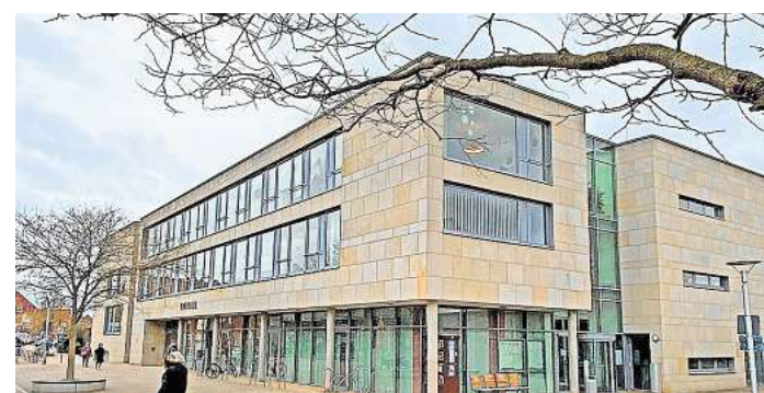
Rekorddefizit: SPD will Mehreinnahmen über Fördergeld erreichen – doch die Stadtverwaltung will die Stelle nicht.