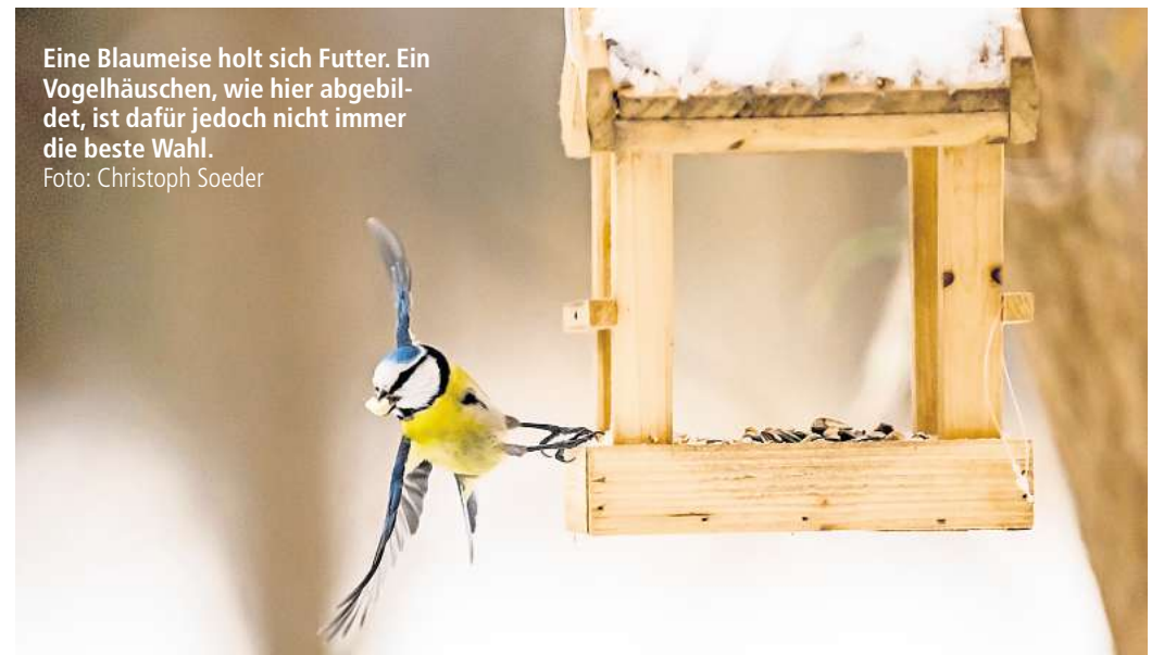
Eine Blaumeise holt sich Futter. Ein Vogelhäuschen, wie hier abgebildet, ist dafür jedoch nicht immer die beste Wahl.

Schwache Igel, insbesondere Weibchen, die im Spätsommer noch Junge zur Welt gebracht