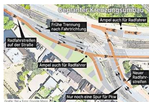
Onlinegrafik, Kreuzungsombau Hildesheimer Straße / Erich-Panitz-Straße

Politik und Verwaltung verständigten sich am Ende darauf, bei der Region zumindest eine Prüfung des grünen Pfeils zu erfragen. Auf eine Neuplanung verzichtete der Verkehrsausschuss, um die Umsetzung nicht zu verzögern. Andernfalls hätte eine sogenannte Planfeststellung erfolgen müssen, die laut Schmidt zwischen sechs und neun Monaten dauern würde. Er gehe davon aus, dass der Umbau in der zweiten Jahreshälfte 2025 erfolgen kann.