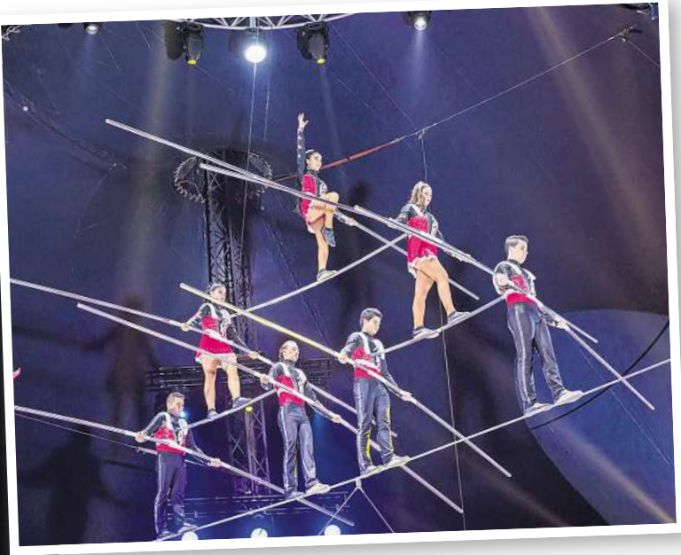
The Robles aus Kolumbien brauchen Nerven aus Drahtseilen.

schwieriger ist wohl die Darbietung von Ricce Meticce. Die beiden Italienerinnen haben die gute alte – und schon fast vergessene – Kunst des Zopfhangs neu belebt. Da muss die Frisur sitzen. Ungewöhnlich und noch nie im Weihnachtscircus zu erleben, ist die Power-Show von Lift. Die vier Akrobatinnen und Akrobaten aus Frankreich und Kanada sind Spezialisten auf dem Fangstuhl.