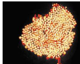
Finissage: Mit „BrennWEITEN@ArtAffair“ verabschiedet sich der Kunstverein Kunsthalle Faust.