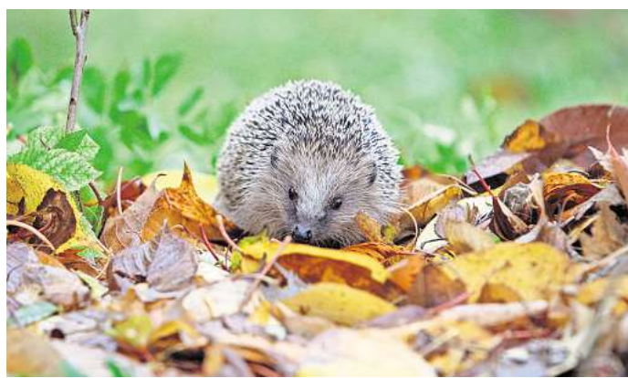
Mit Laubhaufen kann man Igel ein Winterquartier bieten. Karl-Josef Hildenbrand

„Wir sind selbst ganz gespannt, wie es weitergeht und was hier noch so alles passiert“, sagt Kherfani augenzwinkernd. Die Menschen aus dem Ort können daran teilhaben: „Jeder kann zur Kirche kommen und nachschauen, was der Wichtel gerade so macht.“ Wichtig sei aber, dass Tomte und seine Freunde nicht gestört würden. „Man sollte sein Häuschen respektieren und nichts kaputt machen.“