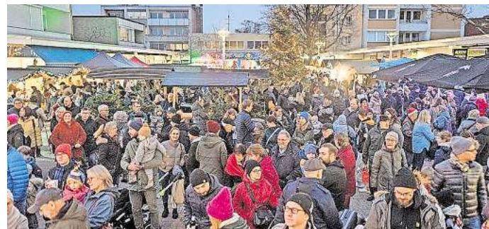
Marktgäste sollen Lieder singen

Darüber hinaus dürfen sich die Gäste wieder auf Musik, Walking-Acts, Glühwein und unterschiedliche kulinarische Leckereien freuen. Rund 60