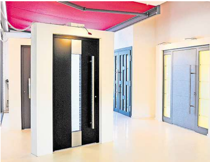
Fertigt hochwertige Türen und Fenster nach Maß: das Laatzenener Fachunternehmen Robering.