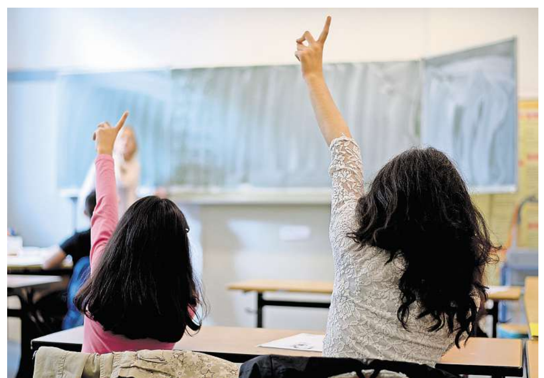
Erschwerte Integration: Kinder mit Migrationshintergrund brauchen in der Schule spezielle Sprachförderung: Doch ein Erlass des Landes erschwert jetzt das Angebot.

Das Problem dabei ist, dass Schülerinnen und Schüler die Regelstundenzahl um nicht mehr als zwei Stunden pro Woche überschreiten dürfen, was ein zusätzliches Angebot an den