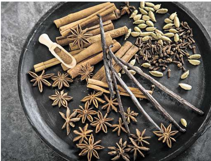
Zimt, Sternanis, Kardamom, Gewürznelken und Vanille sind aus der Weihnachtsküche nicht wegzudenken.

Vanille Die „Königin der Gewürze“ gehört zu den teuersten Gewürzen der Welt. Die wichtigste Art ist Bourbonvanille ( Vanilla planifolia ). Erst fermentiert haben die länglichen Schoten die dunkle Farbe und das sahnige bis blumige Aroma. Kaufen können wir echte Vanille als Schote oder in Pulverform. Produkte mit echter Vanille erkennt man meist an den kleinen schwarzen Punkten des Vanillemarks. Wie der Name sagt, gehört das Gewürz auf jeden Fall in Vanillekipferl. Tipp: Stellen Sie dafür Ihren eigenen Vanillezucker her. Vanilleschoten im Ganzen oder klein geschnitten zusammen mit Zucker in ein Schraubglas füllen und zwei Wochen ziehen lassen. Zwischendurch immer mal gut durchmischen oder schütteln.