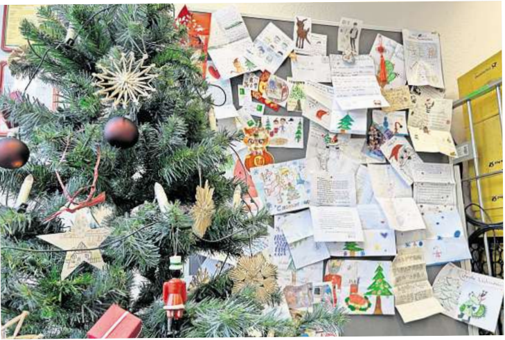
Weihnachtlich: Im Postamt Himmelsthür im Pattenser Briefzentrum der Deutschen Post hängt eine Auswahl besonderer Wunschzettel an einer Pinnwand.

heit“, sagt Osterwald. Er deutet auf ein weiteres Schreiben, das aus China eintraf. „In diesem Jahr habe ich versucht, ein guter Mensch zu sein und meinen Eltern, meinem Bruder, meiner Schwester sowie meinen Freunden zu helfen.“ Er habe allerdings auch ein paar kleine Wünsche für sich. „Ein paar gute Bücher, um mein Wissen zu erweitern“ und „Malmaterial, damit ich meine Kreativität ausleben kann“. Der letzte Wunsch: „Ein neuer Fußball, damit ich mit meinen Freunden spielen kann.“ Osterwald sieht in den Wünschen durchaus ein Muster. „Während die deutschen Kinder ihren Wunsch selten erläutern