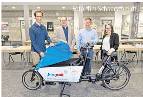
Das Lastenrad „Hannah“ ist bald auf Patten- sens Straßen unterwegs. Seite 2