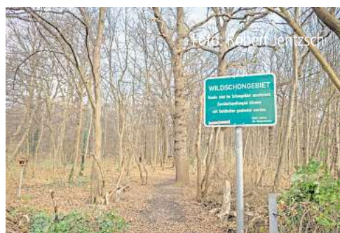
Die Stadt Laatzen will im Mastbruchholz Bäu- me fällen. Seite 5