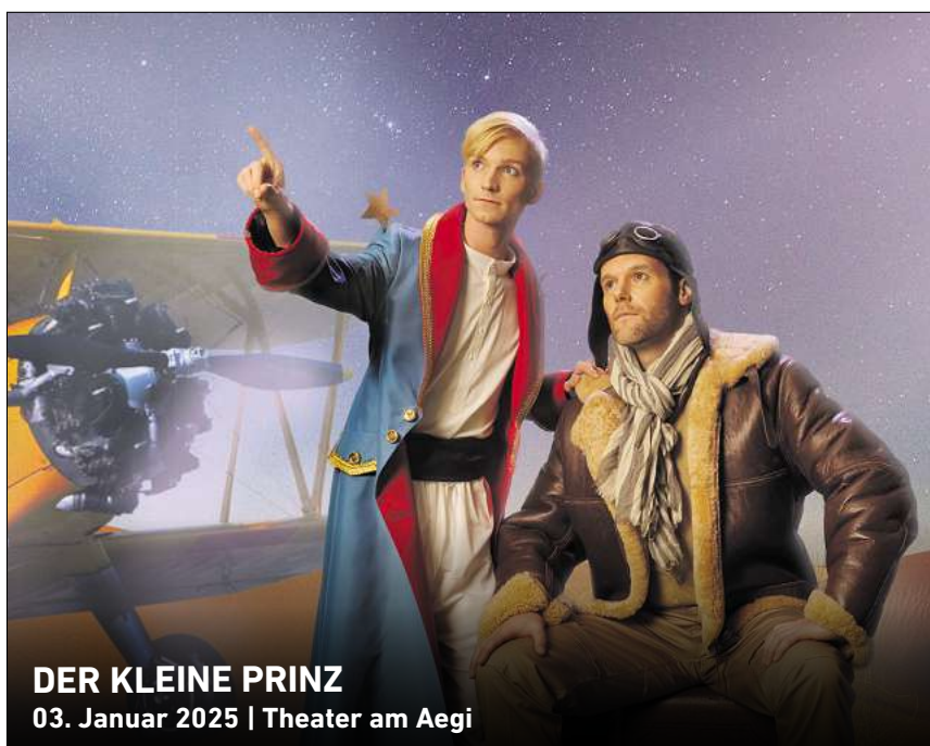
DER KLEINE PRINZ 03. Januar 2025 | Theater am Aegi

In den HAZ & NP Geschäftsstellen Hannover, Lange Laube 10 Neustadt, Am Wallhof 1 Burgdorf, Marktstraße 16 Langenhagen, im CCL, Marktplatz 5 Theater am Aegi, Aegidientorplatz 2