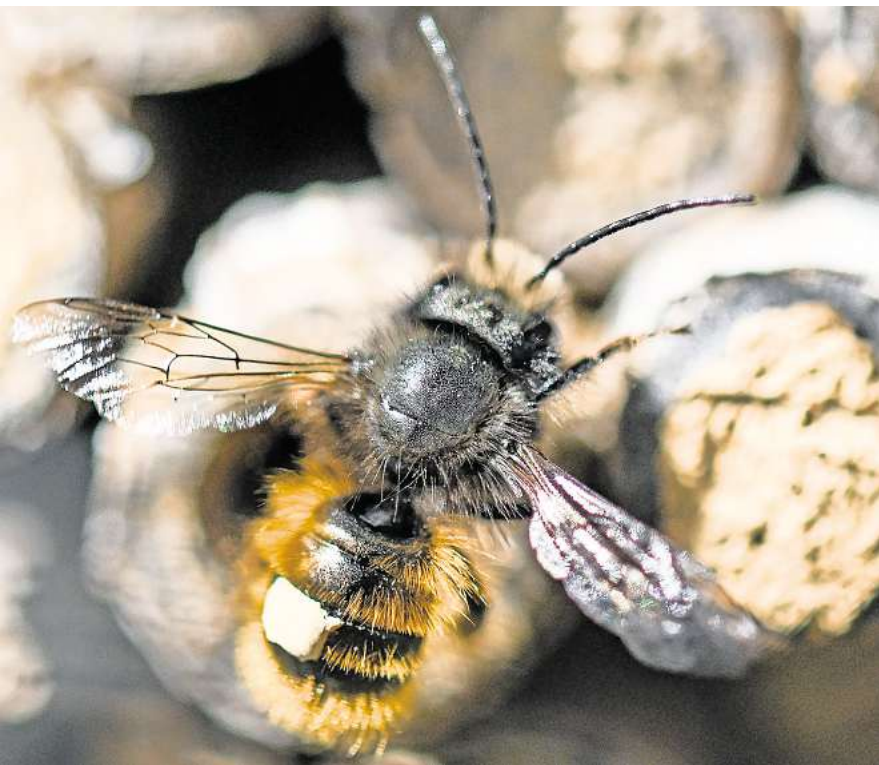
Überwintern oft allein: Menschen können Wildbienen helfen, gut über die kalte Jahreszeit zu kommen.

Im Frühjahr und Sommer sind sie kleine Helfer im Garten, denn sie bestäuben Obstbäume, Beerensträucher und anderes mehr. Im Winter brauchen Wildbienen hingegen unsere Hilfe. Denn während Honigbienen den Winter mit ihrem Volk im Bienenstock verbringen, leben die meisten von ihnen allein und überwintern als Biene oder Puppe im Kokon, so der Naturschutzbund Deutschland (Nabu). Ein geeignetes Winterquartier dafür finden Wildbienen beispielsweise in Pflanzenstängeln oder in hohlen Ästen. Stauden und Gehölze sollte man daher erst im Frühjahr zurückschneiden und bis dahin in Ruhe lassen. Stauden sind für die Tiere grundsätzlich eine wertvolle Nahrungsquelle, Gehölze bieten Nistmöglichkeiten – für Bienenfreunde also ein echtes Muss. Ein Tipp – nicht nur für den Winter: Gute Pflanzideen für Wildbienen sind laut dem Bund für Umwelt und Naturschutz Deutschland (BUND) zum Beispiel Stauden wie Schlüsselblumen, Lungenkraut und Akelei. Oder Gehölze wie Weiden, Wildrosen, Holunder und Weißdorn. Auch Beerensträucher und Obstbäume sind bei Wildbienen beliebt. Übrigens: Wildbienen können auch im Boden überwintern. Of-