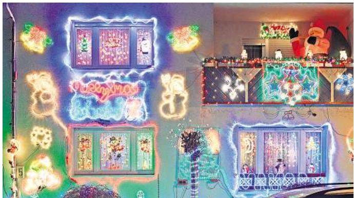
Bunter Lichterglanz: Die Wahl der Farbe kann den Energieverbrauch von Lichterketten beeinflussen.

gibt es bei uns ganz oder als Pulver zu kaufen. Beides sollte dunkel und gut verschlossen aufbewahrt werden. Tipp: Wollen Sie den typischen Weihnachtsduft in der Wohnung halten und noch dazu eine schöne Dekoration haben, spicken Sie eine Orange mit einer Handvoll Gewürznelken, sodass nur noch die Knospenköpfchen heraussehen. Zimt Zimtsterne sind Weihnachtsgebäck-Klassiker. Doch Zimt ist nicht gleich Zimt. Hochwertig ist der Ceylon-Zimt, der vom echten Zimtbaum ( Cinnamomum verum ) stammt. Er hat mehr Aroma und weniger Coumarin als der günstigere Cassia-Zimt. Coumarin kann in höheren Dosen der Gesundheit schaden. Meist ist Ceylon-Zimt im Verkauf als solcher deklariert.