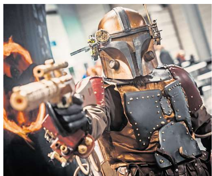
Scienc-Fiction-Sets, Cosplay und jede Menge Spielspaß warten auf dem Messegelände.

Ihr persönlicher Ticketservice der HAZ & NP