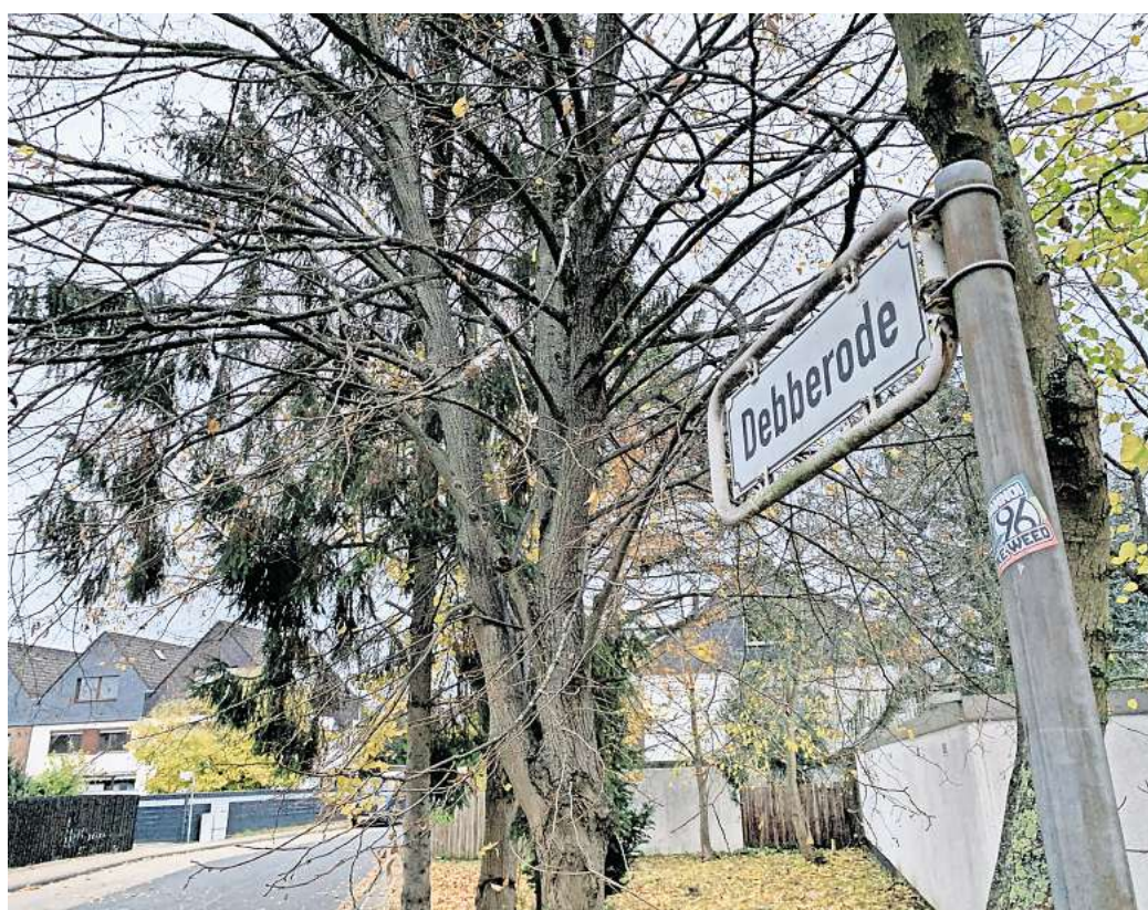
Möglicher Blindgänger im Wohngebiet: In einem Vorgarten der Laatzen Debberode sondierten Experten im Oktober und November mehrfach einen Verdachtspunkt.

Im Viertel kursieren verschiedene Hinweise auf ein echtes Kampfmittel im Boden. Der frühere Eigentümer des betroffenen Grundstückes habe schon vor Jahrzehnten gesagt „Unter meinem Haus liegt eine Bombe“, erinnert sich ein Senior. Ein anderer Mann will von einem Son-