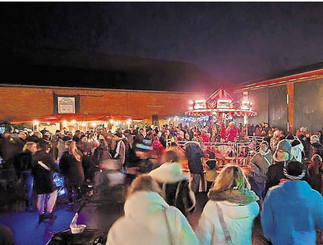
Für Kinder wie immer das Wichtigste auf dem Weihnachtsmarkt in Ingeln-Oesselse: Das Kinder-Karussell auf dem Hof Hennies und der Besuch vom Weihnachtsmann in der Scheune.

• Am Sonntag, 7. Dezember , gibt es gleich zwei Weihnachtsmärkte. In Gleidingen wird von 13 bis 18.30 Uhr bei der alten Feuerwache (Osterstraße) mit Waffeln, Bratwurst, Fritten, Stockbrot und Getränken gefeiert. Der Weihnachtsmann kommt gegen 16 Uhr. Wer will, kann bei dem von der Inter-