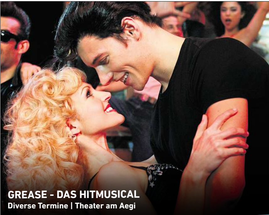
GREASE - DAS HITMUSICAL Diverse Termine | Theater am Aegi

Ihr persönlicher Ticketservice der HAZ & NP