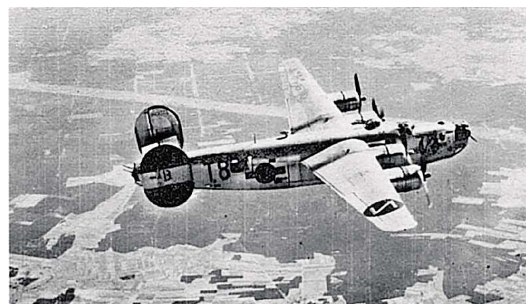
Einst im Einsatz der US Army Air Force: Der Bomber Ark Angel stürzte am 26. November 1944 nach deutschem Beschuss bei Oerie auf ein Feld.

26. November 1944 ist in Oerie und Hüpde weiter präsent. Im Dorf und auch im Nachbarort Hüpde sprechen Menschen noch immer über diesen Tag, der sich nun zum 80. Mal jährt. Die wenigsten von ihnen können sich noch aus eigenem Erleben daran erinnern. Mehrere Anwohner seien von Trümmerteilen getroffen und dadurch schwer verletzt oder sogar getötet worden, wird erzählt. Ob diese Trümmer von der „Ark Angel“ oder von anderen in der Luft beschädigten Flugzeugen stamm-