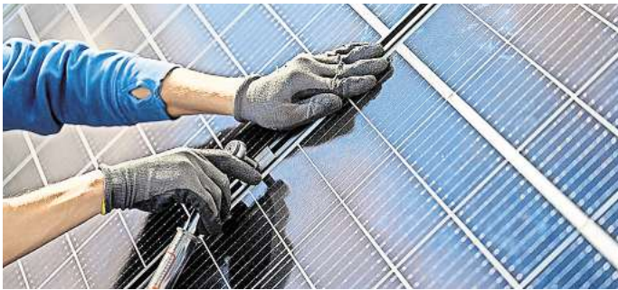
Halten die Netze bei immer neuen Energie-Einspeisungen? Auch um solche Fragen geht es beim nächsten Energie-Forum in Laatzen.