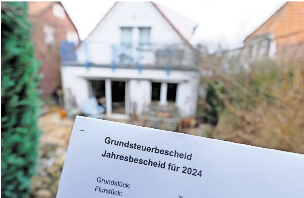
Zum Jahreswechsel tritt die Grundsteuerreform in Kraft – mit teils erheblichen Auswirkungen auf Hausbesitzer und -besitzerinnen in Laatzen.

Der Entwurf sieht vor, dass der neue Hebesatz aufkommensneutral wird. Die Stadt will 2025 also insgesamt die gleiche Summe einnehmen wie im laufen-