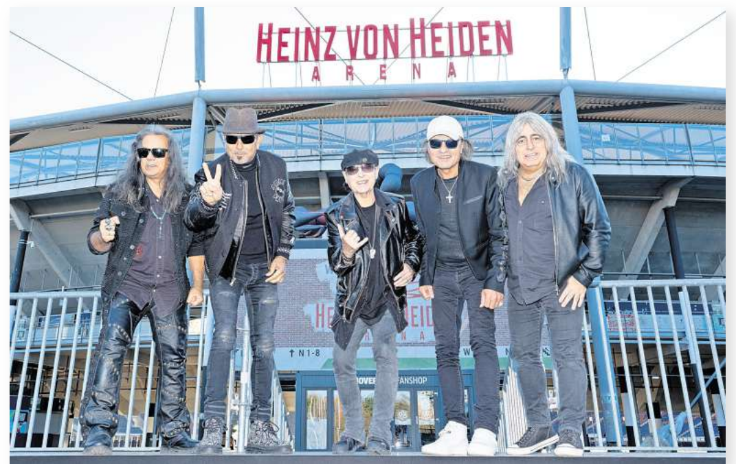
Erstes Stadionkonzert in Hannover: Die Scorpions rocken 2025 endlich in der heimischen Heinz von Heiden Arena.

Und so werden die Scorpions also die erste lokale Band sein, die das mittlerweile dreimal umbenannte Niedersachsenstadion bespielt. In Hannover haben Klaus Meine, Rudolf Schenker und Matthias Jabs in unterschiedlichen Scorpions-Formationen durch die Jahrzehnte immer wieder kleine und große Hallen oder auch die Expo-Plaza oder den Waterlooplatz bespielt. Auf dem Pressepodium erinnern sie sich sogar noch weiter zurück, an die Anfänge in kleinen Clubs wie dem „Savoy“ in Hannover oder der „Grille“ in Minden. Zuletzt