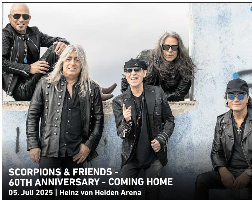
SCORPIONS & FRIENDS - 60TH ANNIVERSARY - COMING HOME 05. Juli 2025 | Heinz von Heiden Arena

Ihr persönlicher Ticketservice der HAZ & NP