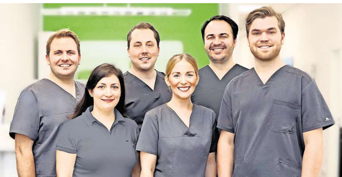
Gefragte Ansprechpartner über die Stadtgrenzen hinaus: das Zahnärzteam von myDent Laatzen.

Wenn die eigenen Zähne gerade stehen, ist dies nicht nur optisch schön, sondern es trägt auch zu ihrer Funktion und zur Gesundheit im Allgemeinen bei. Schief stehende Zähne hingegen können das Kauen beeinträchtigen, zur Abnutzung führen und außerdem das Kariesrisiko erhöhen. myDent Laatzen, in der Pettenkoferstraße 2a (Telefon (0511) 8 97 67 90), bietet hier mit den so genannten Alignern nun individuelle Lösungen zu einem gesunden und schönen Lächeln an. Aligner sind auf die persönliche Gebissform gefertigte, individuelle und transparente Schienen, mit denen sich die Zähne immer ein kleines Stückchen bewegen. Sie werden 22 Stunden am Tag getragen und nach Rücksprache mit dem Zahnarzt alle ein bis zwei Wochen gewechselt. „Das ist eine diskrete Be-