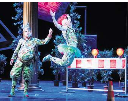
Sommernachts Traum in der Staatsoper.