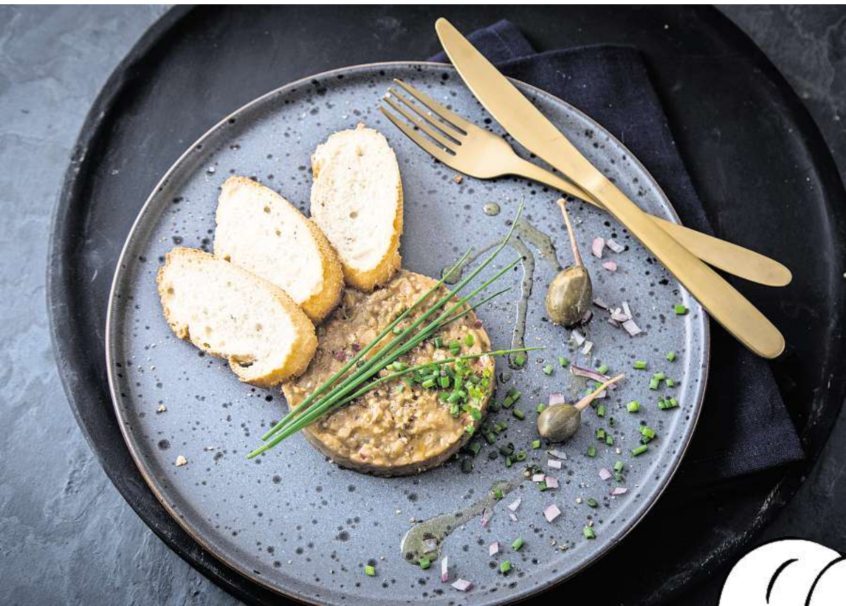
Die Form erinnert an einen Tatar-Taler. Doch er ist aus dem Fruchtfleisch der Aubergine mit Kapern, Schnittlauch und Olivenöl zubereitet und kann mit Baguettescheiben gereicht werden.