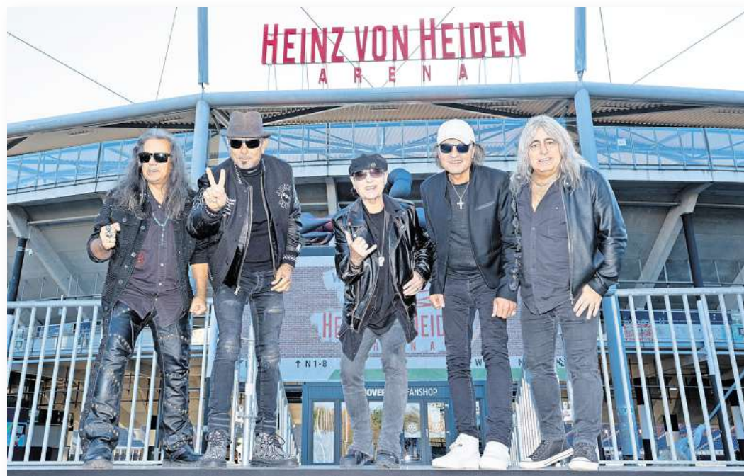
Erstes Stadionkonzert in Hannover: Die Scorpions rocken 2025 endlich in der heimischen Heinz von Heiden Arena.

Und so werden die Scorpions also die erste lokale Band sein, die das mittlerweile dreimal umbenannte Niedersachsenstadion bespielt. In Hannover haben Klaus Meine, Rudolf Schenker und Matthias Jabs in unterschiedlichen Scorpions-Formationen durch die Jahrzehnte immer wieder kleine und große Hallen oder auch die Expo-Plaza oder den Waterlooplatz bespielt. Auf dem Pressepodium erinnern sie sich sogar noch weiter zurück, an die Anfänge in kleinen Clubs wie dem „Savoy“ in Hannover oder der „Grille“ in Minden. Zuletzt