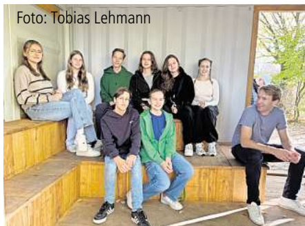
Der neue Container „Roller“ auf dem Jugendplatz. Seite 3