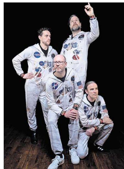
Treten im Jugendzentrum auf: Die Starlight Monkeys

Das Beatsteaks-Konzert 2002 als achttes „Soundgarden“-Open-Air war zugleich das letzte. Das finanzielle Risiko sei zu groß geworden, erinnert sich Berkman. „An dem Tag hat es bis 13 Uhr geregnet, und wir hatten im Vorverkauf gerade