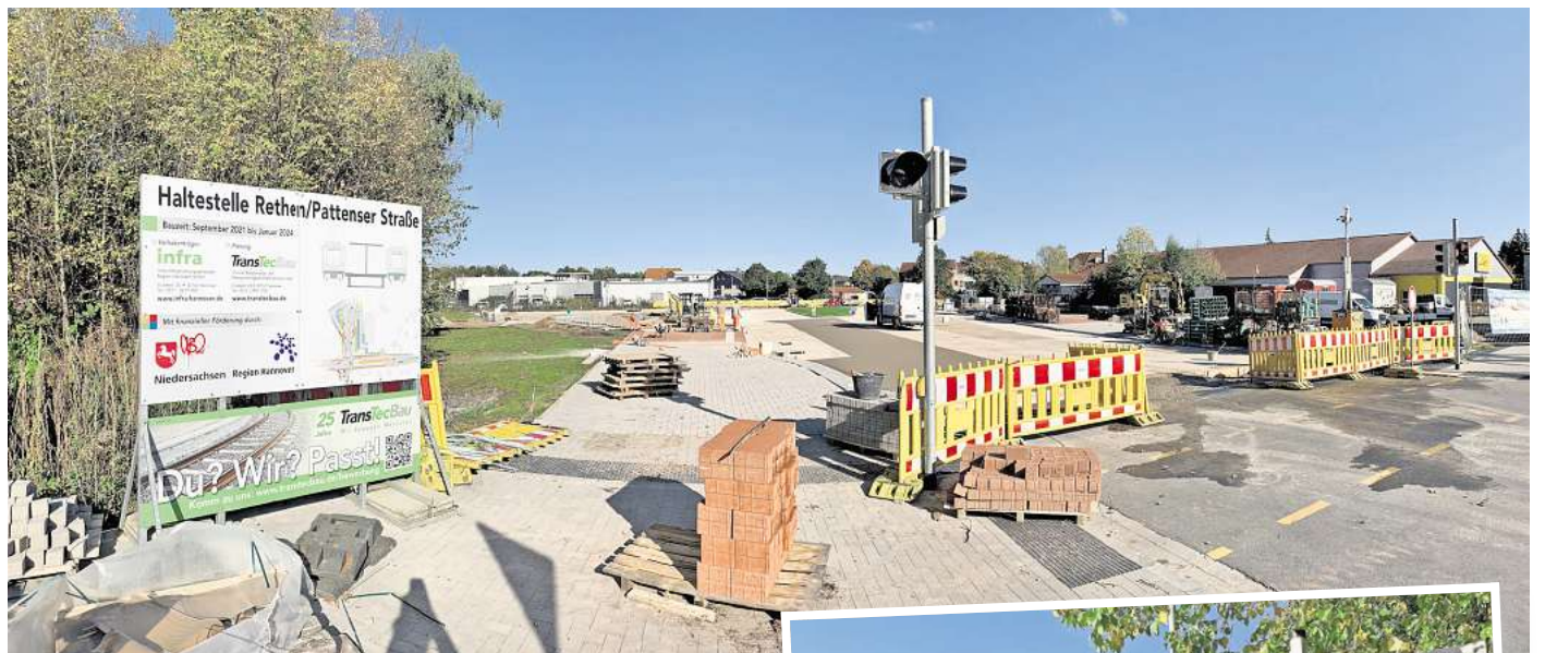
Soll zum Fahrplanwechsel fertig ein: Die Rethener Schleife wird zum Park & Ride-Parkplatz mit 37 Autostellplätzen, Fahrradbügel und Haltestelle für den 390er-Bus umgebaut.

„Die Linie 390 wird im Bereich der neuen Buswendeschleife übergangsweise ihren Endpunkt haben“, sagte Üstra-Sprecher Timo Wegner. Perspektivisch fahre die Linie durchs Neubaugebiet zwischen Rethen und Gleidingen, das sich jedoch in weiten Teilen noch in der Planung befindet. Der 390er-Bus wäre damit der einzige, der