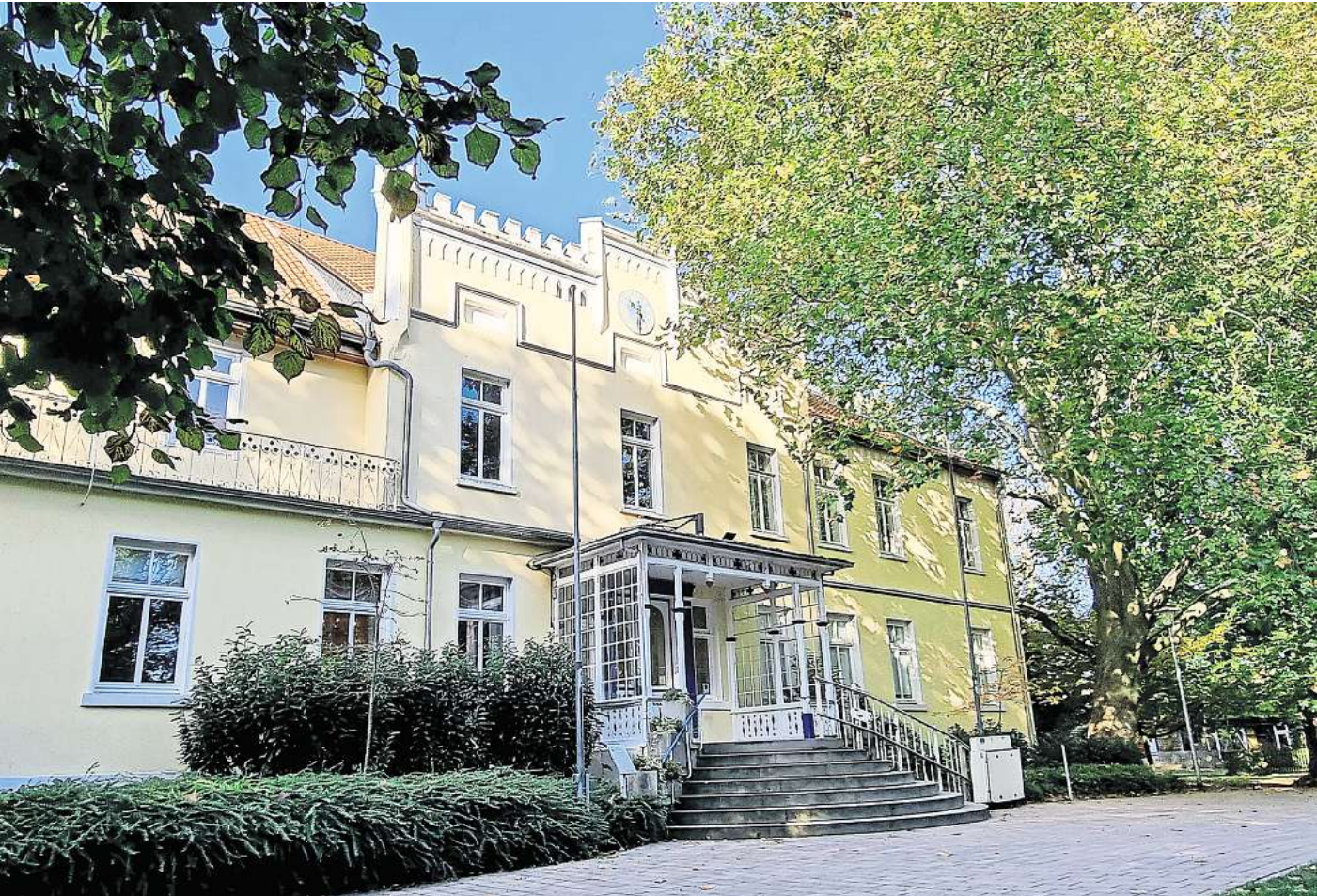
Bei Hochzeitspaaren beliebt: Das „Alte Rathaus“ im Alt-Laatzer Park.

Das Gebäude an der Ecke Hildesheimer Straße/Am Meyerkamp dient seit vielen Jahren als Treffpunkt für Gruppen in Gleidingen. Im Dachgeschoss ist zudem die Heimatstube mit ihren Ausstellungen untergebracht.