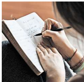
WortLaut: kreatives Schreiben, gemeinsames Lesen.