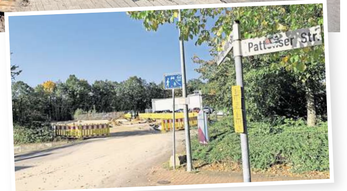
Durchstich wird später fertig: Die Verbindung von der Pattenser Straße zur umgebauten Rethener Schleife ist voraussichtlich erst Anfang 2025 zu nutzen.

Wirtschaftlicher seien Ladesäulen an Standorten mit häufigeren Fahrzeugwechseln. In