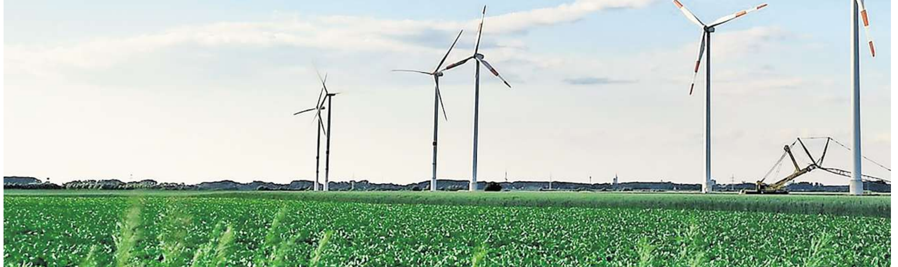
Werden demnächst möglicherweise mehr: Windräder bei Jeinsen

Region Hannover prüft zurzeit noch die Genehmigung – BÜRGERSCHAFT schwankt zwischen Zustimmung und Ablehnung