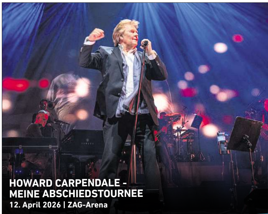
HOWARD CARPENDALE - MEINE ABSCHIEDSTOURNEE 12. April 2026 | ZAG-Arena