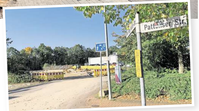
Durchstich wird später fertig: Die Verbindung von der Pattenser Straße zur umgebauten Rethener Schleife ist voraussichtlich erst Anfang 2025 zu nutzen.

Wirtschaftlicher seien Ladesäulen an Standorten mit häufigeren Fahrzeugwechseln. In