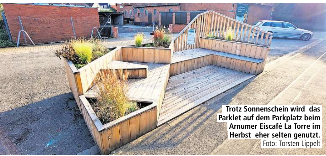
Trotz Sonnenschein wird das Parklet auf dem Parkplatz beim Arnum Eiscafé La Torre im Herbst eher selten genutzt.

ARNUM. Parklets sind für die einen gemütliche Sitzecken statt parkender Autos. Für andere sind es einfach nur „Parkplatzräuber“. Seit Mitte Mai steht nahe des Arnum Eiscafé La Torre das erste Parklet im Hemminger Stadtgebiet. Es ist ein Stadtmöbel, das auf einer Parkplatfläche in der Sackgasse der alten Wilkenburger Straße steht – und ein Geschenk. Die Kosten in Höhe von 13.000 Euro hat das Mobilnetzwerk der Region Hannover übernommen. Die aus dem Englischen entlehnte Wortschöpfung bedeutet dabei so viel wie „kleiner Park“.