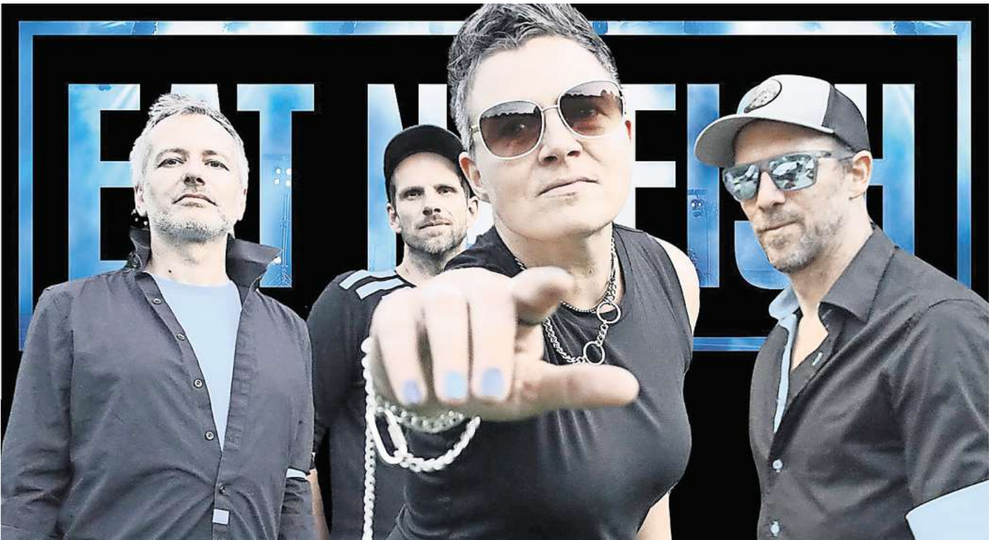
Eat No Fish entern nach über 20 Jahren wieder gemeinsam die Bühne.