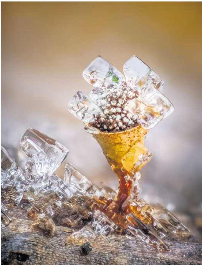
Sieger in der Kategorie „The World of Fungi“: Barry Webb fotografierte nach einem starken Frost den nur einen Millimeter großen Schleimpilz Craterium minutum .

Ein besonderes Highlight ist die Arbeit des britischen Fotografen Barry Webb, der den ersten Platz in der Kategorie „The World of Fungi“ gewonnen hat. Webbs Siegerfoto zeigt einen winzigen Schleimpilz der Art Craterium minutum , der nur einen Millimeter groß ist. Diese außergewöhnliche Aufnahme entstand in Webbs eigenem Garten, wo er den Pilz auf verrottender Vegetation am Rande eines Komposthaufens nach einem starken Frost fand. Besonders auffällig sind die ungewöhnlich würfelförmigen Eisformationen, die sich auf dem Fruchtkörper des Pilzes gebildet haben. Diese seltenen Strukturen, eingefangen unter den besonderen Lichtverhältnissen des frühen Morgens, verleihen dem Bild eine magische, fast surreal