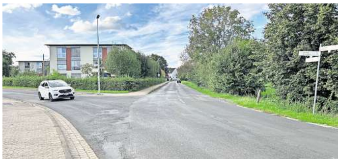
Änderung der Vorfahrtsregel: Der Rat hat einstimmig beschlossen, dass zukünftig Autos aus der Schützenallee den Verkehr auf der Hiddestorfer Straße passieren lassen müssen.