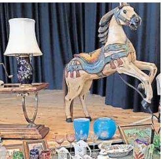
Beim Antikmarkt können Freunde edler Sammlerstücke auf ihre Kosten kommen.

Bei Interesse melden Sie sich an der Kasse. Der Eintritt beträgt 3 Euro.