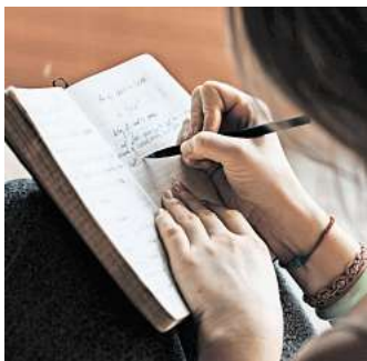
WortLaut: kreatives Schreiben, gemeinsames Lesen.