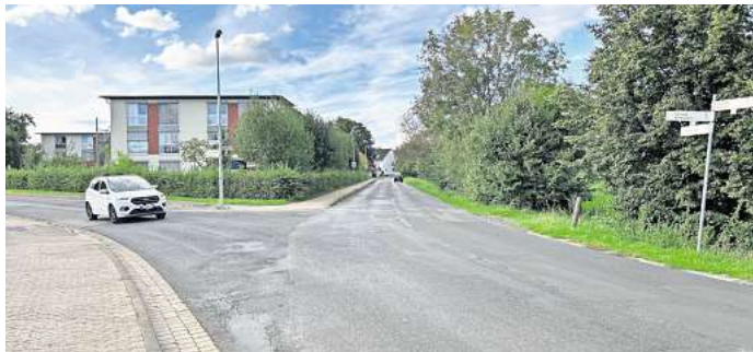
Änderung der Vorfahrtsregel: Der Rat hat einstimmig beschlossen, dass zukünftig Autos aus der Schützenallee den Verkehr auf der Hiddestorfer Straße passieren lassen müssen.