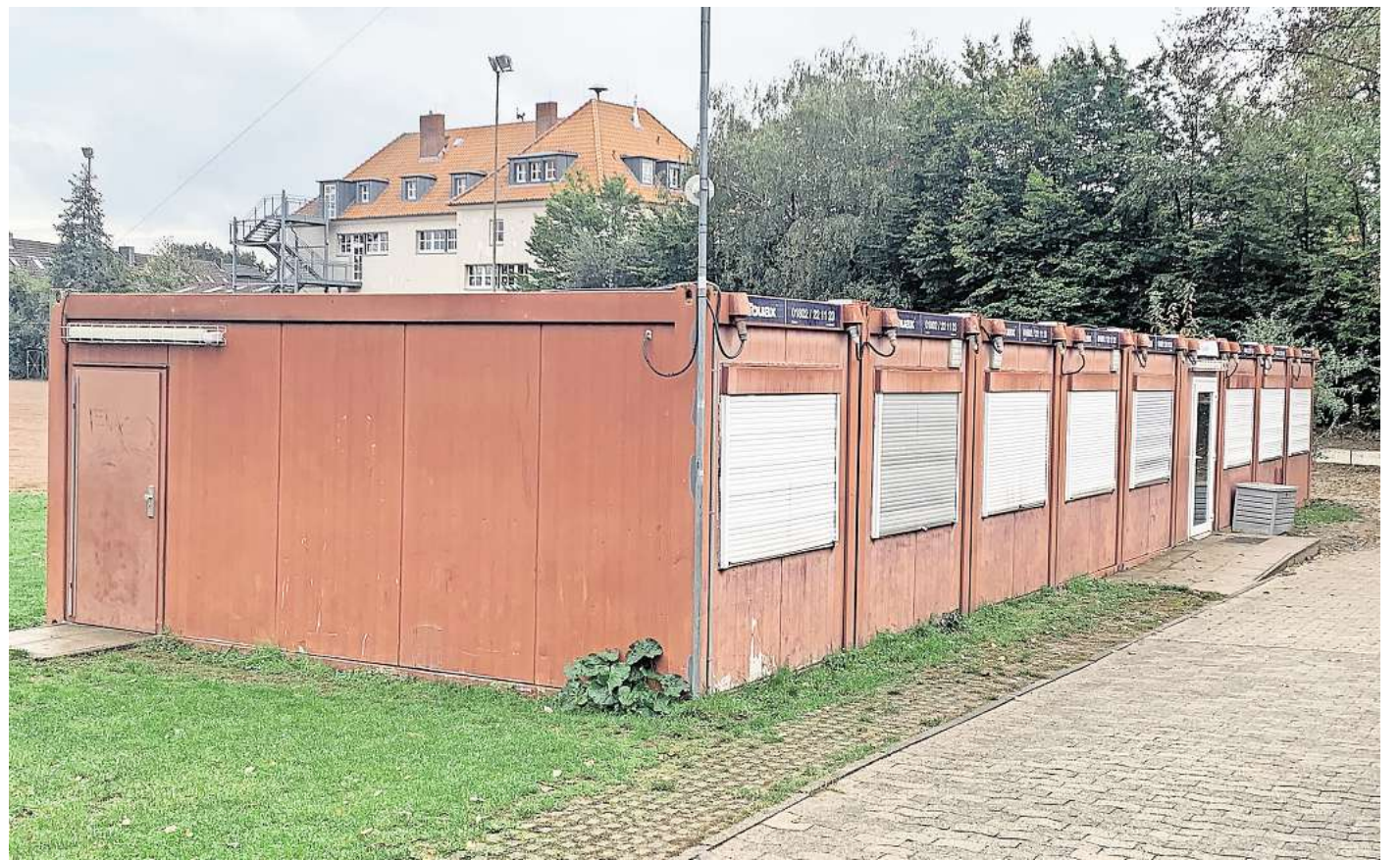
Provisorium auf Dauer: Seit elf Jahren behilft sich die Grundschule Grasdorf mit Unterrichtscontainern, um der Raumnot zu begegnen.