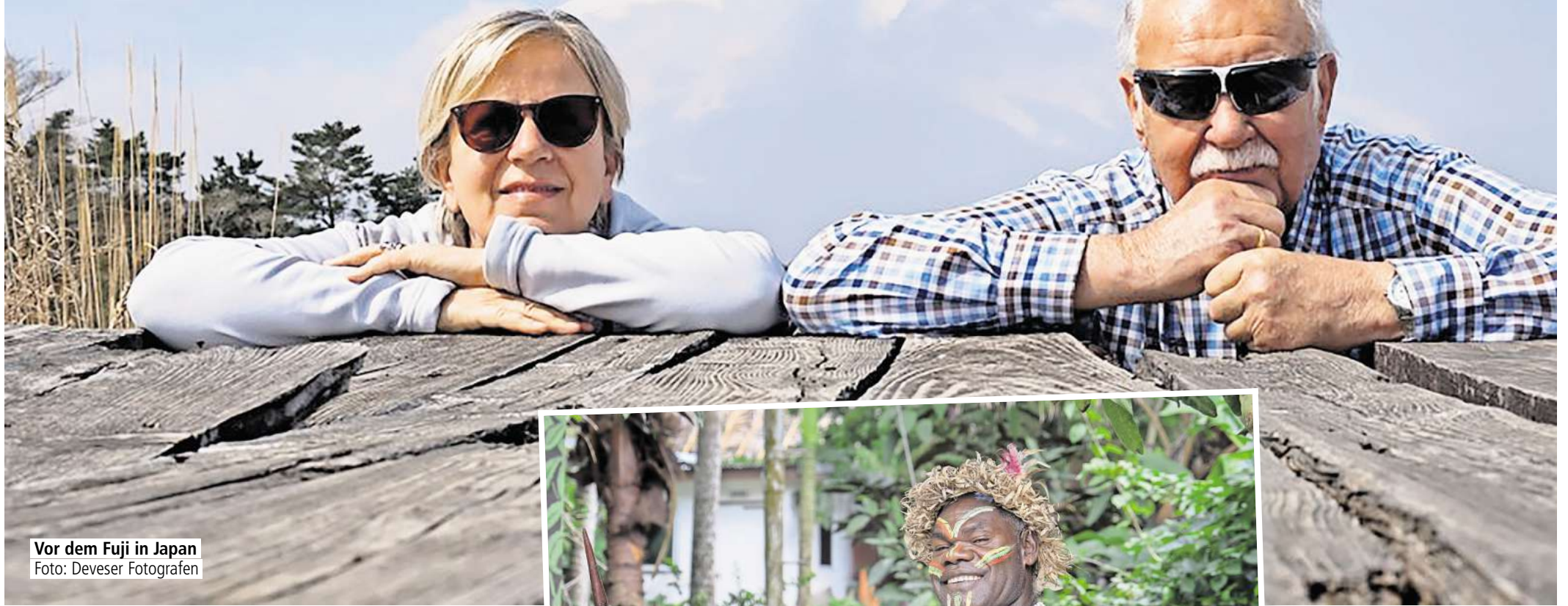
Vor dem Fuji in Japan