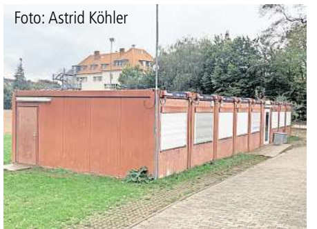
Provisorium auf Dauer.