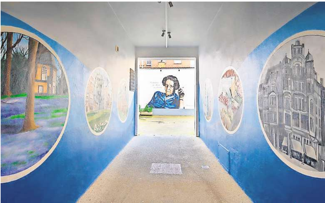
Hannah-Arendt-Bild an ihrem Geburtshaus an der Falkenstraße in Linden.