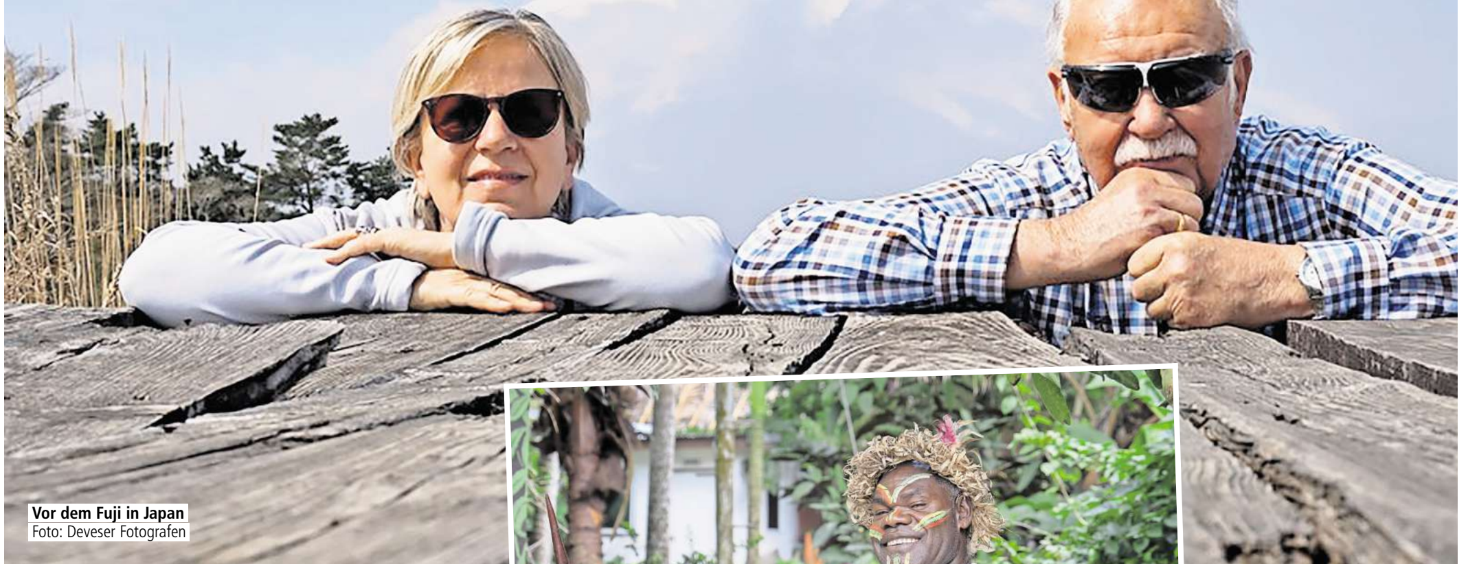
Vor dem Fuji in Japan