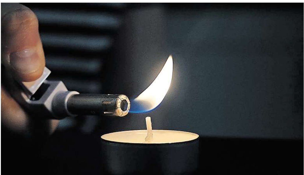
Wenn der Strom ausfällt: Die Stadt erarbeitet zurzeit ein Notfallkonzept.

Zudem wurde Kontakt zu den örtlichen Pflegeheimen aufgenommen und Hilfe angeboten. Herausfordernd sei der Umstand gewesen, dass es immer wieder in kleineren Bereichen zu Stromausfällen kam. Auch mehrere Ampelanlagen auf der Göttinger Landstraße waren betroffen. Die Stadtbahn fuhr jedoch ohne Unterbrechungen. In einigen städtischen Gebäuden soll es nach den Stromausfällen Störungen bei der Beleuchtung oder der Lüftung gegeben haben. Diese wurden mittlerweile jedoch alle behoben. In Privathaushalten kommen für die meisten Schäden bei Stromausfällen Hausrats- oder Gebäudeversicherungen auf.