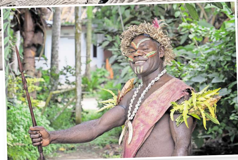
Die Deveser Fotografen waren wieder unterwegs