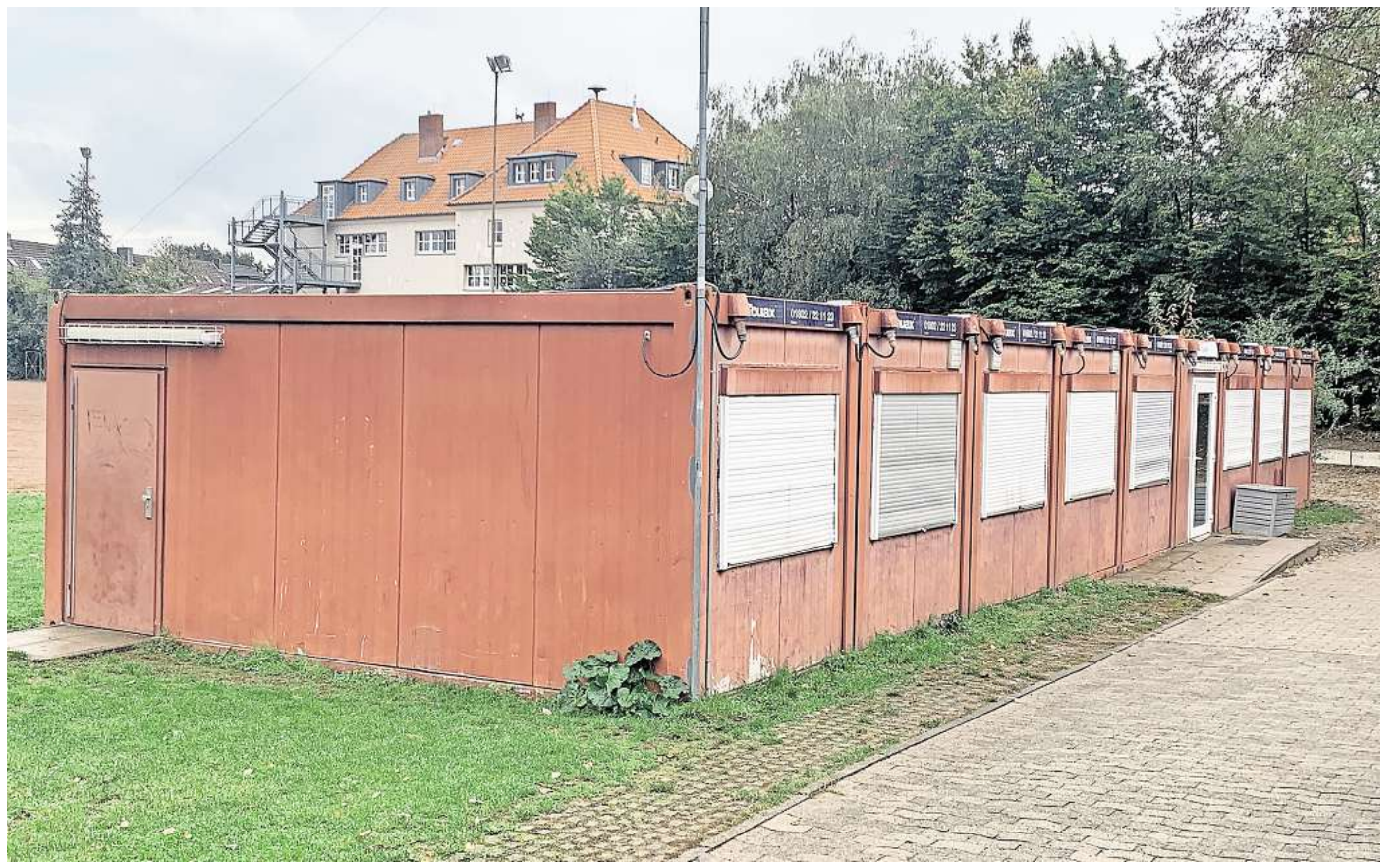
Provisorium auf Dauer: Seit elf Jahren behilft sich die Grundschule Grasdorf mit Unterrichtscontainern, um der Raumnot zu begegnen.