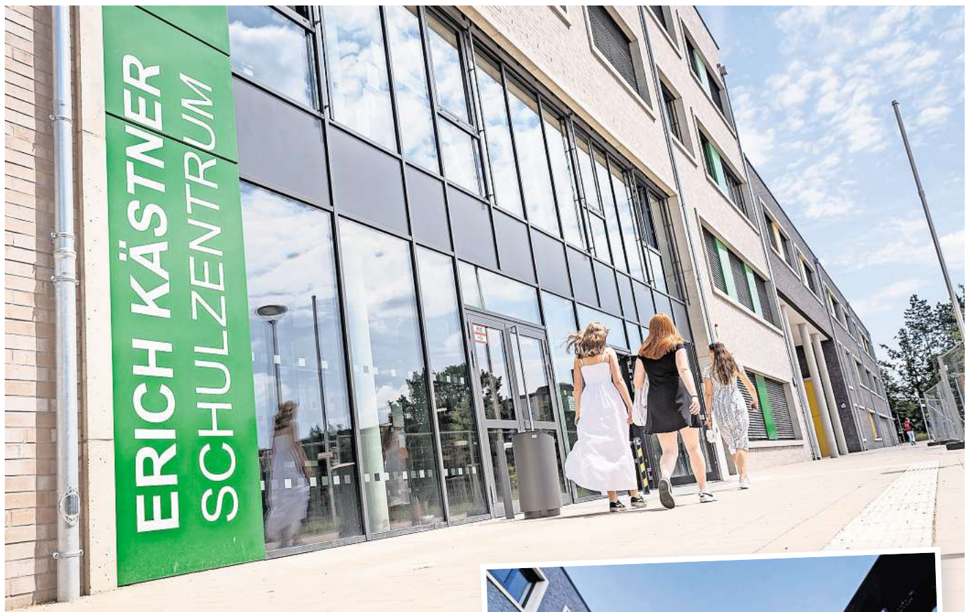
Aufsichtsproblem: Vor dem Erich-Kästner-Schulzentrum führt ein öffentlicher Weg direkt an der Fassade entlang.

Auslöser einer Debatte, die jetzt im städtischen Schulausschuss hohe Wellen schlug, ist die eigenwillige Lage von Zäunen, Toren und öffentlichen Wegen am Schulgelände. Das Problem: Sobald die Schüler von Oberschule und Gymnasium ihre Gebäude verlassen, stehen sie an einem öffentlichen Weg, der an den Fassaden der beiden Schulen entlangführt. Zwar soll dort ein Metallzaun für die Si-