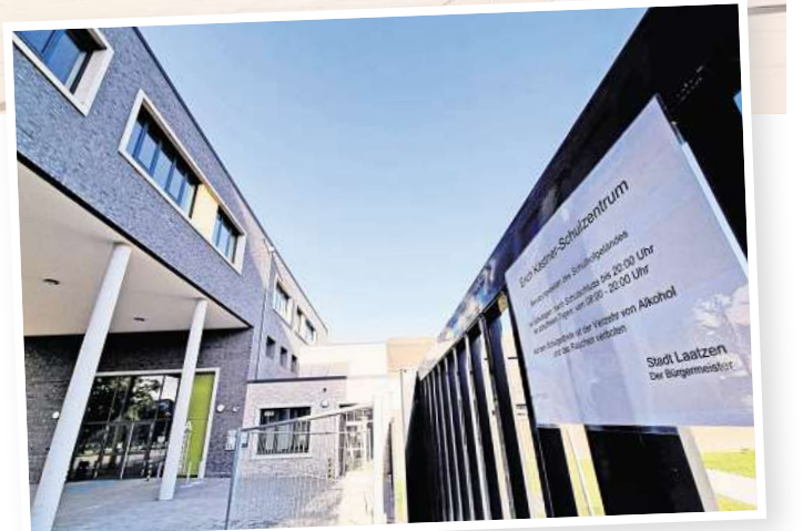
Schilder sollen es richten: Am Eingang zum Schulhof an der Oberschule weist ein Zettel darauf hin, wann das Gelände betreten werden darf.