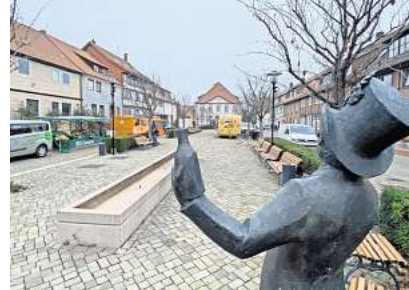
Wenig los: Der Wochenmarkt in Pattensen-Mitte