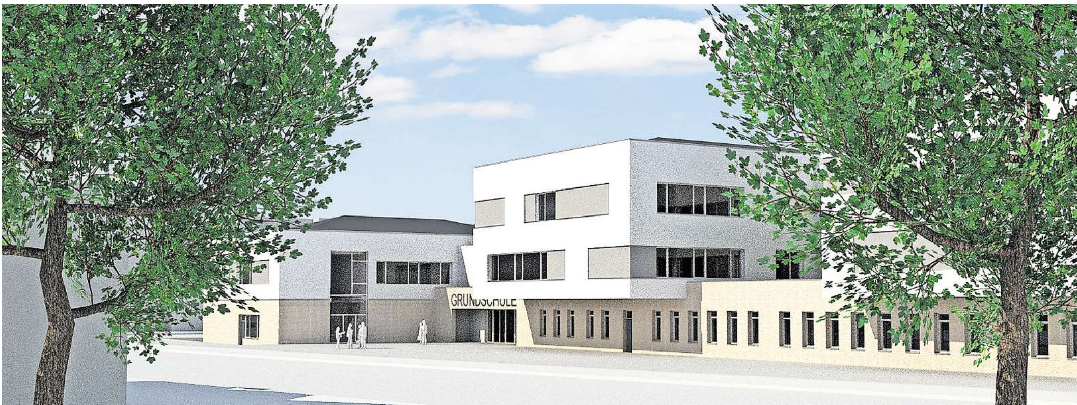
Das neue Schulgebäude von der Albert-Einstein-Schule aus betrachtet.