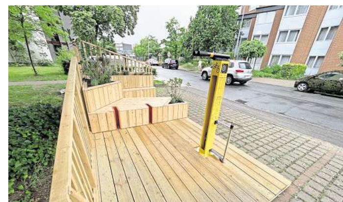
Sitzgelegenheit mit Fahrrad-Reparaturstation: Ein Parklet wie dieses in Wunstorf hätte nach Vorstellung der Stadtverwaltung auch auf einem Stellplatz in Laatzten stehen können.