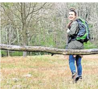
Der Rucksack, den man bereits hat, reicht völlig aus: Foto: Christin Klose

„Denn es bringt etwas mehr Trainingseffekt als ein simpler Spaziergang, ist aber längst nicht so anstrengend wie Laufen und belastet auch den Bewegungsapparat weniger. Das Training lässt sich dabei gut an das eigene Fitnesslevel anpassen“, so der Sportwissenschaftler. Wer die Belastung steigern will, läuft