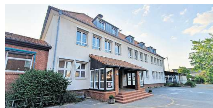
Bleibt „nach heutiger Einschätzung“ zweizügig: Grundschule Grasdorf.

Eggert stellte nun klar, dass die Planung noch dauern dürfte –