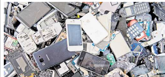
Hersteller und Importeure elektrischer Geräte sind verpflichtet, ihre Geräte nach Ende der Lebensdauer zurückzunehmen.

St. Johannis Apotheke Laatzen Pettenkoferstraße 2 30880 Laatzen Tel. 0511 / 69 17 69 service@meine-apotheke-laatzten.de