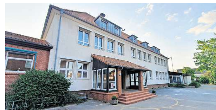
Bleibt „nach heutiger Einschätzung“ zweizügig: Grundschule Grasdorf.

Eggert stellte nun klar, dass die Planung noch dauern dürfte –