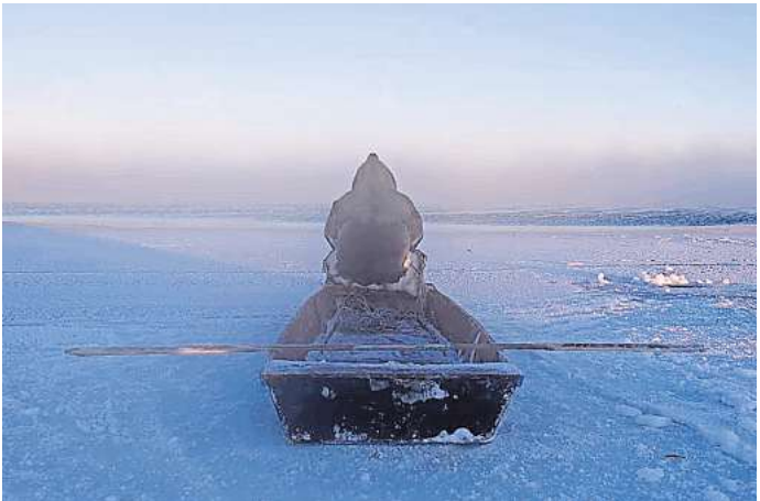
Joar Nango: „Flow Edge“, 2023.