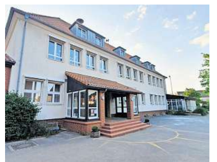
Grundschule Grasdorf. Seite 2