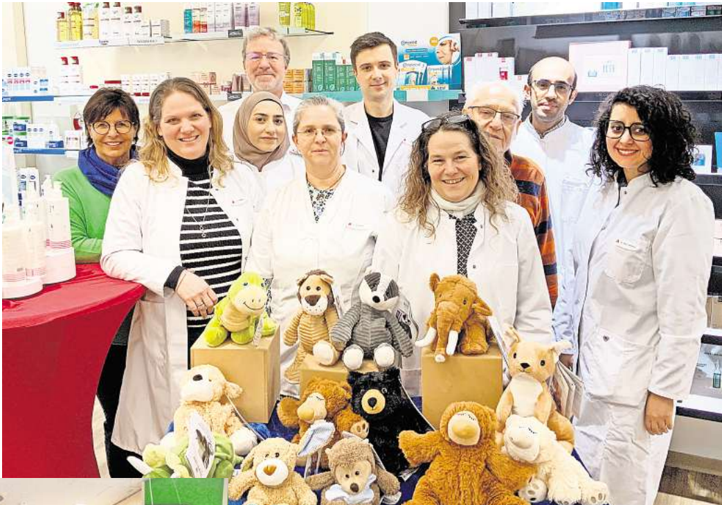
Berät fachlich versiert und individuell: das Team der Laatzeners St. Johannis-Apotheke

Die studierte Pharmazeutin und approbierte Apothekerin ist seit Jahresbeginn Inhaberin der seit 2011 beliebten St. Johannis-Apotheke, zu deren Mitarbeiterinnen sie bereits fast von Anfang an gehört. Aktuell besteht das versierte Apotheken-Team aus 15 Fachkräften, darunter fünf Apotheker/-innen, sowie sieben Pharmazeutisch-technischen Assistentinnen und Assistenten.