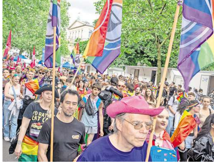
Farbenfrohe Demonstration: CSD 2024 in Hannover.

Mit „Queer und im Visier: Was geschlechtsbezogene Fake News