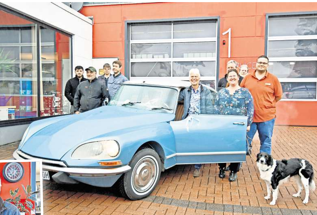
Kompetent in allen Fragen rund ums Automobil: das Team von Baumann Automobile.

Wer einen kompetenten Ansprechpartner für Mobilität in Laatzen sucht, findet bei Baumann Automobile an der Lüneburger Straße 12 im Rethener Gewerbegebiet einen zuverlässigen Rundumservice sowie eine fachgerechte und faire Beratung. Neben Neu-, Jahres- und Gebrauchtwagen aller Fabrikate bietet das Autohaus auch Elektro-Roller und E-Bikes an. Im Servicebereich werden Kundinnen und Kunden von motivierten Angestellten in allen Fragen rund um ihr Fahrzeug beraten. Wer sich für den Kauf eines E-Fahrzeugs interessiert, ist bei Bau-