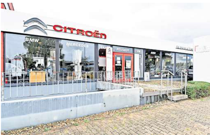
Baumann Automobile ist seit mehr als 25 Jahren im Rethener Gewerbegebiet ansässig.