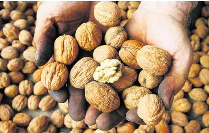
Zwei bis vier Kilo Walnüsse braucht es für die Herstellung von einem Liter Walnussöl. Es verfeinert Salate und warme Gerichte, auch Süßspeisen gibt das Öl eine raffinierte Note.