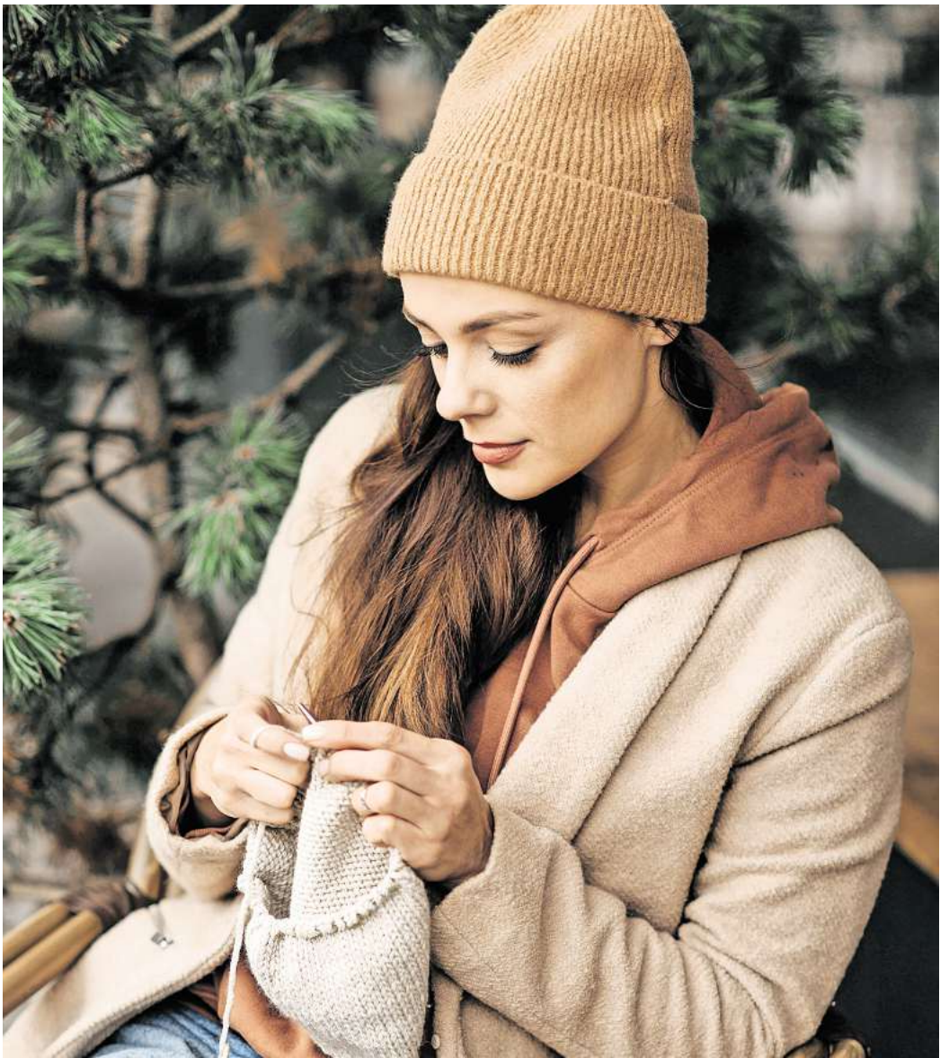
Angenehme Tätigkeiten helfen dabei, dass kein Herbstblues aufkommt.

Im Gegenteil dazu kann der Herbst bei manchen Menschen aber auch die negativen Gefühle des Sommers ablösen, denn nicht jeder mag Hitze oder gleißendes Licht, beides Faktoren,