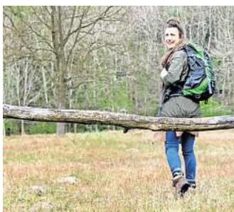
Der Rucksack, den man bereits hat, reicht völlig aus