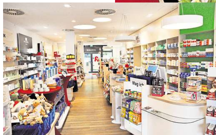
Bietet mehr als nur Medikamente: die St. Johannis-Apotheke in Laatzens Pettenkoferstraße 2

Montags bis freitags zwischen 8 und 19.30 Uhr, sowie samstags von 9 bis 18 Uhr, werden hier nicht nur apothekenpflichtige Arzneimittel und Nebensortimentsartikel für Kosmetik und Zahnpflege, Diätetik und Tees, Verbandstoffe und vieles mehr, abgeholt. Die fachlich geschulten Laatzeners Gesundheitsexperten beraten auf Wunsch individuell zu Arzneimitteln und Al-