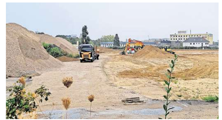
Auftakt: Nach dem Abriss der Altgebäude haben die Bauarbeiten auf der Aurelis-Fläche an der Karlsruher Straße begonnen.

Maffei und der Versandhändler Connox eingezogen sind, erreicht der Aurelis-Komplex allerdings nicht: Im Gewerbegebiet jenseits der B6 sind Hallen mit einer Gesamtfläche von 112.000 Quadratmetern entstanden. Davon belegt allein Krauss Maffei Büro- und Produktionsräume mit einer Fläche von 66.500 Quadratmetern.