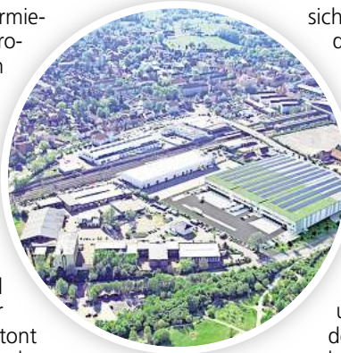
Großprojekt: Die neue Aurelis-Logistikhalle an der Ecke Karlsruher Straße/Kronsbergstraße (Bildmitte) wird künftig die größte Immobilie Alt-Laatzens sein.

Außerdem vermietet Aurelis Büroflächen von 600 bis 750 Quadratmetern. Mit der angepeilten Hallenhöhe liege man über dem Standard vergleichbarer Objekte, betont das Unternehmen. Die Anlage verfüge künftig über 85 Pkw- und acht Lkw-Stellplätze sowie über 28 Tore für die Anlieferung und Abholung, davon drei ebenerdig. „Eine 24/7-Nutzung ist möglich“, heißt es.