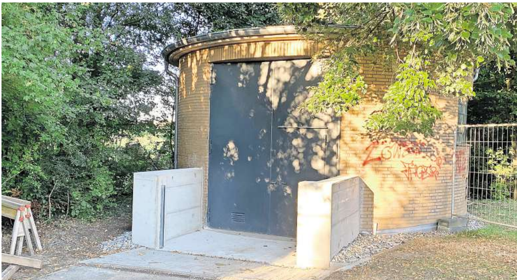
Pumpstation Berliner Straße

Doch nicht nur die mit Steuergeldern bezahlten Reinigungs- und Wartungskosten sollen sich in den vergangenen Monaten