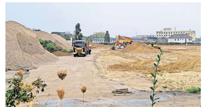
Auftakt: Nach dem Abriss der Altgebäude haben die Bauarbeiten auf der Aurelis-Fläche an der Karlsruher Straße begonnen.

Maffei und der Versandhändler Connox eingezogen sind, erreicht der Aurelis-Komplex allerdings nicht: Im Gewerbegebiet jenseits der B6 sind Hallen mit einer Gesamtfläche von 112.000 Quadratmetern entstanden. Davon belegt allein Krauss Maffei Büro- und Produktionsräume mit einer Fläche von 66.500 Quadratmetern.