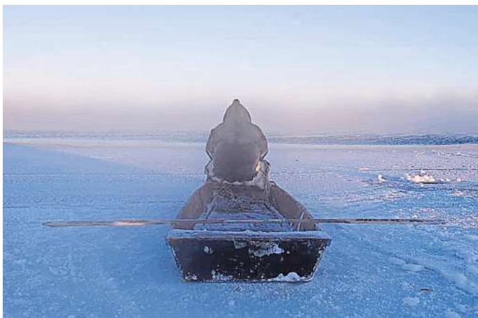
Joar Nango: „Flow Edge“, 2023.