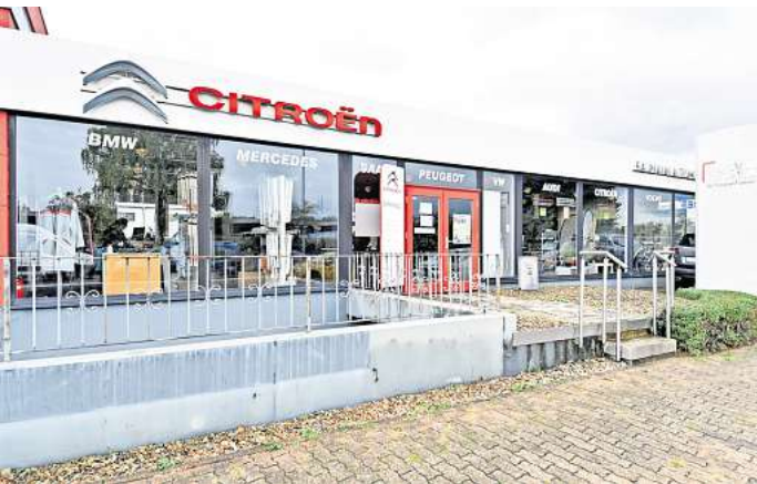
Baumann Automobile ist seit mehr als 25 Jahren im Rethener Gewerbegebiet ansässig.

Baumann Automobile Lüneburger Straße 12 30880 Laatzen – OT Rethen Telefon: (0 51 02) 9 36 60 info@baumann-automobile.de www.baumann-automobile.de Öffnungszeiten : Mo bis Fr 7.30–18 Uhr, Sa 10–13 Uhr