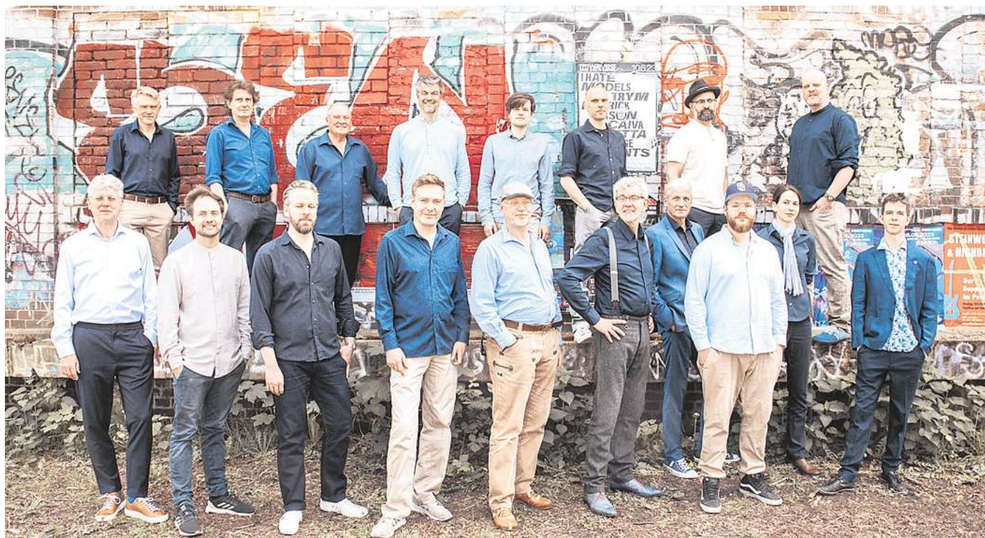
Die Bigband komplett.

Seitdem ist die Fette Hupe eines der Aushängeschilder der hannoverschen Jazzszene mit großer nationaler Strahlkraft. Ihre Konzerte in der Faust / Warenannahme sind meist ausverkauft, sie erreichen jazzuntypisch ein Mehrgenerationenpublikum und überraschen mit innovativen Konzepten – vom Lindy-Hop-Tanzabend bis zu Musiktheater in sogenannten „Jazz escape rooms“. Das Geheimnis der fetten Hupe ist ihr undogmatischer Ansatz. Ob es