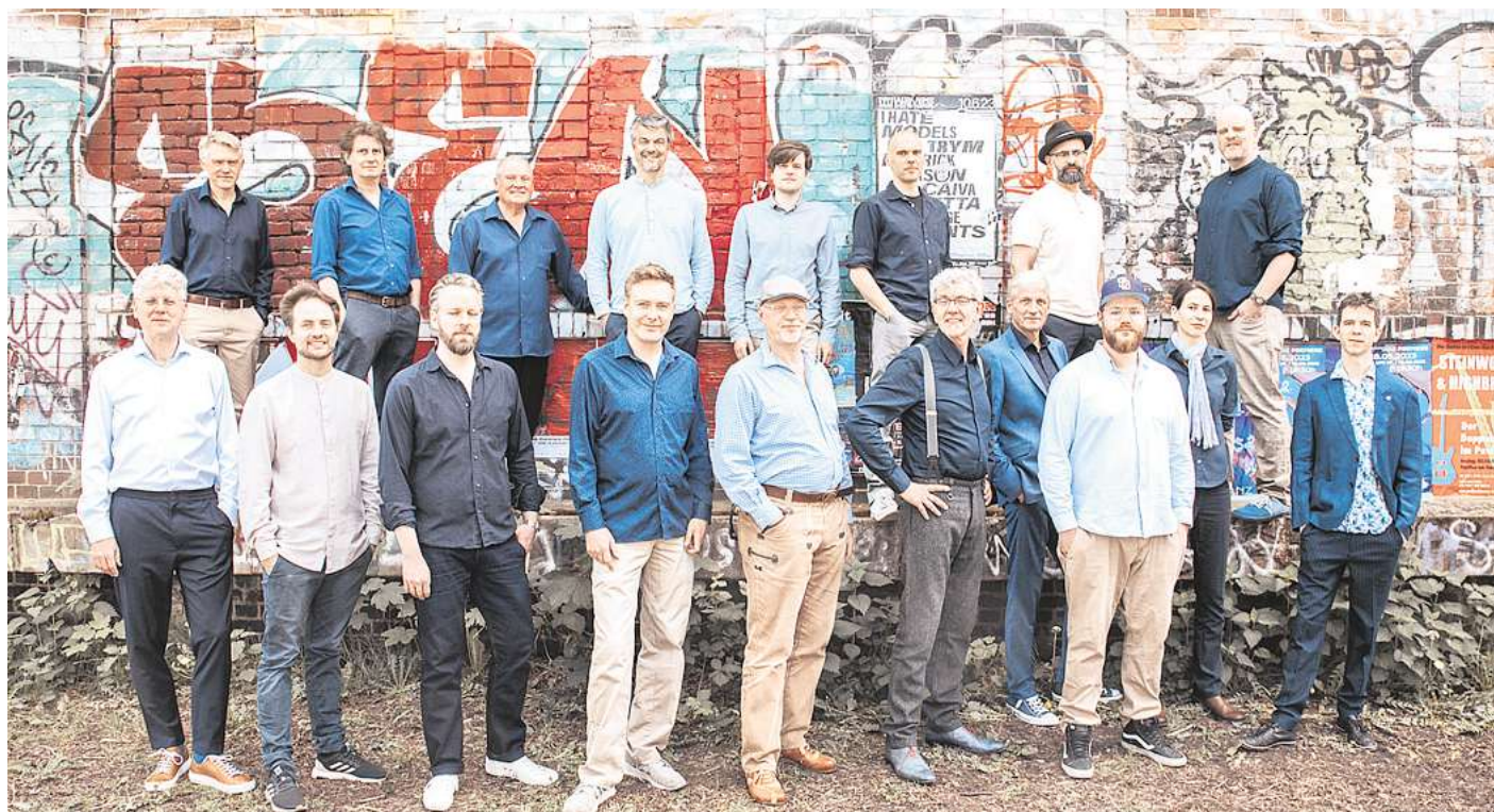
Die Bigband komplett.

Seitdem ist die Fette Hupe eines der Aushängeschilder der hannoverschen Jazzszene mit großer nationaler Strahlkraft. Ihre Konzerte in der Faust / Warenannahme sind meist ausverkauft, sie erreichen jazzuntypisch ein Mehrgenerationenpublikum und überraschen mit innovativen Konzepten – vom Lindy-Hop-Tanzabend bis zu Musiktheater in sogenannten „Jazz escape rooms“. Das Geheimnis der fetten Hupe ist ihr undogmatischer Ansatz. Ob es