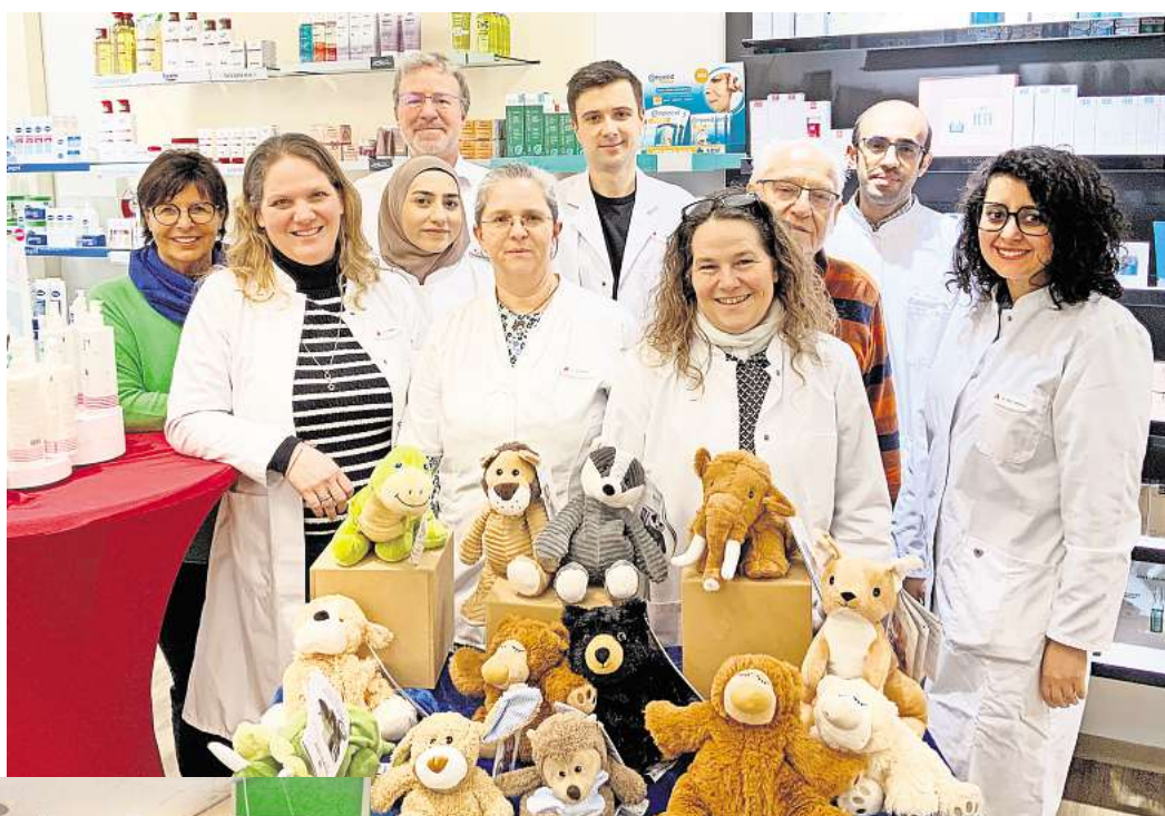
Berät fachlich versiert und individuell: das Team der Laatzeners St. Johannis-Apotheke

Die studierte Pharmazeutin und approbierte Apothekerin ist seit Jahresbeginn Inhaberin der seit 2011 beliebten St. Johannis-Apotheke, zu deren Mitarbeiterinnen sie bereits fast von Anfang an gehört. Aktuell besteht das versierte Apotheken-Team aus 15 Fachkräften, darunter fünf Apotheker/-innen, sowie sieben Pharmazeutisch-technischen Assistentinnen und Assistenten.