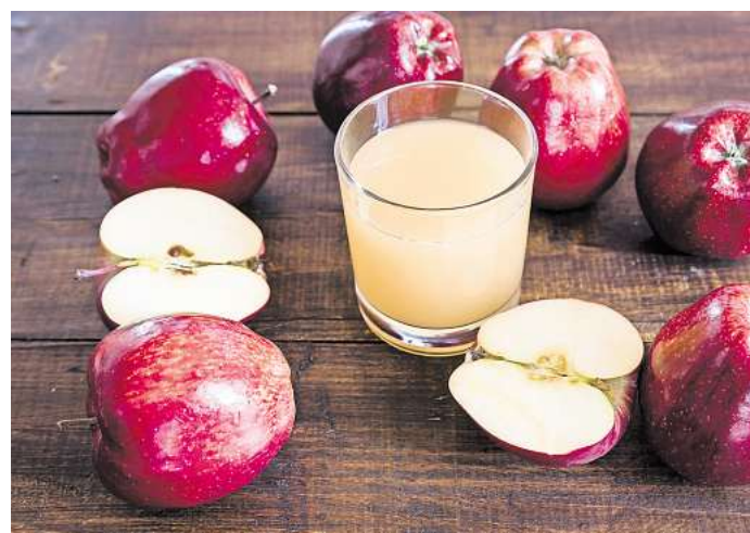
Viele naturtrübe Apfelsäfte schnitten bei einer Untersuchung der „Öko-Test“ in Bezug auf die Qualität sehr gut ab, aber Umweltrisikofaktoren und Pestizidbelastungen trübten das Gesamtbild.

Naturtrüber Apfelsaft im Test – Pestizidbelastungen trüben das Gesamtbild, Bio-Produkte schneiden „sehr gut“ ab