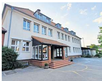
Grundschule Grasdorf. Seite 2